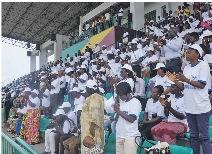
Les participants à la journée de la prière

« Nous vivons des périodes troublées liées à l'évolution de l'actualité politique dans notre pays ; nous avons marre de la division et des luttes fratricides qui se sont produites autrefois. Quand une femme pleure, c'est toute la nation qui souffre... nous ne voulons plus de souffrance, de peine, de chagrin, de cris dans ce pays. Nous ne voulons rien que la paix pour notre la construction du Congo », a-t-elle déclaré.