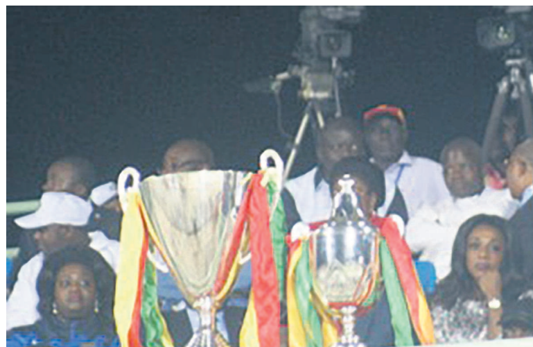
Une vue des coupes du Congo des deux versions exposées lors de la finale Diables noirs-Cara à Sibiti

Dans les Plateaux, une rencontre 100% Djambala est au menu. Elle mettra aux prises