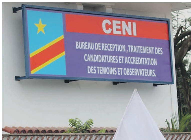
Le Bureau de réception et de traitement des candidatures

avancée par certaines langues. Le rapporteur de la Céni est resté ferme, rejetant cette éventualité, en estimant que ces opérations coûtent énormément à la Céni. Il serait égale-