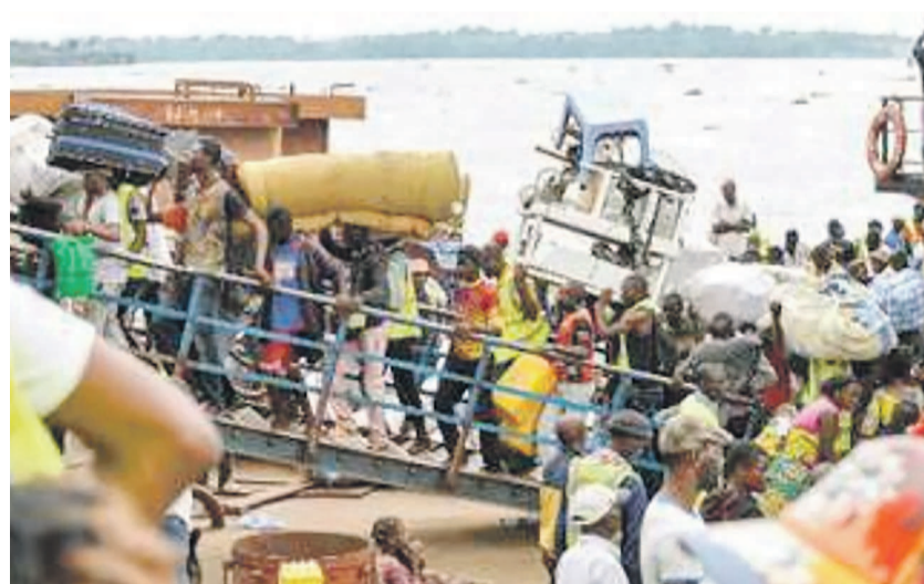
Des ressortissants de la RDC embarquant de Brazzaville pour retourner à Kinshasa

zaville a rassuré sur la prise des dispositions afin que les citoyens de la RDC soient bien traités. Il a, par ailleurs, noté que l'opération