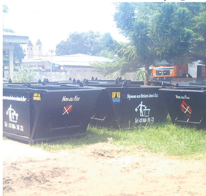
Une vue des bacs à ordures

Pour les populations, c'est un ouf de soulagement car ces bacs à ordures ont été conçus pour elles, avec des écrits et des pictogrammes marqués en vue de