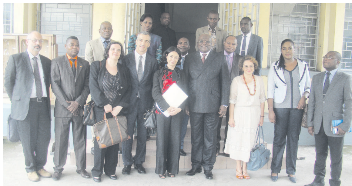
Les deux parties après l'audience

« (...) Dans le secteur du sport en particulier, après la signature des accords de coopération des encadreurs sportifs avec l'université de Udinese, aujourd'hui il s'est agi pour nous de travailler pour voir comment organiser un match de gala avec l'équipe d'Italie championne du monde en 2006, dans le cadre de l'inauguration du stade de Kintélé », a fait sa-