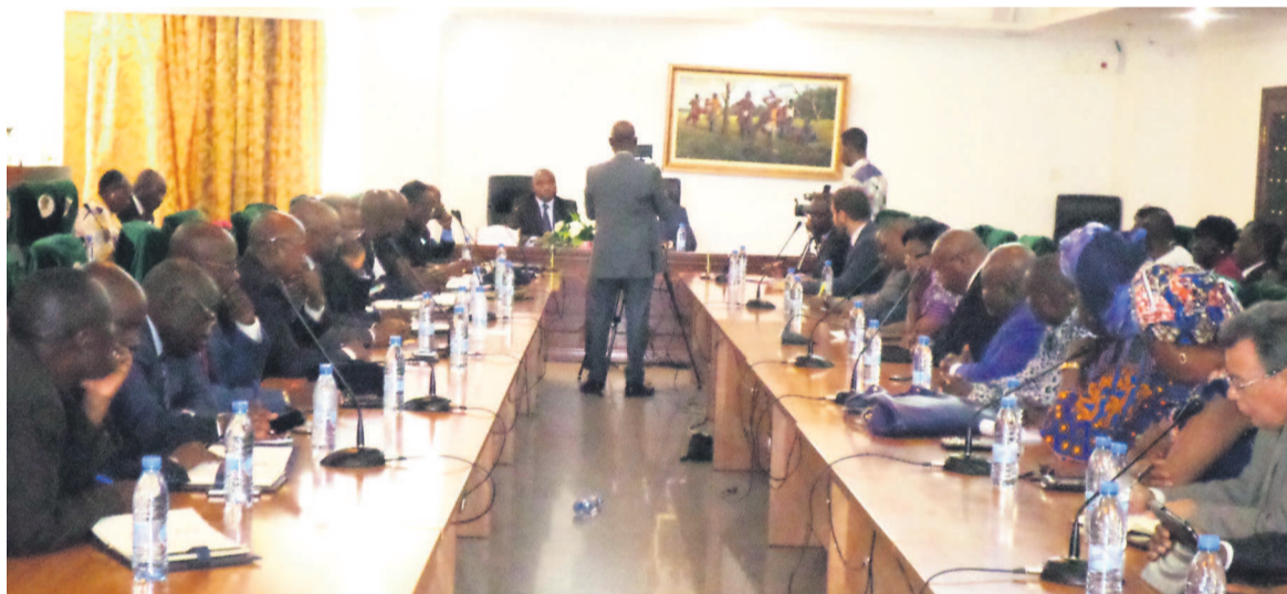
La rencontre entre le ministre de l'Intérieur et le corps diplomatique

Au cours d'une rencontre avec les diplomates en poste au Congo, le ministre de l'Intérieur et de la décentralisation, Raymond Zéphirin Mboulou a invité ces derniers à coopérer avec les autorités congolaises. « Nous avons demandé aux représentations diplomatiques de nous assister dans le cadre de cette opération. Nous sommes ouverts au dialogue et à tout échange d'informations, car nous n'avons rien à cacher », a lancé Raymond Zéphirin Mboulou. Dans sa deuxième phase lancée le 14 mai à Pointe-Noire, plus de 1500 étrangers en situation irrégulière ont déjà été interpellés dans la capitale économique et plusieurs d'entre eux reconduits aux frontières. Page 5