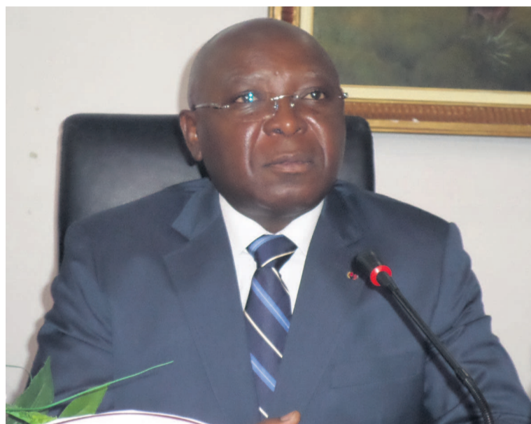
Le ministre Raymond Zéphirin Mboulou

Au cours d'une rencontre avec le corps diplomatique accrédité au Congo ce jeudi 21 mai à Brazzaville, le ministre de l'Intérieur et de la décentralisation, Raymond Zéphirin Mboulou, a défendu l'idée de poursuivre l'expulsion des immigrés clandestins dans le pays conformément au droit international et aux droits humains, et appelé ses invités à coopérer dans le cadre de cette opération policière.