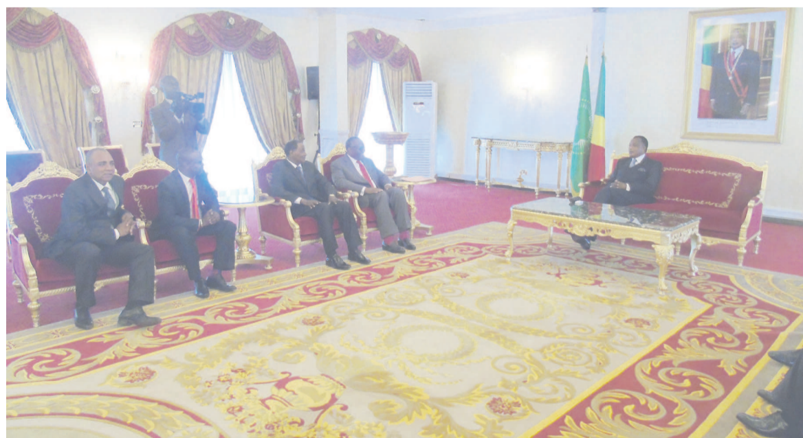
Le chef de l'État et la délégation de la Convention des partis républicains

Au deuxième jour des consultations initiées par le président de la République, sept délégations ont été reçues, hier, au Palais du peuple. Parmi celles-ci, la délégation de la Convention des partis républicains, conduite par le président du Parti républicain libéral, Nicéphore Fylla Saint-Eudes et comprenant, entre autres, le Conseil national des républicains