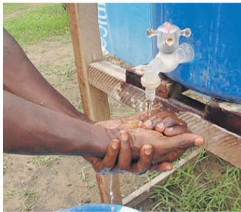
Le lavage des mains prévient plusieurs maladies