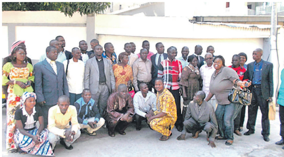
Les participants à l'atelier Caco-Redd+

Du 11 au 12 mai a eu lieu à Brazzaville l'assemblée plénière extraordinaire du Cadre de concertation des organisations de la Société civile et des populations autochtones (Caco) dans le processus Redd+. Majep Obama, coordonnateur du Réseau développement humain durable (RDHD), a fait le 17 mai dernier la restitution à ses adhérents des conclusions de cette activité.