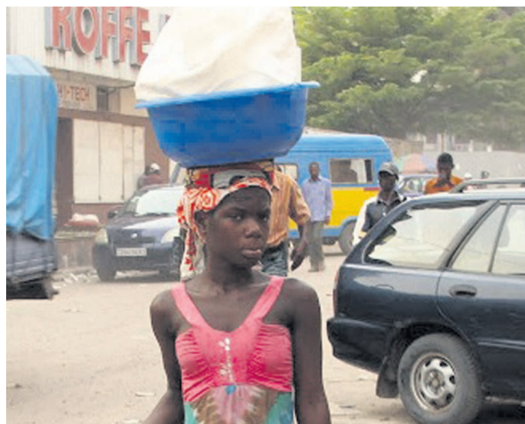
On voit la jeune fille vendant de l'eau en sachet

C'est ainsi que ville de Pointe-Noire était considérée comme l'un des meilleurs élèves dans la mise en musique de cette directive gouvernementale. Aujourd'hui, c'est le contraire qui se produit. L'eau vendue dans les sachets est bien visible sur la portion de l'avenue Marien Ngouabi en allant du rond-point Château-d'eau à l'arrêt de bus Km4 et aussi de l'arrêt de bus de l'hôpital A.Sicé, sur l'avenue Charles de Gaulle, dans de nombreux quartiers populaires de la ville. Et cela se passe au vu et au vu de tous. Au niveau des marchés de Pointe-Noire, la vente de ces sachets se fait furtivement car les vendeurs en gros et les détaillants utilisent un langage codé. Ces sachets sont prisés par des vendeuses de farine de fofou, des solutions sucrées bissap, tanga-