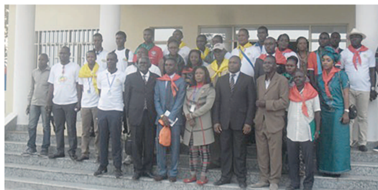
Les membres du bureau exécutif de la Fécotri

Ce bureau est constitué de plus d'une dizaine de membres dont quatre femmes. Iloki Engonza assume les fonctions de premier