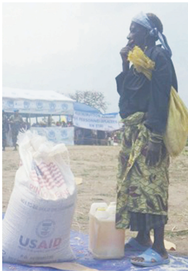
Une femme assistée en vivres PAM au site des déplacés de Lagabo, Province Orientale, RDC

La source a souligné que le Fonds central pour les urgences humanitaires a déjà accordé environ 8 millions USD à la RDC pour les urgences sous-financées ainsi que pour la réponse rapide aux situations d'urgence. Ce rapport a précisé que si l'on extrait du montant de 296 millions USD, les 119 millions USD reportés de 2014 (carry over), le niveau des contributions reçues depuis janvier de cette année s'élève à 177 millions USD, soit un peu plus de 25% du PSR. Ocha, dans ce document, a prévenu sur le risque du sous financement de priver des milliers de personnes de la nourriture, de l'eau et des soins médicaux de base. Pour cette agence onusienne, en effet, à ce jour, seulement trois secteurs ont pu mobiliser le tiers du montant demandé. Il s'agit de la sécurité alimentaire, avec plus de 50 %, de la protection, avec 44, 2%, et de la logistique, avec 32,4%. Alors que le montant alloué à des « secteurs