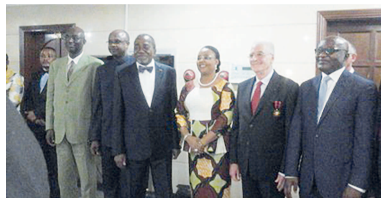
Raymond Benjamin entouré du Ministre d'Etat Adada et autres acteurs de l'aviation civile

Le secrétaire général de l'Organisation de l'aviation civile internationale (OACI) a reçu le 21 mai à Brazzaville, sa médaille d'honneur, des mains du ministre d'État, ministre des Transports, Rodolphe Adada. Il a été décoré officier dans l'ordre du mérite congolais.