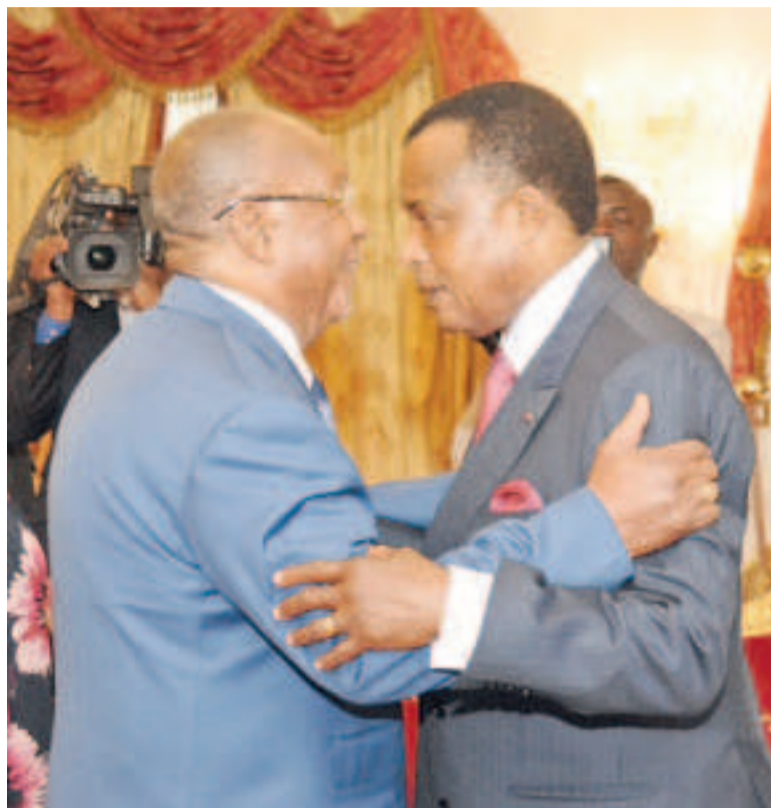
Denis Sassou N'Guesso et Jacques Joachim Yhombi Opango

Au sortir de l'audience que lui a accordée le président de la République, hier, dans le cadre des consultations entreprises avec les forces vives de la nation depuis le 20 mai dernier, le président de l'Assemblée nationale a envisagé la convocation d'une session extraordinaire de la chambre basse du Parlement.