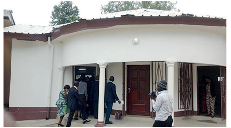
Entrée principale du bâtiment

Cette collecte de données s'est déroulée sur toute l'étendue du territoire natio-