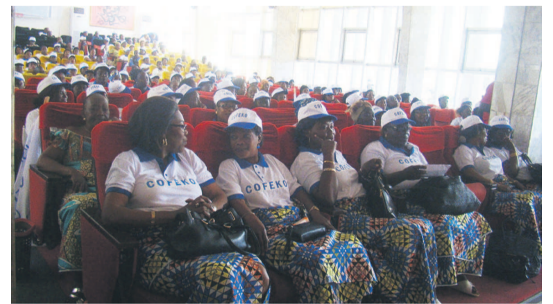
Les femmes originaires du Kouilou lors de la sortie officielle de la Cofeko

La Convergence des femmes du Kouilou (Cofeko), association apolitique œuvrant pour la paix et le développement des activités génératrices de revenus en milieu féminin, a fait sa sortie officielle depuis le 14 mai à la mairie centrale de Brazzaville.