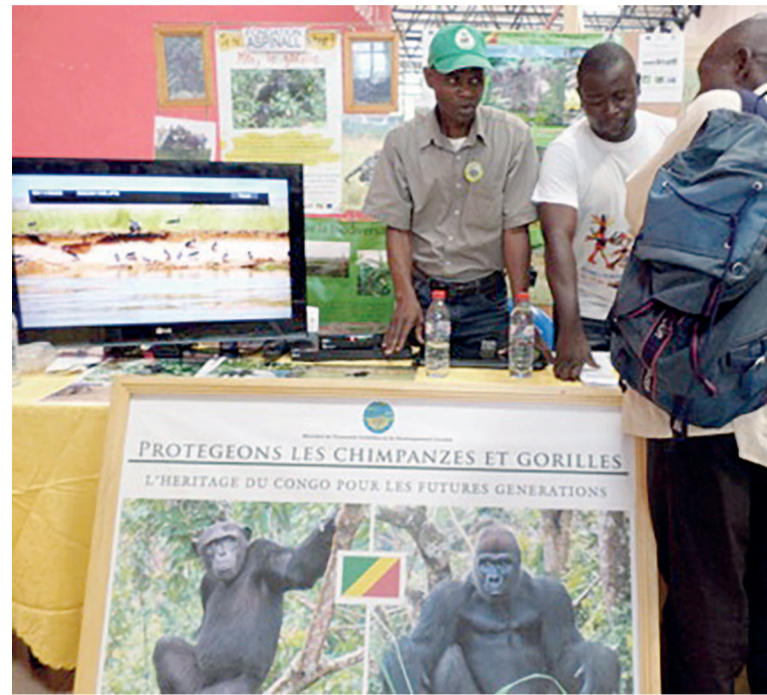
Devant un stand de The Aspinall foundation

En marge de la semaine de l'Union européenne (UE) qui s'est tenue à Brazzaville du 19 au 22 mai dernier, plusieurs ONG congolaises financées par l'UE ont exposé au grand public leurs réalisations. Les Dépêches de Brazzaville ont fait le tour de quelques stands. Suivez.