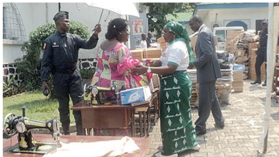
La responsable du centre de l'église Kimbanguiste recevant un kit

la machine. Elle a indiqué que ce don s'inscrivait dans le cadre du programme national de développement 2012-2016 et obéit à la mise en œuvre des objectifs du millénaire pour le développement. Il fait suite à la campagne d'information, d'éducation et de communication pour le changement de comportement sur le statut de la femme et l'appui aux activités génératrices de revenus organisées dans tout le territoire national.