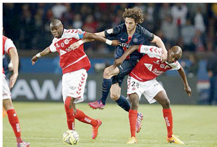
Prince Oniangue a-t-il disputé son dernier match sous le maillot de Reims contre le PSG

Suspendu après son expulsion avec la réserve lilloise, Kévin Koubemba n'était pas dans le groupe de Lille, large vainqueur à Metz (1-4). Pri-