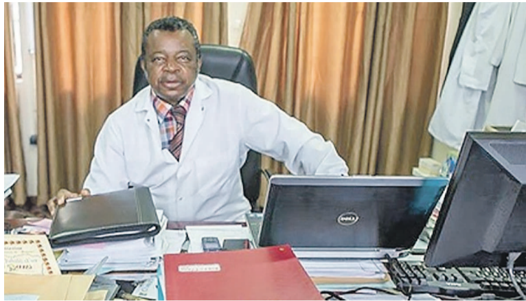
Le Dr Muyembe.

Des années de recherche Le professeur Jean-Jacques Muyembe a contribué à la découverte de la fièvre hémorragique à virus Ebola et avait été le premier chercheur à se rendre sur le site de la toute première épidémie, qui a eu lieu en 1976 à Yambuku, en République démocratique du Congo, alors appelé Zaïre. Avec son équipe, il a commencé par décrire les manifestations cliniques de la maladie, à partir d'observations faites ainsi que les complications tardives, les aspects épidémiologiques, virologiques et