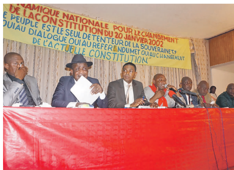
La tribune officielle de la cérémonie

Outre ces articles, l'orateur pense que la constitution du 20 janvier 2002 n'accorde pas une place de choix à la jeunesse, aux femmes, aux personnes handicapées. « Ce texte accuse une faiblesse sur les moyens de contrôle de l'action gouvernementale, il y a aussi la non garantie du statut du chef de l'opposition, la limitation des mandats présidentiels et bien d'autres » a-t-il déclaré, avant de dénoncer le comportement de certains hommes politiques qui