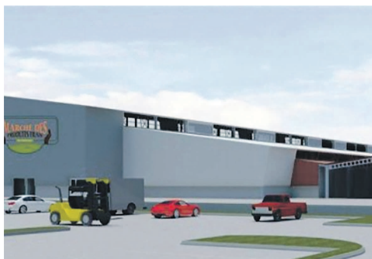
La maquette du MIK

Comme l'ont expliqué certaines sources proches du gouvernement, il n'y aurait pas eu une synergie d'ensemble suffisante pour arriver à valoriser tout le potentiel