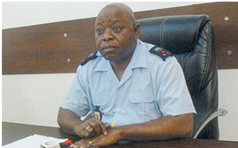
Le colonel Jules Moukala Tchoumou

Pour confirmer tous ces faits, le colonel Jules Moukala Tchoumou, porte-parole de la police nationale, a expliqué: « On a dû constater à Brazzaville qu'à certains moments de la nuit comme de la journée, il y a quelques jeunes qui ont le malin plaisir de s'attaquer aux populations. Ils sont