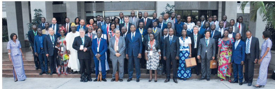
Photo de famille à l'issue de la cérémonie d'ouverture de la 10 e université du notariat africain

il s'en suit qu'il faut sécuriser l'accès à la propriété pour éviter des conflits. Pour ce faire, les notaires, juges préventifs par excellence, sont donc des partenaires privilégiés de l'Etat et des particuliers. Avant de signifier que le métier de notaire leur confère une proximité avec les populations qui font d'eux des partenaires de choix dans l'amélioration du climat des affaires et dans la gestion des immeubles en copropriété. Car l'accès à l'émergence sous-entend que le tissu industriel peut se développer en toute sécurité, en comptant sur le notariat congolais. Puis elle a sollicité de la tutelle, non seulement de procéder à la relecture et à la révision des textes organisant leur profession, mais aussi de mettre à leur disposition un bâtiment ou de bureaux pour abriter le siège de la