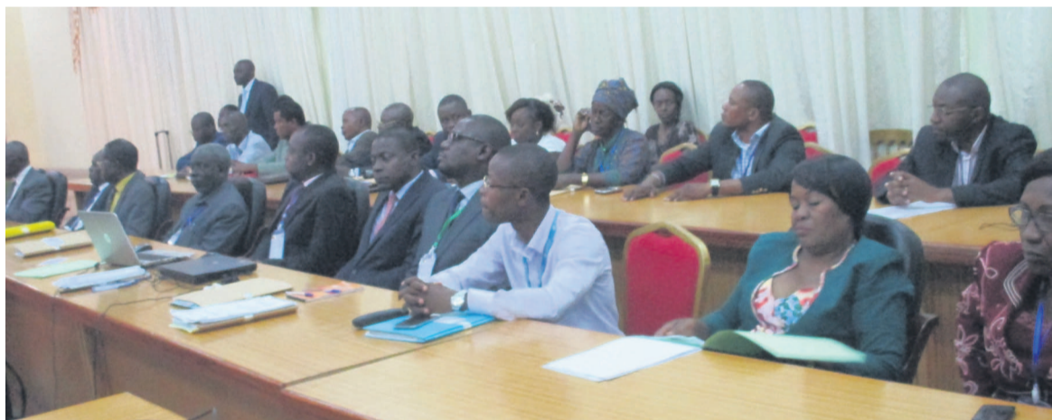
Une vue partielle des délinquants