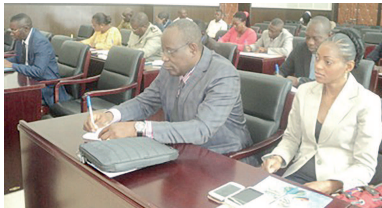
Les participants (DR)