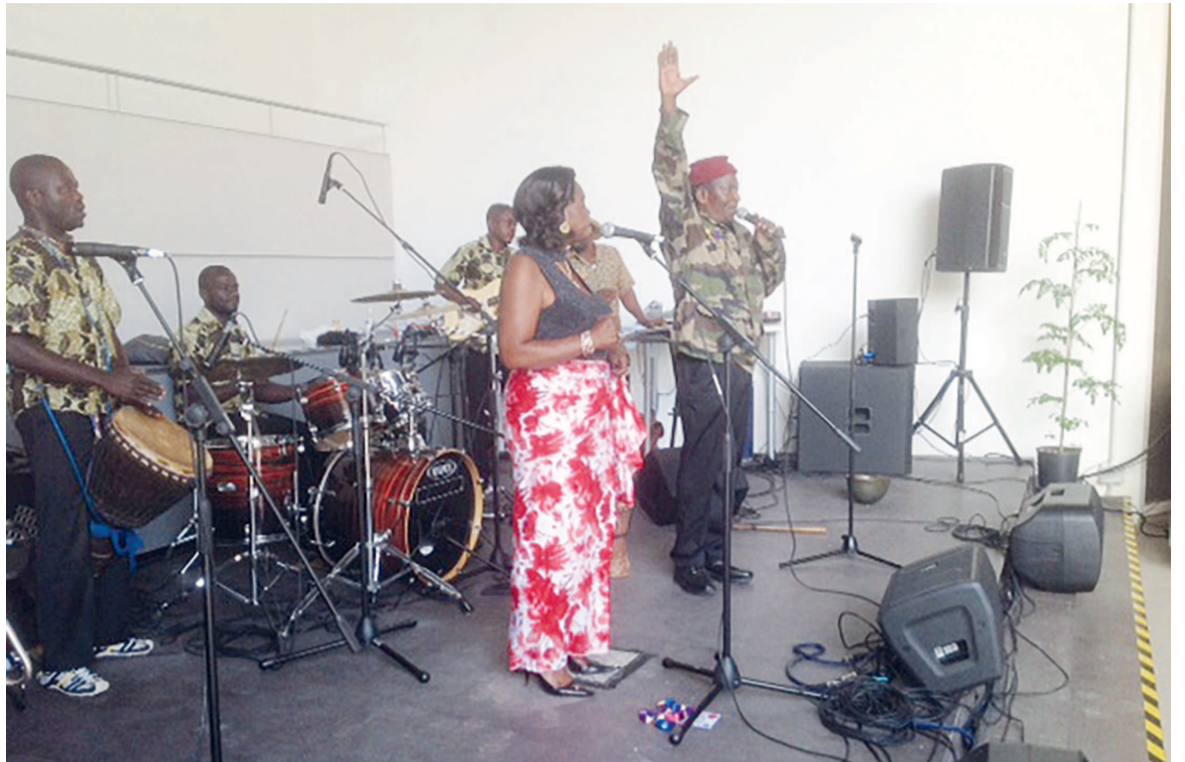
Zao sur scène

Mais à Milan, Zao a surtout fait remuer les hanches. Ses tubes ont été applaudis et réclamés. À un moment du spectacle, la ministre Claudine Munari s'est même mise debout et a exécuté un pas de danse des plus réussis. Succès à tout rompre à l'applaudimètre !