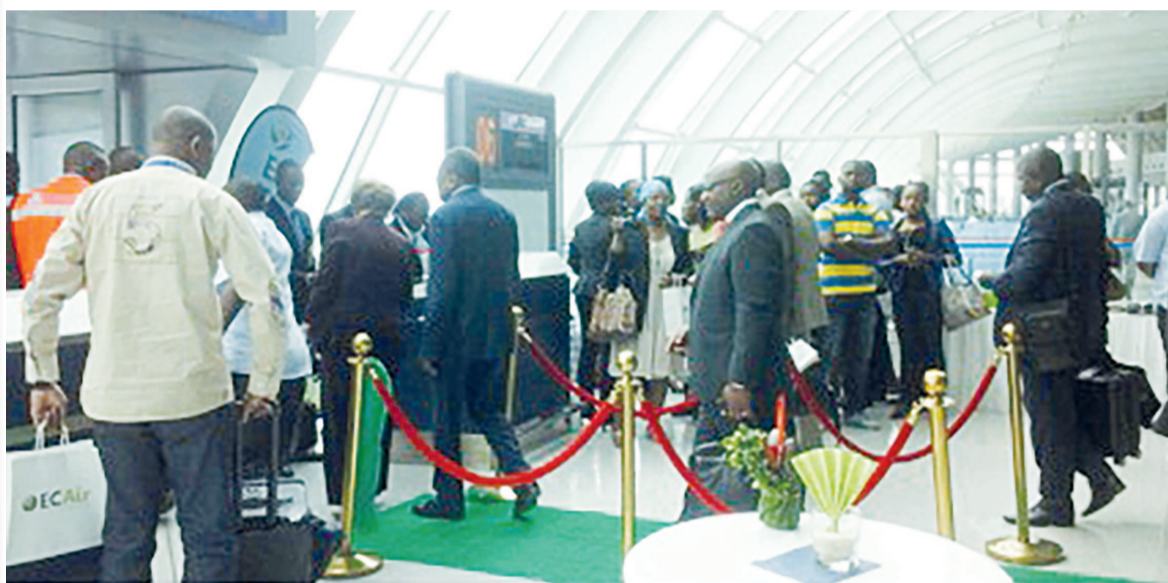
Les derniers passagers à embarquer, photo Adiac

« Nous allons nous présenter chaque fois que c'est nécessaire au tribunal pour continuer à défendre notre position et expliquer que ces avions appartiennent à Ecair qui est une société anonyme dont l'État est actionnaire. Mais les avions