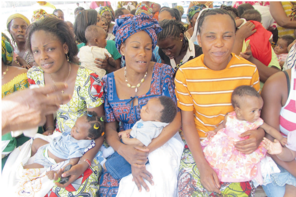
Des mères à l'attente de la vaccination de leurs enfants

Le vaccin contre la poliomyélite est une solution liquide qui s'administre par la bouche. Il est efficace sans risque et sans danger pour l'enfant. Le vaccin est