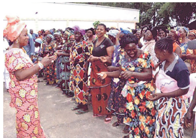
Antoinette Sassou N'Guesso s'adressant aux femmes de Mongo Mpoukou

À l'occasion de la célébration de la fête des mères, Antoinette Sassou N'Guesso, l'épouse du Chef de l'Etat a entretenu le 31 mai à Mongo Mpoukou dans le 5e arrondissement de Pointe-Noire les mamans de cet arrondissement sur les vertus de paix, d'amour et de solidarité.