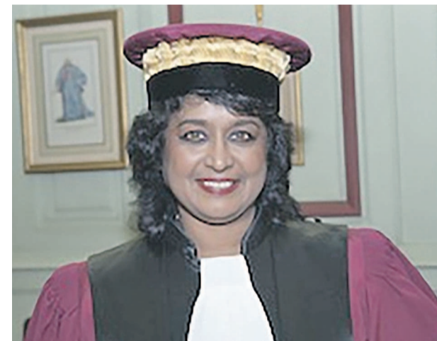
La présidente Ameenah Gurib-Fakim

La biologiste Ameenah-Garib Fakim a été désignée par le gouvernement, ce lundi 1er juin, comme présidente de la République de Maurice après la démission de Kailash Purryag, le 29 mai dernier. Elle devient ainsi la première femme à occuper ce poste dans l'histoire du pays.