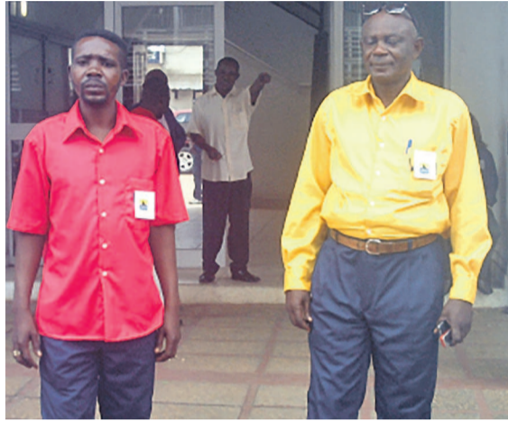
À gauche la tenue des contrôleurs et à droite celle des chauffeurs

teur du transport en commun, qu'une nouvelle mesure a été édictée en destination des chauffeurs de transport en commun. Ces derniers devront porter une tenue de travail si cette mesure venait d'être appliquée. Pour les chauffeurs c'est un pantalon bleu de nuit et une chemise jaune, manches longues ou courtes, flanquées de deux poches avec rabat portant sur la poche gauche, avec un macaron ou écusson frappé des insignes VPN, le