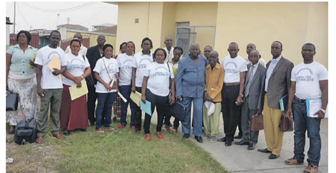
Photo de famille après le lancement des activités