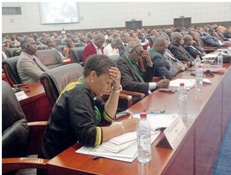
Vue des participants

Lors de cette troisième réunion conjointe, la dernière du genre avant le démarrage de la compétition, les délégués vont conclure certaines procédures et formalités administratives et techniques afin de répondre aux exigences des règlements généraux des Jeux africains 2015. « A trois mois de l'ouverture des jeux, il ne s'agit plus de spéculer sur les correctifs là où ils s'imposent, et je suis convaincu que la haute expertise des participants à cette réunion sera mise à profit pour parvenir à des résolutions constructives », a commenté Michel Tchoya, l'administrateur intérimaire du Conseil du sport de l'Union africaine. Les experts venus pour la réunion conjointe, ont pu apprécier les efforts remarquables fournis par le Coja 2015 dans les