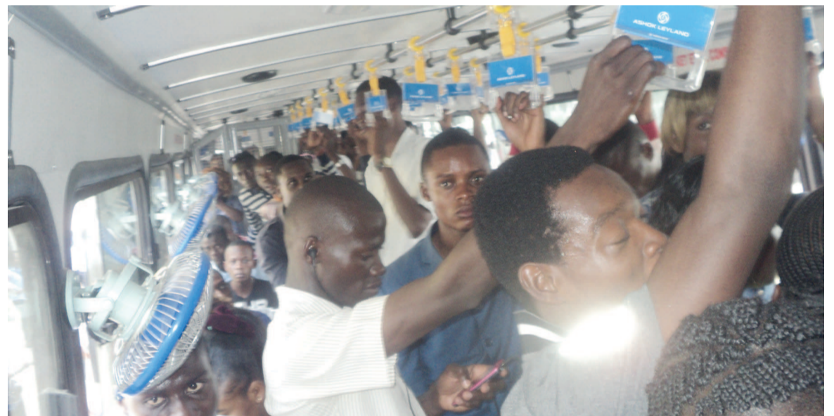
De nombreux élèves à Brazzaville ont emprunté les bus de l'État

Le gouvernement congolais a mis en circulation le 2 juin, les véhicules de transport en aller et retour des candidats au baccalauréat session 2015 tant pour ceux de l'enseignement général que de l'enseignement technique