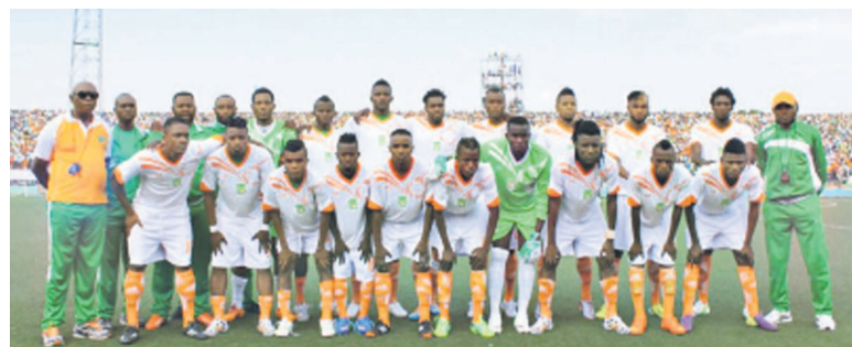
FC Renaissance du Congo de Kinshasa