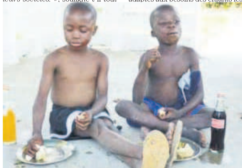
Même les enfants défavorisés ont droit à une vie décente