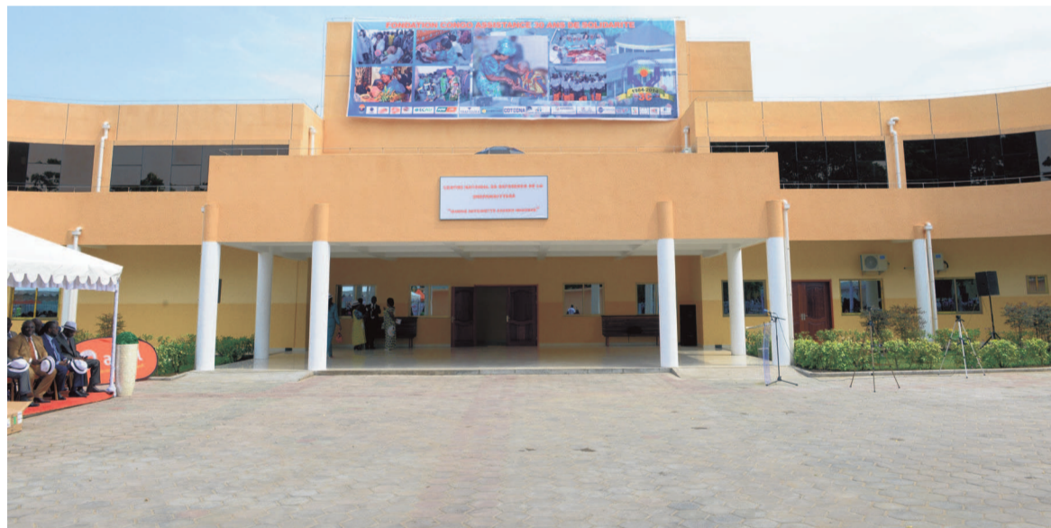
La façade principale du centre

Du moins, le jour de l'inauguration de ce centre, les visiteurs ont pu constater l'installation des lits et de quelques matériels de première nécessité. En effet, l'inauguration du centre national de référence de la