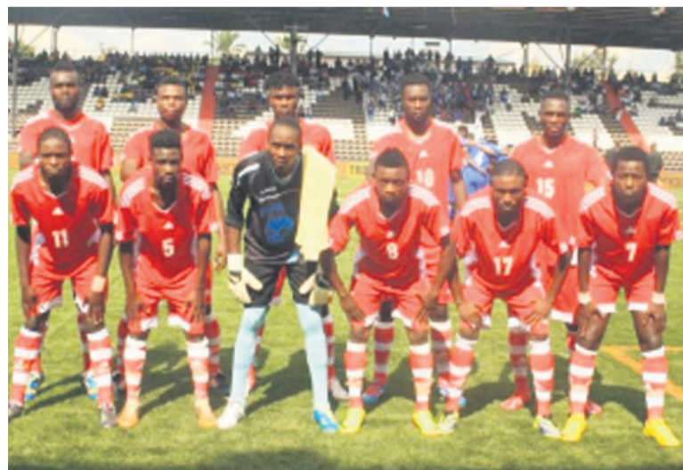
FC Saint-Eloi Lupopo de Lubumbashi

Dans la grande affiche du groupe B, le FC Saint-Eloi Lupopo a battu à l'arrachée le Daring Club Motema Pembe