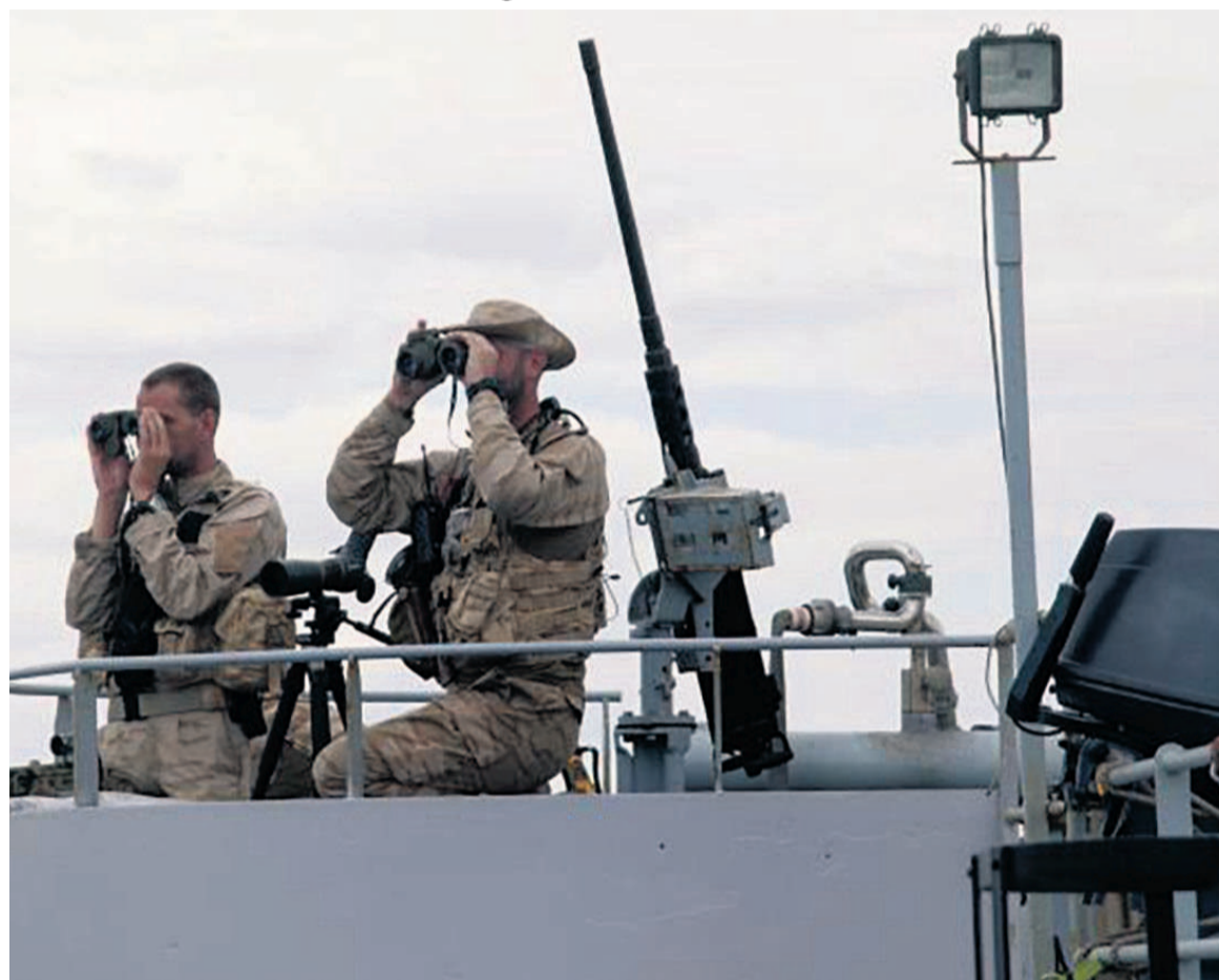
Des militaires scrutent l'horizon à bord du bateau belge Godetia, le 18 juin 2015.

Les vingt-huit pays de l'Union européenne tournaient autour de la manière radicale de freiner les vagues de migrants provenant surtout des côtes libyennes. Lundi, ils sont passés à l'action. Réunis à Luxembourg, les ministres des Affaires étrangères ont décidé de déployer les gros moyens pour endiguer les flux, dont surtout l'Italie et la Grèce supportaient seules le plus gros poids dans un problème pourtant européen. Ces derniers jours, les images des migrants rejetés de partout et bloqués à Vintimille pour les empêcher d'entrer en France donnaient le spectacle désolant d'une Europe se barricadant. Une Europe « égoïste » condamnée par le pape au Vatican. « Je vous le dis clairement, les cibles ne sont pas les migrants, mais ceux qui gagnent de l'argent sur leurs vies et, trop souvent, sur leurs morts », a-t-il déclaré. La commissaire européenne des Affaires étrangères, l'Italienne Federica Mogherini, a tenu à y mettre les formes. « Cette première phase de l'opération commencera à être mise en œuvre dans les jours à venir, avec un recueil d'informations et des patrouilles en haute mer pour aider à