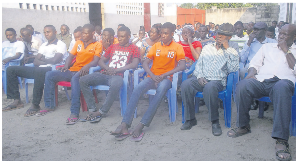
Une vue des mandants

se rendre à Moukondo-Mazala via la pirogue. L'élu de Djiri a promis transmettre toutes ces doléances à qui de droit, pour que des solutions idoines soient