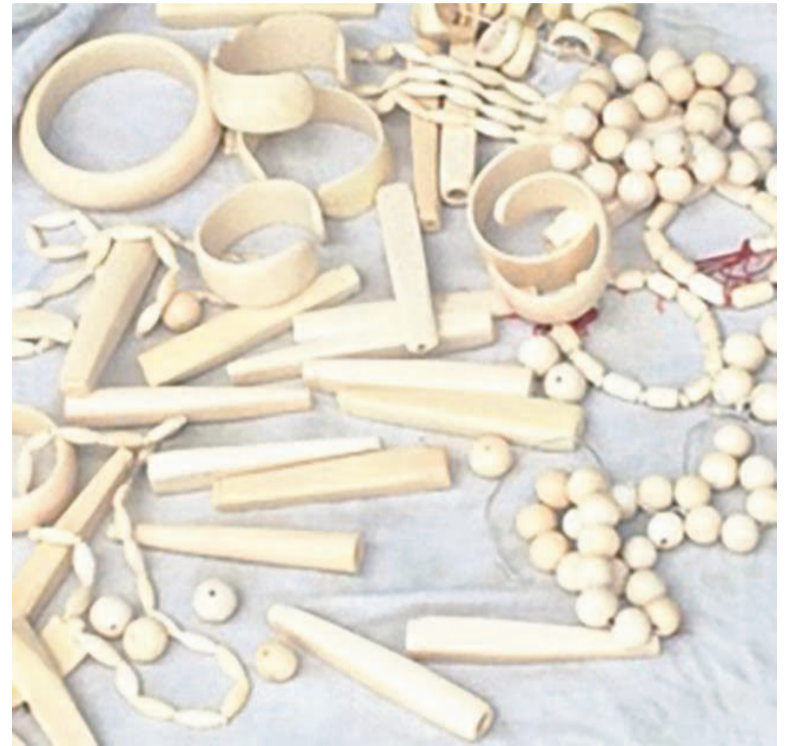
Ces bijoux en ivoire ont fait l'objet d'une interpellation