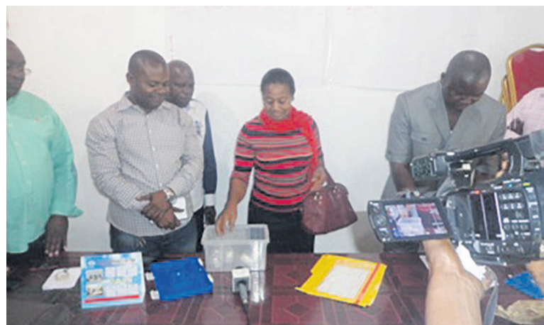
Le tirage au sort

Le dimanche 28 juin, la Jeunesse sportive de Poto-Poto (JSP) en découdra avec Etoile du Congo, en première explication. Bras de fer entre une équipe de ligue 2 qui s'affirme et un vétéran de ligue 1 déterminé à obtenir le ticket des demi-fi-