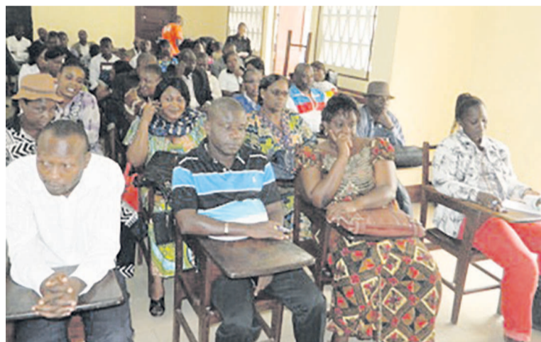
Une vue des participants lors du lancement de la formation