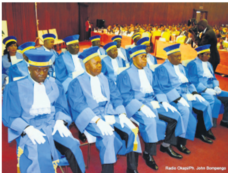
Les membres de la Cour constitutionnelle