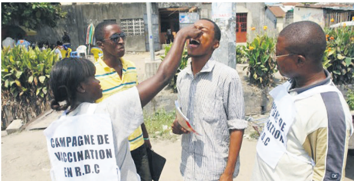
Une femme entrain d'administrer le vaccin contre la polio

Introduit officiellement dans le calendrier vaccinal de l'enfant en RDC, le 28 avril 2015, lors du lancement de la semaine africaine de la vaccination à Mbakana dans la commune de Maluku, le nouveau vaccin injectable contre la polio vient d'être introduit dans la vaccination de routine à Lubumbashi dans la province du Katanga. Soulignant l'importance de l'introduction de ce nouveau vaccin qui vise à éradiquer le virus polio sauvage et à protéger les enfants contre cette maladie invalidante, le ministre provincial de la Santé a invité la population à adhérer à la dynamique pour le bien-être des enfants. Notons que la RDC est engagée sur la voie de l'éradication de la polio qui touche plus les enfants de moins de cinq ans et provoque la paralysie des membres inférieurs. La seule arme pour vaincre la polio, c'est la prévention qui passe par la vaccination. Page 13