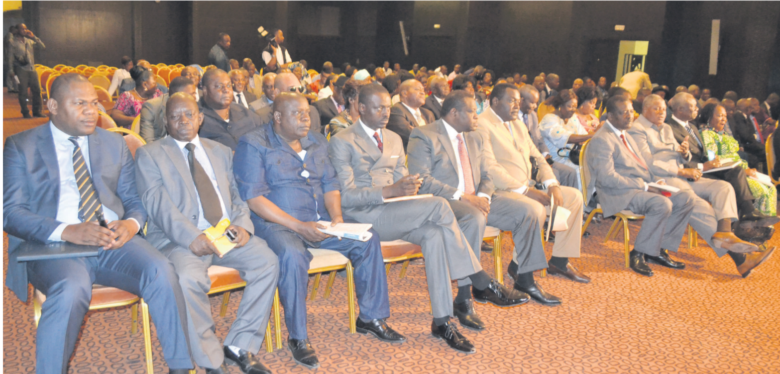
Le cadres du Pool en avant-plan

européenne à plus de 37 milliards FCfa. Les travaux avaient déjà débuté depuis le 3 mars 2014 pour une durée d'exécution de 32 mois. Cette route est la suite du tronçon Brazzaville-Kinkala (75 km), achevée depuis 2008.