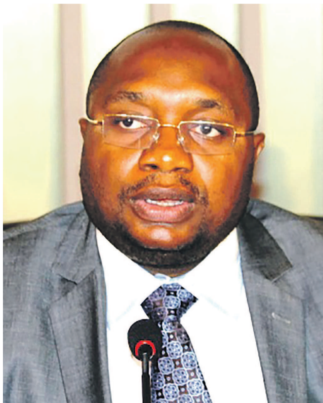
Dr Félix Kabange Numbi