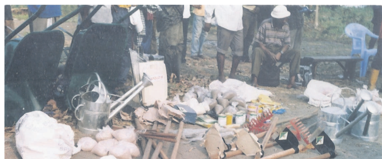
Quelques lots prêts à être distribués

de dix boîtes de 100kg de tomate du Japon, du concombre du sud du pays, de l'aubergine violette, ainsi que quelques kilos de l'oignon et d'Afrique, de la ciboule de France et des engrais chimiques. « L'AJCP est une association qui milite en faveur de la paix et du développement. Lorsqu'il y a paix, il y a développement. Comme notre pays jouit actuellement d'une paix stable, nous avons pensé qu'il fallait rentrer dans le cas du