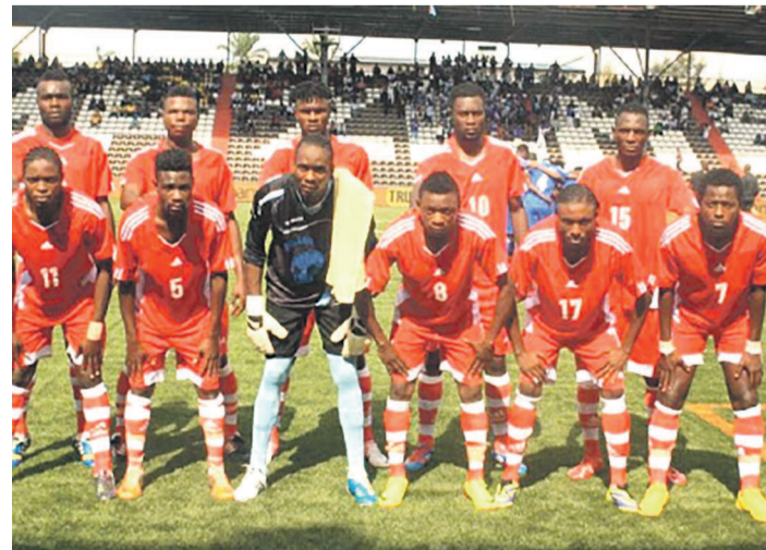
Lupopo affrontera KFA en finale de la Coupe du Congo