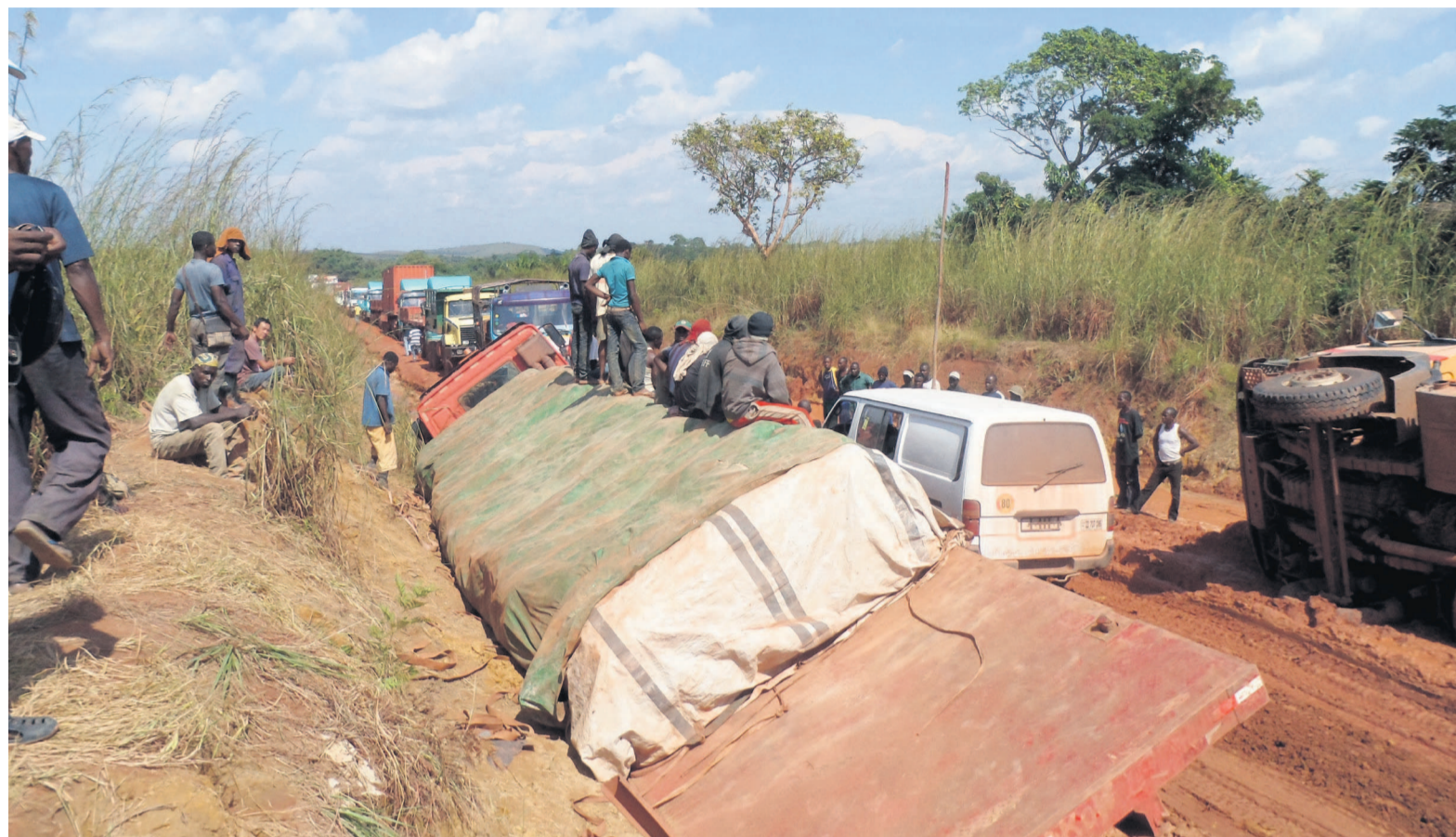
La construction du tronçon Kinkala-Mindouli mettra fin à ce spectacle

Partie intégrante de la route nationale numéro 1 reliant Brazzaville à Pointe-Noire, le tronçon Kinkala-Mindouli, inclura l'aménagement et le bitumage de trois kilomètres de routes urbaines à Mindouli, et d'un kilomètre de raccordement du village Missa-fou-Gare, rapporte la même fiche technique. En 2006-2009, dans le