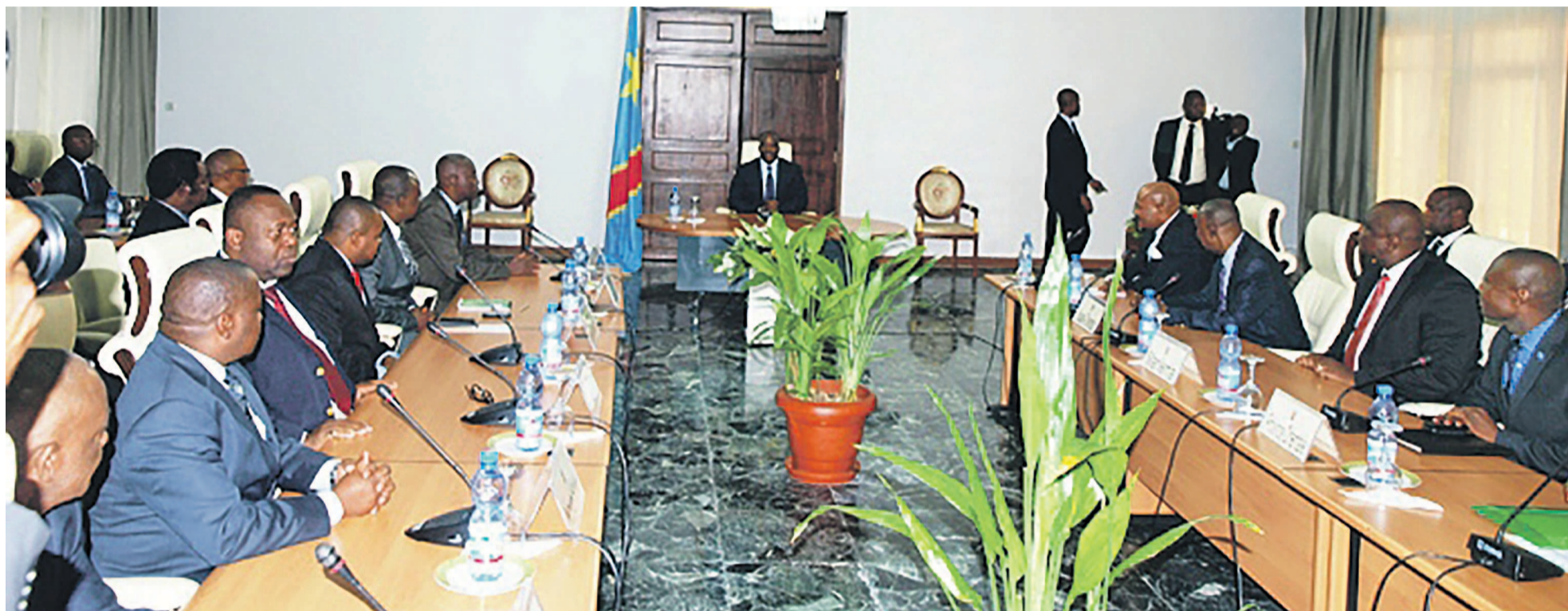
Joseph Kabila s'entretenant avec les députés

C'est de la ville de Matadi, dans la province du Kongo central, que le président de la République prononcera son discours à la nation en marge du défilé marquant le 55 e anniversaire de l'accession de la RDC à l'in-