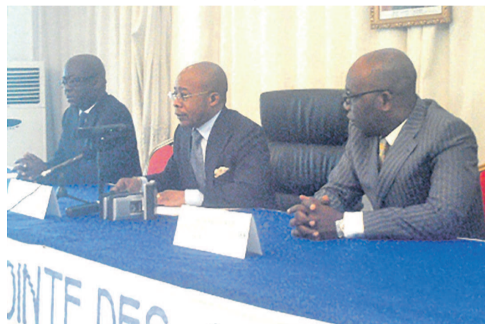
Le ministre Martin Parfait Aimé Coussoud-Mavoungou ouvrant le focus.

« Mon constat amer est de voir que les entreprises maritimes n'ouvrent pas leurs portes pour faciliter les stages et les emplois aux gens de mer à former ou formés. Pourquoi avons-nous peur de la relève ? Je rappelle que la priorité