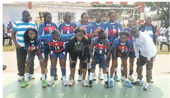
Patronage dames