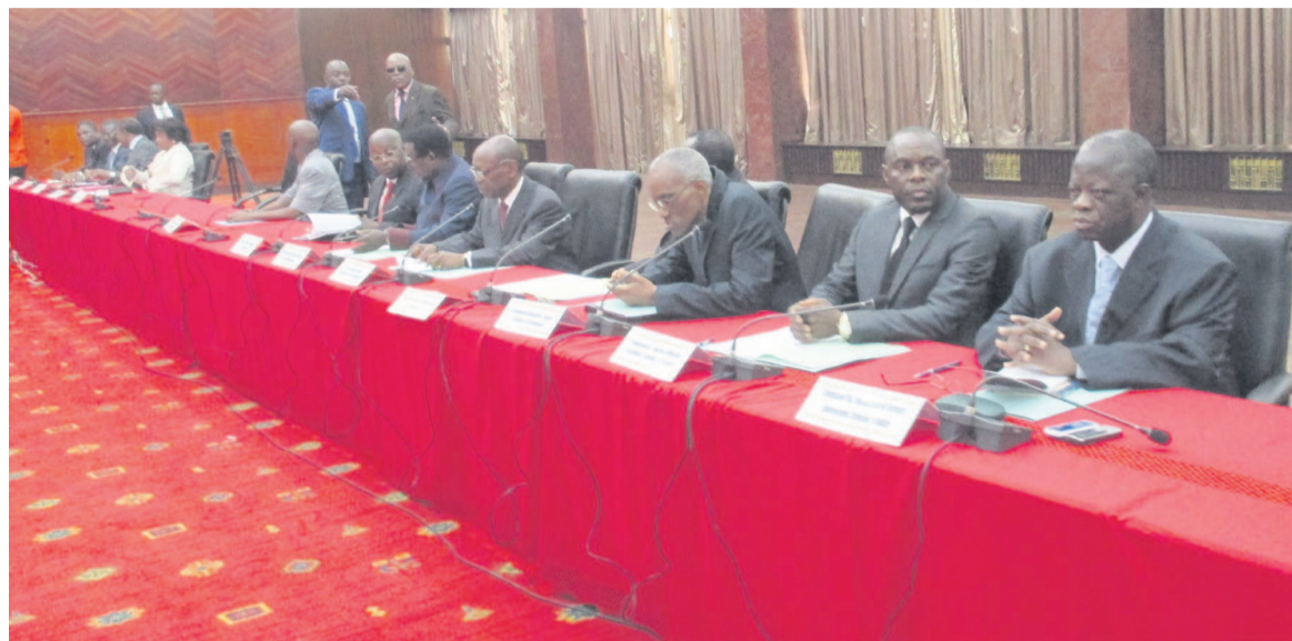
Une vue des députés lors de la Conférence des présidents

En prélude à la session administrative qui s'ouvre de coutume le 02 juillet, la conférence des présidents a inscrit, le 25 juin à Brazzaville, à son ordre du jour : 18 affaires au Sénat contre 13 à l'Assemblée nationale.