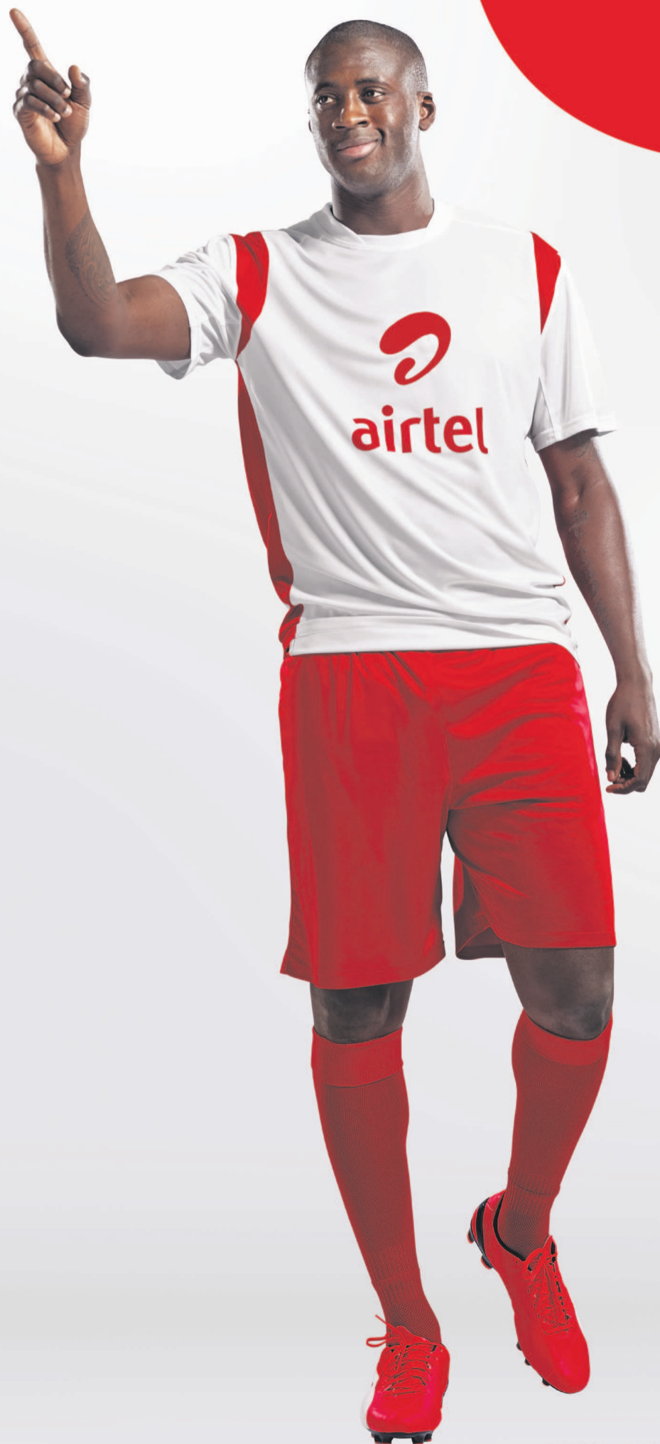
YAYA TOURÉ | JOUEUR AFRICAINE DE L'ANNÉE