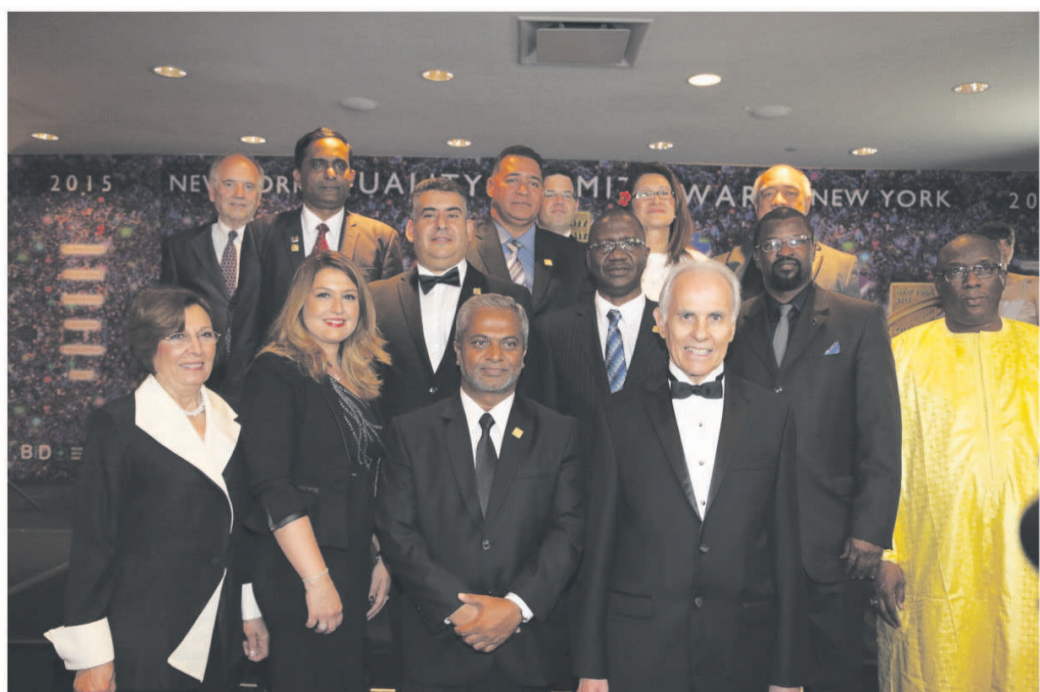
Le Président de BID avec les membres de quelques sociétés lauréates