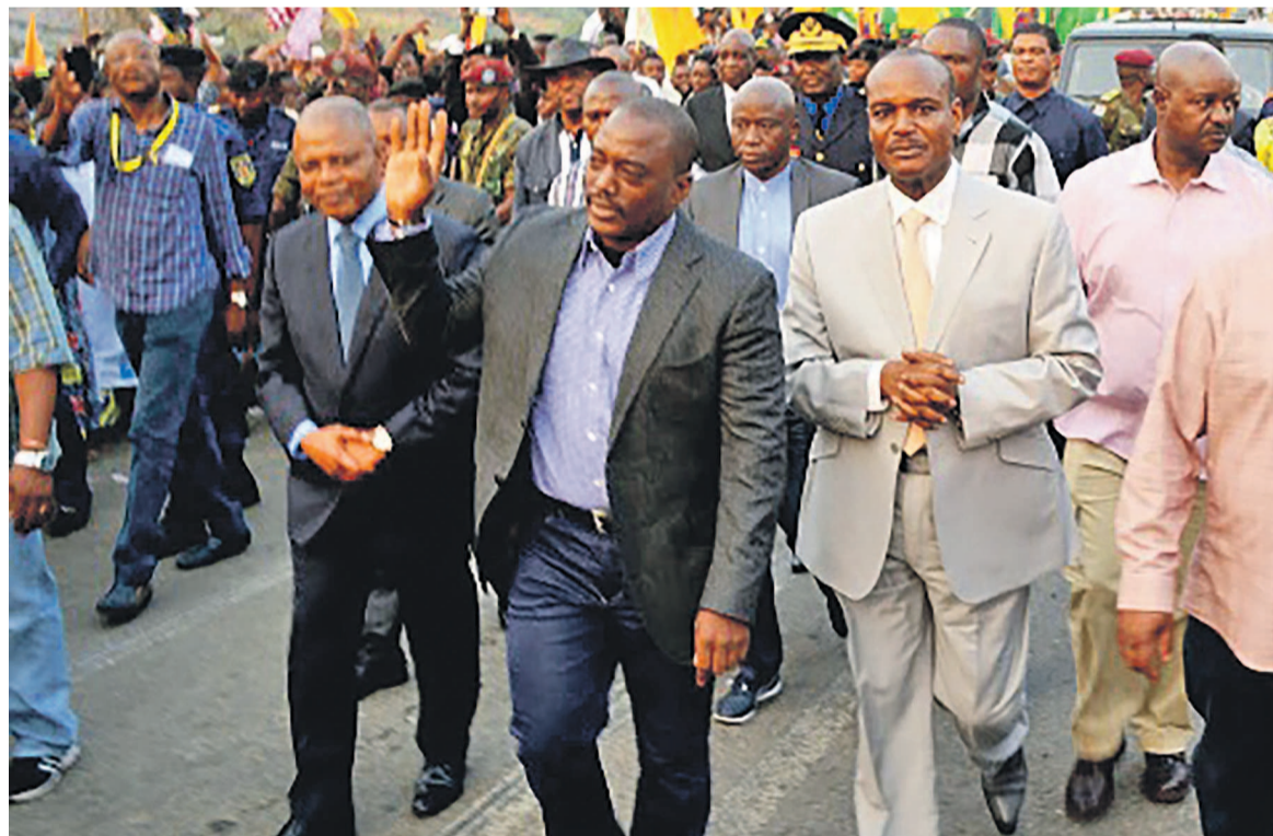
Arrivée de Joseph Kabila à Matadi pour les festivités du 30 juin 2015

En attendant l'issue des dites consultations qui se poursuivent encore dans le Congo profond par le biais des échanges que les gouverneurs des provinces ont avec leurs administrés, Joseph Kabila a, dans son speech,