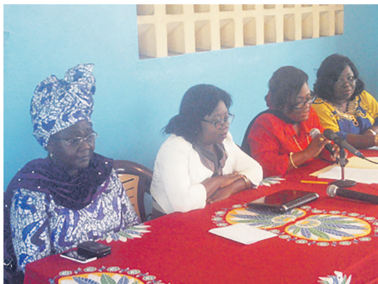
La tribune officielle sur la situation des veuves au Congo

La quatrième édition de la journée internationale consacrée à la veuve décrétée le 23 juin de chaque année a été célébrée au Congo sous le thème « Les rites de veuvage : Redonner la dignité aux femmes ». Cette activité a été une occasion de se pencher sur la situation de la veuve qui subit des humiliations calvaires après la disparition de son mari. Maltraitée et privée de ses droits, tout comme les enfants, spoliés de leur héritage paternel, réduite à la précarité, donc incapable d'assumer ses responsabilités élémentaires de mère et de citoyenne et de jouir de ses droits fondamentaux, tant en tant que personne humaine que veuve, la femme veuve subit les pires humiliations possibles. La précarité, qui en est la conséquence immédiate la conduit à la