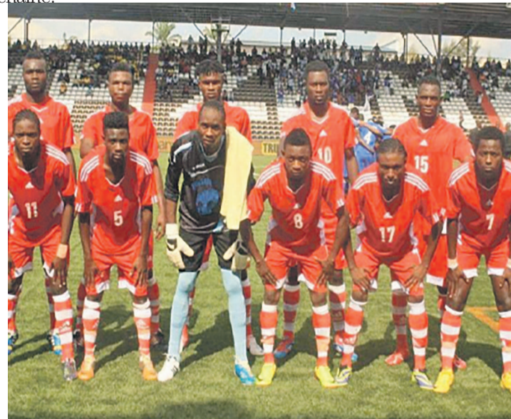
FC Saint-Eloi Lupopo, vainqueur de la 51 e Coupe du Congo de football