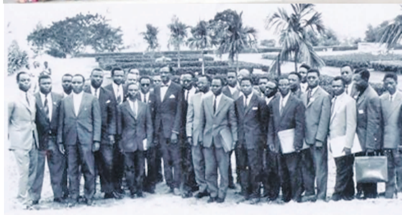
Les gouvernements Lumumba et Matata, 55 ans après

il a appelé clairement à l'élevation d'une nouvelle race de Congolais. En effet, ces défis futurs ne pourront être relevés que par des jeunes épris de jus-