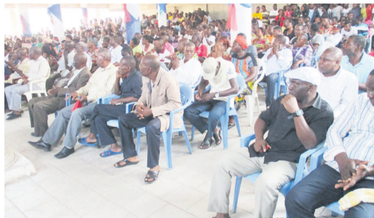
Les habitants du quartier 54 Ouenzé

Au cours de cette rencontre, d'autres questions ont été évoquées notamment sur les actes de vandalisme et les cas d'inci-