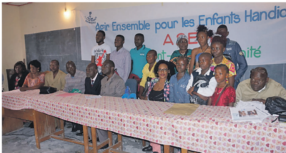
Les membres de l'Association et le personnel de l'Institut accompagnés des meilleurs élèves

Les membres de l'association Agir ensemble pour les enfants handicapés, A2EH ont procédé ce mardi 30 juin au Centre de promotion des personnes handicapées à la remise de divers gadgets aux meilleurs écoliers de cet institut à l'occasion de la cérémonie d'émulation marquant la fin de l'année scolaire 2015.