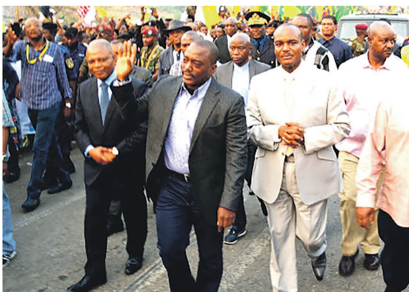
Arrivée de Joseph Kabila à Matadi pour les festivités du 30 juin

Pour la première fois, la ville portuaire de Matadi, chef-lieu de la province du Kongo central, a abrité ce 30 juin les festivités marquant le cinquante-cinquième anniversaire de l'indépendance du pays. C'était en présence du chef de l'État, Joseph Kabila, des différents animateurs des institutions et des ambassadeurs et chefs des missions diplomatiques accrédités à Kinshasa. Outre l'imposant défilé militaire et des forces vives, l'autre temps fort de cette journée aura été marqué par le mot de circonstance de Jacques Mbadu. Au sujet des consultations menées par ses soins sur recommandation du chef de l'État qui tenait à les étendre en provinces, le gouverneur du Kongo central a indiqué que ses administrés adhèrent