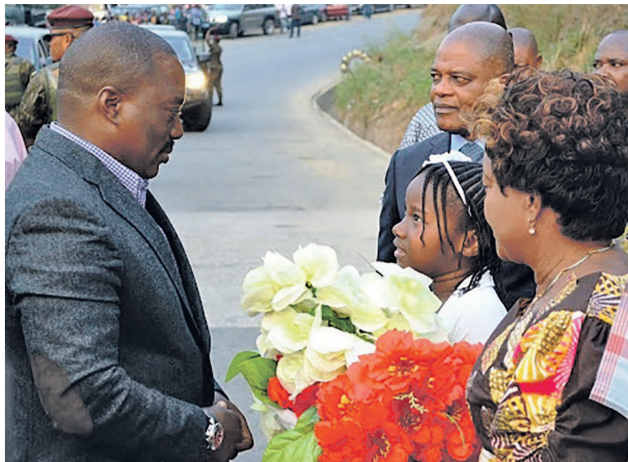
Accueil de Joseph Kabila à Matadi