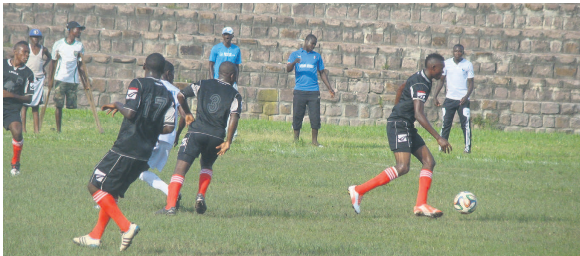
Phase de jeu d'un match de l'AS Tsiemba

souligne l'article 47 du règlement du Championnat national d'élite ligue 1.