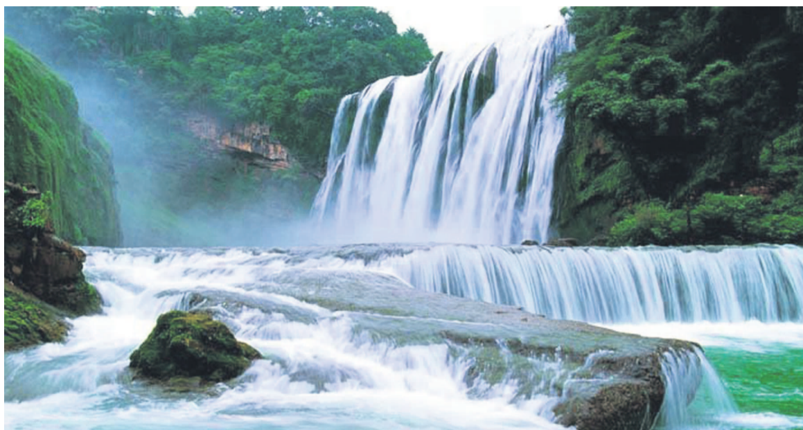
La chute de Huangu Shu, une merveille naturelle de la province de Guizhou

Outre la chute de Huangu Shu, la province doit également sa