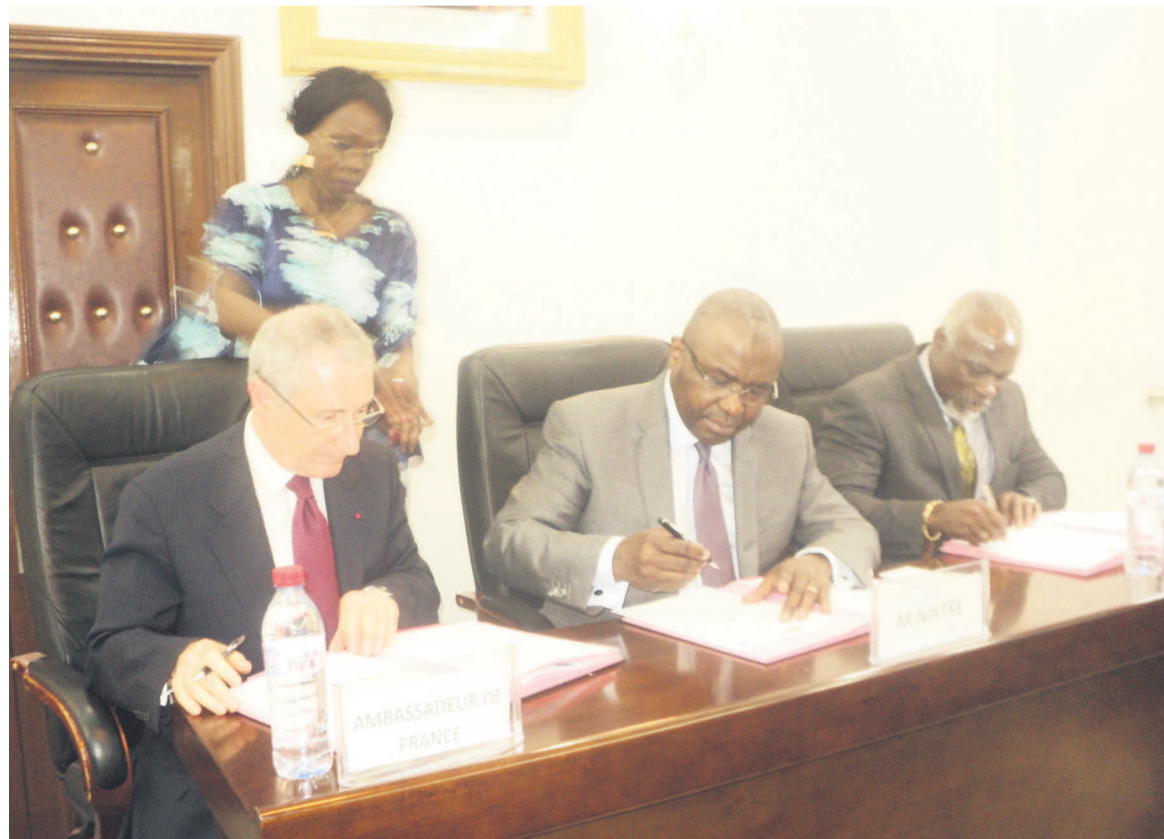
La signature des documents par les trois parties

monisé des finances publiques au sein des Etats membres.