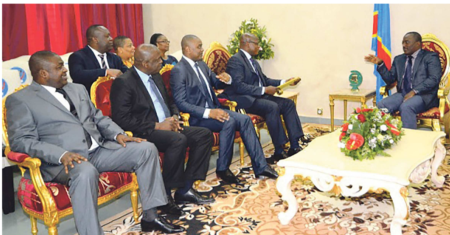
Joseph Kabila en consultation avec les acteurs politiques