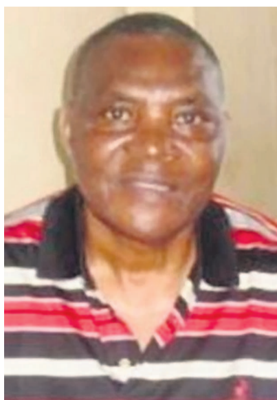
Pierre Kalala Mukendi

Et en 1968, Pierre Kalala offre donc le sacre de la CAN à la RDC grâce à un but d'anthologie en