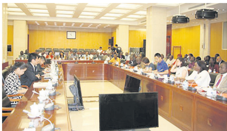
Réunion de concertation entre les journalistes africains et l'équipe rédactionnelle de Xinhua

En rapport avec le développement des nouveaux médias, l'agence Chine nouvelle (Xinhua), une institution du gouvernement chinois, se montre plus que déterminée à élargir son champ d'action dans le continent africain où elle a déjà signé des accords dans le cadre d'un échange d'informations.