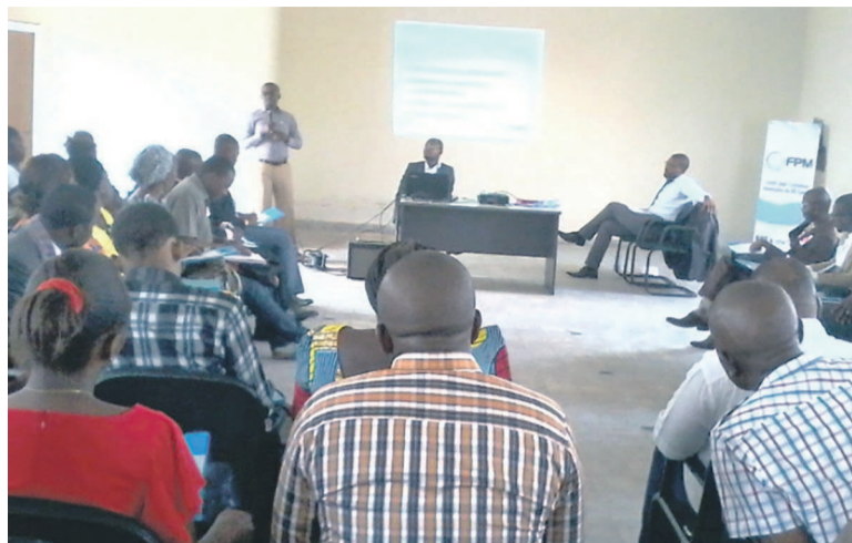
Une vue de l'assistance suivant les exposés des responsables PME des institutions bancaires