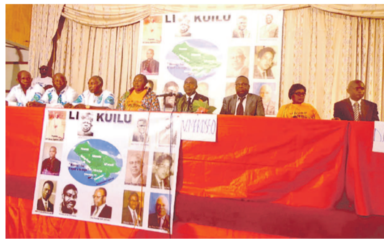
Les membres du bureau de Li Kuilu lors de la sortie officielle

Les fils et filles du Kouilou n'ont pas voulu rester insensibles devant la perte des valeurs culturelles et la crise des repères culturels, politiques et économique qui constituent de véritables menaces sur l'âme du terroir. C'est donc la volonté commune de pouvoir revisiter l'histoire, les valeurs ancestrales, l'héritage culturel et