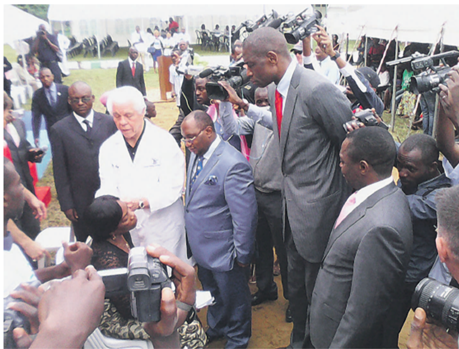
Une opération de pose de prothèses auditives à l'HBMM/Photo Adiac.

L'HBMM fait également des descentes sur terrain afin de mener certains actes en faveur de la population. Il s'agit, pour cette formation médicale, de procéder à certains examens gratuits ( ten-