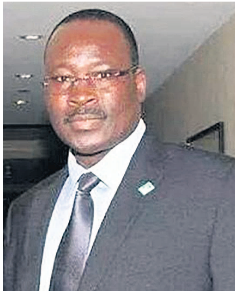
Le lieutenant-colonel Isaac Zida, Premier ministre de la Transition

Depuis la chute de Blaise Compaoré en fin octobre de