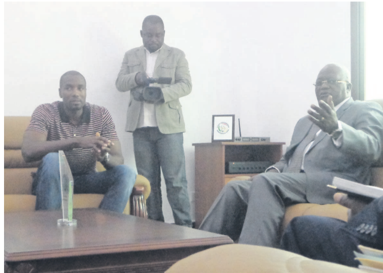
Serge Ibaka dévoilant ses projets

La star du basket-ball congolais reçue en audience ce 1 er juillet par Léon Alfred Opimbat a dévoilé son projet d'investir dans le social pour aider la population démunie.