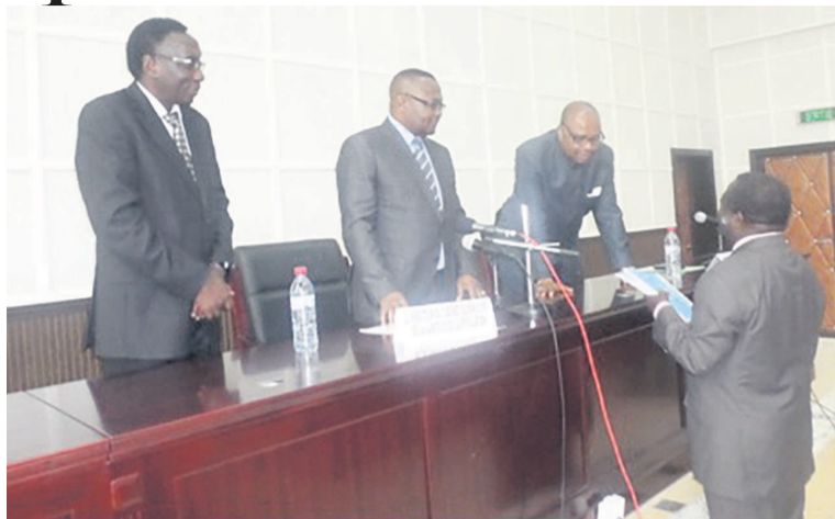
Remise des kits de prévention

Présidant la cérémonie d'ouverture, le directeur du cabinet du ministre de la Santé et de la population a rappelé que le pays ne devrait pas baisser la garde même si jusque-là il n'a été enregistré