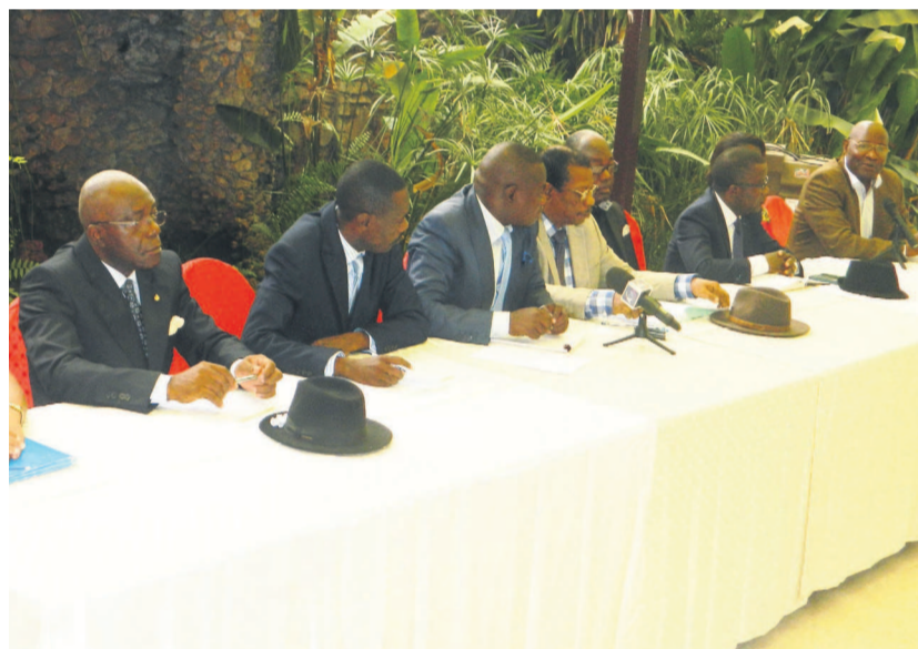
Des membres du Frocad