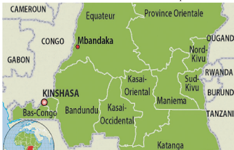
Province du Kongo Central

Les données en notre possession indiquent que le Kongo Central compte exactement 321