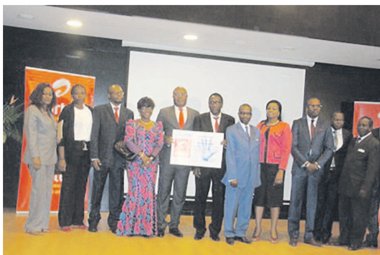
Les DG de Airtel et le représentant de l'Unicef 'au milieu' entourés de leurs collaborateurs

Pendant que la pandémie du virus Ebola sévissait l'année dernière, dans ces trois pays de l'Afrique de l'Ouest, au niveau du Congo, la société de téléphonie mobile, Airtel-Congo, qui répondait à l'appel du ministère de la Santé pour prévenir la maladie, avait beaucoup communiqué dans le cadre de la prévention. Elle s'était affichée, surtout