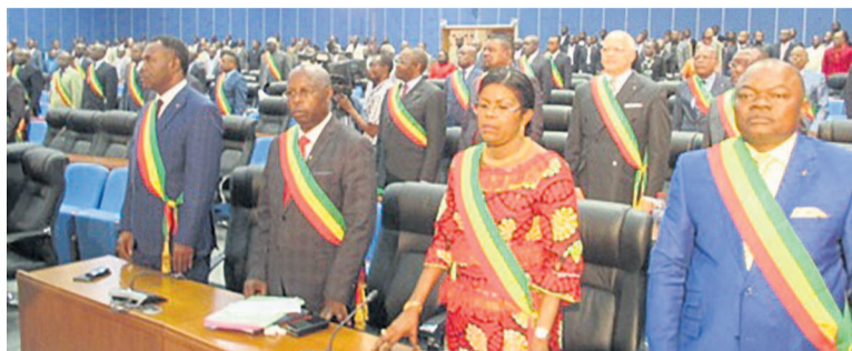
Une vue des députés