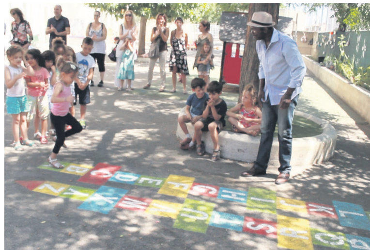
Les enfants jouant à la marelle alphabet africa