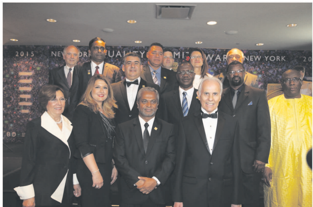
Le Président de BID avec les membres de quelques sociétés lauréates