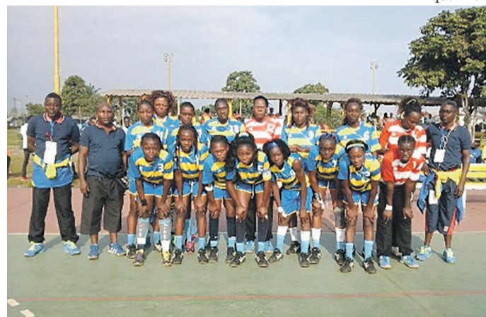
Abo sport «DR»

Inter remporte son 17e sacre six ans après. Il représentera le Congo au championnat d'Afrique des clubs champion