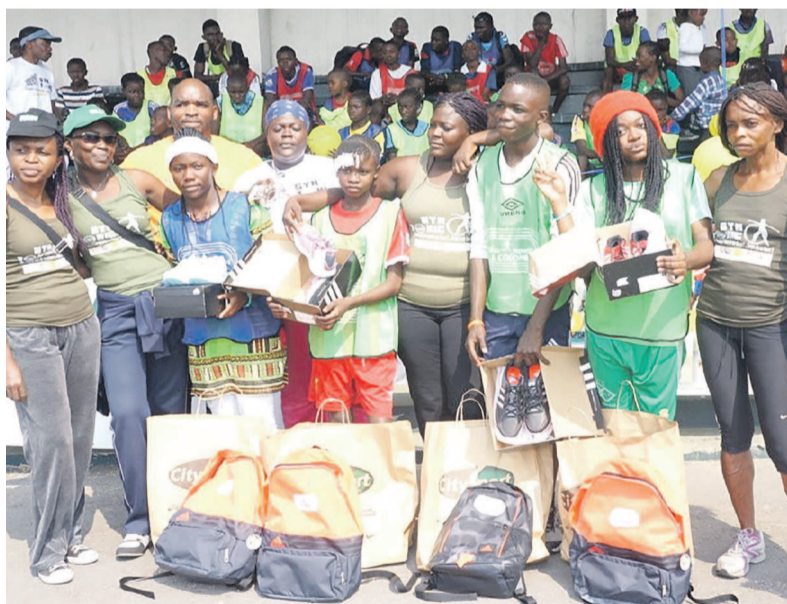
Photo de famille lors de la cérémonie