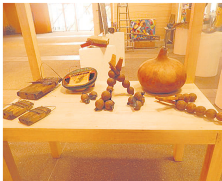
Instruments traditionnels congolais!

La première édition du Festival international des instruments de musique traditionnelle (Fiimt) a débuté hier matin à l'Institut français du Congo par un atelier d'initiation à l'endroit de plusieurs griots Brazzavillois et d'une exposition des instruments traditionnels.