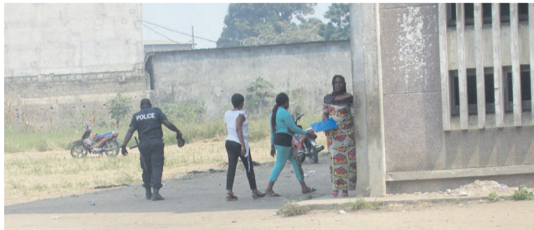
La force publique et les surveillants de salle veillent au grain au lycée Pierre Savorgnan de Brazza

C'est le cas dans les centres des lycées Pierre-Savorgnan de Brazza et Chaminade ainsi qu'au CEG Lheyet Gaboka où nos reporters sont passés. Mais la réalité ne semble pas la même d'un site à un autre. Si au lycée Pierre-Savorgnan de Brazza sur les 505