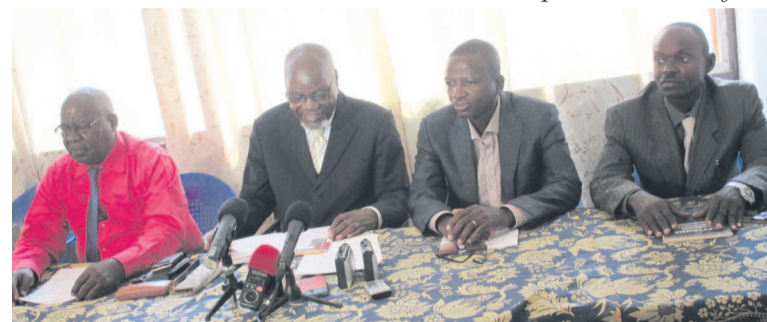
Le présidium des travaux

Ce groupement de partis de l'opposition lance ainsi un appel patriotique à tous ceux qui militent pour le respect de l'ordre constitutionnel et l'alternance démocratique de se mobiliser afin de déjouer « le piège » sur l'évolution des institutions et éviter une transition politique. « C'est ensemble, démocrates et patriotes congolais que nous gagnerons la bataille de l'alternance démocratique en