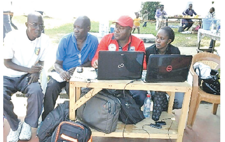
Les secrétaires-chronomètres et observateurs pendant la compétition «DR»

Présenté il y a plus de trois mois à Brazzaville, le logiciel de gestion des statistiques des matchs de handball a été conçu par la Société Congo Ingéniering Consulting (CIC), partenaire de la Fédération congolaise de Handball, dans l'optique de la prise en compte des rencontres du tournoi de handball lors des 11e Jeux africains, prévus du 04 au 19 septembre dans la capitale congolaise