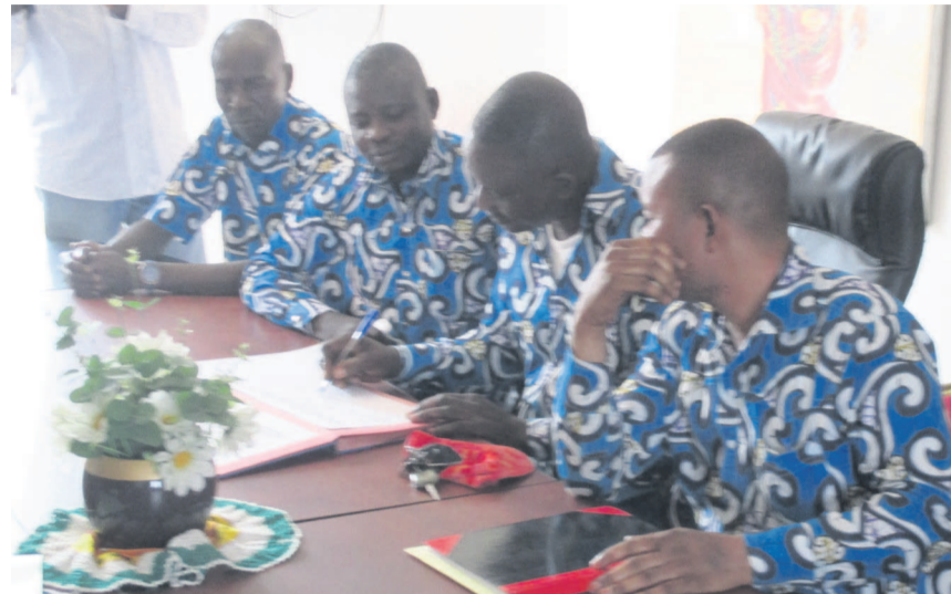
Les Ex-combattants signant le manifeste

de manière à ce que chacun des départements ait la possibilité d'avoir un Gouvernement élu par lui-même pour que ces en-