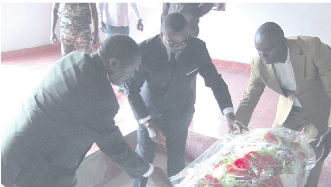
Dépôt de la gerbe de fleurs