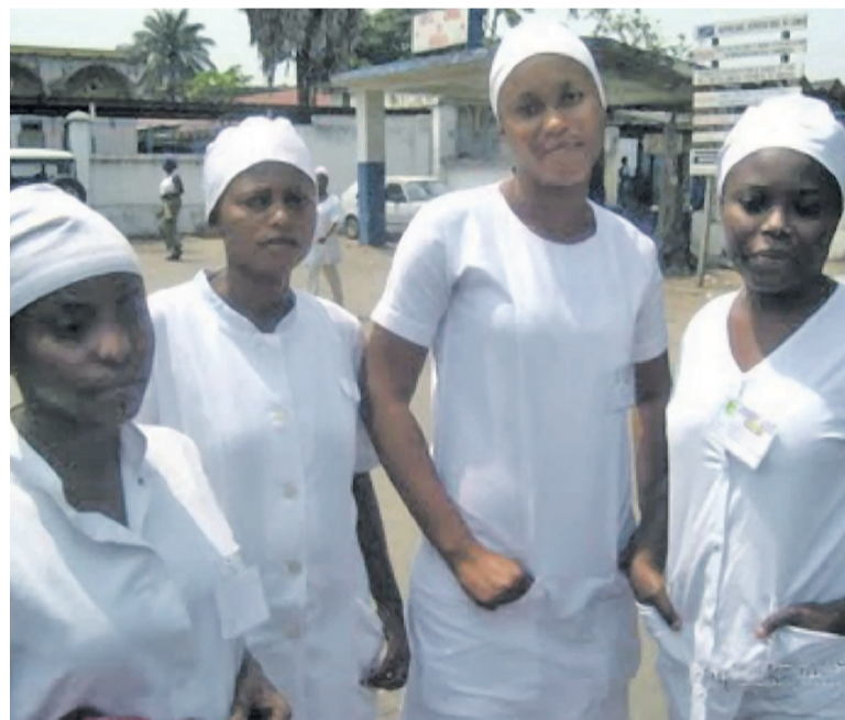
L'amélioration des conditions de vie et de travail des infirmiers préoccupe le gouvernement

Depuis une semaine, l'hôpital général de référence de Matete est paralysé. Pour cause, les médecins et infirmiers ainsi que le personnel paramédical opérant dans cette formation médicale sont entrés en grève.