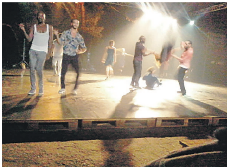
Badke sur la scène de Connexion Kin dans la cour du Lycée Mama Diankeba à le 13e rue, Limete quartier résidentiel

La danseuse fait partie des trois chorégraphes de la pièce de danse Badke qui met en scène dix danseurs palestiniens. En août 2013, la Suisse a accueilli la première de cette pièce de danse qui avait connu un début de création en 2012 en Palestine et s'est poursuivi deux mois à Bruxelles. Soixante représentations ont été faites jusqu'ici et les premières africaines sont les deux que Kinshasa a abritées, les 3 et le 4 juillet, dans le cadre du festival Connexion Kin. Le lendemain, elle a accordé un entretien exclusif aux Dépêches de Brazzaville.