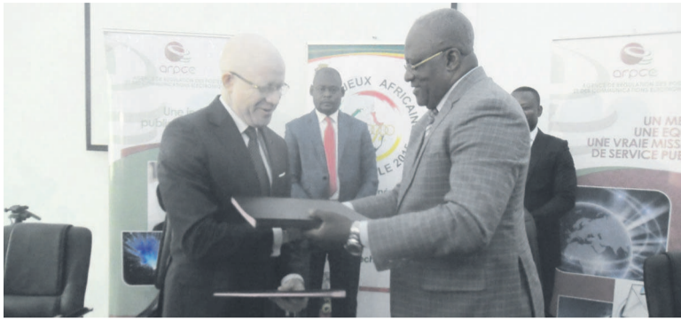
Les ministres Thierry Lézin Mougalla et Léon Alfred Opimbat échangeant les parapheurs

Un protocole d'accord vient d'être signé entre les responsables de MTN, Airtel, Azur, Huawei, de l'Agence de régulation des postes et des télécommunications électroniques (Arpce), le ministère des Postes et des télécommunications ainsi que celui des Sports et de l'éducation physique, pour couvrir le site des Jeux en réseaux Internet et de téléphonie.