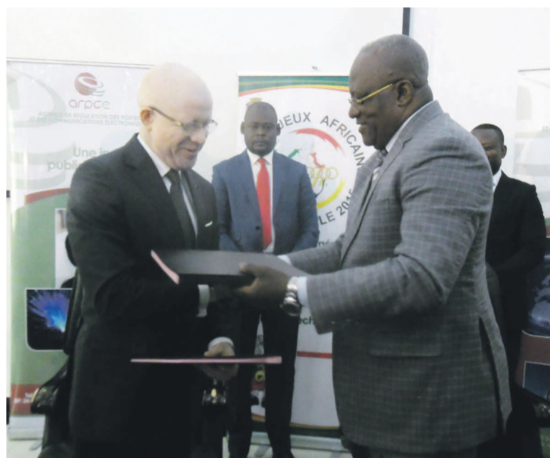
Les ministres Thierry Lézin Mougalla et Léon Alfred Opimbat échangeant les parapheurs

timé à 1 million de dollars, les opérateurs concernés se sont engagés à apporter 70% et l'État 30%. Des investissements qui seront vite minimisés, selon le ministre des Postes et télécommunications, Thierry Lézin Mougalla, qui a estimé à 72 000 le nombre d'abonnés potentiels dans cette zone du site de Kintélé. Page 16