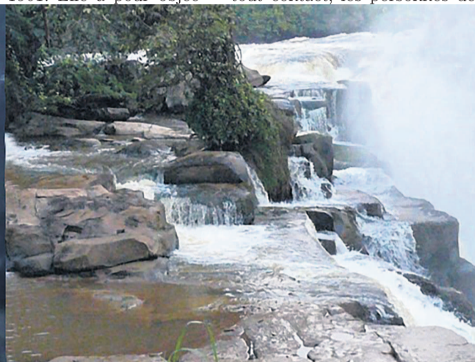
Les chutes de la Loufoulakari

pêche sportive et jeux diverses ; randonnée pédestre ; petit déjeuner et repas. La fin des activités intervient à 15h30. Par ailleurs,