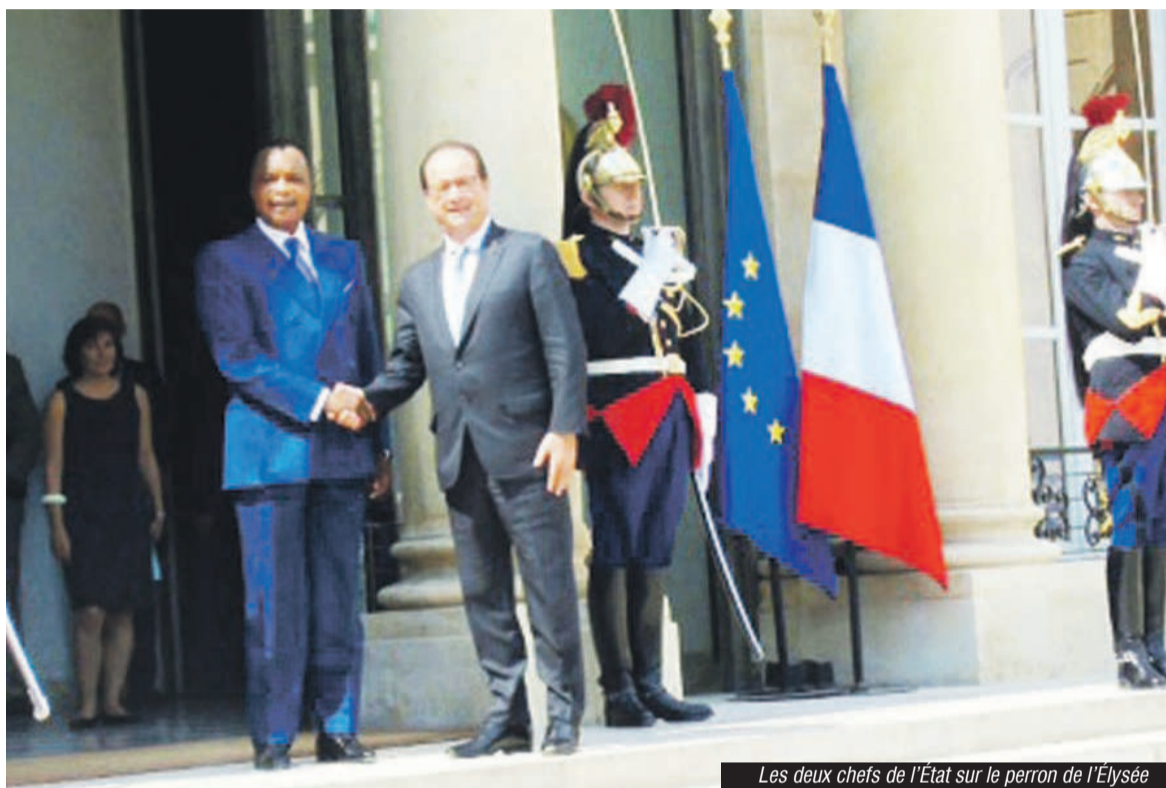
Les deux chefs de l'État sur le perron de l'Élysée