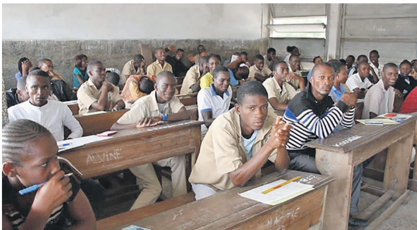
Les candidats au Bac du centre de LVA 1 Pointe-Noire

suite aux fraudes abusives constatées dans tous le pays, à Pointe-Noire les mesures de sécurité ont été renforcées par la direction départementale de l'enseignement conformément à la demande du directeur général des examens et concours, Pierre Mbenga,