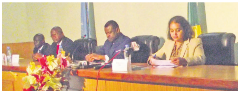
Le ministre du Tourisme et la directrice de la coopération de l'OMT

Depuis hier, des acteurs du secteur touristique examinent, pour validation, le rapport des études de diagnostic réalisées par une équipe d'experts internationaux et nationaux, conjointement sélectionnée par le ministère du Tourisme et de