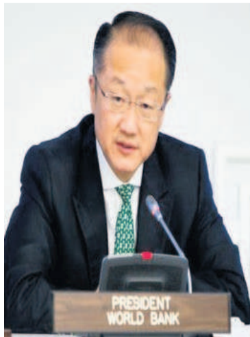
Jim Yong Kim

En Afrique, 5% seulement des importations de produits alimentaires de base proviennent