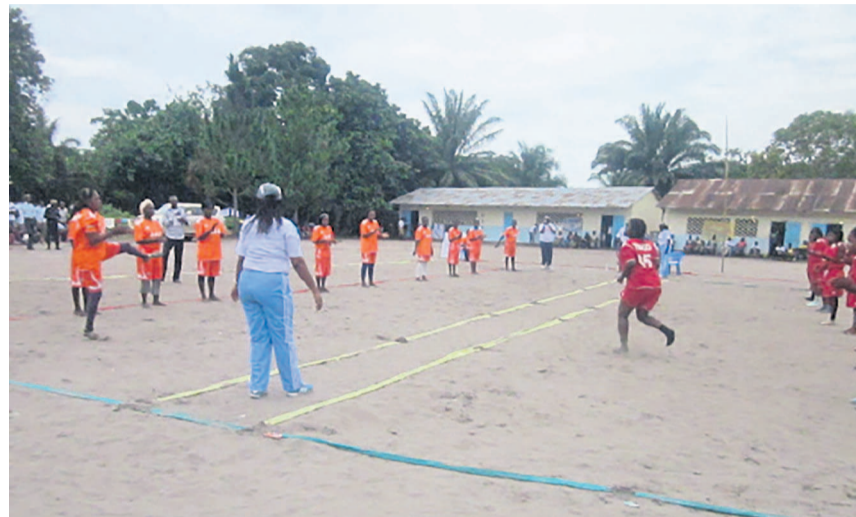
Une rencontre de nzango

La finale de la première édition du championnat départemental de nzango de la ligue de Pointe-Noire opposera Balbin à Femmes unies le 12 juillet au Complexe municipal