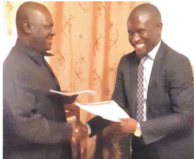
Poignée de mains et échange des parapheurs entre les deux présidents

Cette phase a pour objectif principal d'apporter de l'aide aux retraités dans la réalisation de leurs tâches quotidiennes et prévenir les maladies survenant avec l'âge. En effet la deuxième phase se fixe deux objectifs à savoir le rapport statistique fiable sur la morbidité vue l'incidence de certaines