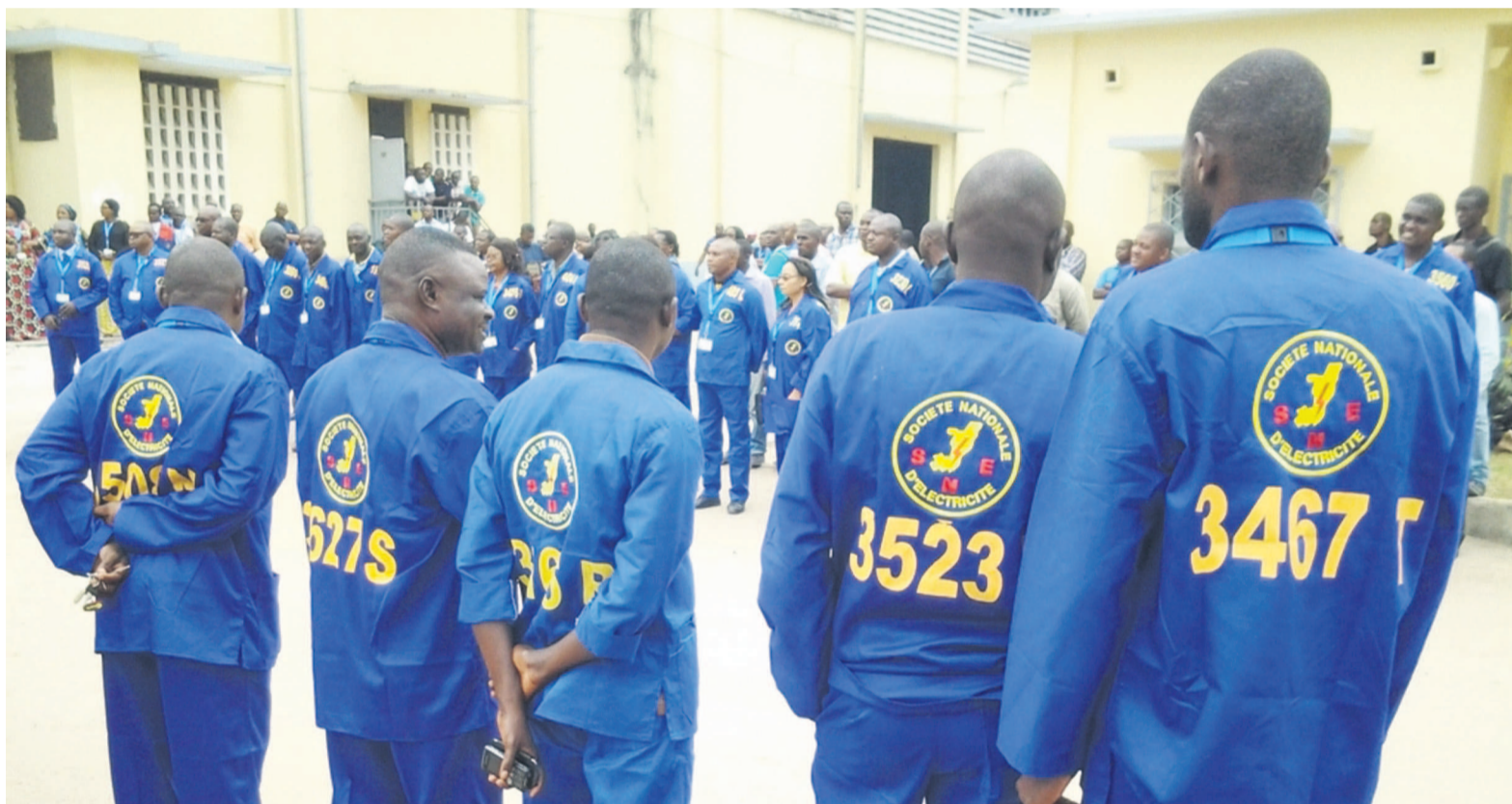
Les commerciaux de la SNE dans leur nouvel uniforme