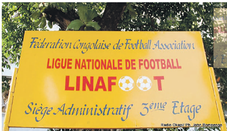
La Linafoot devra attendre le séminaire sur la sécurité avant de tenir son assemblée

La Fecofa a décidé du report de l'assemblée générale de la Linafoot qui doit être précédée d'un séminaire axé sur la sécurité dans les stades.