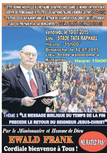
Une affiche sur la tournée du missionnaire en RDC.

Dans son programme, il est prévu de donner deux grandes conférences bibliques à Kinshasa, le vendredi 10 juillet à 15 heures, au stade Tata Raphaël, et le dimanche 12 juillet 2015 à la même heure, au stade vélodrome de Kintambo.