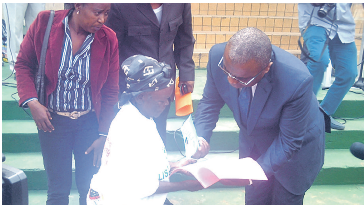
Le ministre Raphaël Mokoko remettant les documents de paie à une bénéficiaire

Pour Djibrilla Issa, représentant résident de la Banque mondiale en République du Congo, le Projet Lisungi contribuera à réduire l'impact de la pauvreté et l'insécurité alimentaire par l'amélioration de l'accès aux services de base aux plus vulnérables et par la promotion de l'inclusion productive et surtout la promotion de l'épargne. « La particularité de ce programme est de