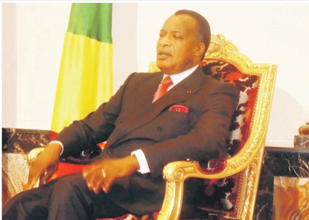
Le président Denis Sassou N'Guesso répondant aux questions de la presse

leur avenir. Ceux qui choisissent les sujets qui devaient être discutés sont libres de penser ainsi, mais on n'a jamais vu un peuple refuser le fait qu'on lui donne l'exercice de son propre pouvoir. J'invite tous les acteurs politiques et sociaux à ces discussions qui sont ouvertes et libres », a déclaré le président de la République. Page 3