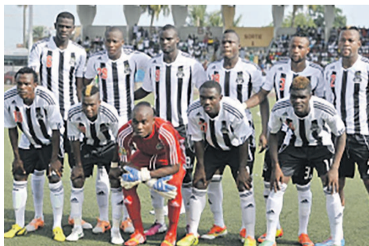
Le TP Mazembe de Lubumbashi

Après le résultat d'égalité de zéro but partout contre Al Hilal du Soudan, Mazembe se rend à Tétouan au Maroc, en quête des trois points de la victoire, avant de prendre la direction d'Alexandrie en Egypte, pour affronter Smouha SC.