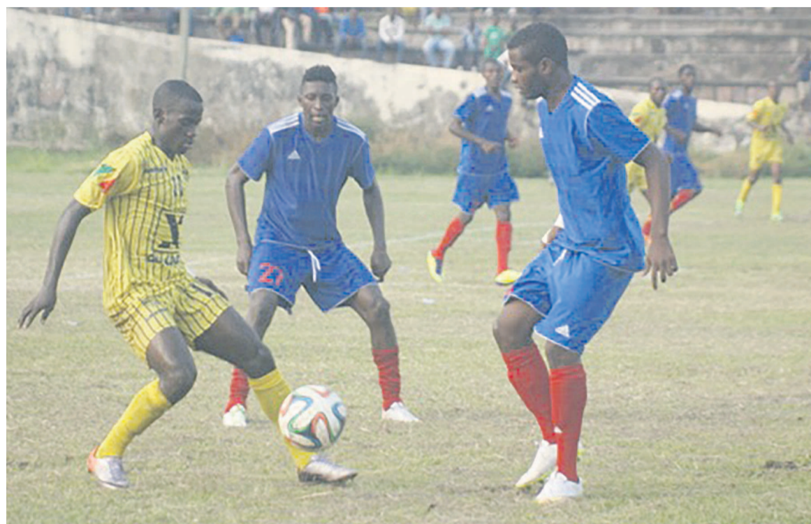
Un match du championnat national

pas le bruit. La bonne nouvelle serait que le ballon roule à nouveau et très vite dans les différents stades d'autant plus que le football congolais est engagé dans plusieurs tableaux. Les équipes nationales disputent les éliminatoires de la CAN 2017 et CAN U-23 sans oublier les Jeux africains. LAC Léopards lui aussi profiterait des matches du