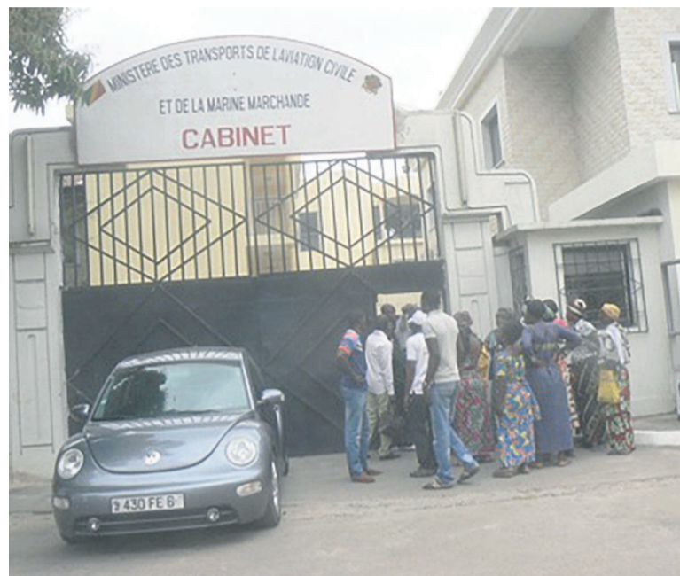
Pied de grues des victimes au ministère

Des victimes de l'accident du Cargo Ek-76300 appartenant à la société Aéro service, survenu le 30 novembre 2012 en plein quartier Makazou à Brazzaville, ont observé, le 09 juillet à Brazzaville, un sit-in à la devanture du ministère des Transports, de l'aviation civile et de la marine marchande pour réclamer de l'Etat, leur indemnisation.