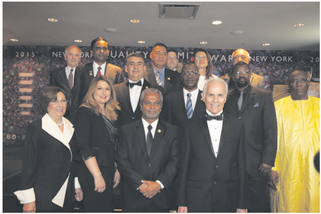
Le Président de BID avec les membres de quelques sociétés lauréates