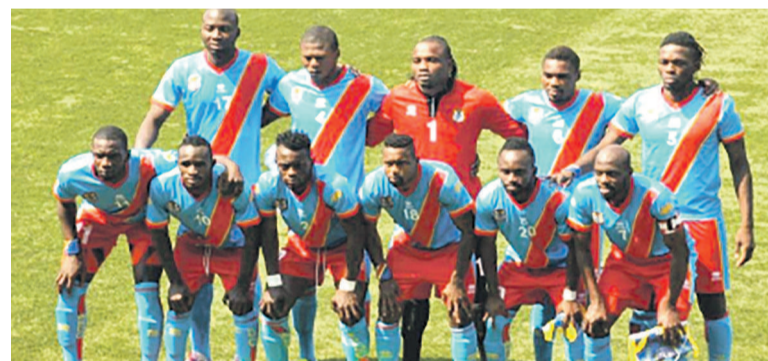
Les Léopards de la RDC

La RDC a perdu quatre cases au classement de la Fédération internationale de football association (Fifa) pour le mois de juillet 2015. La dernière actualisation de ce classement mensuel de l'instance mondiale du sport-roi a été rendue publique le jeudi 9 juillet 2015 à Zurich en Suisse, où se trouve le siège de la Fifa.