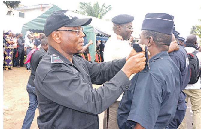
Les anciens portant les grades aux nouveaux promus

les sept districts du Kouilou et les six arrondissements de Pointe-Noire. Les accidents de circulation ont considérablement baissé grâce au renforcement des effectifs des unités de circulation routière », a déclaré le directeur départemental qui est encore revenu sur la poursuite de l'opération de police