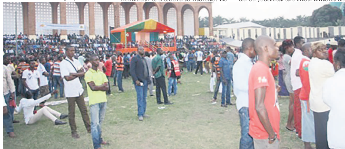
L'ambiance peu avant l'ouverture de la 10 e édition du Fespam

Les lauréats du grand prix des arts et des lettres édition 2014 décorés par le chef de l'Etat. Le poète Gabriel Okoundji et le dramaturge Dieudonné Niangouna lauréats du grand Prix des arts et des lettres du président de la République édition 2014 ont été distingués au cours de cette cérémonie d'ouverture. Ce signe de reconnaissance a été réinstauré en 2013, il sert à accompagner d'une façon efficace la créativité artistique du Congo. Son attribution remonte depuis Taty Loutard, Sony Labou Tansi, Gotene qui ont été parmi les pre-