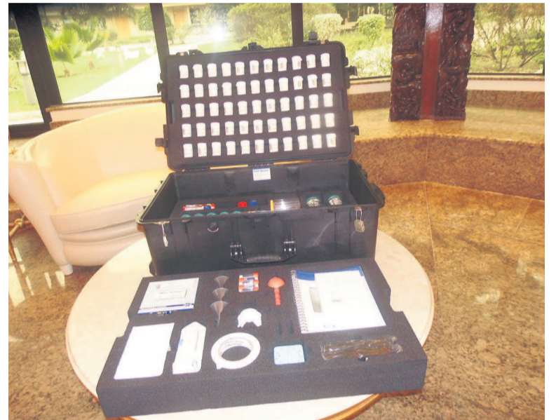
Une vue de l'appareil

Au Congo, lors de l'opération Mpili lancée en 2013, les services de police avaient saisi 35 tonnes de faux médicaments à