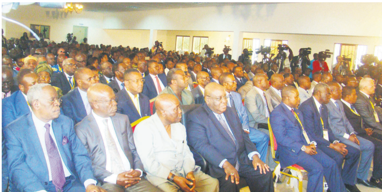
Cérémonie de clôture du Dialogue national, le 17 juillet à Sibiti

Les participants au dialogue national inclusif, organisé du 13 au 17 juillet à Sibiti, dans le département de la Lékoumou, ont unanimement balisé le chemin de l'amélioration de la gouvernance électorale au Congo. Cependant, même si leur écrasante majorité a souhaité une réforme des institutions de la République au moyen d'un changement de l'actuelle Constitution, la volonté de prendre en compte les opinions divergentes exprimées lors de ces débats, les a obligés de s'en remettre au chef de l'État.