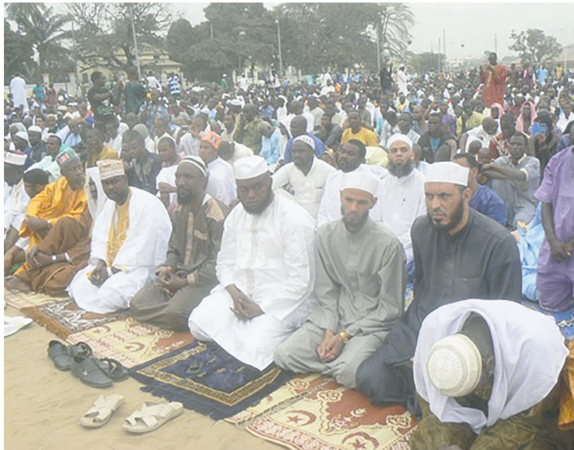
La séance de prière

Et, bien après la rupture du ramadan, un repas de l'iftar, qui marque la rupture quoti-