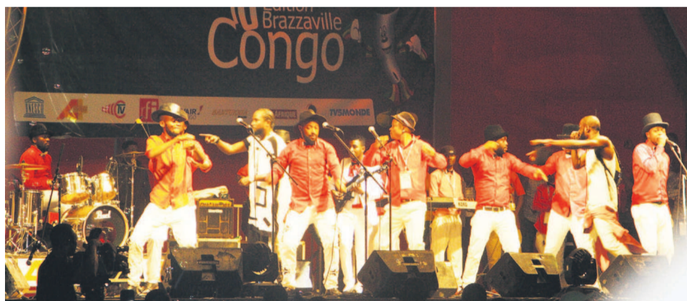
L'un des show à la cérémonie d'ouverture du Fespam

Tel est le souhait formulé par le président de la République, Denis Sassou N'Guesso, à l'ouverture, samedi, de la 10 e édition du Festival panafricain de la musique (Fespam) qui se tient sur le thème : « Le dynamisme des musiques africaines dans la diversité des expressions culturelles ». Pays à l'honneur de cette édition jubilaire : Cuba, avec son mythique groupe Aragon, a ouvert le bal des spectacles avant de voir se succéder sur le podium plusieurs autres artistes et groupes au grand bonheur d'un public que l'on sait exigeant à l'égard de cet art populaire qu'est la musique.