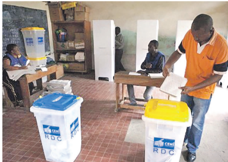
Ambiance dans un bureau de vote

Rappelons que le fichier électoral actualisé contient 30.682.599 électeurs. Pour l'opposition,