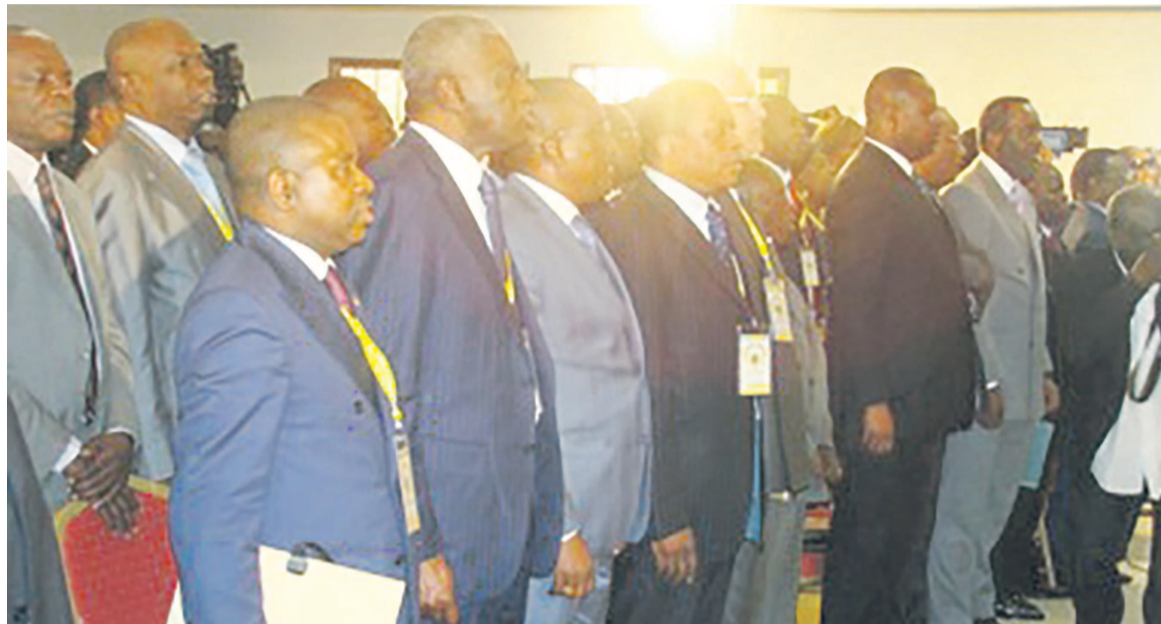
Les participants chantant l'hymne national

», leurs adversaires, défenseurs du statu quo se sont eux aussi satisfaits, quoi que minoritaires,