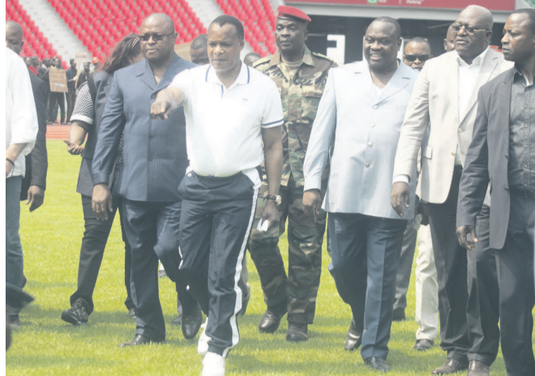
Denis Sassou N'Guesso visitant le Complexe sportif de Kintélé

continuent l'effort de reboisement. C'est ainsi qu'au Congo dans le cadre du pronar, nous avons décidé de planter pendant 10 ans, un million d'hectares de terrain supplémentaire. Le