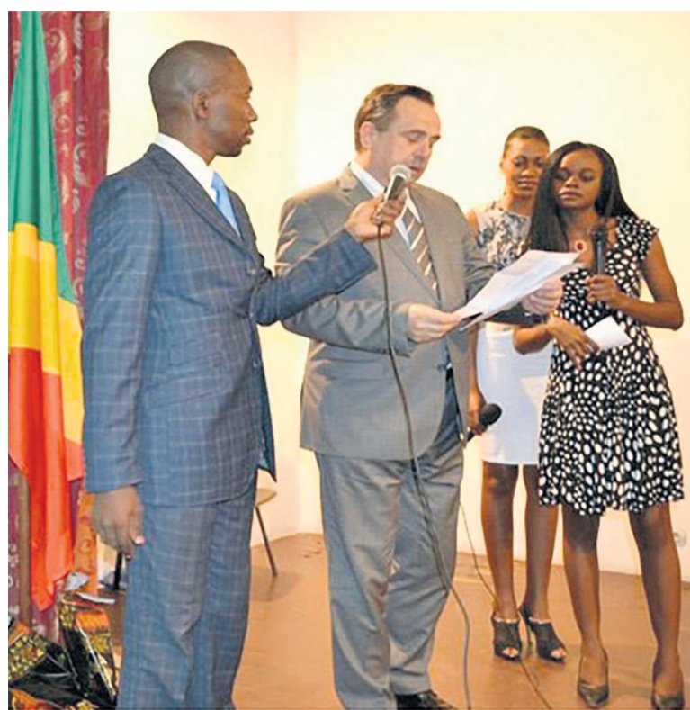
Le directeur du CCR prononçant son mot de bienvenue