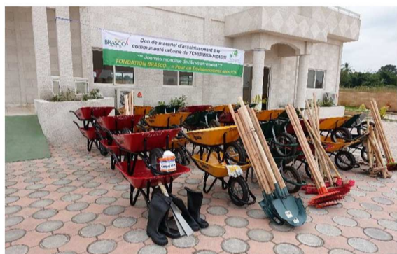
Don de la Fondation BRASCO à la communauté urbaine de Tchiamba Nzassi. Cérémonie du 3 juillet 2015.

C'est ainsi que dans le cadre du prolongement des activités de la célébration de la journée mondiale de l'Environnement, la FONDATION BRASCO a organisé dans le département de Pointe-Noire, deux importantes activités les 3 et 5 juillet dernier, pour rappeler à nous tous combien il est important de prendre soin de notre environnement et à ce titre chaque action compte.