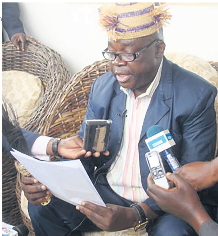
Le porte-parole des sages de Sibiti lisant la déclaration

l'Association des sages et notabilités de Sibiti. Il va de soi que cette déclaration des sages et notabilités du chef-lieu de la Lé-