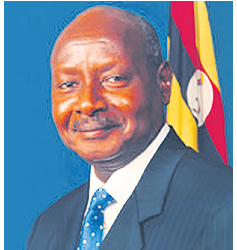
Le président Yoweri Museveni

Au pouvoir depuis 1986, le chef de l'Etat ougandais a annoncé le week-end dernier qu'il représentera son parti le National resistance movement (NRM) à la présidentielle de 2016.