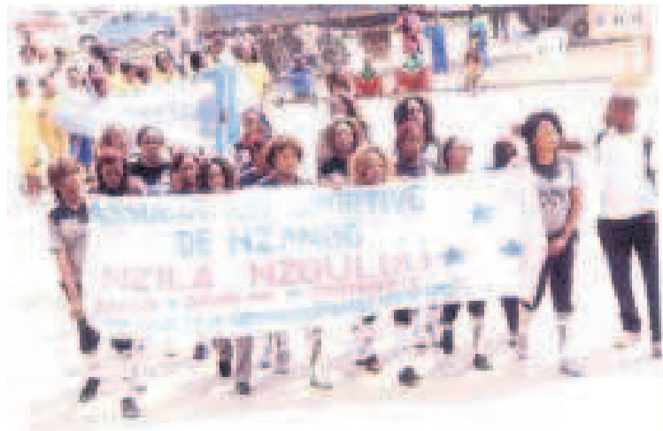
Le défilé des équipes à l'ouverture du championnat «DR»