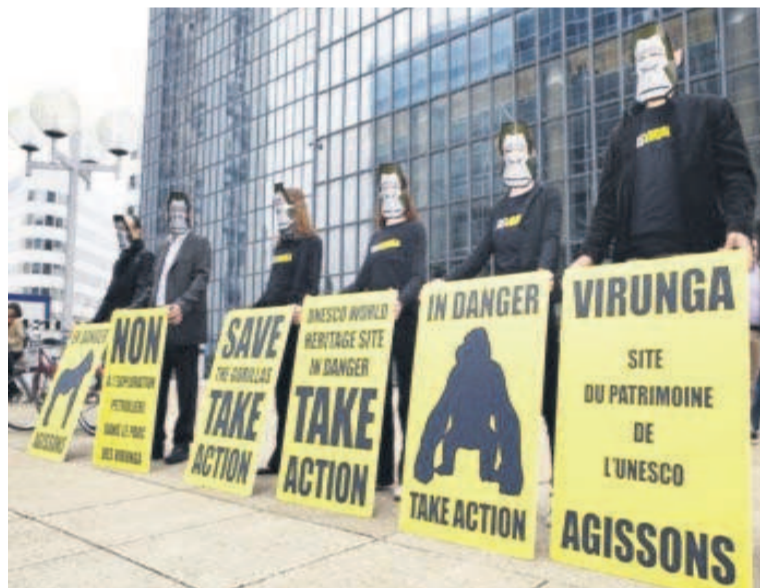
Une action menée pour la protection du parc des Virunga, en RDC.

Cette résolution de l'Assemblée générale des Nations Unies, intitulée Tackling the Illicit Trafficking in Wildlife - en français S'attaquer au trafic illicite des espèces de flore et de faune sauvages - est, a souligné WWF, une initiative du Gabon et de l'Allemagne, qui a été soutenue par plus de soixante-dix autres pays dont tous les pays de l'Afrique centrale. Il est, à en croire cette organisation, le fruit de trois années d'efforts diplomatiques à l'issue desquelles les pays ont, pour la première fois, reconnu sans exception la gravité de la criminalité liée aux espèces sauvages et le besoin urgent de joindre leurs forces pour la combattre. C'est en encouragement à ces efforts que le Fonds mondial pour la nature a salué cette initiative. Dans cette optique, le directeur du WWF en Afrique centrale, Marc Languy, a félicité le Gabon, pour avoir initié ce processus,