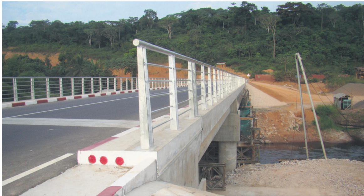
Le pont sur la rivière Liouesso (tronçon Mambili-Ouesso)

tions et le transport de l'électricité », déclarait le président de la République, Denis Sassou N'Guesso, très optimiste quant à la mise en place du programme de développement