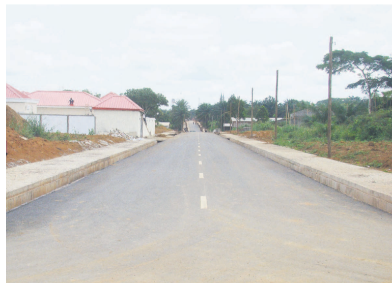
Les voiries urbaines, un volet réussi de la municipalisation de la Sangha