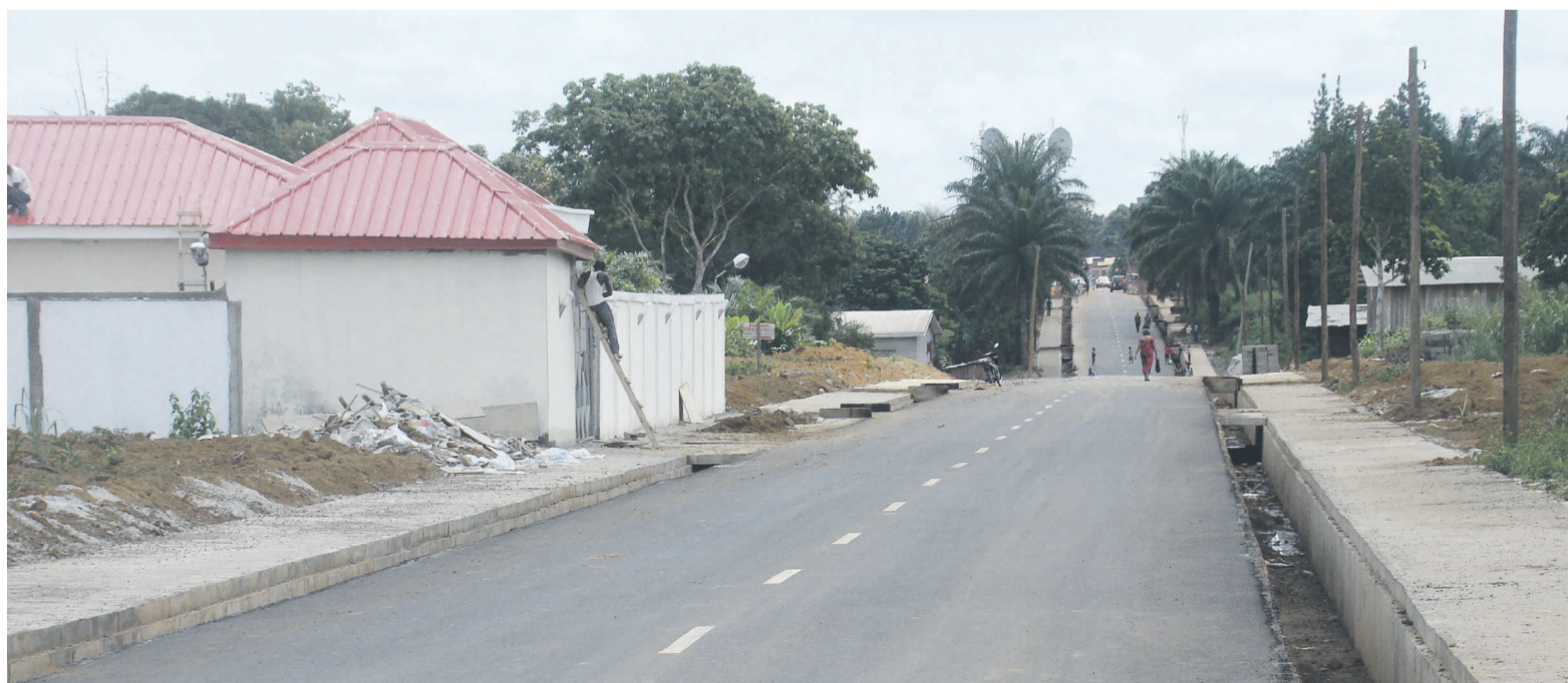
Les voiries urbaines de Ouesso font partie des rares réalisations déjà palpables de la municipalisation accélérée

Certes, l'argent n'aime pas le bruit, mais l'argent manque visiblement aux autorités locales chargées d'organiser les festivités du 15 août à Ouesso. Même si celles-ci ne veulent pas en épiloguer, le fait de constater qu'à 10 jours du 15 août, l'opération de salubrité dans la ville ne mobilisait que quelques rares volontaires en dit long sur cette précarité des moyens à la disposition des organisateurs des festivités du 55 e anniversaire de l'indépendance nationale.