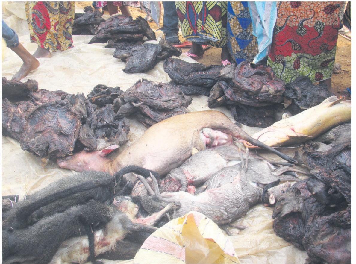
La viande de chasse de la Sangha très prisée par la population

LDB : Quel est votre message alors que le département s'apprête à accueillir les festivités du 55e anniversaire de l'indépendance nationale ?