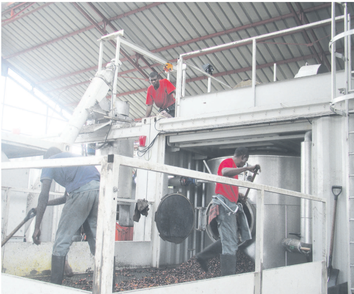
Le modular, une unité industrielle légère, permet déjà de savourer les premiers produits Eco-oil Energie