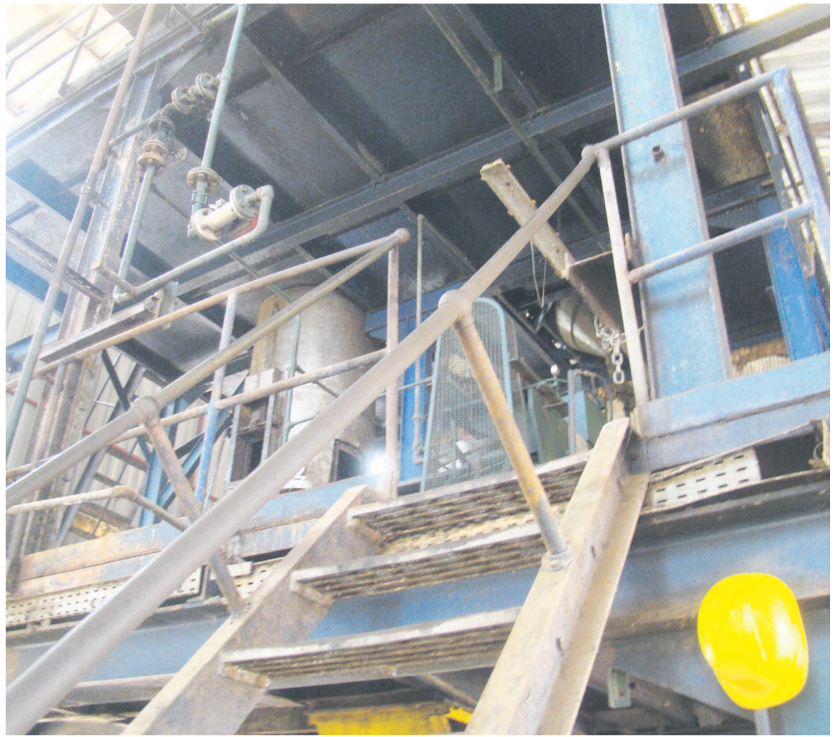
Sur l'ancien site industriel de l'huilerie de Mokeko, Eco Oil a engagé d'importants travaux de réhabilitation de l'usine

Ainsi, forte de ses palmeraies et de ses unités industrielles à Owando, Etoumbi et Mokéko (Ouessou), l'entreprise ambitionne de produire plus que les seules huiles de