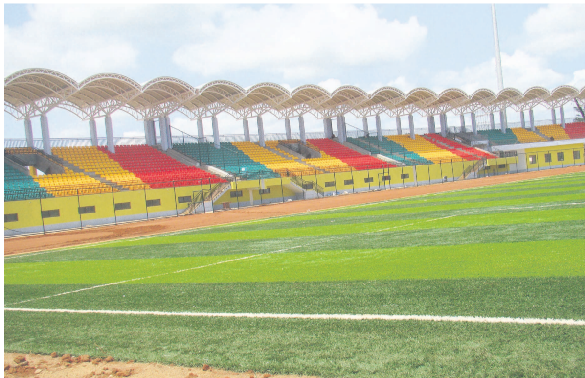
Le stade omnisport de Ouesso

Le stade omnisport de Ouesso est une réalisation impressionnante de la Municipalisation accélérée de la Sangha. Avec plus de seize mille cinq cents places et une annexe dédiée aux entraînements et compétitions de moindre envergure, il est désormais prêt à l'utilisation. Une pelouse synthétique étant déjà posée depuis quelques semaines, cette arène va abriter, ce 14 août,