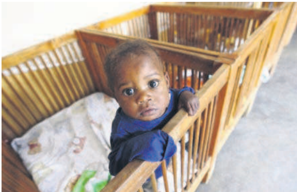
Un enfant congolais

En France, des parents membres d'un collectif regroupant une trentaine de familles adoptantes en RDC réclament le soutien du gouvernement français pour débloquent la situation de quelques 300 enfants adoptés légalement et bloqués en RDC. « C'est un drame pour les enfants et pour les parents adoptants. Ce qu'on veut, c'est obtenir le soutien des autorités, organiser un pont humanitaire pour protéger les enfants le temps que cette crise soit réglée. Nous espérons une mobilisation de la classe politique », a déclaré à l'Afp un membre du collectif sous le sceau de l'anonymat. Les membres du collectif piaffent d'impatience. Ils s'insurgent contre l'attitude du Quai d'Orsay qui refuse de les recevoir, les dirigeant plutôt vers leurs