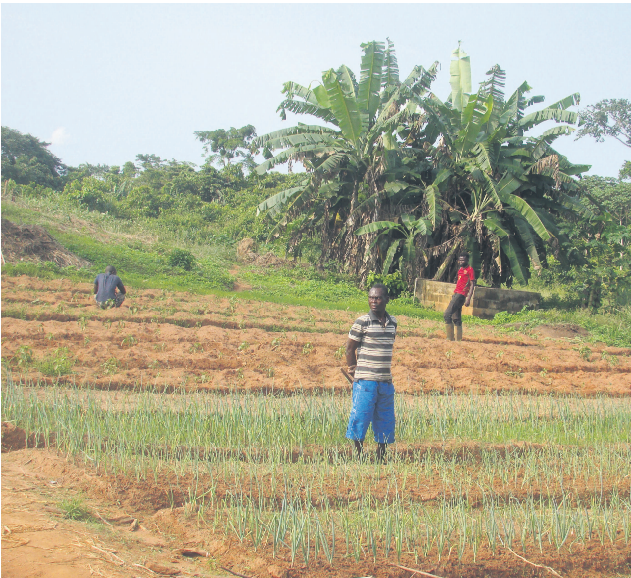
Le centre de maraichage du diocèse de Ouesso

Ce centre qui s'étend sur une superficie de 74 hectares vise, selon son promoteur, à améliorer la production dans la Sangha afin de mettre un terme aux importations dans le