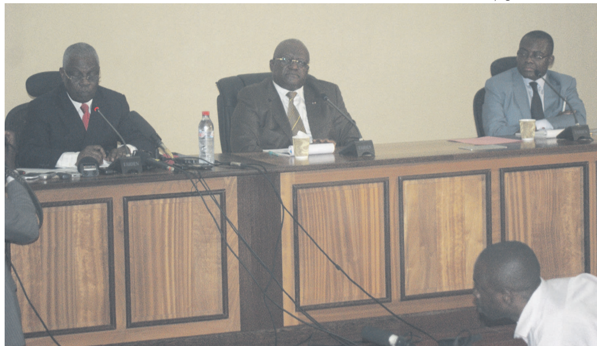
Le stade de l'Unité prêt à accueillir les Congolais et Ghanéens le 1 er septembre

publique, Denis Sassou N'Gusso. Le ministre des Sports et de l'éducation physique a confirmé la nouvelle, le 20 août, lors d'une conférence de presse à laquelle a assisté le ministre ghanéen de la Jeunesse et des