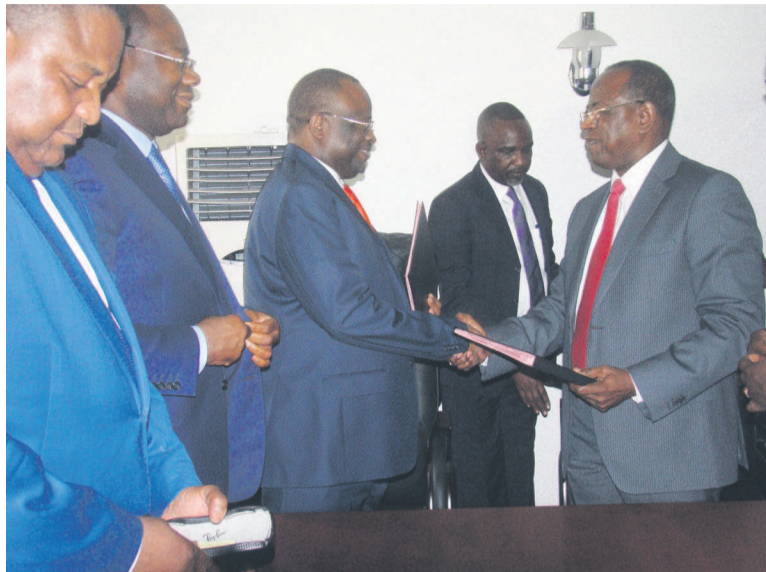
Échange des parapheurs entre les ministres de la Fonction publique entrant et sortant

À la lecture du procès-verbal, les participants ont été informés des projets en cours, initiés par le ministère, notamment ceux liés à la présidence du Comité Technique Spécialisé (CTS) n°8 de l'Union Africaine ; la création de l'Observatoire Africain de Gouvernance Territoriale et de Modernisation de l'Action Publique ; la création du Réseau des Ministres des Services Publics et de l'Administration de l'Afrique Centrale (REMISPAAC) ; le recensement et l'identification physique des agents civils de l'État ; le contrat de formation dénommé « Programme LIBOSSO » ; la révision du statut général de la Fonction publique ; l'élaboration du Répertoire interministériel des Métiers de la fonction publique (RIMEC) ; la mise en place du « Fichier unique Fonction Publique - Solde - Caisses de re-