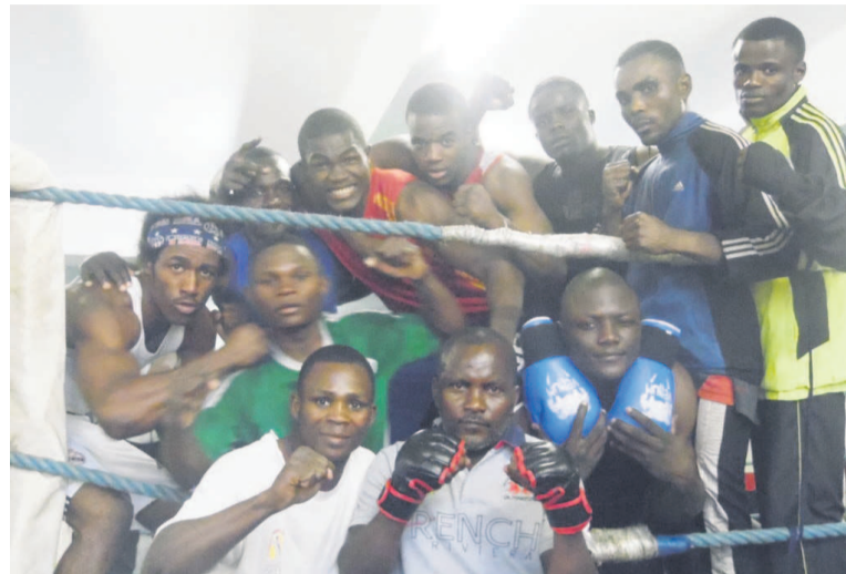
Les boxeurs congolais