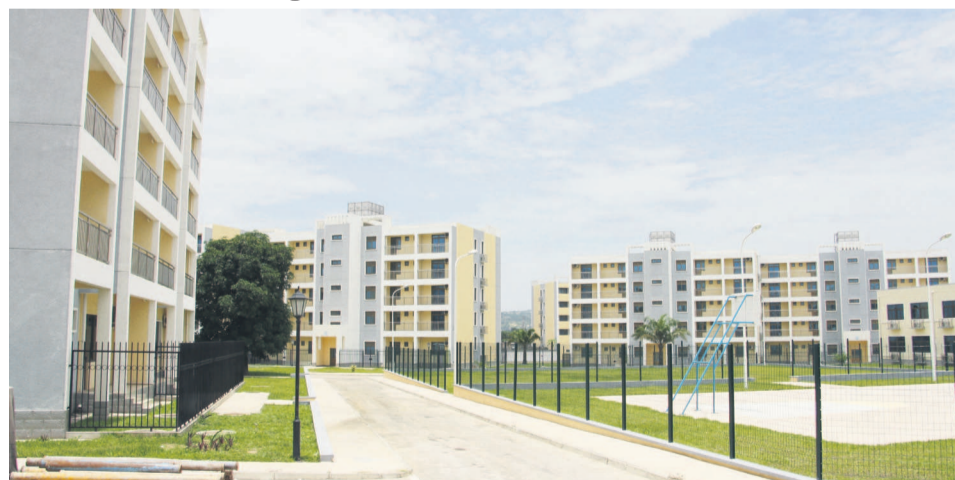
Les immeubles de Mpila

L'assemblée nationale s'est penchée, le 21 août, sur la loi portant statut de la copropriété des immeubles bâtis au Congo. Le projet de loi présenté par le ministre Claude Alphonse Nsilou était défendu à la plénière par son collègue Léon Raphaël Mokoko.