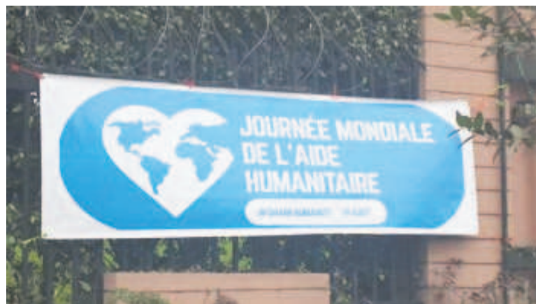
Une banderole arborée sur la clôture de l'immeuble de l'ONU, à Kinshasa.

Mais, pour la RDC, a-t-il noté, cette Journée est plus que symbolique. Elle représente, selon lui, « une réalité pour des millions de Congolais qui vivent une crise humanitaire qui n'a que trop duré et qui les prive de paix et de prospérité ». Face à une situation critique et complexe - personnes déplacées, malnutrition chronique, épidémies récurrentes, enfants déscolarisés, a-t-il souligné, des travailleurs humanitaires tant Congolais que d'ailleurs, s'efforcent de fournir chaque jour l'aide nécessaire à ces personnes affectées pour leur rendre la dignité qu'elles méritent.