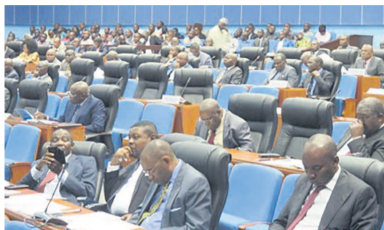
Les députés en plénière

Le projet de loi relatif au statut de la copropriété des immeubles bâtis propose un dispositif juridique permettant de gérer efficacement la vie des habitants d'un même ensemble immobilier. A ce titre, la copropriété repose sur un règlement de copropriété, un syndicat des copropriétaires, et un syndic.