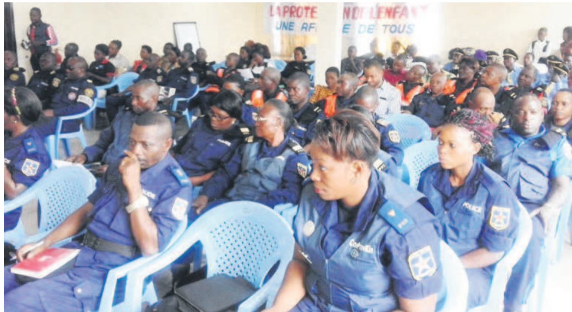
La salle lors du lancement de l'atelier

Pour le chef de département protection de l'enfant au sein de la PNC, le Colonel Néné Musavuli, cet atelier est une opportunité pour la police dont les membres ont bénéficié d'un renforcement des capacités pour mieux faire leur travail et répondre à la mission leur dévolue par la nation. Le responsable de l'Unité de gestion du projet enfant de la rue de