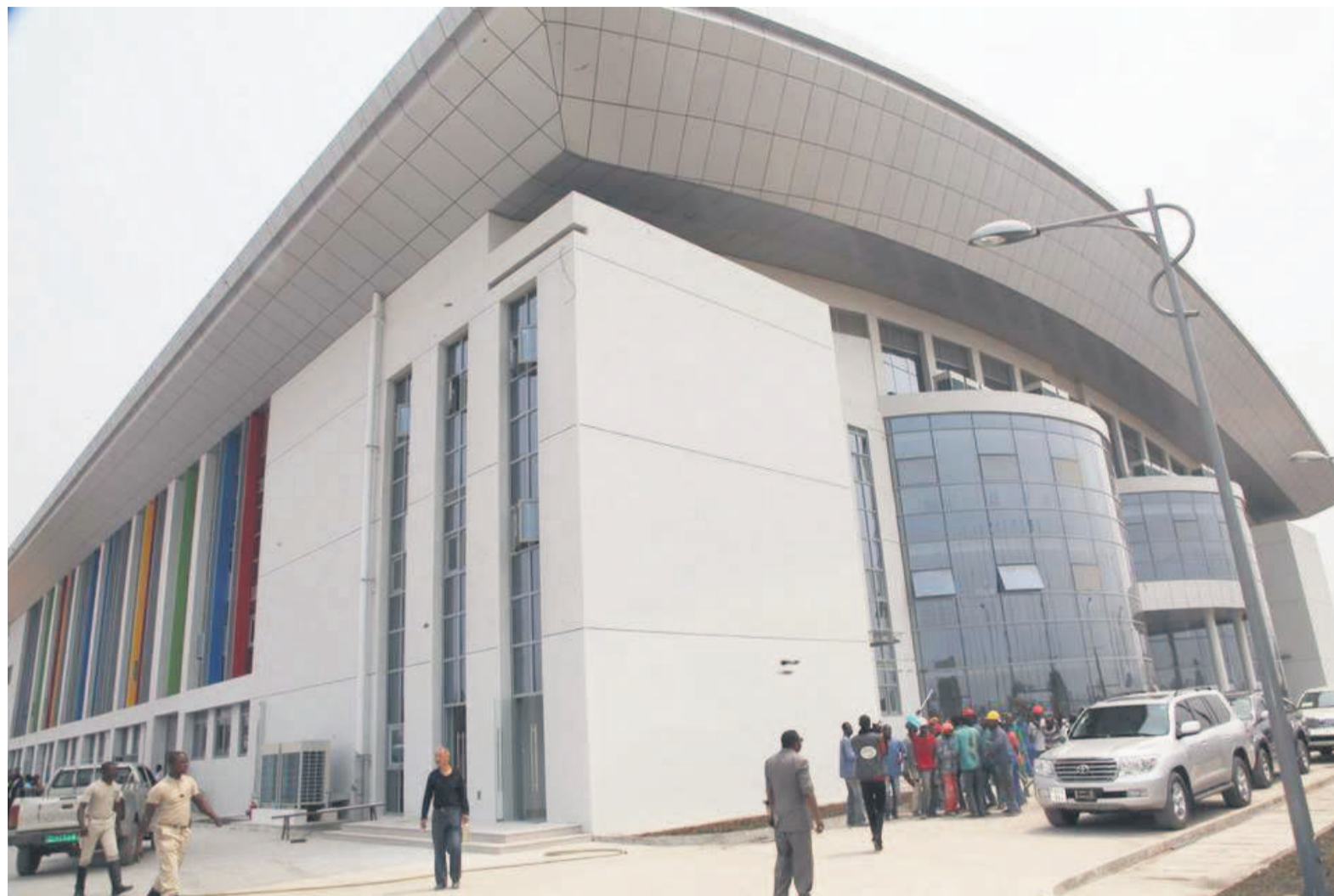
Gymnase de Talangai

Le complexe nautique de la Paix, s'élève, quant à lui, à 27 m91 de hauteur sur une surface de 12.990 m 2 . Il a une capacité de plus de 2800 places, doté d'un bassin de compétition (50x25 mx3) avec des équipements de mesures ultramodernes pouvant accueillir les épreuves de natation, walter Polo et natation synchronisée, un autre bassin d'échauffement de 50x 25x 1m5 et un plongeon de 25x25x 6 m. Ce complexe nautique dispose d'une tribune à deux niveaux pour spectateurs, VIP et mass média. On y trouve