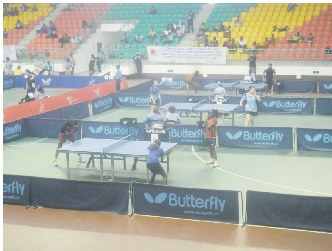
Des rencontres de tennis de table

Fédération congolaise de Péta- tanque : « Hier vous riez quand on vous disait que nous allons vous ramener la médaille du