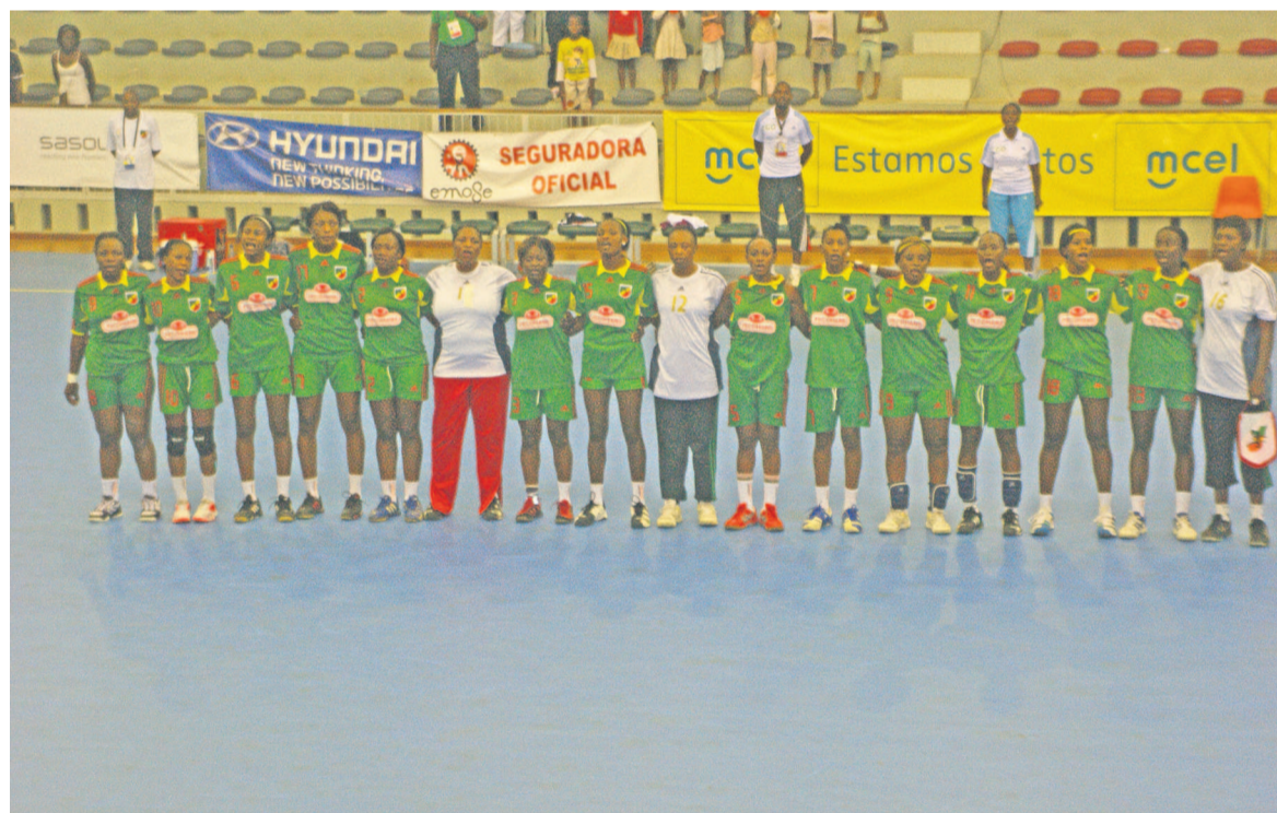
Les Diabes rouges dames chantant la congolaise

Fédération congolaise de Football : « 50 ans après les jeux africains organisés à Brazzaville, le Congo renoue avec la tradition par l'organisation