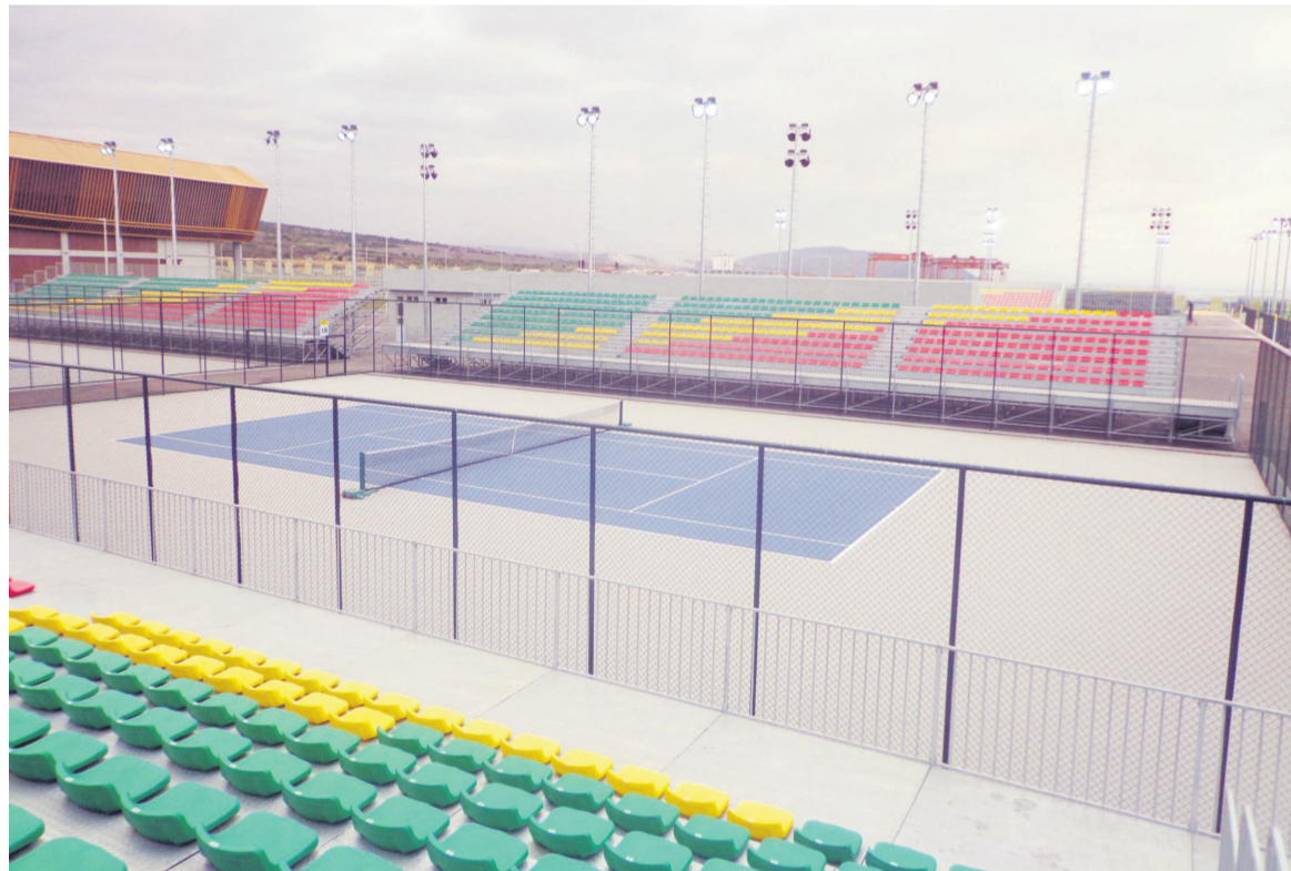
Cours de Tennis annexe

structure, nous avons 4 gymnases construits dans les différents arrondissements. Pour l'hébergement des athlètes, il y a à 3km du Complexe, l'uni-