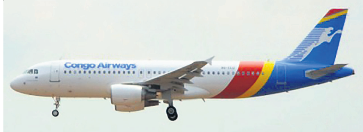
Un Airbus 320

le gouvernement « étudiait un accord entre parties qui pourrait être présenté devant le juge irlandais par les avocats des deux parties, ce qui permettrait une rapide main-