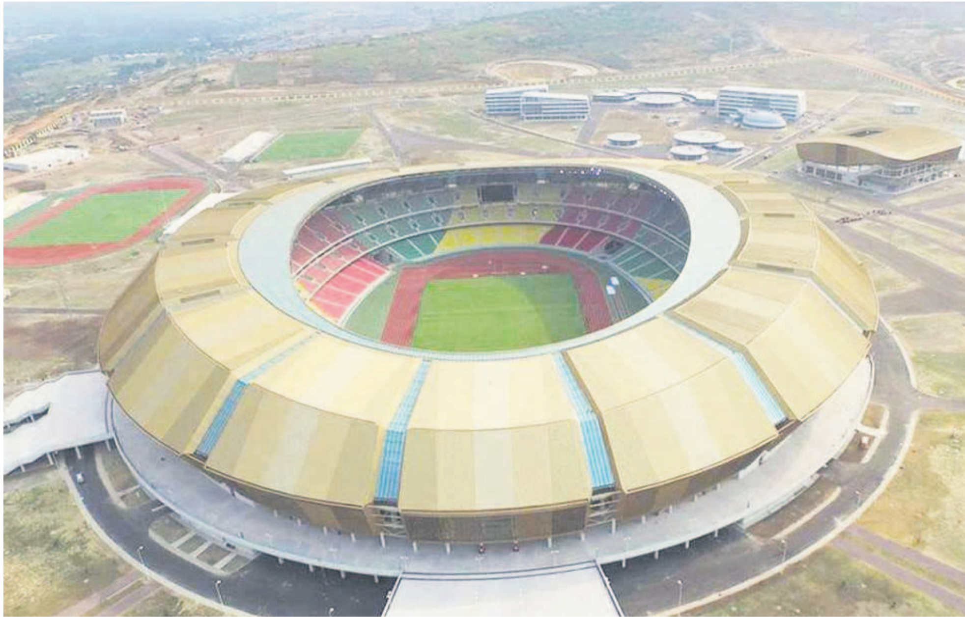
Stade de l'Unité (Kintélé)

Pour célébrer avec éclat les jeux du cinquantenaire, le gouvernement congolais n'a pas lésiné avec les moyens. Il a offert à la jeunesse sportive africaine, des installations de qualité répondant aux normes internationales. Un pari gagné.