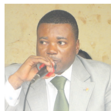
Le sénateur Gaspard Kaya-Magane délivrant son discours de circonstance

« Sans la paix, rien n'est possible. La paix doit être placée au centre de toutes nos préoccupations afin qu'elle devienne une