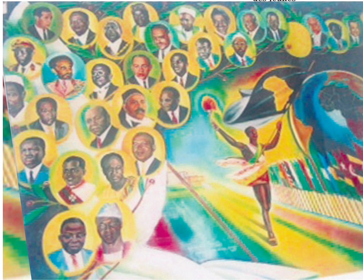
Une fresque des pairs fondateurs de l'OUA au siège de l'Union africaine à Addis Abeba en Éthiopie

Les Jeux Africains sont d'abord un message de lutte de libération de l'Afrique, un message du panafricanisme. En 1965, le Congo a organisé les premiers Jeux Africains presque les mains nues, nous n'avions pas beaucoup de ressources. Mais à cette occasion, le peuple congolais s'était mobilisé pour réaliser les quelques infrastructures qui sont encore viables, notamment le stade Alphonse Massamba Débat. Il y avait quelques ressources en-