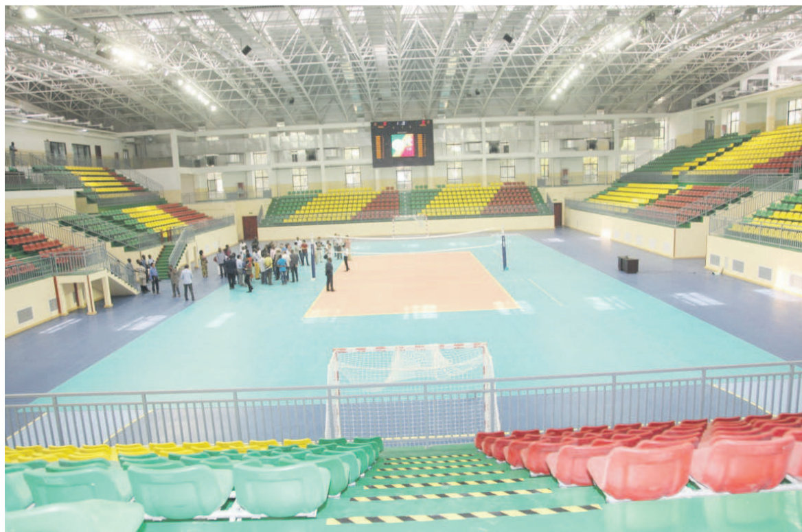
Le gymnase du stade Alphonse Débat

et de la sensibilisation, nous avons consolidé l'appel lancé par le président de la République en réalisant notamment des descentes dans différents quartiers. La jeunesse congolaise va se mobiliser non seulement pour accueillir des invités qui vont arriver mais aussi en remplissant les gradins des stades et gymnases pendant les rencontres de sorte à donner une bonne image de notre pays.