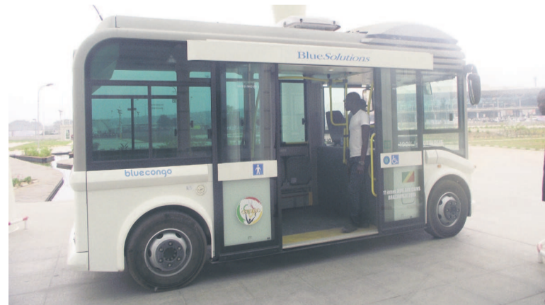
Bus 100% électrique

« Depuis que nous avons ce bus, ça se passe bien. On a fait quelques transferts, notamment de l'hôtel à l'aéroport et de l'aéroport à l'hôtel et les commentaires de nos clients ont été positifs. Quand nous sommes arrivés pour la première fois à l'aéroport, pleins de gens sont sortis et ont pris leurs téléphones portables pour le filmer, vu qu'ils n'ont jamais vu ça », explique-t-il, reconnaissant les avantages sur le plan environnemental. En effet, ce bus dispose d'une batterie électrique qui a une capacité de 250 km et effectue la distance