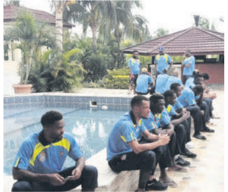
Les Léopards au Centre technique Kurara Mpova de la Fécofa

La rencontre de la deuxième journée des éliminatoires de la Coupe d'Afrique des Nations (CAN) Gabon 2017, le 5 septembre au stade Barthélemy-Boganda de Bangui, entre les Fauves du Bas-Oubangui de la République centrafricaine et les Léopards de la RDC focalise déjà l'attention de l'opinion sportive nationale.