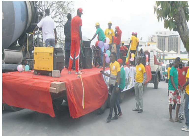
L'orchestre Pape God en pleine animation

« Nous demandons aux Brazzavillois de participer massivement et de réserver un accueil chaleureux à nos hôtes. Nous organisons ce carnaval pour anticiper sur l'ambiance qui va prévaloir le jour J. Que les Congolais s'imprègnent et mettent en avant