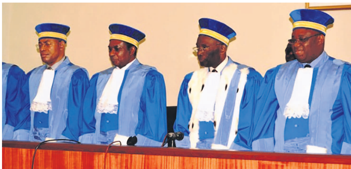
Des haut magistrats de la Cour constitutionnelle

Dans son arrêt rendu public le 8 septembre, la Haute Cour demande à l'exécutif national de prendre des « dispositions transitoires exceptionnelles » pour éviter le désordre dans la gestion des nouvelles provinces démembrées. La Cour a enjoint également le gouvernement « d'accélérer l'installation des bureaux définitifs des assemblées provinciales des nouvelles provinces et de doter la Céni des moyens nécessaires pour l'organisation