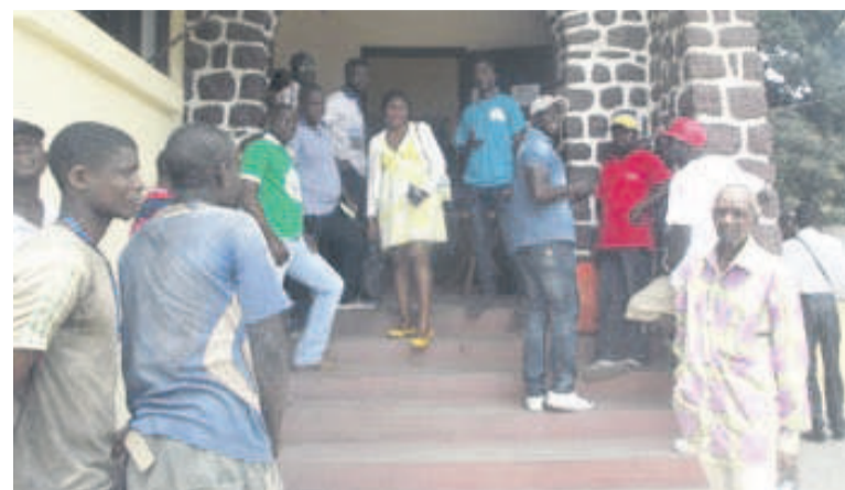
Des Centrafricains faisant la queue devant le bureau de recensement -

Ouvert du 8 au 15 septembre, l'enrôlement sur la liste électorale vise l'ensemble de la communauté centrafricaine y compris les réfugiés et demandeurs d'asile.