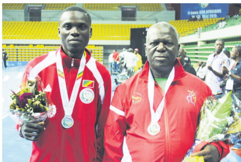
Chabrol Bingouila et son entraîneur posent pour la photo de famille aux côtés de Claude Azema, le président de la Fédération internationale de boules