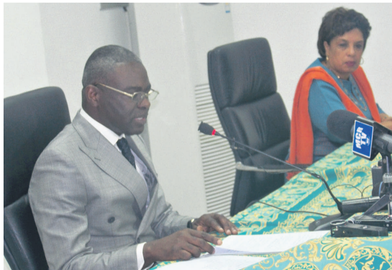
Le ministre Anatole Collinet Makosso

L'humanité a célébré le 8 septembre la Journée internationale de l'alphabétisation sur le thème « Alphabétisation et sociétés durables. » Dans le message du gouvernement, à l'occasion de cette 49 e Journée, couplée avec le lancement de la Semaine nationale de l'alphabétisation (SNA), le ministre de l'Enseignement primaire et secondaire a exhorté les apprenants à fréquenter les centres de rescolarisation.