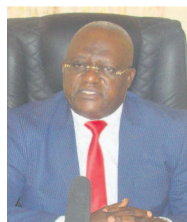
Le ministre des Sports faisant le point de la participation des Congolais en six jours de compétition