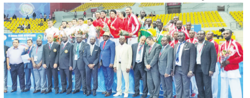
Les Congolais sur la troisième marche du podium