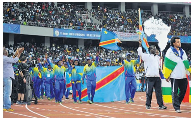
Logo des onzièmes Jeux africains de Brazzaville

Cependant, bien avant la traversée, le ministre des Sports, Sama Lukonde Kyenge, a, au cours d'une cérémonie solennelle à Kinshasa, remis officiellement l'étendard national aux athlètes. C'était en présence des officiels du Comité olympique congolais, des dirigeants et athlètes des disciplines participantes aux Jeux. On rappelle que la RDC prend part à cette compétition sportive africaine avec quasiment deux cents athlètes de quinze disciplines sportives. Et déjà les premiers résultats, négatifs,