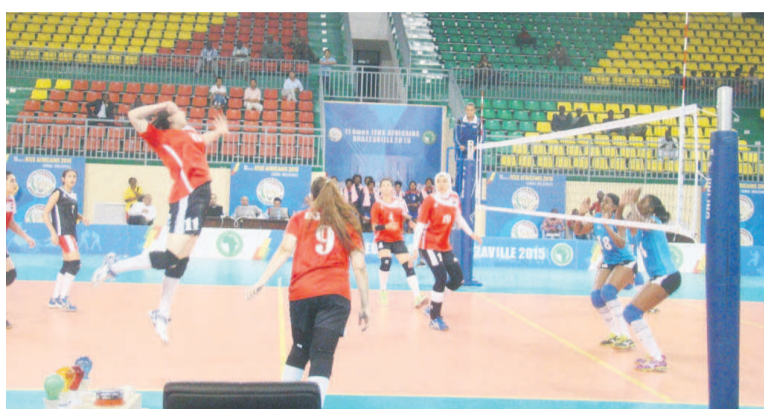
Les Égyptiennes déjà qualifiées avec quatre victoires/crédit photo Adiac.

Les volleyeuses congolaises ne cessent de briller par des contre-performances même dans les matchs qui sont visiblement à leur portée. Après les trois défaites consécutives devant le Ghana (0 set à 3), l'Égypte et le Botswana par le même résultat, les Diables rouges dames ont à nouveau courbé l'échine face aux Seychelles. Sur l'aire de jeu, elles ont montré qu'elles n'ont pas le niveau qu'il faut pour cette compétition, d'autant plus que sur l'ensemble de leurs matchs, elles