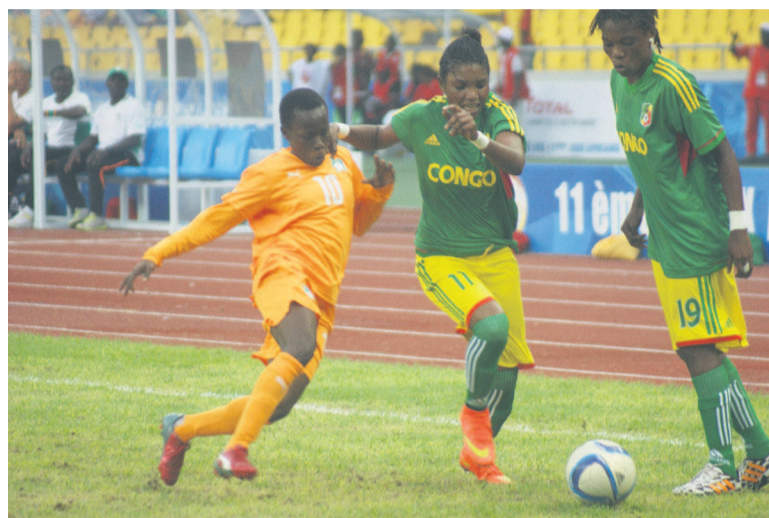
Une séquence du match Congo-Côte d'Ivoire

Grâce à cette victoire, la Côte d'Ivoire rejoint le Nigeria en de-