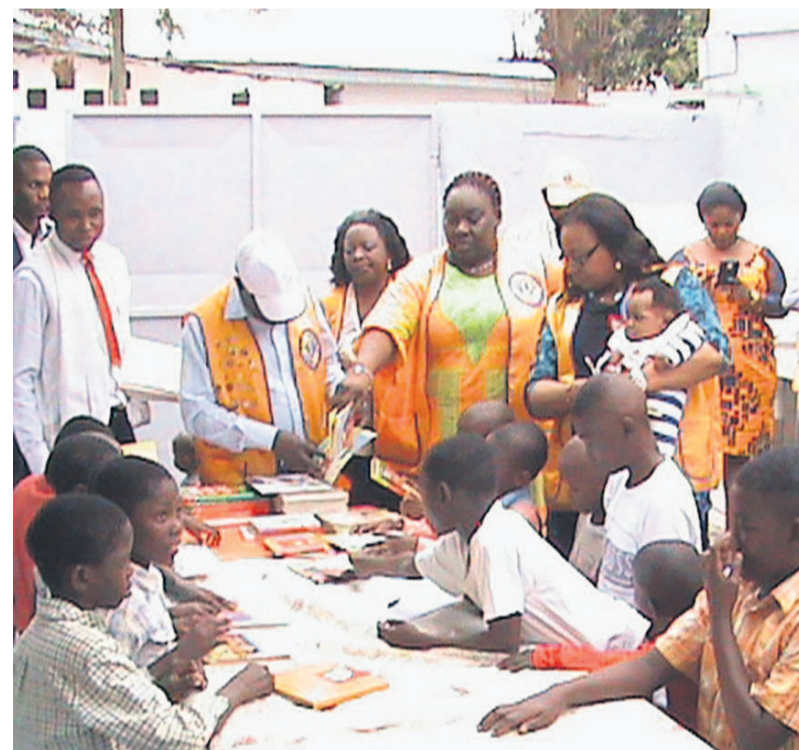
Séance de lecture avec les enfants

sur dix ans, en faveur de la lecture qui, a-t-elle dit, « appelle chaque Lions Clubs du monde entier à se mobiliser pour organiser des projets et des activités d'œuvres sociales dans le but de souligner combien il est