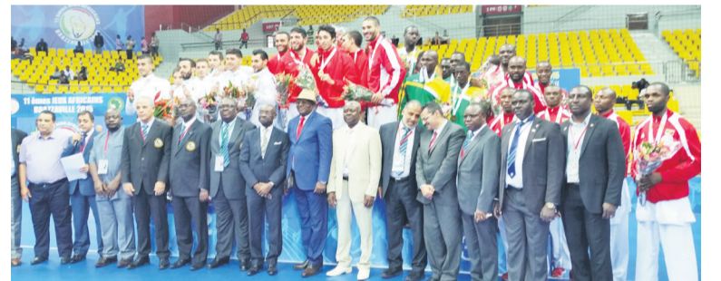
Les Congolais sur la troisième marche du podium

par une défaite 2-3 face à l'Algérie composée d'Achache, Anis Samy, Benathmane, Benkhaled, Cherk, Hamadini et Hassan. Cette équipe ayant atteint la finale, le Congo a été repêché. Lors de cette seconde chance, les Diables rouges ont domi-