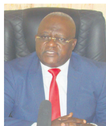
Le ministre des Sports faisant le point de la participation des Congolais en six jours de compétition