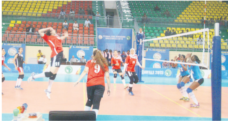
Les Égyptiennes déjà qualifiées avec quatre victoires/crédit photo Adiac.

Les volleyeuses congolaises ne cessent de briller par des contre-performances même dans les matchs qui sont visiblement à leur portée. Après les trois défaites consécutives devant le Ghana (0 set à 3), l'Égypte et le Botswana par le même résultat, les Diables rouges dames ont à nouveau courbé l'échine face aux Seychelles. Sur l'aire de jeu, elles ont montré qu'elles n'ont pas le niveau qu'il faut pour cette compétition, d'autant plus que sur l'ensemble de leurs matchs, elles