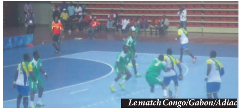
Le match Congo/Gabon/Adiac

Après les dames le 16 septembre, les quarts de finale messieurs du tournoi de handball des 11es Jeux africains se sont disputés le 17 septembre au Palais des sports de Kintélé. L'Angola a battu la Libye, 30-18, le Nigeria a eu raison du Sénégal, 29-18, l'Égypte s'est imposée face à la Côte d'Ivoire, 27-17, et le Congo a défait le Gabon, 25-24.