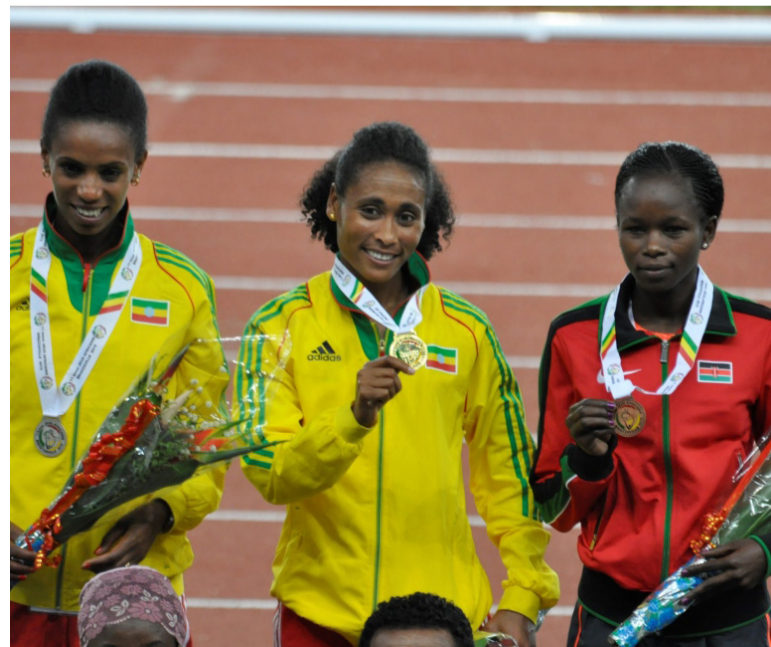
Double éthiopien sur le 3000 steeple féminin

Dans la lutte qui fait rage entre le Kenya et l'Ethiopie, cette der-