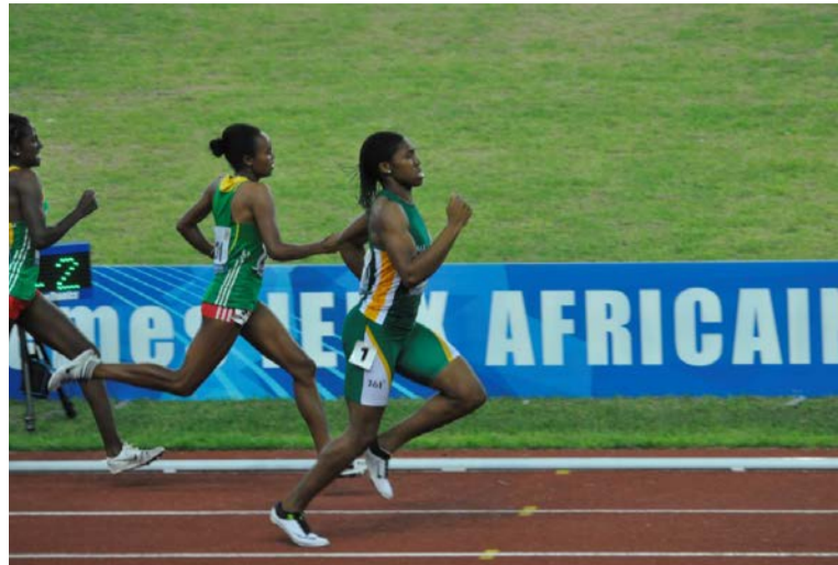
Menée à l'entame de la dernière ligne droite, la Sud-africaine Caster Semenya a déposé ses adversaires éthiopiennes au sprint Longtemps dominée par les Ethiopiennes Annet Mwanzi et Chaltu Shume, la Sud-africaine Caster Semenya a finalement remporté la médaille d'or après une fin de course de folie : dans la dernière ligne droite, elle a déposé ses deux adversaires avec

une facilité déconcertante. La championne du monde 2009 du 800 mètres boucle les deux tours de pistes en 2 minutes et 97 centièmes, soit près de 5 secondes de plus que la mythique Maria Mutola, détentrice du record des Jeux en 1.56.99 (Johannesburg 1999). Les Ethiopiennes Mwanzi et Shume sont respectivement deuxième et troisième en 2.01.54 et 2.01.59 (nouveau record personnel). Eliminées lors des séries, les Congolaises Leo Bafoundissa Missamou et Elizabeth Nabiala Nkengue ont couru en 2 minutes 12 secondes 53 pour la première et 2 minutes, 19 secondes 87 pour la seconde. Et se classent respectivement 15e et 18e sur 20 participantes.