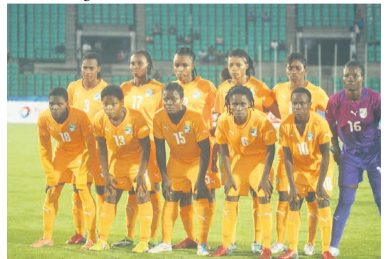
La Côte d'Ivoire médaillée de Bronze des 11èmes Jeux africains

La Côte d'Ivoire termine la compétition au podium après sa victoire 2-1 face au Nigeria.