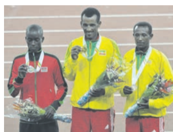
Les Ethiopiens ont pris deux médailles sur trois sur le 10.000 mètres masculin, marquant un coup important dans le rivalité avec le Kenya