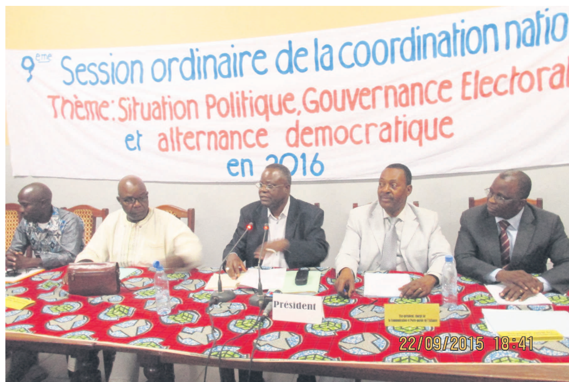
Vue du présidium lors de la cérémonie de clôture de la neuvième session de la coordination nationale de l'ARD

Après examen de la situation politique actuelle, l'Alliance pour la République et la démocratie (ARD), que préside Mathias Ndzonga, au cours de la neuvième session ordinaire de la coordination nationale, tenue le 22 septembre à Brazzaville, désapprouvé la procédure de révision des listes électorales.