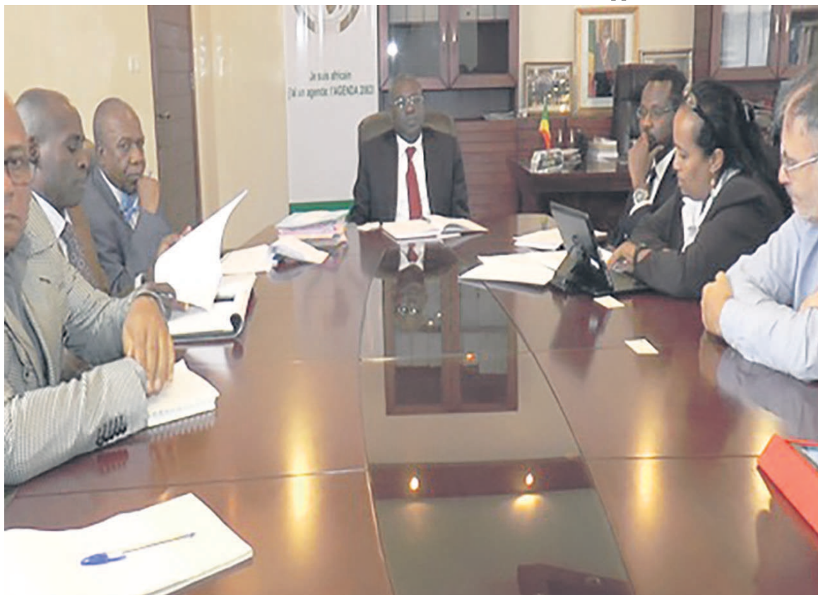
Le ministre Anatole Collinet Makosso s'entretenant avec la délégation de la banque mondiale

En outre, le ministre a abordé avec la délégation de la Banque mondiale (BM), les priorités