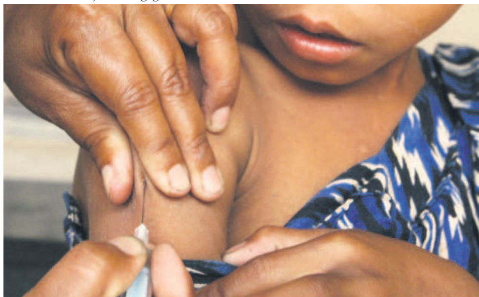
Le nouveau vaccin inactivé contre la polio est injectable

vaccination demeure la seule arme pour lutter contre la polio, d'autant plus qu'il n'y a pas un traitement curatif et, en plus de cela, un enfant non vacciné est exposé à la paralysie flasque des membres inférieurs. Des affiches sur la vaccination sont apposées sur des véhicules décorés de la Division provinciale de la santé. La stratégie arrêtée pour cette campagne est celle dite de porte-à-porte pour atteindre tous les enfants même dans les coins d'accès difficile.