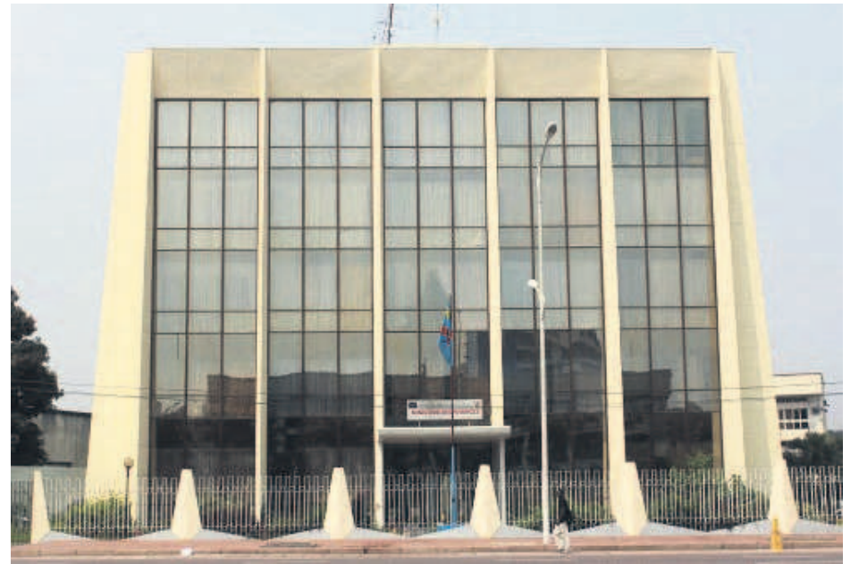
Le siège du ministère des Finances à Kinshasa

Au regard des résultats moyens réalisés sur le terrain, soit la bonne évolution de sept indicateurs sur 14, le gouvernement et la Banque mondiale (BM) ont convenu de prolonger pour une durée d'une année la Stratégie d'assistance pays pour la RDC. Ce 23 septembre, les deux partenaires se sont retrouvés pour une revue à mi-parcours. Cette séance de consultation a abouti à d'importantes recommandations, notamment une convergence de vues sur la nécessité de renforcer les piliers de la réduction de la pauvreté et de la prospérité partagée. Le portefeuille de la BM en RDC est de 2,3 milliards de dollars et comprend 26 projets actifs. L'institution financière internationale fournit également une assistance technique et des études sectorielles. Ces projets ont permis de récolter quelques résultats dans les secteurs de l'éducation, des infrastructures routières et de l'agriculture, quitte à les accélérer et surtout à les approfondir. Page 13