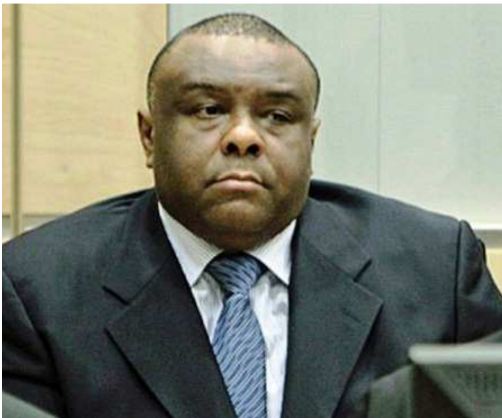
Jean-Pierre Bemba Gombo