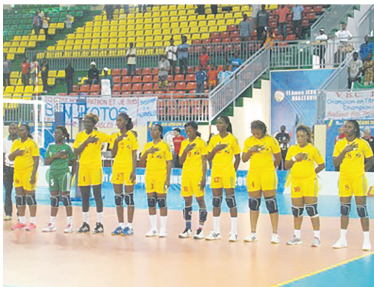
L'équipe de volleyball

De quoi remettre en question les critères de qualification de ces Diables rouges Dames en équipe nationale, de quoi se demander où sont passées les brillantes volleyeuses de la DGSP, de Kinda Odzoho, entre autres, qui ont révélé leurs ta-