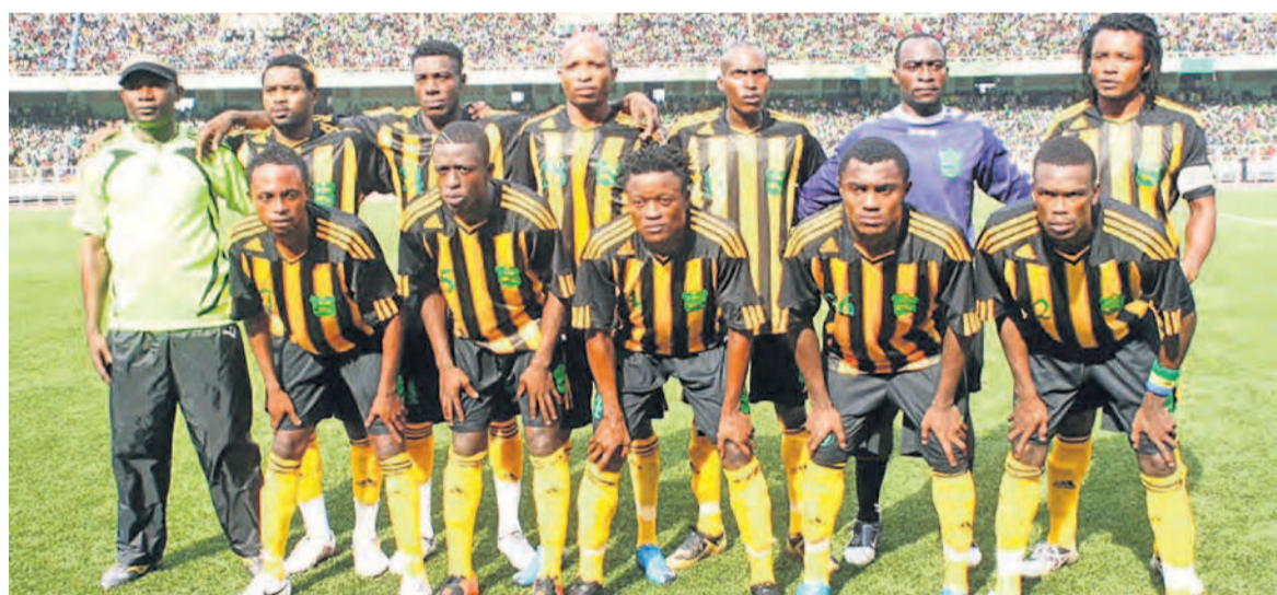
V.Club vainqueur de Dragons/Bilima

La première place de la manche aller, dans la zone de développement ouest du championnat national de football, est très disputée entre l'AS V.Club et le Daring Club Motema Pembe, les deux principaux clubs rivaux de Kinshasa. Les Dauphins Noirs ont momentanément repris la tête après leur victoire sur les Monstres de Dragons/Bilima en 9e journée.