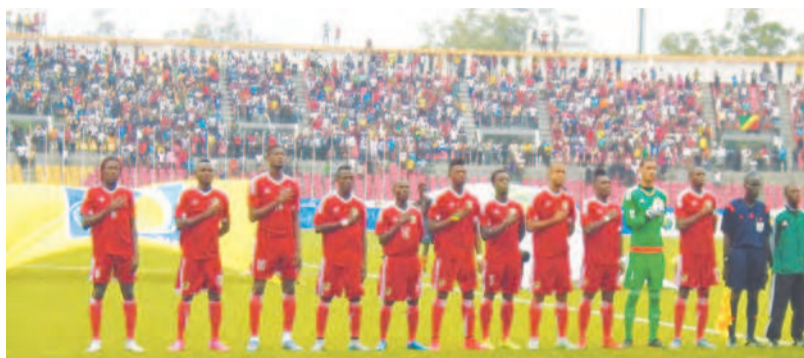
Les Diabes rouges

Sur le chemin menant vers l'intégration des groupes des éliminatoires de la prochaine Coupe du monde, le Congo croise sur son chemin l'Ethiopie. Le match aller se disputera le 14 novembre à Addis Abéba et le retour le 17 novembre à Brazzaville, selon le programme communiqué par la Fédération internationale de football association. Le vainqueur de cette confrontation sera logé dans l'un des cinq