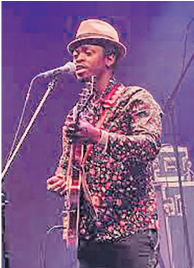
< Sans données à partir du lien >

Le 12 novembre, Yaro accueille le collectif Bayaya, un conglomérat d'auteurs compositeurs qui s'illustrent en musique urbaine notamment le hip hop. Ce groupe qui fera aussi, par la même occasion sa sortie officielle, va présenter un répertoire riche et varié où les thèmes tels que: l'espoir, l'unité, la persévérance etc, sortiront des voix