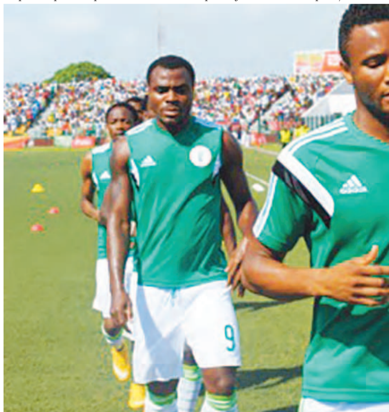
Sunday Oliseh devra faire sans Emmanuel Emenike, qui a annoncé sa retraite internationale