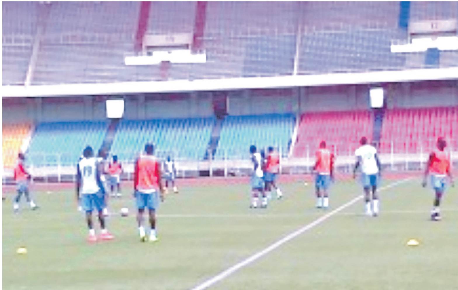
Les Léopards de la RDC à l'entraînement

Le premier chapeau se constitue de l'Algérie, du Cap-Vert, de la Côte d'Ivoire, du Ghana et du Sénégal, les cinq pays les mieux positionnés au classement Fifa publié en début novembre 2015. Ces équipes ne vont pas s'affronter et formeront les têtes de série des groupes lors des éliminatoires. Le chapeau numéro trois renferme l'Égypte, le Mali, le Nigeria, l'Ouganda et la Zambie. Enfin, le quatrième et dernier chapeau se compose de l'Afrique du Sud, du Burkina