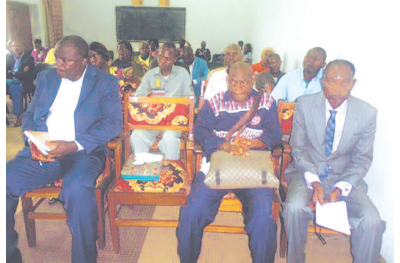
Vue des participants

Quatre départements du Congo sont concernés par ce programme à savoir : Kingoué dans la Bouenza, Kinkala 1 dans le Pool, Lekana dans les Plateaux et Ouesso-Mokeko dans la Sangha.