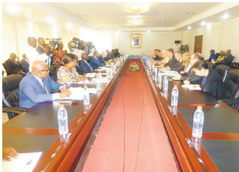
Une vue des deux délégations

Notons que la partie congolaise était représentée par les ministres des Affaires étrangères, Jean Claude Gakosso, de la Communication, Thierry Lezin Mougalla, de l'Intérieur, Raymond Zéphirin Mboulou ainsi que le président de la Commission nationale d'organisation des élections,