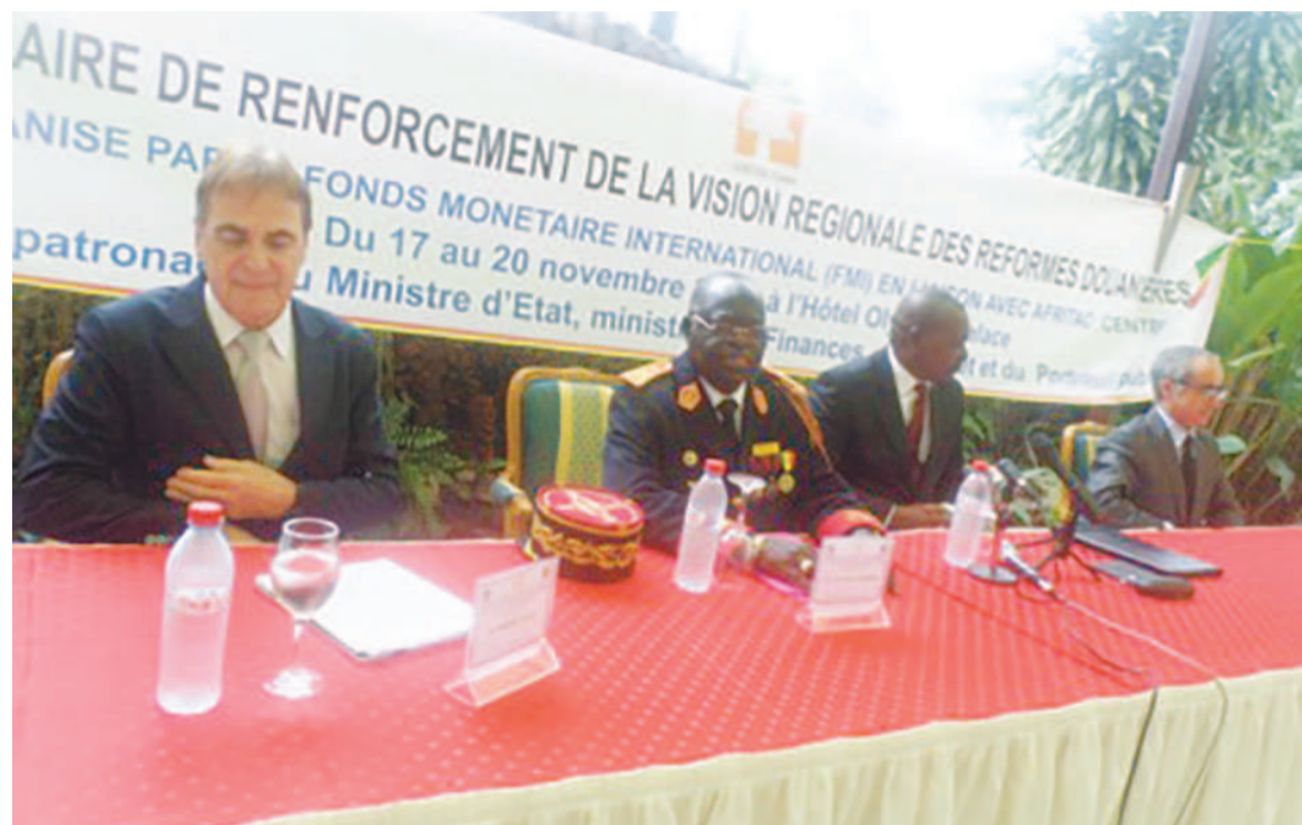
Une vue des responsables des douanes et les animateurs du séminaire à l'ouverture des travaux

C'est l'une des recommandations, parmi la kyrielle, adoptée à l'issue du séminaire de renforcement de la vision régionale des réformes douanières, tenu du 17 au 20 novembre, à Brazzaville. Cette réunion qui a regroupé les responsables des administrations des douanes de la sous-région, vise à renforcer l'efficacité des services de douanes au sein des pays de la Cemac, dans la collecte des taxes et des droits, en vue de faciliter les échanges commerciaux.