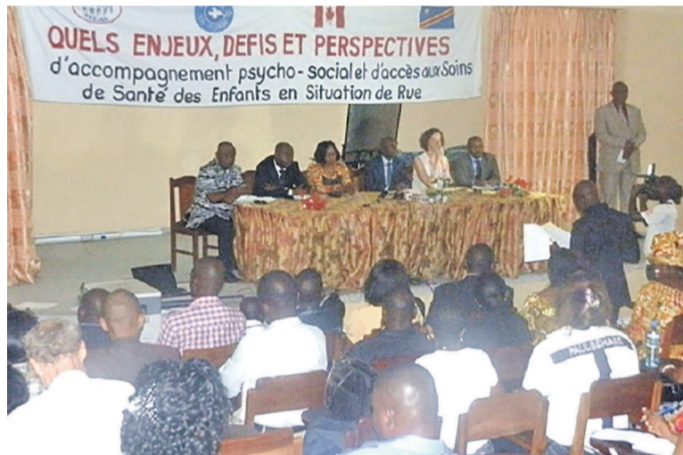
Clôture du colloque international

Dans l'objectif de poursuivre les échanges sur thème retenu, après l'identification des problèmes, les participants à ces assises de trois jours organisées par le Reejer au Centre de rééducation des handicapés physiques, à Kinshasa, ont émis plusieurs recommandations qui visent le bien-être des enfants, surtout ceux qui sont en situation de rue. Ces exhortations sont adressées à l'État congolais, à la coordination du Reejer, aux structures membres du Reejer, à la communauté et aux partenaires. Ils ont notamment exhorté l'État congolais à appliquer la loi en rapport avec la qualité des structures de prise en charge : fermeture des structures qui ne respectent pas les normes; accompagnement des structures de prise en charge des moyens conséquents pour les rendre viables et opérationnelles, de faire appliquer les normes existantes, de standardiser les modules de formation et de ren-