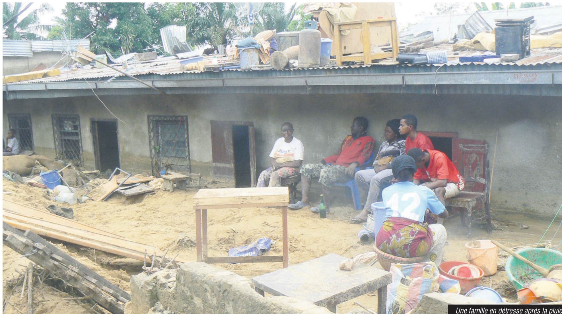
Une famille en détresse après la pluie

Dans plusieurs quartiers de la capitale congolaise, les mêmes causes ont encore produit les mêmes effets à l'issue des pluies de cette nouvelle saison. Comme ces dernières années à la même période de pluies, dans plusieurs secteurs des arrondissements 6 Talangai et 9 Djiri