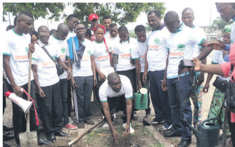
Le président met en terre un plant