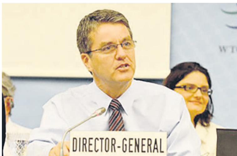
Roberto Azevêdo (DR)

Le «paquet de Bali» approuvé en 2013 en est un bon exemple. Les pays africains ont joué un rôle crucial dans les négociations ayant abouti à cet ensemble de mesures qui, nul ne s'en étonnera, a produit d'excellents résultats pour la région. On y trouve des mesures sur l'agriculture et la sécurité alimentaire, une série de décisions sur les questions relatives aux PMA (y compris sur le coton) et l'Accord sur la facilitation des échanges. Cet accord sera d'une aide considérable et il pourrait jouer un rôle important dans la facilitation de l'intégration économique en Afrique. En rationalisant et en standardisant les formalités à la frontière et les formalités douanières, l'Accord contribuera à réduire de façon spectaculaire les coûts associés aux échanges commerciaux – de plus de 16% dans les pays en développement. C'est particulièrement