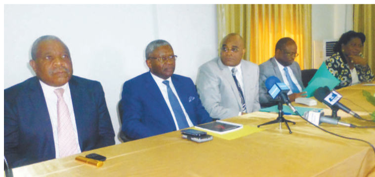
Les responsables des deux plateformes

À la faveur d'une conférence de presse animée le samedi 21 novembre à Brazzaville, les responsables de l'Initiative pour la démocratie au Congo (IDC) et ceux du Front républicain pour le respect de l'ordre constitutionnel et l'alternance démocratique (Frocad), ont affirmé que les deux plateformes de l'opposition congolaise entretiennent de bonnes relations.