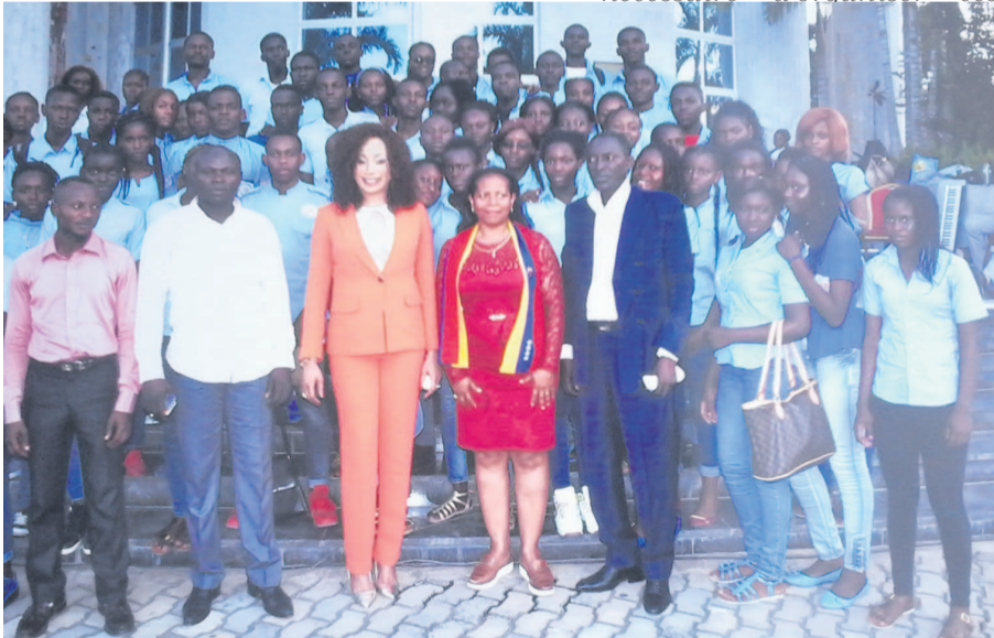
Photo de famille avec des élèves

le Venezuela, plus précisément en ce qui concerne le tourisme et la culture. « Il est très important qu'on se re-