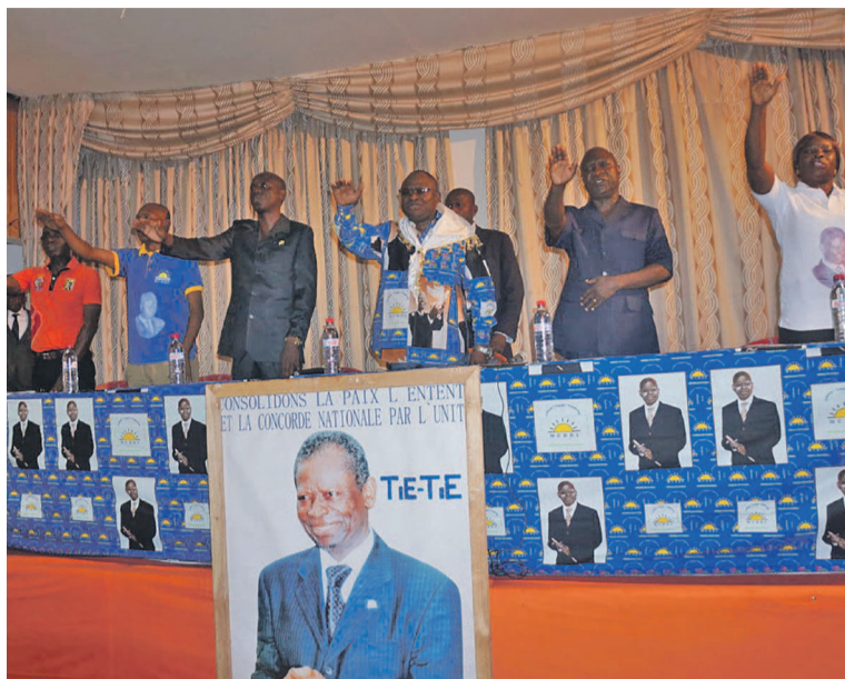
Tribune officielle; les membres du MCDDI interprétant l'hymne du parti

a-t-il déclaré. Ainsi l'orateur a rappelé à ces interlocuteurs que tout homme politique doit avoir une vision principale basée sur l'amour, l'unité et la paix. Dans cette perspective le président de ce parti a signifié que, les membres du MCDDI sont condamnés partout où ils se trouvent à cultiver l'amour, la paix, l'unité, le pardon et combattre la violence, la division, la haine, le mépris, la médisance. « L'alliance MCDDI-PCT reste et demeurera. De ce fait le MCDDI soutient sans ambiguïté les actions du gouvernement et du président de la République Denis Sassou N'Guesso comme cela était le cas lors du référendum du 25 octobre dernier qui a conduit au changement de l'ancienne loi fondamentale, donnant la place à une nouvelle République et à une nouvelle Constitution, celle du 06 novembre 2015 », a-t-il déclaré.