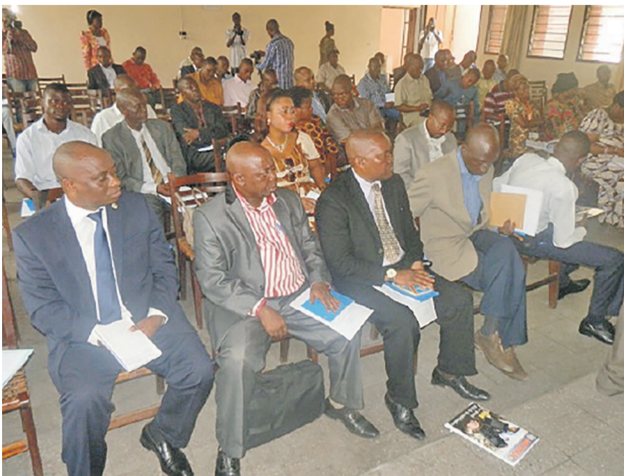
Des participants au forum national de la société civile