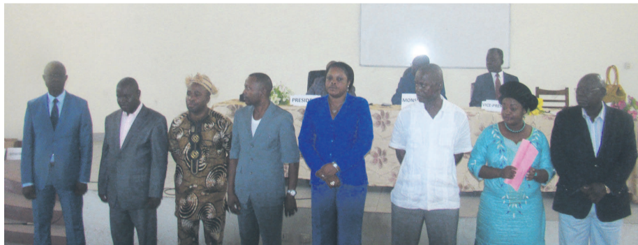
Les membres du bureau exécutif national

Il a, par ailleurs, rassuré la direction rectorale de la disponibilité du Synalu qui, aux côtés des autres forces syndicales, accompagnera l'université Marien-Ngouabi dans l'accomplissement des missions qui lui sont assignées. S'adressant aux membres