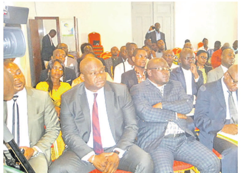
Les responsables des médias ponténégrins

« Si en 2014, les médias de la ville océane ont battu le record en la matière par rapport à ceux de Brazzaville, en 2015 aucun média de Pointe-Noire ne s'est pas encore acquitté de ses droits de taxes et de redevances audiovisuelles. Ainsi jusqu'en fin janvier 2016, si aucun média ne prend l'engagement de régulariser sa situation administrative et financière, les sanctions tomberont conformément aux dispositions des articles 7 de la loi organique du Conseil supérieur de la liberté de communication et l'article 70 de la loi 8 qui donnent au conseil toute la possibilité en vue de fixer les conditions et décider de l'attribution ou du retrait des fréquences à une quelconque chaîne », a dé-