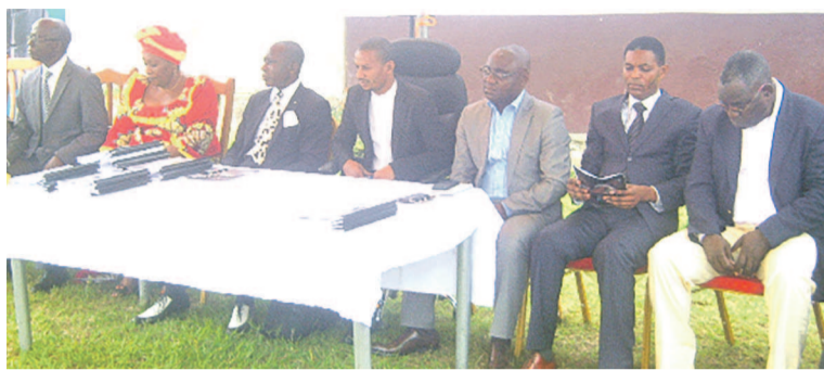
La tribune officielle au lancement des formations du PDCE

La composante 1.1 dont les formations ont été lancées à Pointe-Noire, lesquelles formations seront assurées pour un début par deux prestataires de formation identifiés depuis 2013 par la Banque mondiale. Il s'agit du Centre professionnel Don Bosco situé dans l'arrondissement 3 Tié Tié et le centre d'éducation et de formation par apprentissage (CEFA) mécanique automobile basé à Lumumba. D'autres prestataires seront sélectionnés sous peu, après le lancement des avis à manifestation d'intérêt afin de former un plus grand nombre de jeunes. La phase 1 basée sur la formation professionnelle durera 6 mois. La phase 2 consistera à la mise des apprenants en stage en entreprise pendant 3 mois et la phase 3 sera consacrée à l'appui à la recherche d'emploi pendant 6 à 9 mois. « Afin de motiver la participation et l'assiduité, et pour compenser les