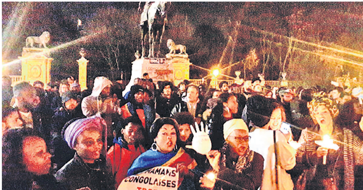
Une vue de la foule présente à la manifestation

Pour ce faire, les organisateurs ont exigé que la ville de Bruxelles ainsi que les autorités belges clarifient leur position vis-à-vis des exactions durant la colonisation. Ils ont également demandé la mise en place d'une commission d'enquête parlementaire qui porte sur ces exactions commises contre les populations congolaises par l'État indépendant du Congo. Par ailleurs, le CMLCD exige que la ville de Bruxelles réforme l'enseignement par rapport à l'histoire de la colonisation en mettant en exergue la violation des droits de l'Homme, la résistance des peuples et l'apport de ces peuples à l'essor économique de l'Europe. « Par rapport à l'éducation et à la citoyenneté qu'un accent soit mis sur la propagande coloniale qui a construit le racisme structurel qui perdure jusqu'aujourd'hui », explique le CMLCD