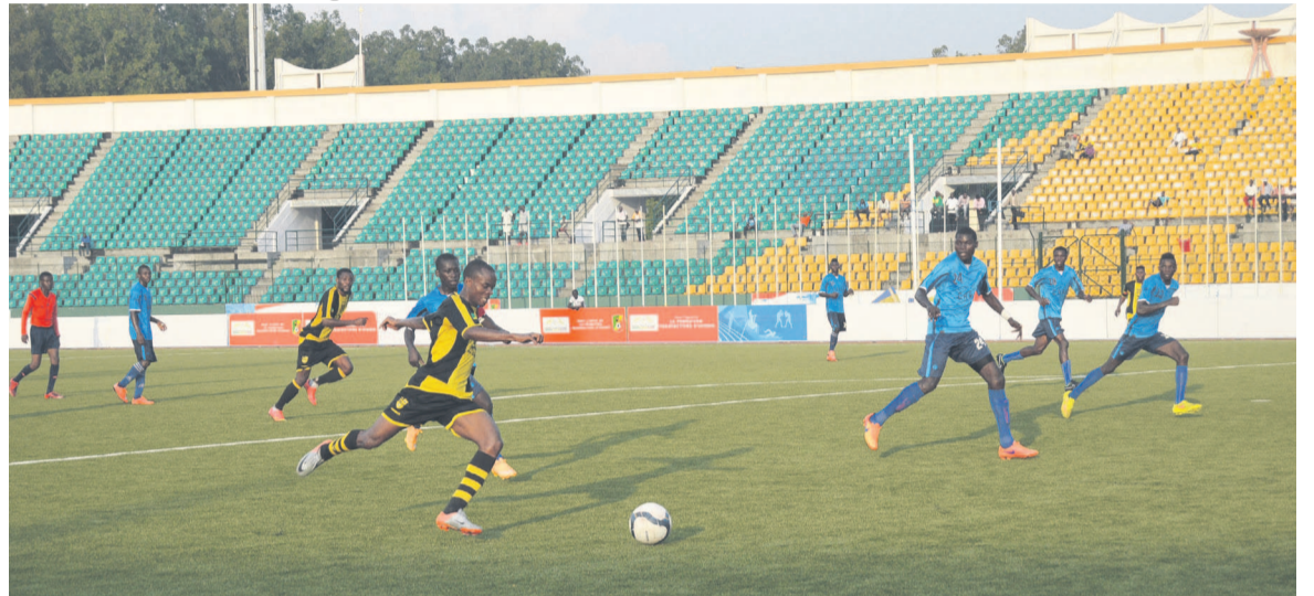
Match amical Diabes noirs-Carp

En 2014, l'équipe s'est essouffée lors des préliminaires de la Ligue des champions face à Flambeau de l'Est du Burundi : 0-1 à domicile et 1-1 à l'extérieur. Dernière-