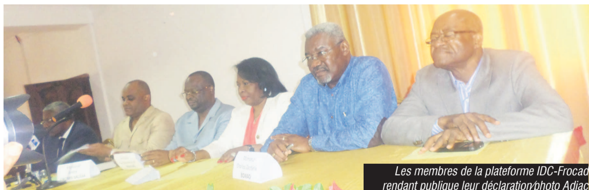
Les membres de la plateforme IDC-Frocad rendant publique leur déclaration

En dépit du fait que la prochaine présidentielle soit ramenée au premier trimestre 2016, les deux groupements politiques de l'opposition dite radicale entendent y participer. Cependant, l'Initiative pour la démocratie au Congo (IDC) et le Front