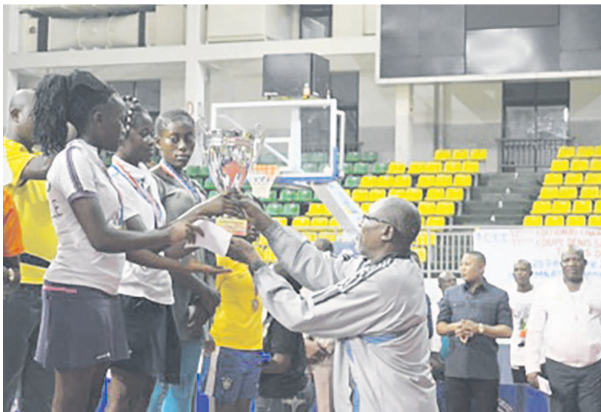
Les pongistes de la Sangha, championnes en dames par équipe.