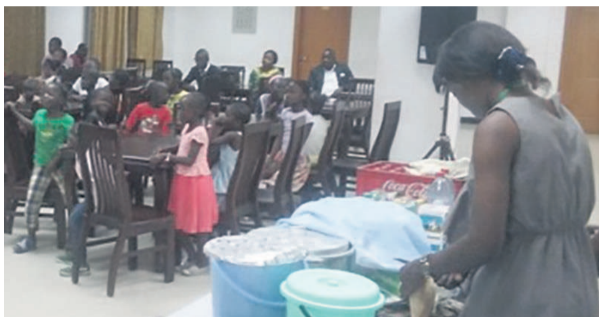
Les enfants s'appropriant à passer à table pour le repas de Noël

Les enfants ont dansé au rythme des chansons Tsotsa du DJ Epéla,