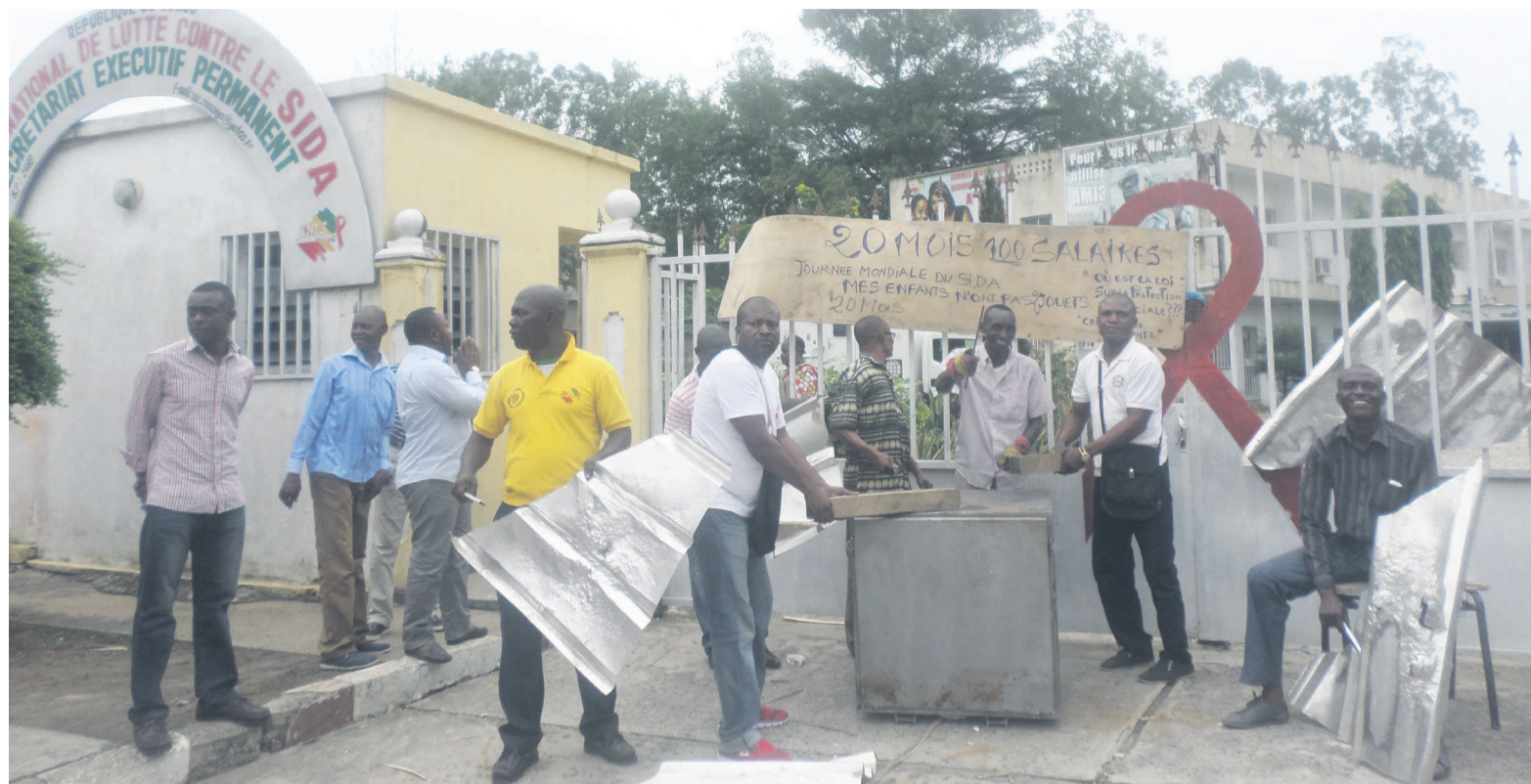
Une vue des manifestants

Ces vingt mois d'arriérés de salaire sont, a-t-il expliqué, à l'origine des séparations de corps dans les foyers, et de l'aban-