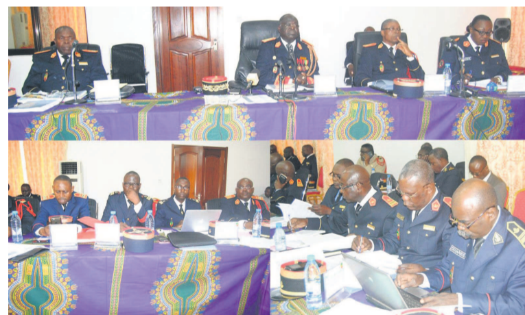
Le comité de modernisation de la Douane en plein travaux