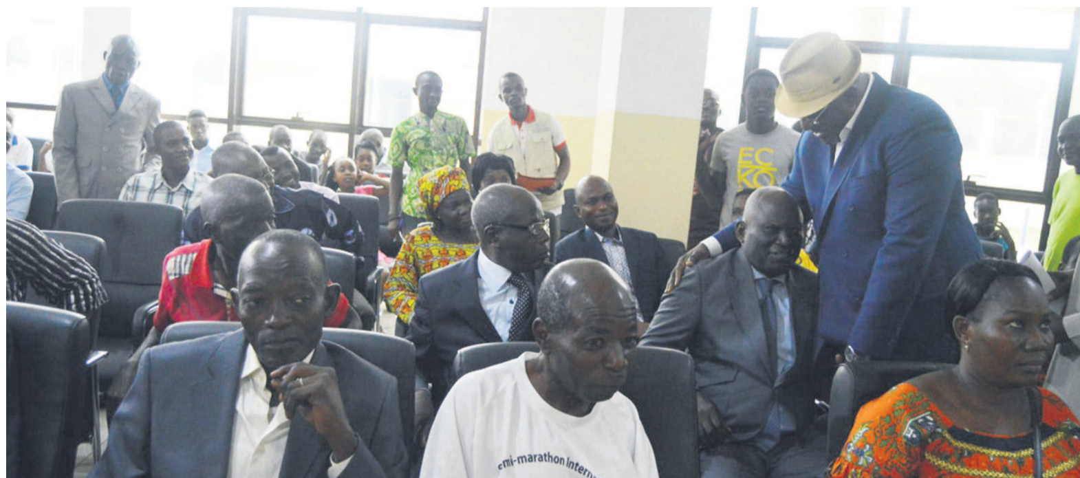
Le ministre des Sports console un des sportifs malades

« (...) Nous avons pensé qu'il était bon de donner l'opportunité à tous de se retrouver. Souvent nous vous savons malades mais nous ne nous voyons pas », a déclaré le ministre des Sports. Page 12