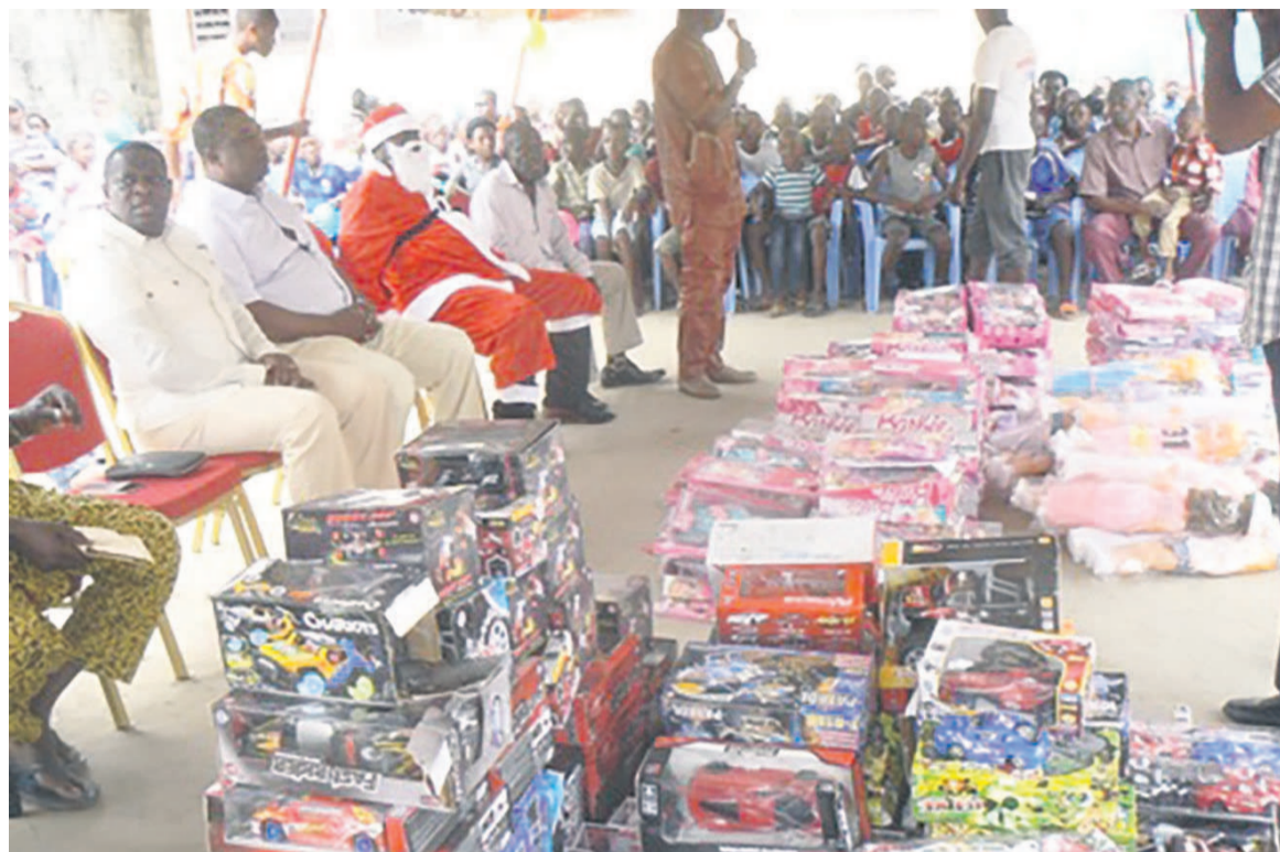
Un échantillon des jouets

L'occasion a été également un moment charnière pour adresser des messages forts aux acteurs des partis politiques du Congo. « Les enfants de Poto-Poto m'ont chargé de dire aux politiques : qu'ils veulent la paix. Sans la paix, il est impossible de se rassembler en pareille circonstance pour permettre aux enfants de manifester leur joie. Sans la paix, il n'y a pas de cours. La paix est la condition essentielle de la vie d'un pays. A l'orée de l'élection présidentielle, nous demandons à l'ensemble de la classe politique