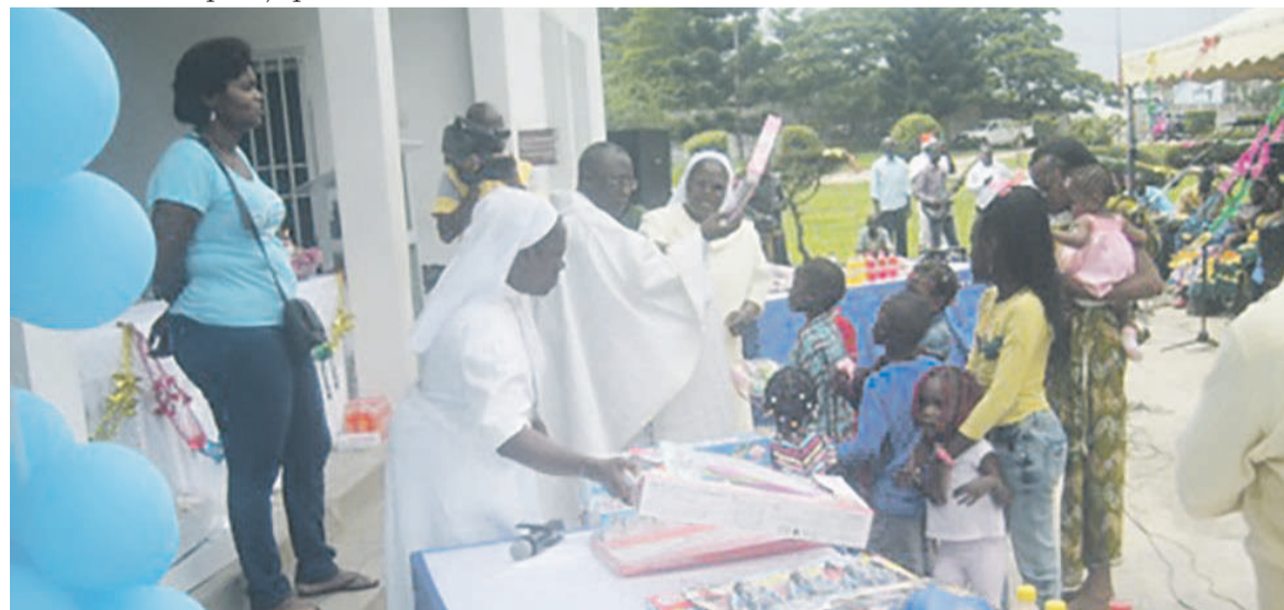
La distribution des jouets aux enfants

l'homélie du livre de Jean 1 : 1-18, exhortant le peuple de Dieu au sens de la responsabilité en répondant à la question fondamentale : Que devons-nous faire ? L'esprit de servitude, l'humanisme, l'amour du prochain sont les vertus que tout individu doit