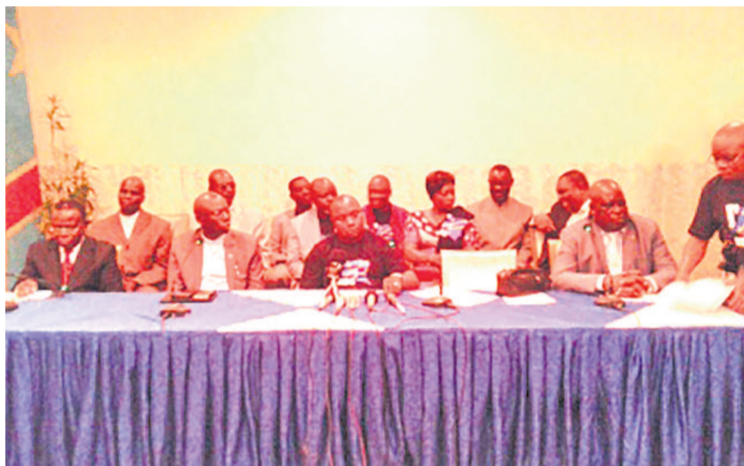
Le Dr Félix Kabange Numbi, initiateur de la campagne

Un mouvement patriotique, laïc, citoyen et apolitique vient de voir le jour. Il s'agit de la campagne « j'aime mon pays la RDC, je soutiens le dialogue. Le ministre de la Santé publique, le Dr Félix Kabange Numbi en est l'initiateur.