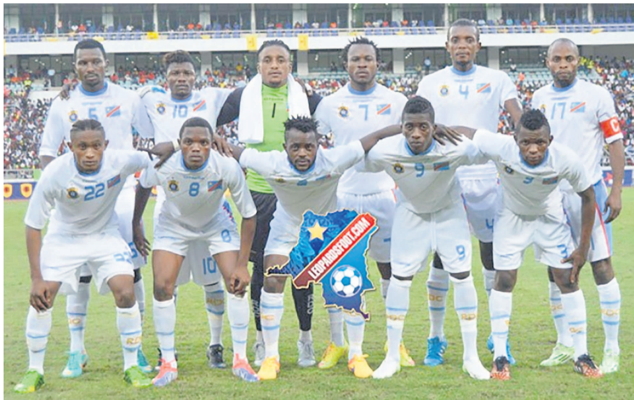
Léopards locaux de la RDC