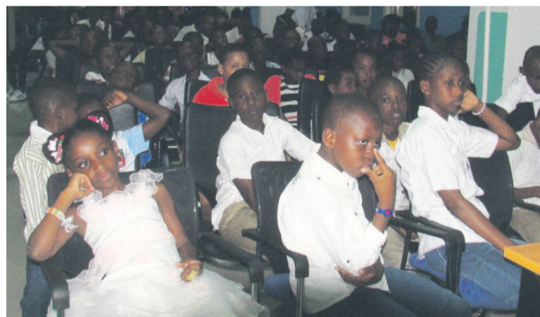
Une vue des enfants à la clôture de la formation

Plus de cent enfants, filles comme garçons, âgés de 8 à 14 ans, ont suivi du 22 au 23 décembre, une formation spéciale sur l'usage du numérique. Le but est d'inciter les plus petits à aimer et à développer dès le bas âge des aptitudes dans les nouvelles technologies. La formation a été organisée par Yekolab, à travers son concept « Noël numérique ».