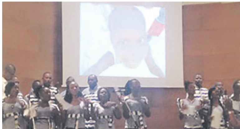
La chorale Sainte Odile prestant au cours de la soirée

Au total 795.300 FCFA ont été récoltés au cours de ce cocktail organisé le 19 décembre dernier à l'hôtel Radisson Blu M'bamou palace hotel Brazzaville. Cette somme sera doublée par cet établissement hôtelier à la hauteur de 1.590.600 FCFA pour la remettre à l'orphelinat La Maison de la Charité située à Mpila dans le cinquième arrondissement de Brazzaville.