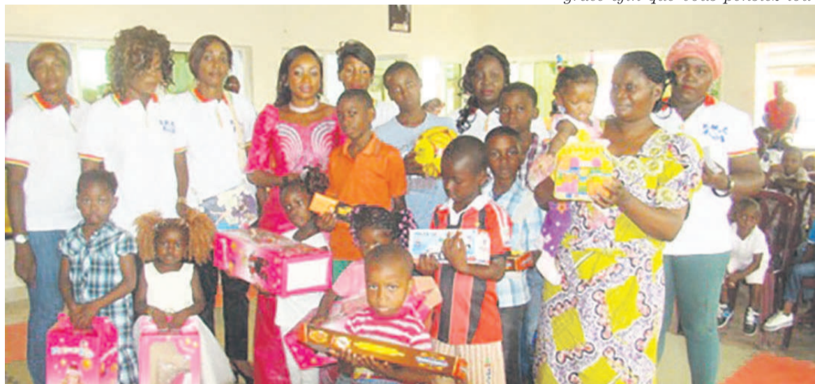
Les membres du bureau de la FMC posant avec les enfants

dation pour avoir pensé à nous offrir ces précieux cadeaux. Etant orphelins, nous avions perdu l'espoir qu'un jour nous pourrions avoir des jouets et passer une bonne fête de Noël. Mais, grâce à votre générosité, nous voici heureux et comblés. Cela prouve que vous avez le cœur d'une mère. Nous disons longue vie à la FMC. Puisse Dieu vous combler de grâce afin que vous pensiez tou-