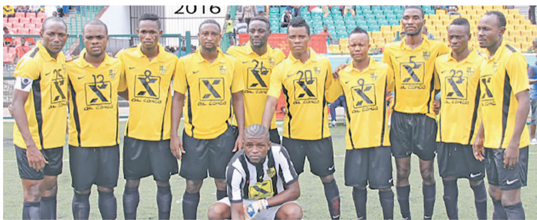
Diabes Noirs

Alors que Diabes-noirs et Cara, respectivement premier et deuxième au classement provisoire du championnat, ont conservé leur place à l'issue de la 5e journée, La Mancha a cédé la troisième place à l'AC Léopards à la suite de son match nul contre JSP, le 24 janvier, au stade Alphonse-Massamba-Débat à Brazzaville.