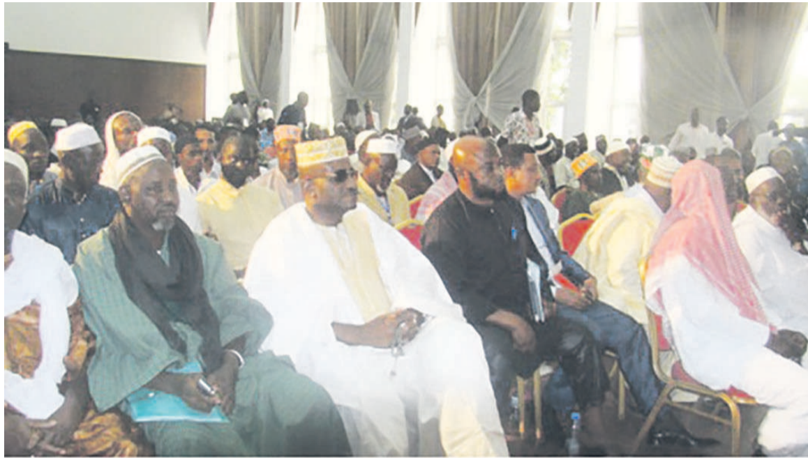
Une vue de la salle