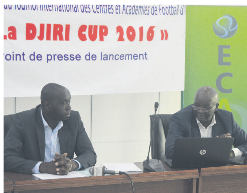
Les organisateurs de la Djiri Cup en conférence de presse

L'équipe du centre de formation de Metz en France et plusieurs autres d'Afrique seront dans la ville capitale congolaise du 12 au 14 février de l'année en cours pour disputer la 3 ème édition de la Djiri Cup.