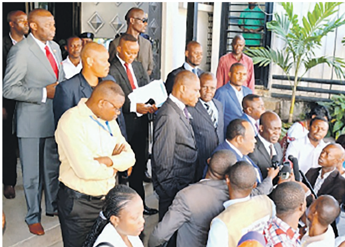
Des leaders de l'opposition après une réunion à Kinshasa

Alors que la Dynamique de l'opposition avait rejeté en bloc l'invitation d'Edem Kodjo dans le cadre de ses consultations amorcées avec la classe politique congolaise, le parti de Jean-Pierre Bemba a mordu à l'hameçon. Faisant fi de la décision de