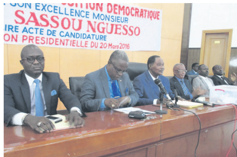
Une vue des présidents de l'AOD

L'AOD a exhorté, le 25 janvier à Brazzaville, Denis Sassou N'Guesso à faire acte de candidature au scrutin du 20 mars prochain. Pour cette plateforme, le président de la République est le seul garant de la paix. Ses membres ont également évoqué l'implication de l'actuel président en faveur du développement économique et social du Congo; la nécessité de préserver les acquis démocratiques, économiques et sociaux; enfin, son expérience au sommet de l'Etat. Pour dire clair, cette plateforme de l'opposition ne présentera pas de candidat pour la présidentielle 2016. « À l'étape actuelle où s'opèrent de grandes mutations au niveau des Etats, vous avez compris que les congolais n'ont pas besoin d'un dirigeant providentiel. Ils refusent de confier leur destin