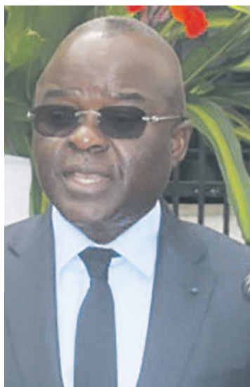
Le ministre Georges Moyen prononçant son allocution d'orientation

Il a également rappelé que le but premier de l'assurance-qualité est de renforcer la qualité de l'enseignement supérieur et d'améliorer le rôle de la contribution de ce secteur à la croissance économique et au développement social du pays. C'est ainsi qu'il a instruit ses services compétents de mettre à la disposition de l'université un référentiel à partir duquel se fera l'évaluation du LMD. Les résultats de cet exercice concernant tous les établissements feront, a-t-il dit, l'objet d'une concertation qui per-