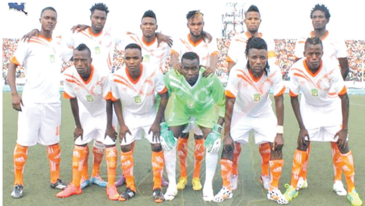
FC Renaissance du Congo

Deux buts à un, c'est le score en faveur du FC Renaissance du Congo face au RC Sodigraf au tour préliminaire de la 52e édition de la Coupe du Congo de football.