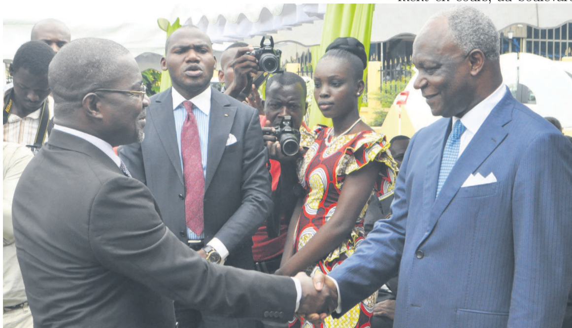
Henri Ossebi félicitant le directeur général de la SNDE ; crédit photo cabinet (MEH)

Le bilan du ministère de l'Énergie et de l'hydraulique de l'année dernière a été jugé satisfaisant. En effet, selon Henri Ossebi, le niveau exceptionnel des performances réalisées dans les secteurs sensibles de l'eau et de l'électricité peut leur servir de grille d'évaluation. Pour lui, la remontée progressive du niveau des performances en cours dans les deux secteurs doit se poursuivre et s'accélérer. Parlant des réalisations lourdes, il a rappelé que la Société nationale d'électricité (SNE) et la Société nationale de distribution d'eau (SNDE) ont, activement et avec des fonds propres, épaulé les Grands travaux dans la finalisation des chantiers structurants à Ouessou. « Le summum de cette contribution stratégique de notre département à la vie nationale, aura sans doute été, comme chacun le sait la célébration merveilleuse, sans accroc, sans délestage, sans incident, des 50 e Jeux africains. Nous avons réussi à hisser notre niveau d'exigence et de conscience professionnelle, en relevant collectivement le défi de sauver l'honneur de notre Nation », s'est réjoui Henri Ossebi. S'agissant de la gouvernance interne, ces deux entreprises ont désormais atteint, à en croire la tutelle, leur rythme