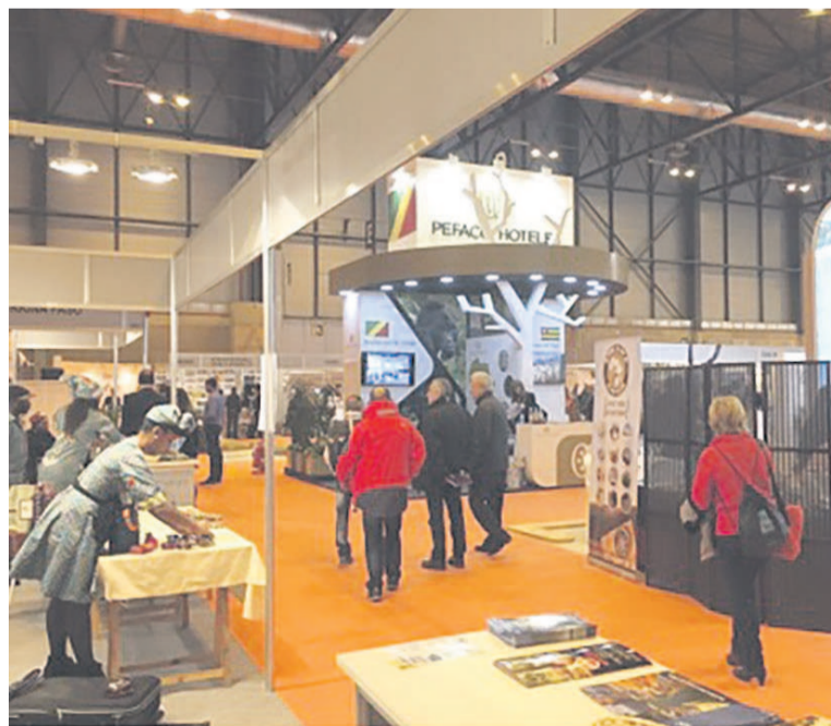
Les stands du Togo, du Congo et Pefaco Hoteles de chasse. Grupo Pefaco est spécialisé dans les secteurs des jeux et loisirs et de l'hôtellerie.

foire, les deux pays ont suscité un très fort besoin d'information des voyageurs, des tours opérateurs, des compagnies aériennes et des consommateurs du monde entier. « Pré-servés et authentiques, ouverts et bien équipés, le Togo et le Congo-Brazzaville sont des destinations de plus en plus prisées sur le marché international du tourisme, ainsi qu'en atteste la croissance du secteur dans les deux pays », souligne le communiqué de presse. Pour Pefaco Hoteles, la République du Congo est une destination touristique de choix grâce notamment à ses vestiges historiques, ses villages pittoresques, ses paysages variés,