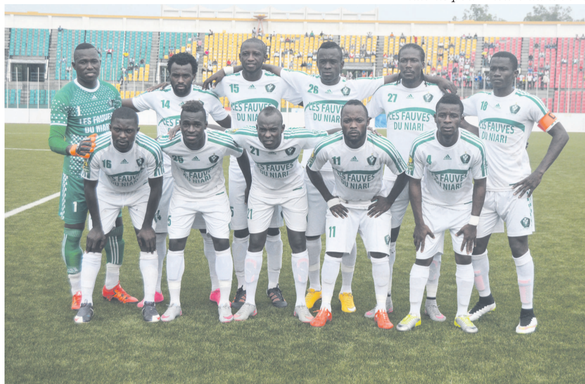
L'AC Léopards de Dolisie Crédit photo Adiac.

De retour des vestiaires, les militaires de l'Inter Club ont tenté de relever la tête sans succès. Plusieurs de leurs assauts ont été stoppés par le portier Barel Mouko, impérial sur sa ligne de but. A la 76 e , contre le cours du jeu, l'attaquant fauve Kuluwé, entré en deuxième mi-temps, est accroché dans la surface de réparation. L'arbitre désigne le point de penalty. Contre-pied parfait d'Hermann Lakolo qui a porté le score à 3-0. Les rêves de victoires de l'Inter Club ont été définitivement enterrés. « Nous avons trop respecté