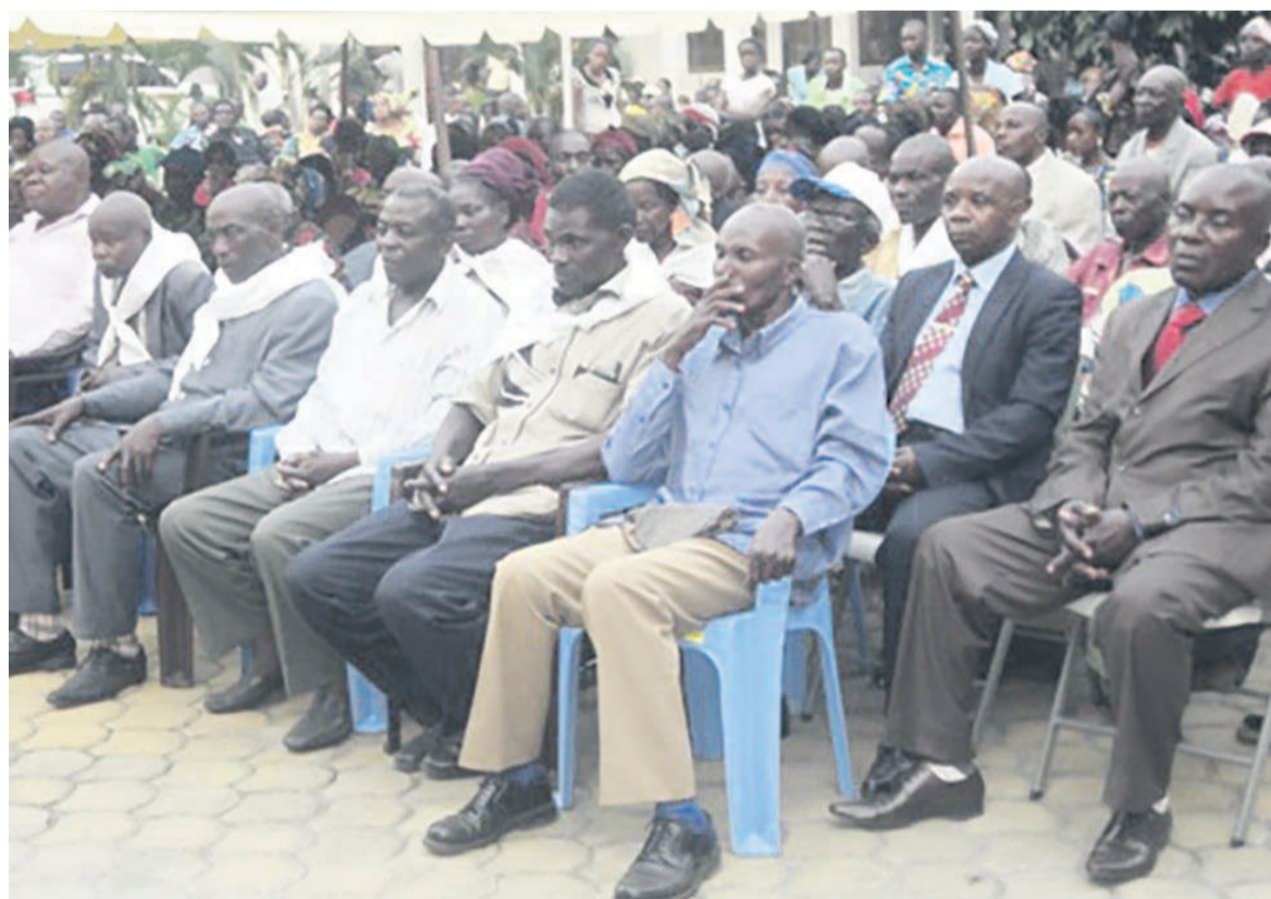
Une vue de la population de Djambala

Le soutien au président de la République a été le même à Djambala qu'à Lékana, où des femmes regroupées au sein d'une association dénommée « Les douze terres de Lékana », profitent de cette occasion pour présenter également leurs doléances: « Monsieur le ministre, tous les sages de Lékana vous chargent d'aller dire au président Denis Sassou N'Guesso que notre population est derrière lui. Nous vous chargeons également de lui dire de penser à nous dans les domaines de l'électricité, l'adduction d'eau potable et