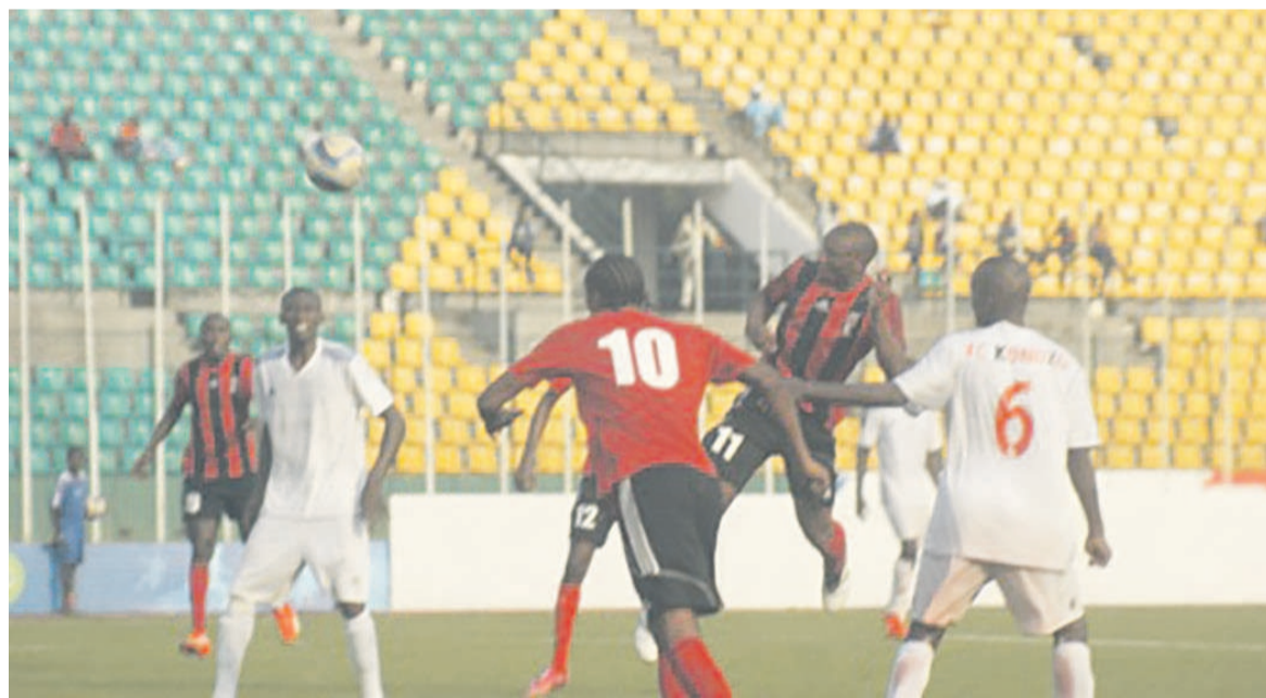
Les joueurs de Cara à l'assaut des buts du FC Kondzo

Le Club athlétique renaissance aiglon (Cara) a manqué, le 2 février, une occasion de prendre provisoirement la tête du championnat vingt-quatre heures avant la rencontre des Diables noirs (18 points) face à la Jeunesse sportive de Poto-Poto.