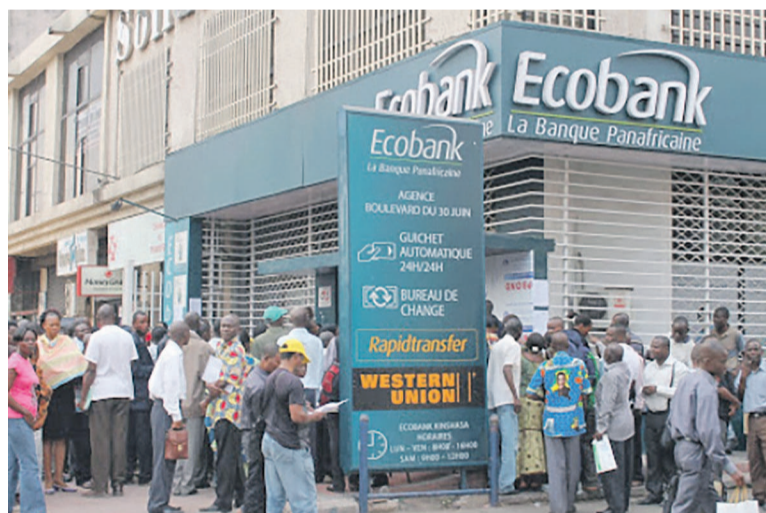
Une agence d'Ecobank à Kinshasa