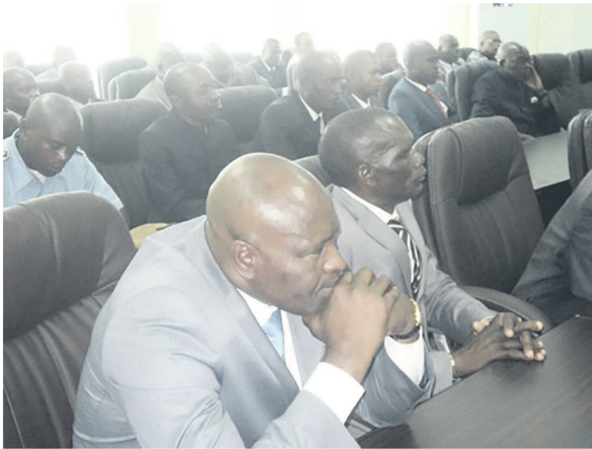
Les cadres attentifs à la communication du ministre

Au niveau de la CRF poursuit-il, des directives ont été données afin