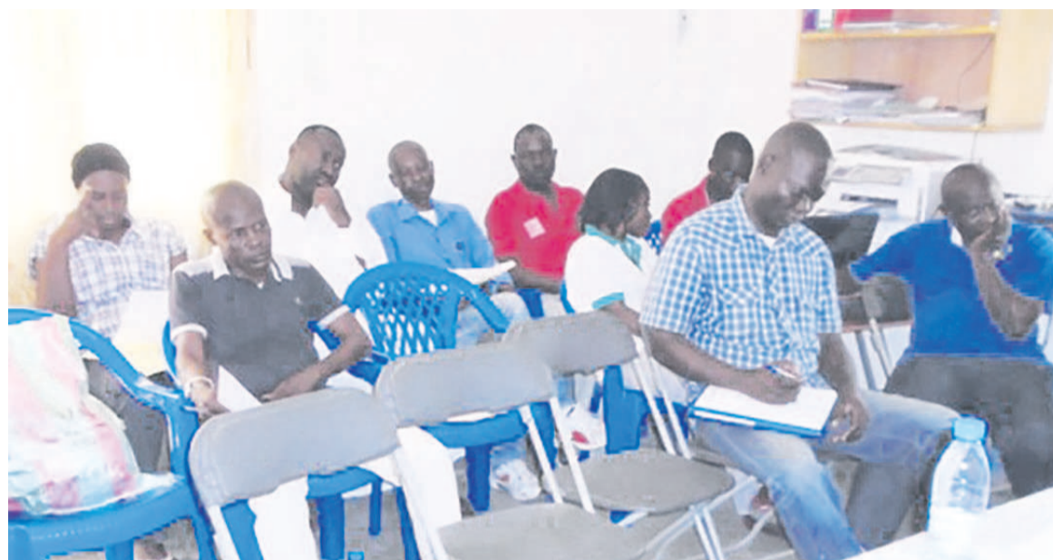
Les membres de la Ligue de Brazzaville en réunion inaugurale

Le problème du manque d'équipes, des joueurs et des arbitres de qualité sont autant de défi qu'ils souhaiteraient résoudre dans l'urgence. La ligue a promis aller au déla en apportant le soutien aux équipes en création et ce afin d'accroître le nombre des clubs à Brazzaville. Dans son programme d'activités qu'ils