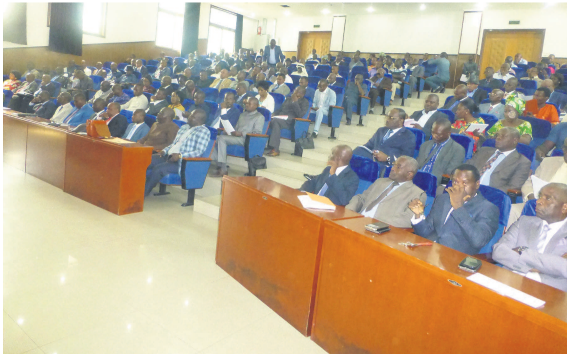
Les représentants des partis et de la société civile

précisé, en outre, que les candidatures individuelles à la CNEI seront rejetées. « Nous attendons les propositions des groupements, des partis politiques et de la société civile impliquée dans le processus