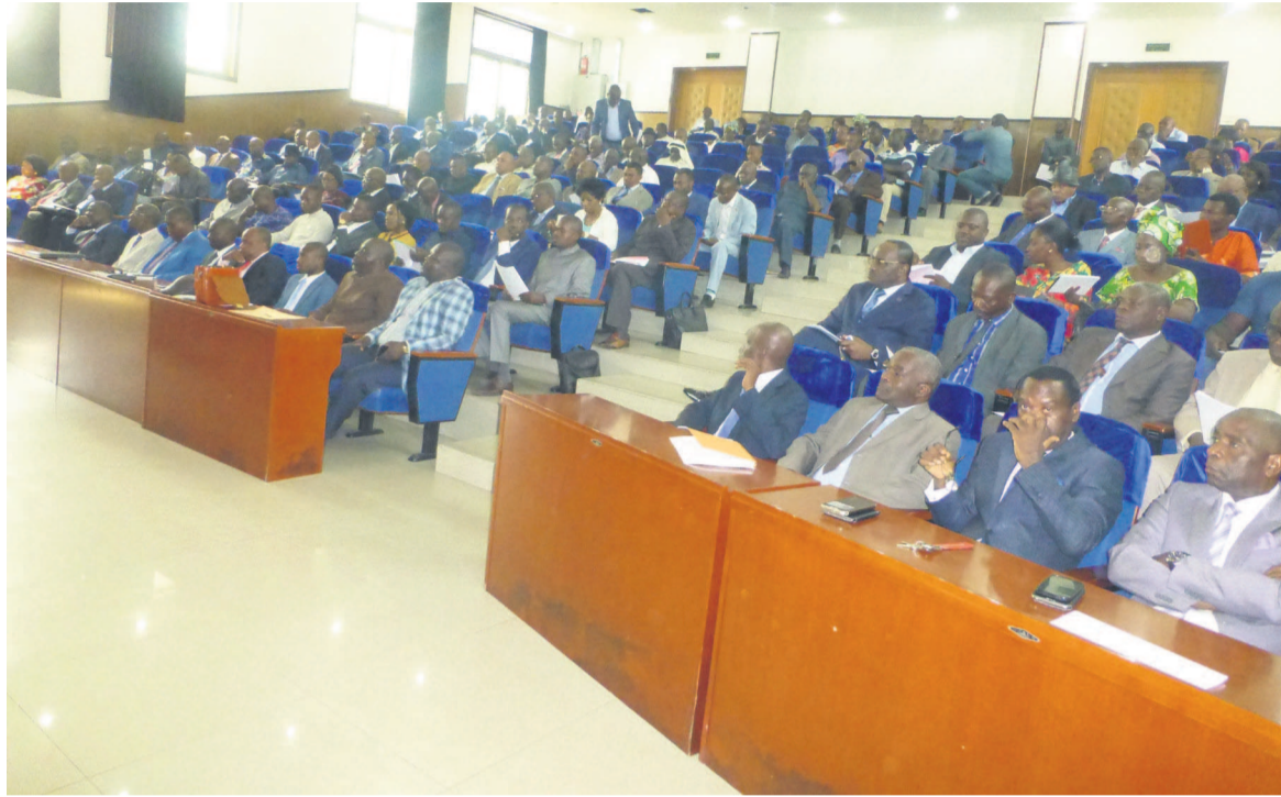
Les représentants des partis et de la société civile

précisé, en outre, que les candidatures individuelles à la CNEI seront rejetées. « Nous attendons les propositions des groupements, des partis politiques et de la société civile impliquée dans le processus