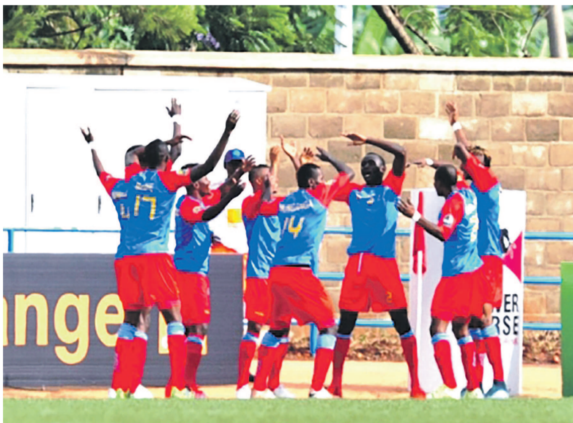
Les Léopards célébrant un but lors du match contre le Rwanda