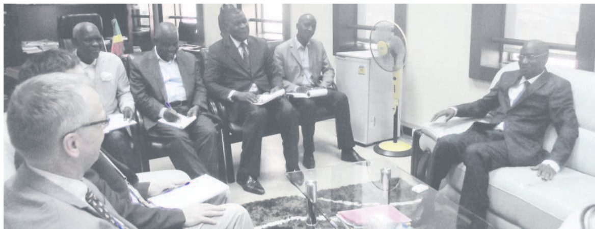
La délégation italienne reçue par le ministre de la Pêche et de l'aquaculture