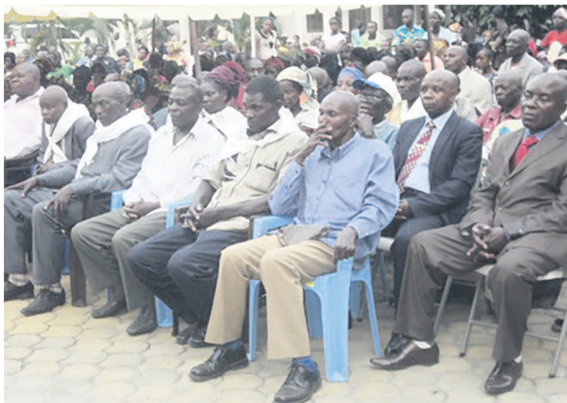
Une vue de la population de Djambala

Le soutien au président de la République a été le même à Djambala qu'à Lékana, où des femmes regroupées au sein d'une association dénommée « Les douze terres de Lékana », profitent de cette occasion pour présenter également leurs doléances: « Monsieur le ministre, tous les sages de Lékana vous chargent d'aller dire au président Denis Sassou N'Guesso que notre population est derrière lui. Nous vous chargeons également de lui dire de penser à nous dans les domaines de l'électricité, l'adduction d'eau potable et