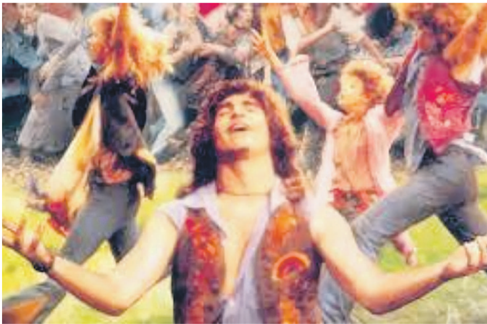
Le film Hair de Milos Forman

«Hair», projeté le 16 février à Loandjili dans la ville océane, est un film américain réalisé par Milos Forman. Le film est l'adaptation de la comédie musicale éponyme de Jerome Ragni, James Rado et Galt MacDermot des années 1960.