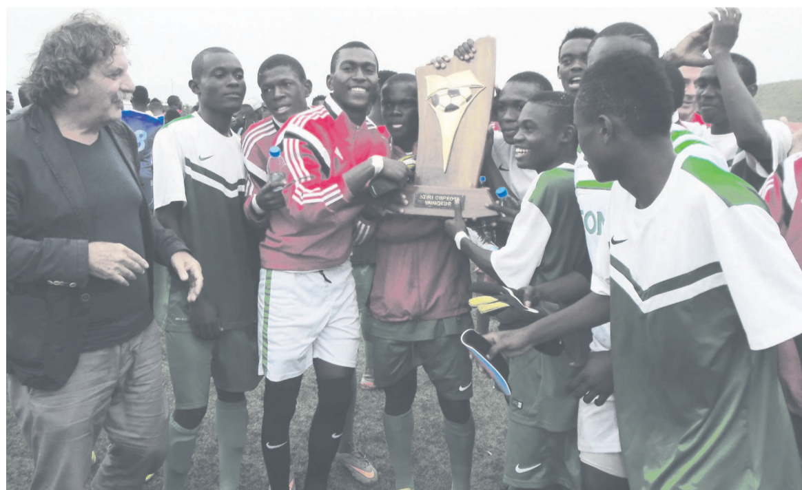
La joie des pensionnaires du CNFF après leur 2 e titre

« Nous en sommes à la 3 e édition. De quatre, nous sommes passés à 9 équipes. Il y a une équipe de France qui est arrivée, les Maizières. Le Centre de formation Joël Tiehi de la Côte d'Ivoire était présent tout