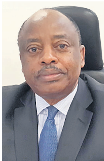
L'ambassadeur Léonard-Emile Ognimba

LEO : C'est un privilège pour moi d'avoir travaillé à la fois au pays au ministère des Affaires étrangères et à la présidence, pour le pays dans le cadre d'une ambassade à Addis-Abeba où j'étais conseiller et puis comme ambassadeur en Afrique du Sud et pour l'Afrique en général au niveau de l'OUA/Union africaine et aujourd'hui pour les ACP. C'est une expérience