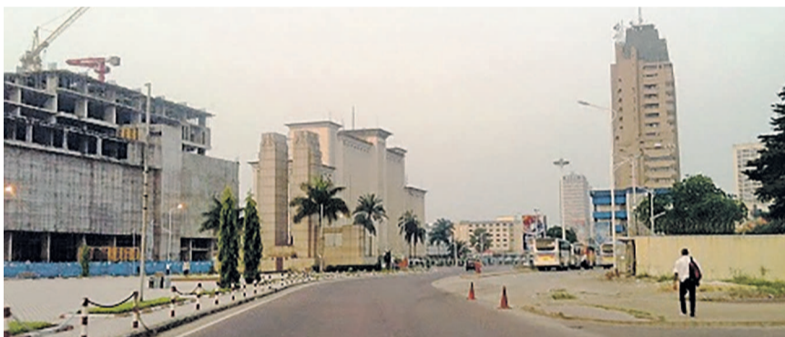
Place de la gare

Pendant ce temps, le vice-Premier ministre chargé de l'Emploi est monté au créneau pour souligner le caractère ouvrable de la journée du 16 février qui n'est pas comptabilisé comme jour férié. Le commissaire provincial de police/ ville de Kinshasa a renchéri en mettant en garde tous ceux qui empêcheraient les autres de se rendre à leur poste de travail. Nonobstant tous ces appels à la conscience des Kinois, ces derniers,