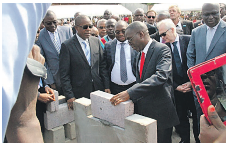
le premier ministre pose la première pierre de construction de l'entrepôt

Pour le représentant de l'Unicef en RDC, Pascal Villeneuve, le chantier qui est inauguré ainsi que les autres chantiers qui verront le jour permettront « de doter le pays de capacités permettant de stocker des quantités toujours plus importantes de vaccins, du fait de l'introduction de nouveaux vaccins, de l'accroissement continu de la population d'enfant et de l'extension des services de vaccination ». Pascal Villeneuve d'ajouter : « La pose de la première pierre va marquer le début d'une belle aventure, laquelle aventure ne verra son apogée que dans la