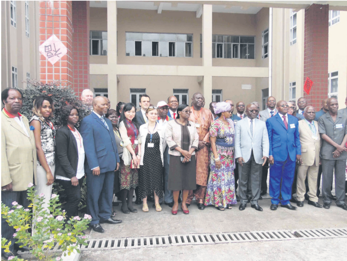
Les participants à l'atelier de formation à la gestion de la douleur et des soins palliatifs (Adiac)