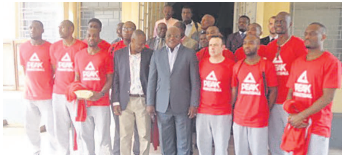
Le ministre des Sports avec les basketteurs (Photo d'archives) Crédit photo Adiac

Il n'y aura plus de brouille entre les pétitionnaires et Firmin Dinga. À l'issue d'une réunion avec le ministre des Sports et de l'éducation physique, Léon Alfred Opimbat, en effet, les angles ont été arrondis. Les deux parties retravailleront main dans la main. Un comité de suivi a d'ailleurs été mis en place. Celui-ci est composé de deux membres