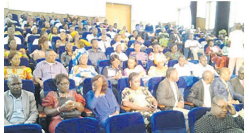
Une vue des commerçants lors de la rencontre avec le ministre

département à accomplir leur mission, celle de veiller à la protection du consommateur et à la loyauté des actes de commerce pour le bien-être de la population et le développement des affaires, le ministre a relevé : « Mon propos a valeur d'avertissement général, je se-