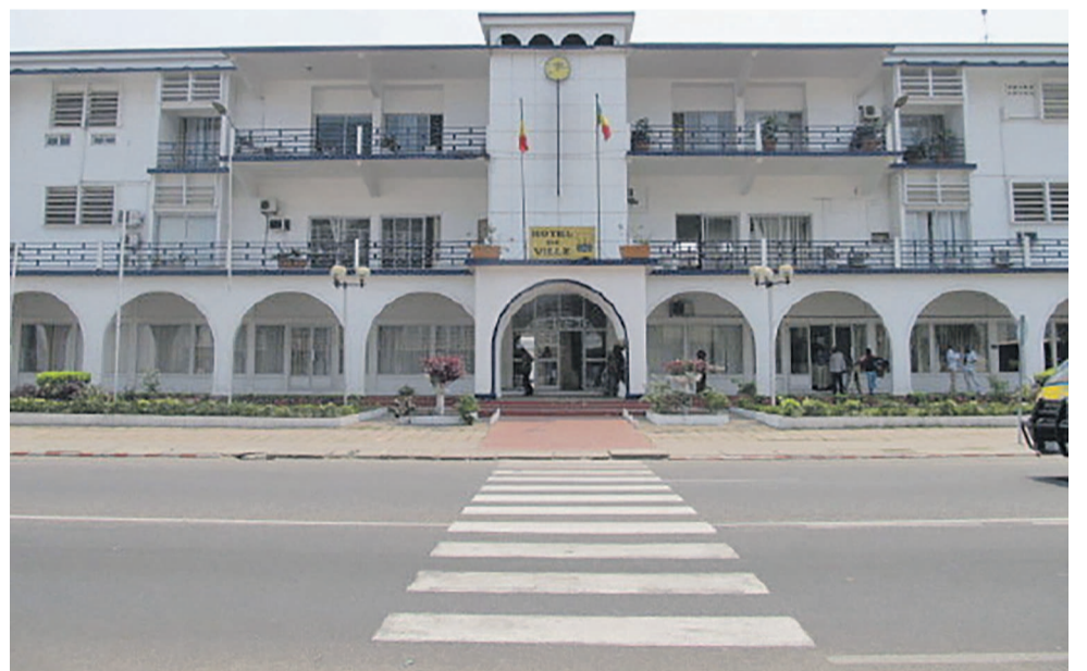
Une vue de la mairie de Pointe-Noire

Le Conseil départemental et municipal de la capitale économique annonce l'ouverture de sa 4 e session ordinaire dite « budgétaire » ce mercredi dans la salle de mariage de l'Hôtel de ville.