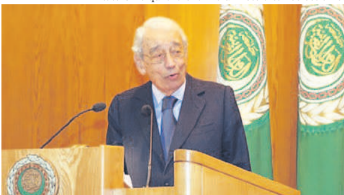
Ancien secrétaire général de l'ONU et de la Francophonie, l'Égyptien Boutros Boutros-Ghali, s'est éteint mardi à l'âge de 93 ans

Après la mort en Somalie de 18 soldats américains fin 1993 et les reculs des Nations unies dans les dossiers de l'ex-Yougoslavie et du Rwanda, il avait été pris comme bouc émissaire, en particulier par les États-Unis qui avaient mis un veto à sa réélection et