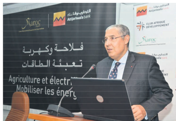
Les organisateurs du Forum

rencontrer leurs homologues africains et détecter ainsi les différents opportunités d'investissement en Afrique et à l'international.