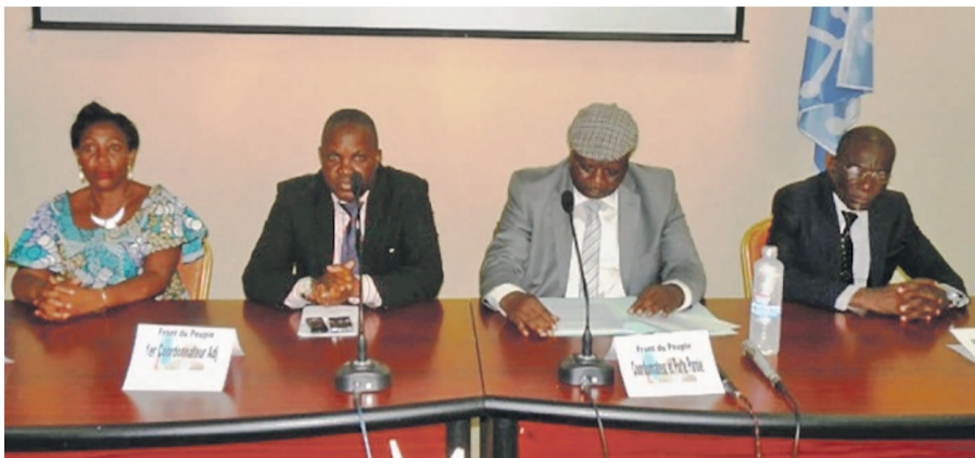
Une vue de la tribune

Pour l'honorable Lisanga Bonganga, en effet, après de longs débats animés et constructifs, la synthèse à laquelle les alliés du président Étienne Tshisekedi sont parvenus, à la clôture des travaux de leur premier convention politique, est la preuve qu'ils restent mobilisés et rassemblés autour de leur autorité morale. Si les alliés du président Étienne Tshisekedi