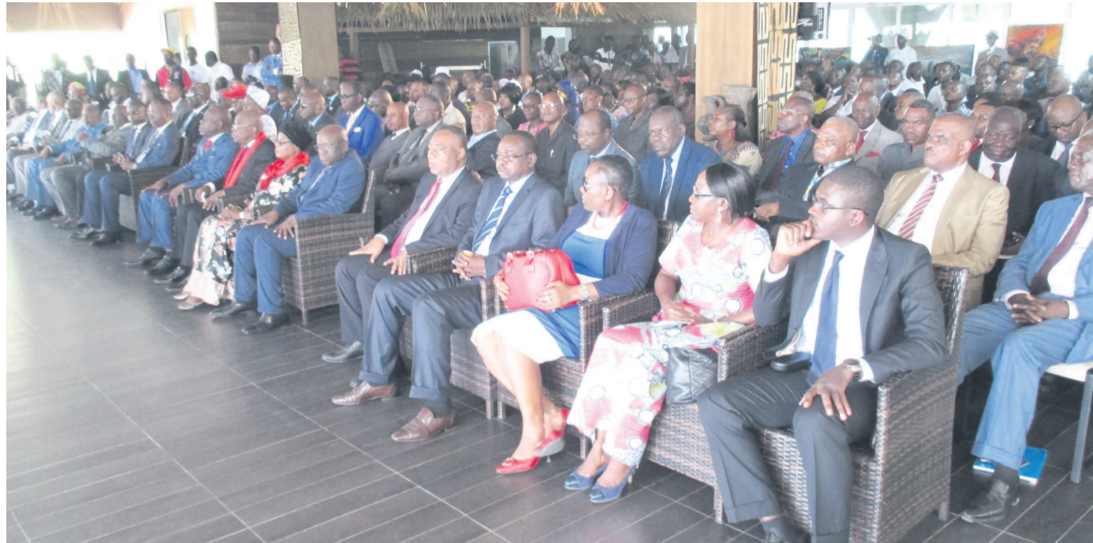
Les participants (à droite).

de passage institutionnel à la nouvelle République. Et la première étape, c'est l'élection présidentielle de mars prochain ». Les deux partis entretiennent des relations de coopération