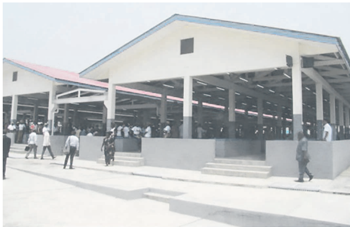
Une façade du marché Maman Mboulé