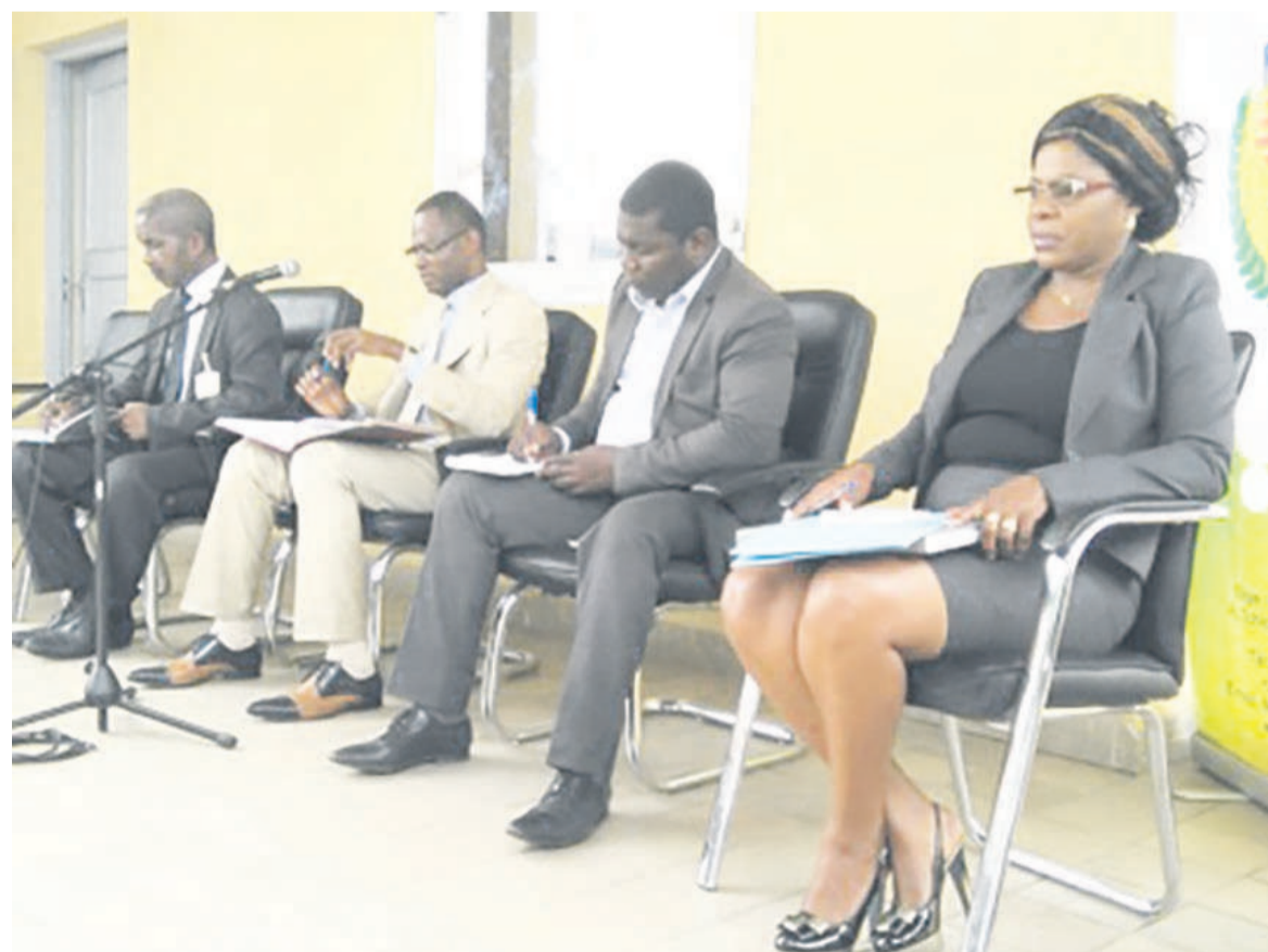
L'équipe dirigeante du Fespam