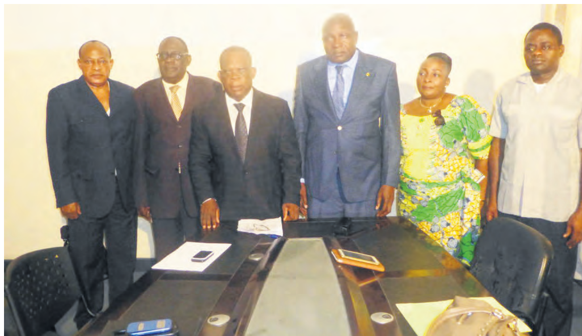
Les membres du bureau de la FPU-Congo

tiques graves, qualifiés de bêtises humaines, ont failli conduire notre pays vers un non-Etat, notamment en 1993, 1997, 1998 et 1999. Tout récemment, des événements précédant le référendum constitutionnel n'ont pas été loin de déstructurer le tissu social du Congo. Aujourd'hui, notre pays se prépare à organiser l'élection présidentielle du 20 mars, la FPU-Congo milite pour la pérennisation du climat de paix », a-t-il renchéri.