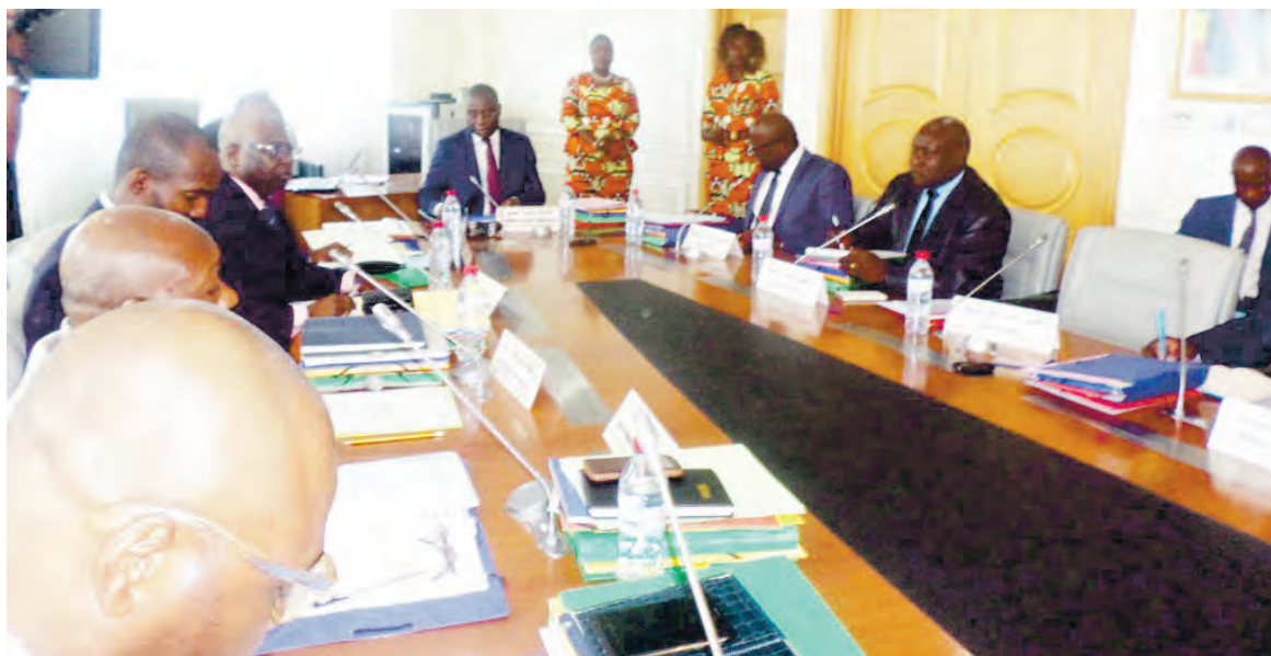
Les membres du conseil d'administration pendant les travaux

Selon le communiqué final sanctionnant les travaux du conseil, ce budget de 2,940 milliards FCFA comprend 2.912.800 millions francs CFA destinés aux charges d'exploitation, et 27.200.000 FCFA, pour la marge bénéficiaire prévisionnelle. Les investissements sur fonds propre du port, sont eux, arrêtés à la somme de 303 millions FCFA.