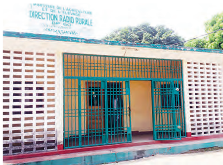
La façade de la Radio rurale congolaise