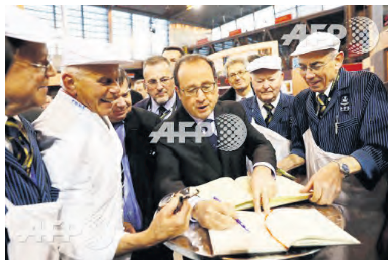
François Hollande au Salon International de l'agriculture 2016

Pour la 53 e édition de l'univers des élevages et de ses filières, le public retrouvera : bovins, ovins, porcins, volailles, ... bref, les productions des régions et du monde. De stand en stand, les acteurs du monde agricole seront là, chacun pour présenter les facettes du sec-