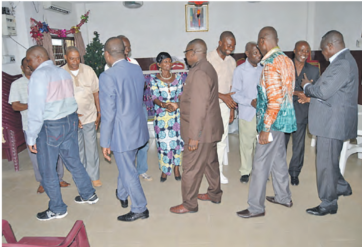
Les membres de la Fécofoot et le représentant du directeur départemental des Sports félicitant les membres élus de la ligue «adiac»

Cependant, vu l'importance de la Ligue du Kouilou au niveau du football congolais, la Fécofoot a jugé nécessaire de reprogrammer cette assemblée le 26 février. En effet, sur trois candidats inscrits au départ, deux étaient restés