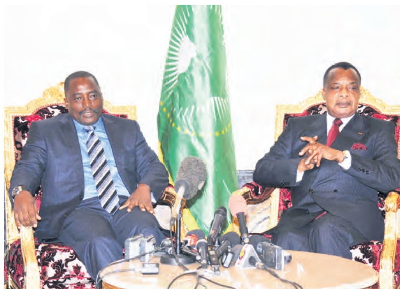
Denis Sassou N'Guesso et Joseph Kabila Kabange

coopération bilatérale entre Brazzaville et Kinshasa ainsi que celles portant sur la situation globale de la sous-région d'Afrique centrale. Page 24