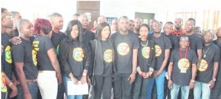
L'équipe de la Génération Z

En effet, il a été mis en place une équipe de neuf membres qui pilotera la campagne du candidat de la