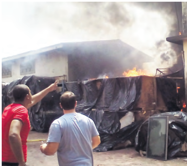
Une partie du dépôt de Congo-Métal en feu

La scène se passe au contre-rail de la gare de Brazzaville, le samedi 27 février 2016. Il est 10h 15 lorsque brusquement une grande fumée apparaît, accompagnée des flammes. Tout le monde s'étonne et la panique s'installe. Les commerçants de toute nationalité qui exercent aux alentours vont et reviennent dans tous les sens.