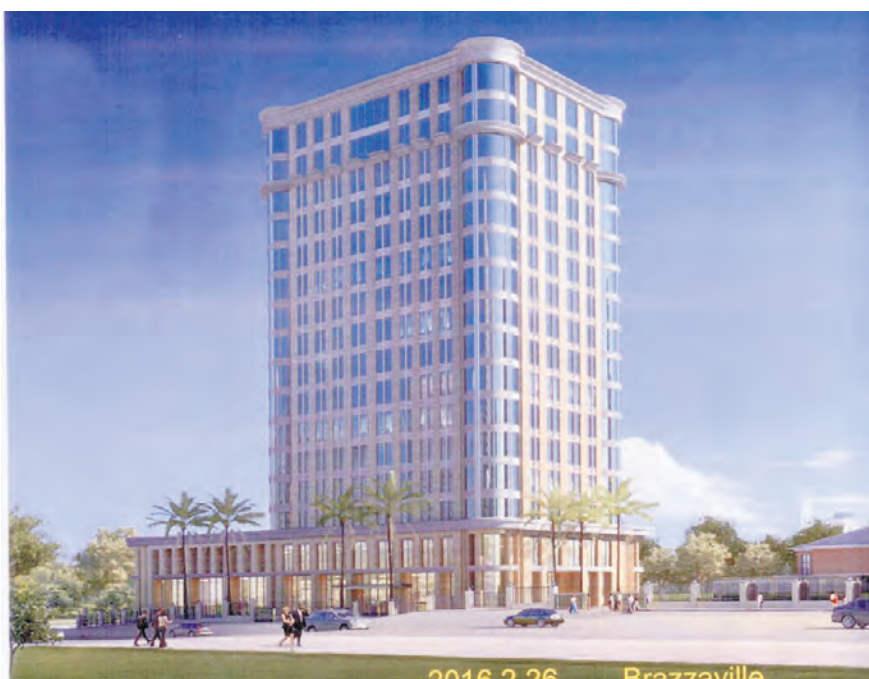
Futur siège social de la Banque Sino-Congolaise