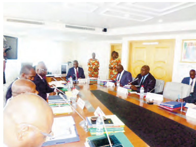
Les membres du conseil d'administration pendant les travaux

Le Conseil d'administration du Port autonome de Brazzaville et ports secondaires