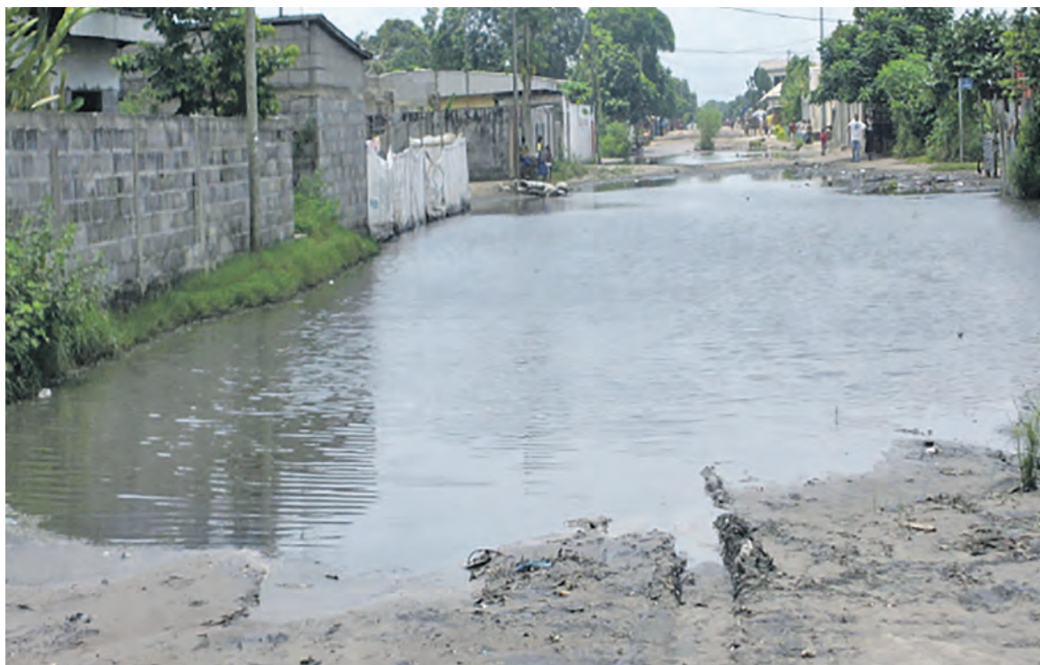
L'avenue Yacinthe-Bakanga avant d'être aménagée

L'avenue Yacinthe-Bakanga est l'unique voie principale dans cette zone, qui permet aux automobilistes d'atteindre le bout des horizons. Le nom donné à cette route est une marque de reconnaissance à l'ancien président du comité qui a permis d'élire le président de la Conférence nationale