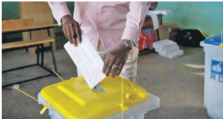
Dépôt de bulletin de vote dans l'urne

Justicia ASBL a fait constater que c'est depuis le 10 février, jour de la publication par la Céni, de la décision portant réaménagement du calendrier de l'élection des gouverneurs et vice-gouverneurs des nouvelles provinces, « qu'une