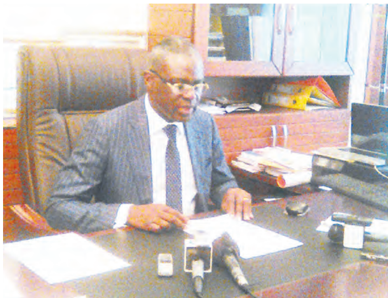
Le ministre Anatole Collinet Makosso rendant la déclaration

développement équilibré et durable pour le pays. « La nouvelle République doit être intériorisée par les jeunes car leur sens de responsabilité, l'expression de leur maturité et de leur volonté à consolider notre jeune démocratie sont ici sollicités. Les jeunes doivent apprendre à connaître les règles et les principes démocratiques sur lesquels la République repose désormais », a-t-il indiqué. Les réalisations du gouvernement en leur faveur ajoute-t-il, sont multiples. Parmi celles-ci, l'on peut noter le programme Eau pour tous, avec des