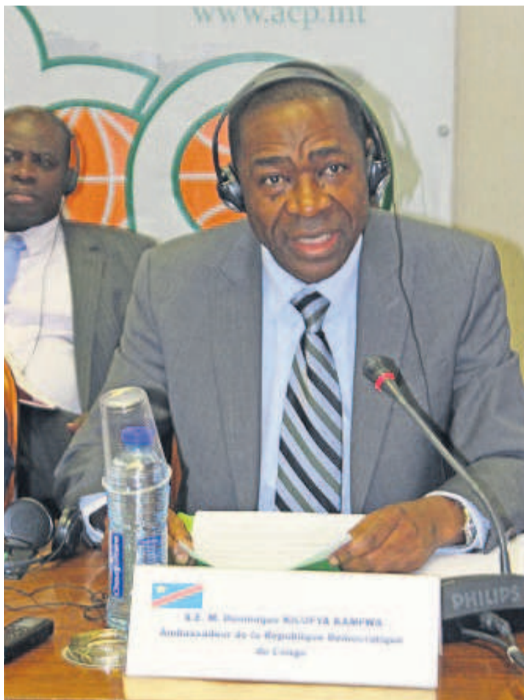
L'ambassadeur Dominique Kilufya Kamfwa pendant son discours

Parlant de la RDC, il a fait remarquer qu'avec l'amélioration de la gouvernance comme priorité, le gouvernement congolais s'est résolument engagé sur le chemin de l'émergence des politiques budgétaires et monétaires prudentes et met en œuvre, par la même occasion, des politiques de développement et de réduction de la pauvreté. « Les réformes déjà entamées doivent se poursuivre dans tous les domaines et secteurs de la vie nationale. Les mesures et principes retenus s'appuient, d'ores et déjà, sur l'implication de tous les acteurs au développement y compris la société civile et le secteur privé. Il s'agit de forcer le destin par des actions volontaires et concrètes qui démontrent que la RDC, mon pays,