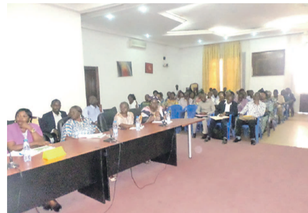
Une vue des participants