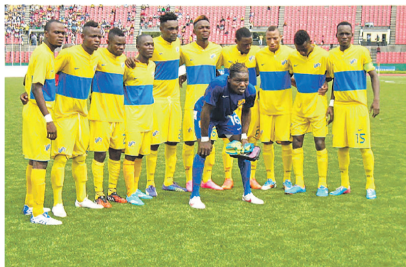
La JSP avance lentement mais sûrement

La Jeunesse sportive de Talangai (JST) devient provisoirement le dauphin de l'Athlétic club Léopards de Dolisie après sa courte victoire 1-0 le 29 février au stade Alphonse-Massamba-Débat devant l'Interclub, dans le cadre de la 13 e journée de la compétition.