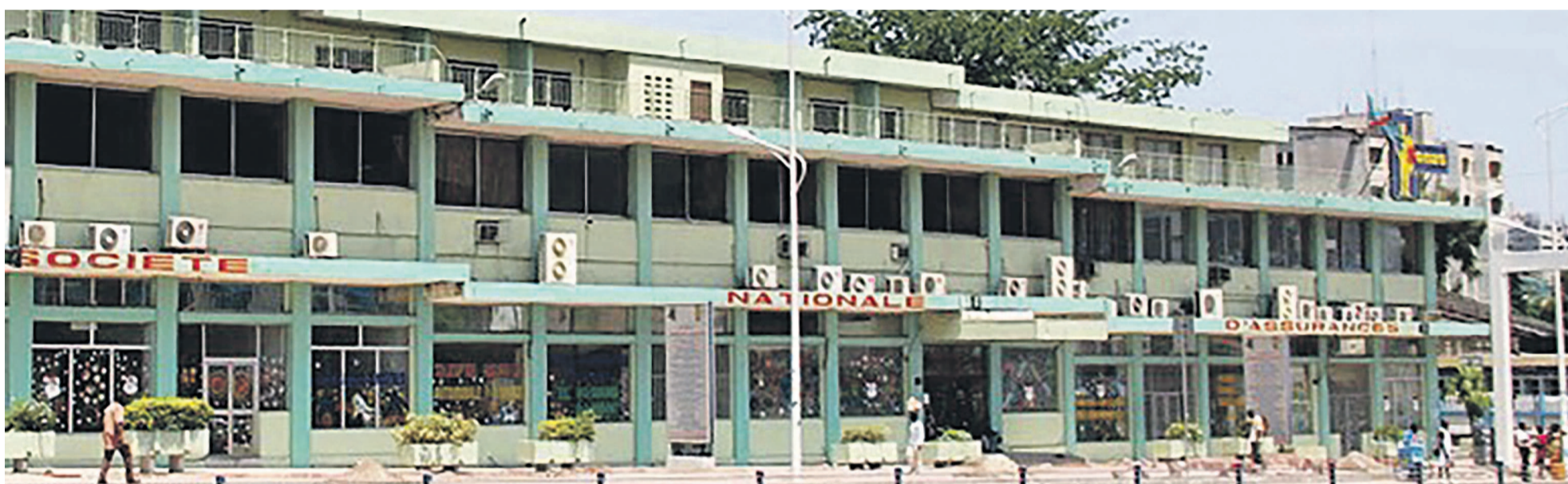
Le siège de la Sonas à Kinshasa.

Les grandes manœuvres ont débuté dans les milieux des affaires pour examiner les opportunités possibles dans un secteur verrouillé durant plusieurs décennies par l'entreprise pu-