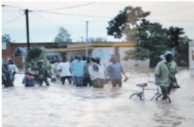
Une inondation dans un quartier de Pointe-Noire

Célébrée cette année sur le thème de «Protection civile et les nouvelles technologies de l'information», thème édifiant pour montrer l'apport des nouvelles technologies dans la protection de la population, la journée devrait s'attendre, au plan local, à l'organisation de certaines activités dans la ville, notamment une journée «portes ouvertes» pour montrer aux yeux des Ponténégrins son importance en leur présentant, à travers même la direction départementale de la sécurité civile relevant, bien sûr, du ministère de l'Intérieur et de la Décentralisation, des effets occasionnés par des calamités naturelles, des accidents et autres y compris les matériels de secours, l'exécution de manœuvres et de démonstrations en matière de secours, de sauvetage et d'extinction des incendies, l'animation de séances de sensibilisation des citoyens, particulièrement auprès des jeunes, aux différents risques, ainsi que la distribution d'affiches et de dépliants y relatifs. De nombreux lycéens, collégiens, intellectuels et habitants de la ville interrogés sur cette journée, déclarent sans langue de bois