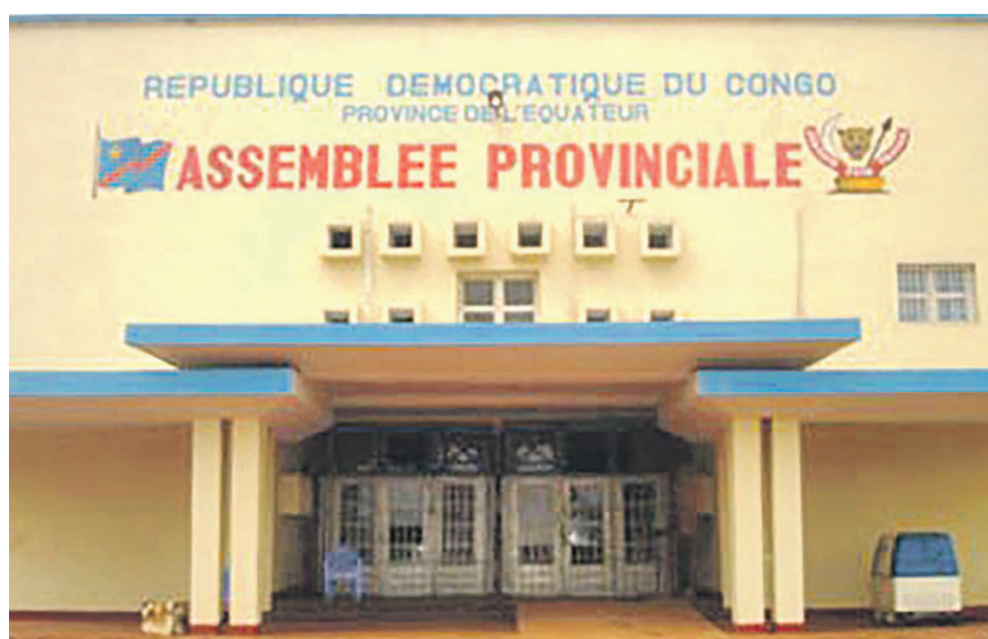
Siège de l'Assemblée provinciale de l'Équateur