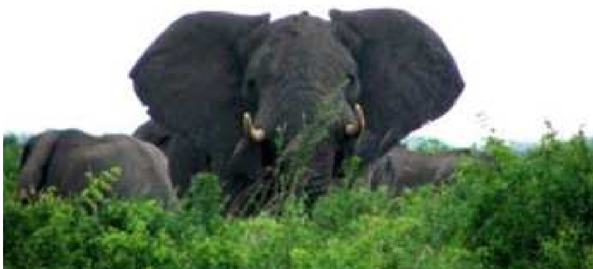
Des éléphants du parc des Virunga

« Cette action est une étape importante. Cependant, la RDC doit fournir plus d'effort, y compris la fermeture de ses marchés locaux illicites d'ivoire et l'augmentation de ses opérations anti-braconnage », a fait