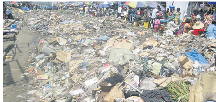
L'avenue de la Liberté au niveau du marché Miambanzila

Ces ordures sont là depuis des semaines et continuent de s'amonceler. Les odeurs nauséabondes qu'elles dégagent ulcèrent non seulement les vendeurs qui se situent à ce niveau mais également les personnes qui fré-