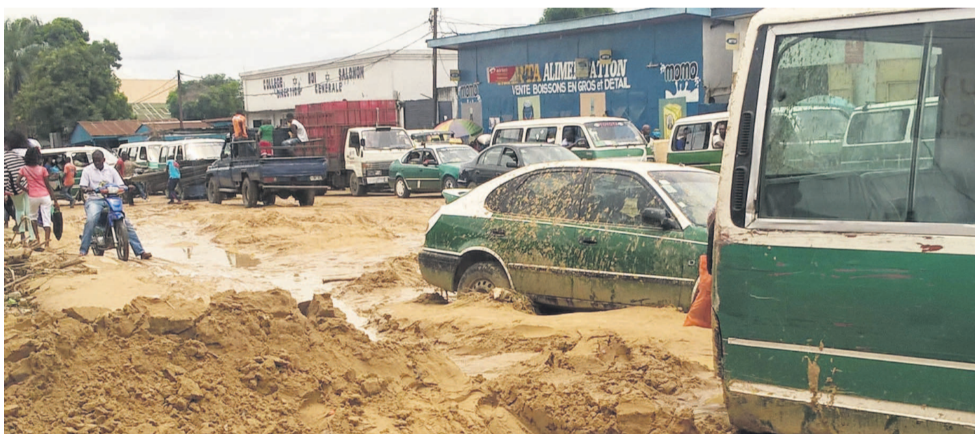
Des véhicules engloutis par l'ensablement à Mikalou