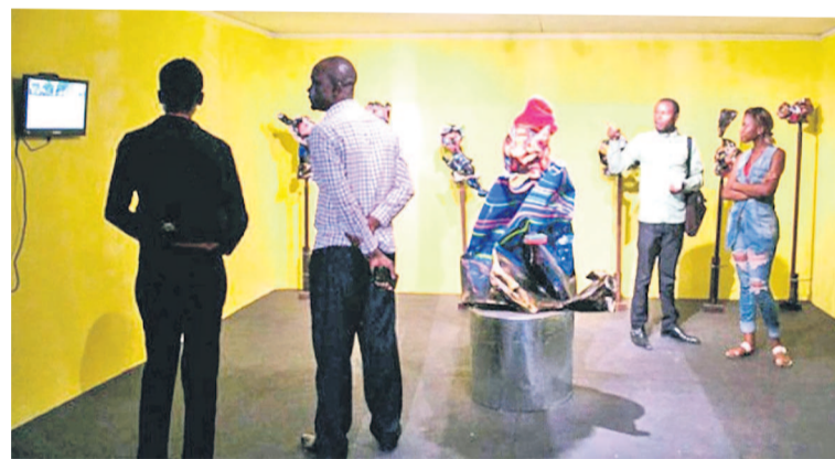
Une des expositions antérieures de Kin ArtStudio

tion de l'événement à venir par un souci de grande vulgarisation de l'art visuel qui, à son avis « n'est pas accessible à tous à Kinshasa, en République démocratique du Congo, voire dans différentes villes africaines ». Et d'ajouter à ce constat qu'il semble plus fami-