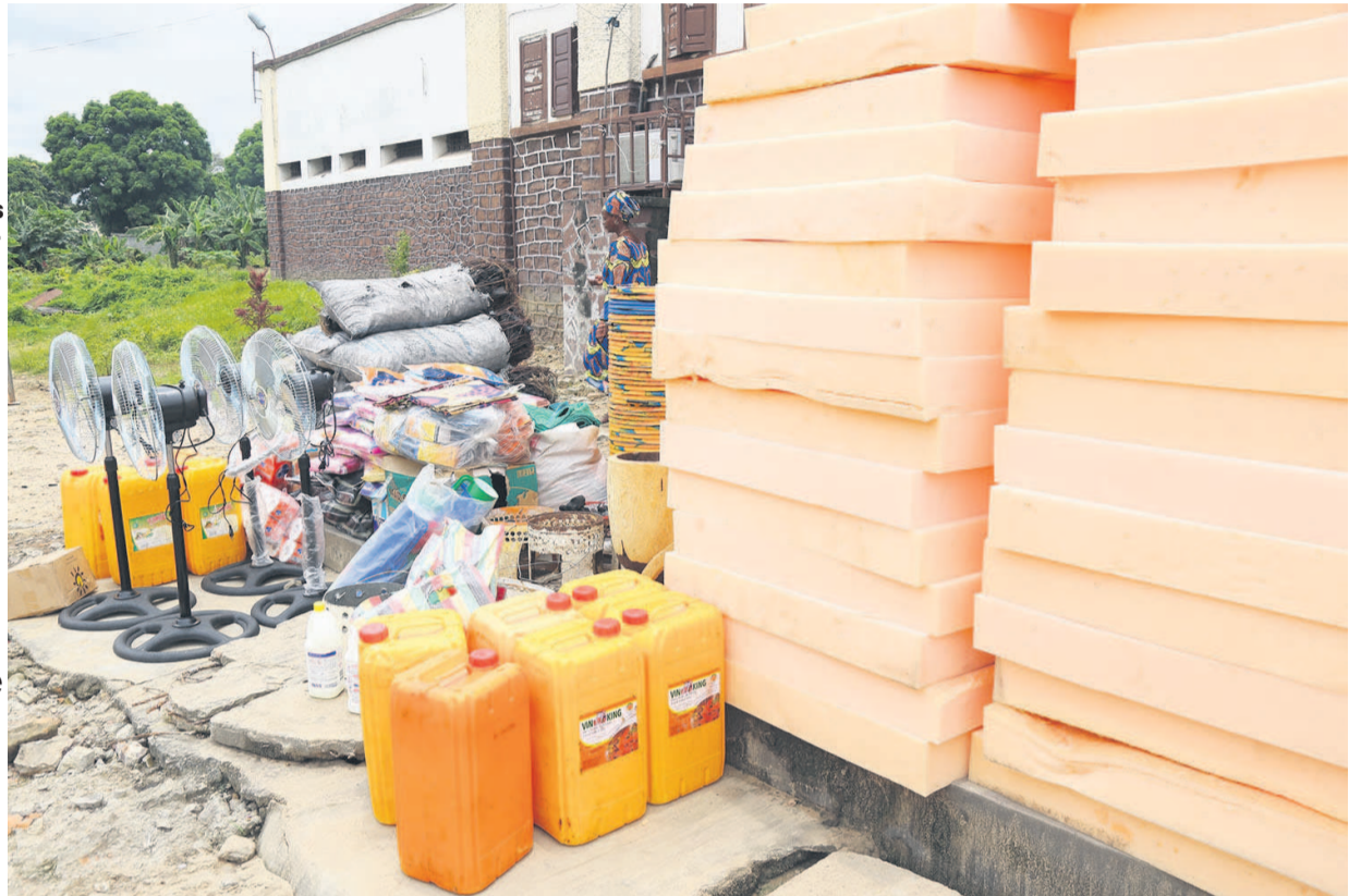
Un aperçu du don des MTNeuses aux détenues

C'est avec beaucoup d'émotion que les femmes détenues ont réceptionné ce don, en remerciant « la société MTN Congo et ses responsables pour cette marque d'attention et de considération ». Elles sont une tren-