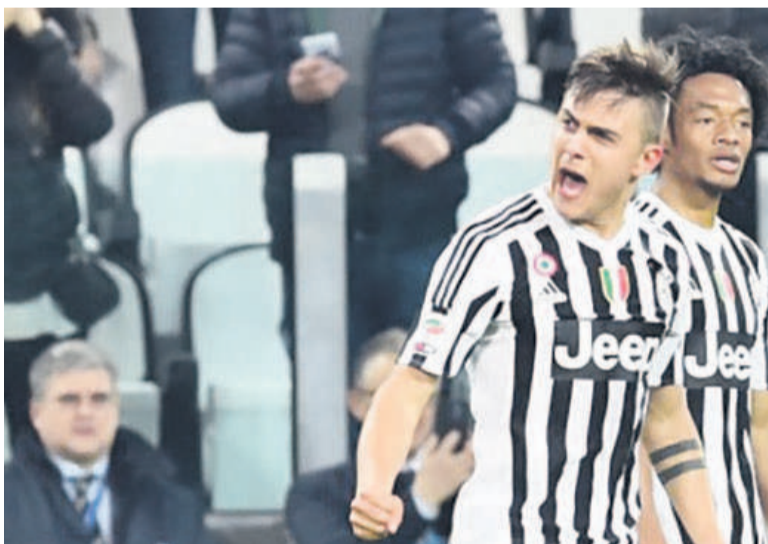
Paulo Dybala, le prodige argentin de la Juventus de Turin, est forfait pour le huitième de finale retour de la Ligue des champions chez le Bayern Munich: un coup dur pour la Juventus

L'attaquant argentin Paulo Dybala et le milieu de terrain italien Claudio Marchisio, deux titulaires indiscutables de la Juventus Turin, sont blessés et seront absents ce mercredi en huitième de finale retour de Ligue des champions face au Bayern Munich, a annoncé leur club mardi. Alors que la Juve, vice-championne d'Europe, a été tenue en échec 2-2 à l'aller à Turin, l'absence de ces deux éléments majeurs de l'équipe est un énorme coup dur pour l'entraîneur Massimiliano Allegri.