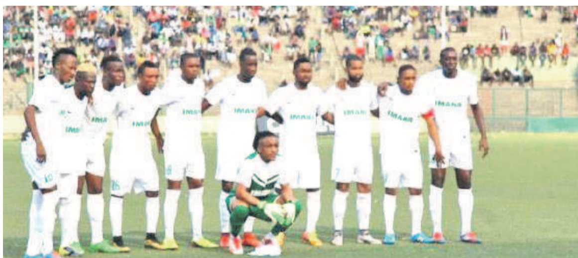
DCMP sanctionné par la Linafoot

DCMP est privé des recettes de cette rencontre, tout en étant sommée de réparer les préjudices corporels et matériels causés. La Linafoot envisage aussi de traduire en justice les auteurs des agressions. « En cas de récidive, l'équipe jouera son prochain match en huis clos. Pour atteinte à l'honneur et au prestige du championnat national et