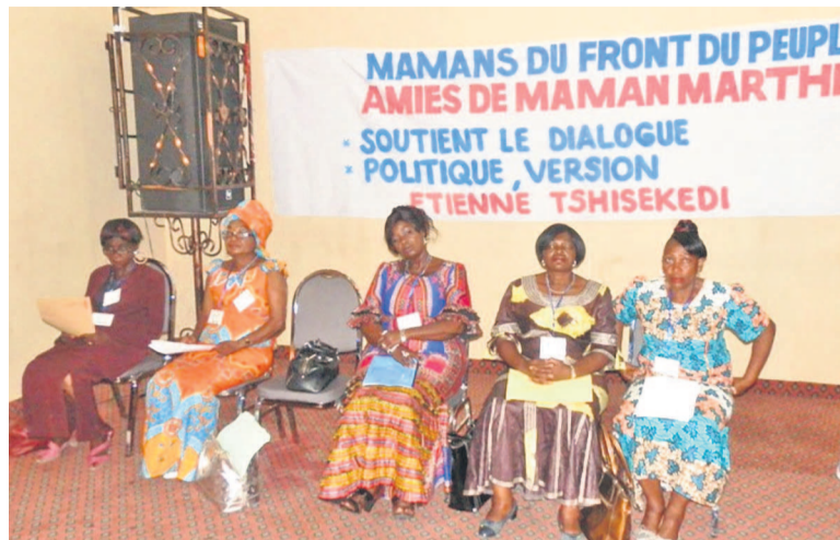
Les mamans membres de cette plate-forme

Les femmes du Front du peuple ont lancé, le 15 mars à l'hôtel Africana Palace, à Lingwala, les activités marquant le mois de mars, dédié, sur le plan international, à la femme. Pour ces femmes politiques et actrices sociales amies à Maman Marthe Tshisekedi, membres des partis et organisations alliés au lider maximo, Étienne Tshisekedi, ce mois est consacré au dialogue politique attendu dans le pays. À les en croire, le dialogue politique reste la seule voie royale pouvant sortir le pays du gouffre où il se trouve. C'est pourquoi, pendant les travaux, ces femmes congolaises vont réfléchir sur leur apport pour l'organisation du dialogue en RDC. Au cours de la cérémonie de lancement de ces activités, en plus des exhortations du coordonnateur et porte-parole du Front du peuple, Jean-Pierre Lisanga Bonganga, les six autres