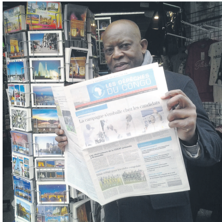
Ici Dépêches du Congo en vente sur les Champs Elysées de Paris en France