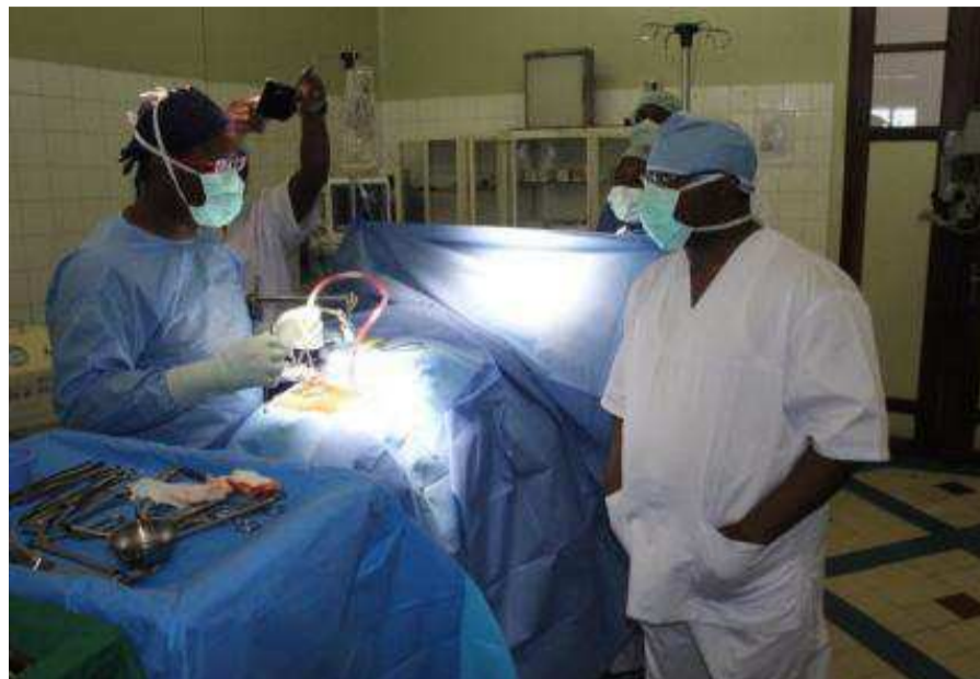
Le ministre de la Santé assiste à l'opération de hernie discale