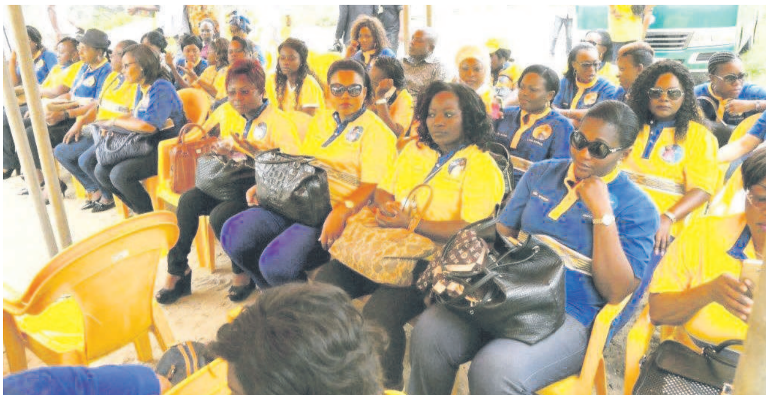
MTN, Everywhere You Go!

Somme toute, les MTNeuses ont salué cette initiative qui leur a permis de se remettre en cause et d'envisager l'avenir au sein de l'entreprise avec plus d'optimisme et de détermination, pour maintenir MTN Congo au rang de leader.