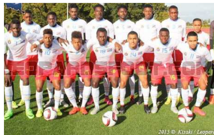
Les Léopards U20 aile Europe en 2015

cière de la part du gouvernement- annihile bien d'efforts et de sacrifice consentis. Alors que le gouvernement se cabre à ne financer que trois disciplines (football senior homme, taekwondo et handball), la Fécofa n'arrive visiblement pas à trouver des sponsors pour booster le développement de football d'âges