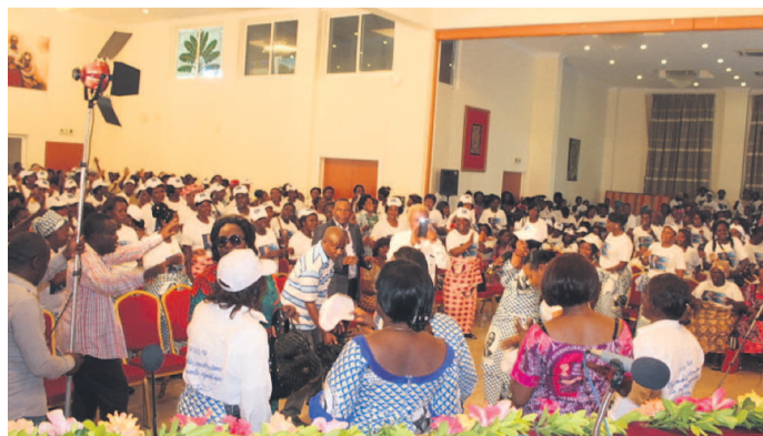
Une vue des femmes lors de la rencontre