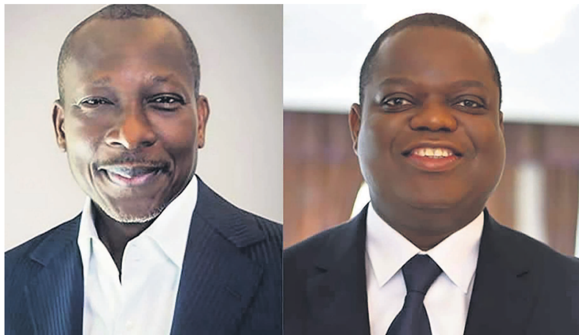
Sébastien Ajavon et Patrice Talon

MM. Zinsou et Talon sont arrivés en tête du premier tour de la présidentielle du 6 mars, avec respectivement 27,11% et 23,52% des voix, selon les résultats annoncés dimanche par la Cour constitutionnelle. Un second tour doit les départager dimanche prochain. M. Ajavon s'est imposé comme le troisième homme du scrutin en obtenant 22,07% des voix. Réagissant aux résultats dimanche soir, M. Talon, qui a qualifié M. Ajavon de «grand homme» et de «grand opérateur économique», a dit «compter sur lui pour la suite». M. Talon a aussi appelé «tous les autres» candidats à le rejoindre, dont l'économiste Abdoulaye Bio Tchane (8,29%) et l'ancien Premier ministre Pascal Irénée Koupaki (5,6%), tous deux