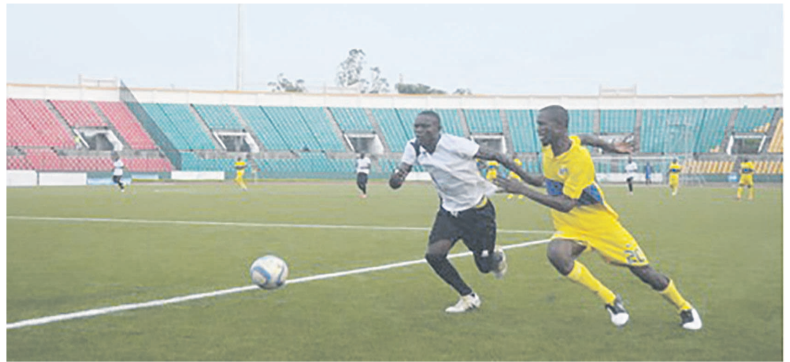
Phase de jeu du match JST-Nico Nicoyé.

Sans chercher de prétextes, l'entraîneur de Nico-Nicoyé, Hilaire Bamoussiba, a souligné que son effectif n'était pas au grand complet. Quatre de ses titulaires n'ont pas été alignés certains pour blessure, d'autres pour accumulation de cartons jaunes... « Nous avons péché dans la