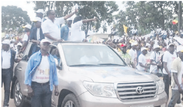
L'arrivée du candidat Denis Sassou N'Guesso à Dolisie