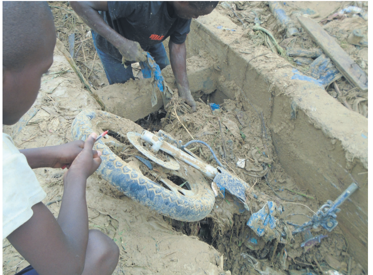
Des gens fouillant la Djakarta engloutie par le sable

Rappelons que les pluies des 2 et 3 mars derniers avaient fait huit morts dans les quartiers sud et ouest de la ville, notamment à Mfilou et Makélékélé. Les familles endeuillées ont reçu une assistance financière