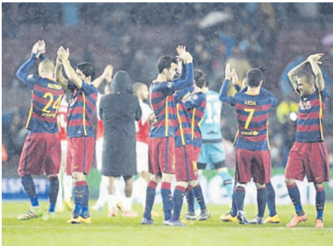
Emmenés par un grand Luis Suarez, le Barça se qualifie sans forcer face à Arsenal

s'est chargé d'éteindre les dernières flammèches adverses avec une claquette sur un coup franc d'Alexis Sanchez (80 e ).