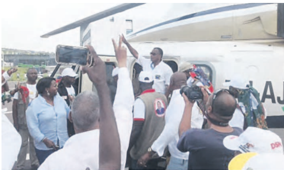
Le candidat Denis Sassou N'Gusso à son arrivée à Kintélé