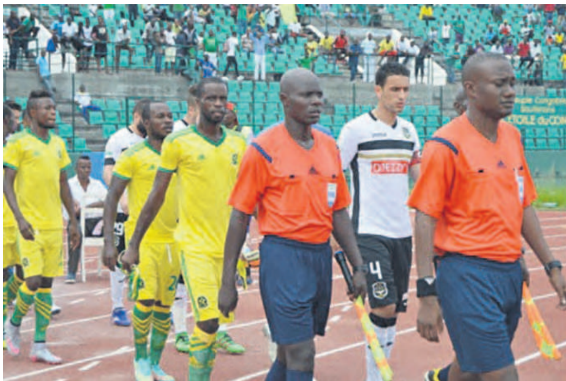
L'Etoile du Congo et Sétif partent à 50-50

Selon lui, son équipe jouera sa chance à fond pour rééditer l'exploit de V Club Mokanda