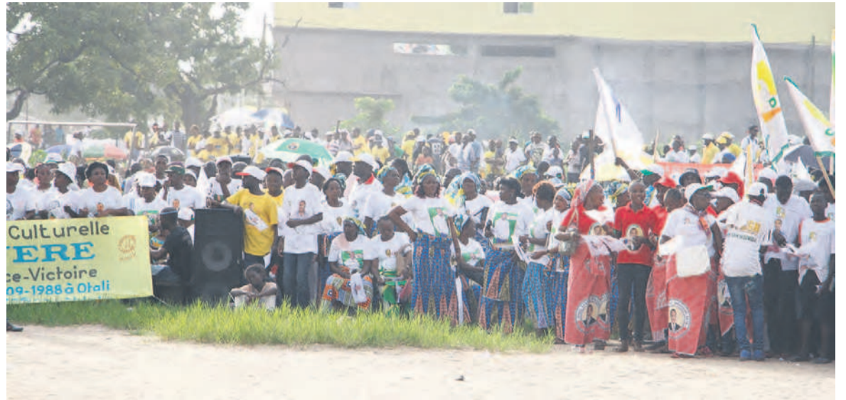
Une vue de la foule