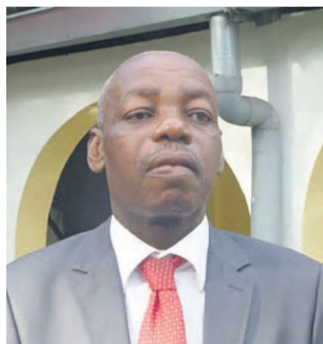
Pierre Siméon Athomo Ndong

Pierre Siméon Athomo Ndong : La mission de la CEEAC se félicite de ce que les partenaires majeurs qui accompagnent ce processus électoral en matière de paix, de sécurité et de gouvernance soient présents à Brazzaville pour soutenir le peuple congolais dans cette échéance capitale de la vie politique de son pays.