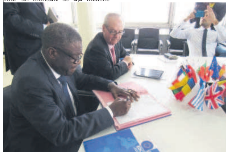
Signature des documents de la convention

Dans le cadre de ce projet, une éducation de rattrapage devra être offerte aux enfants et des forma-