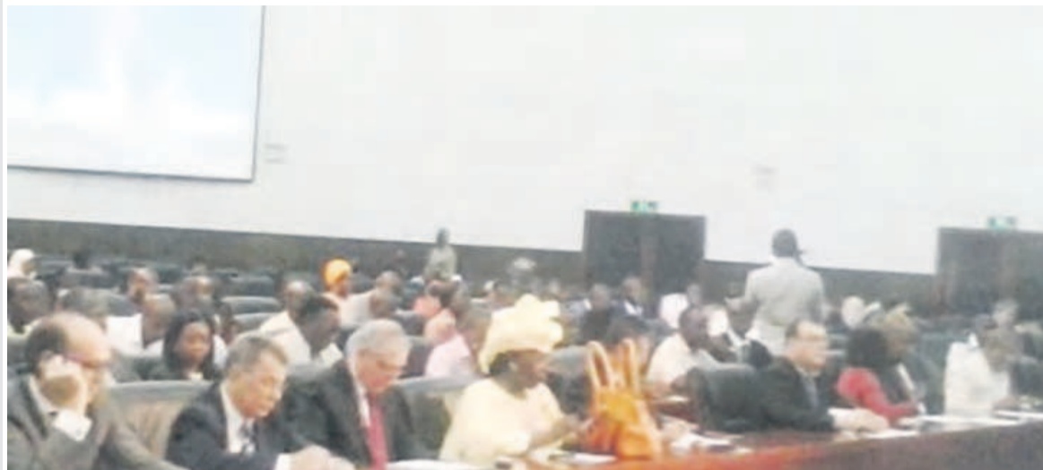
Le corps diplomatique et les délégués des observateurs internationaux