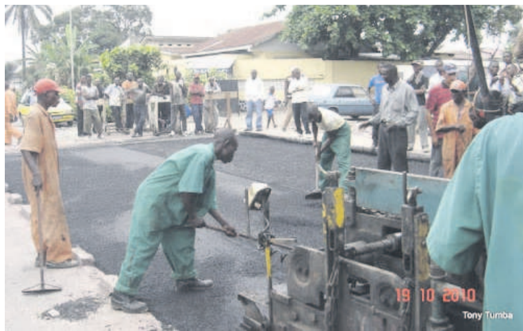
Réhabilitation des routes à Kinshasa

Dans un communiqué du 17 mars, l'ONG attend notamment du gouvernement de la RDC de procéder à l'audit de toutes les infrastructures routières réalisées dans le cadre de ce contrat de collaboration; d'établir les responsabilités des personnes impliquées dans la réalisation défectueuse des infrastructures à Kinshasa; de faire traduire en justice toutes les personnes physiques et morales impliquées dans la réalisation des dites infrastructures et de procéder à l'indemnisation des victimes des démolitions méchantes et illégales. L'Asadho a, par ailleurs, sollicité du gouvernement de la République populaire de Chine d'ouvrir une enquête sur le comportement des entreprises chinoises chargées de la réalisation de ces infrastructures à Kinshasa, alors que la population de la RDC a été appelée à exiger que les personna-