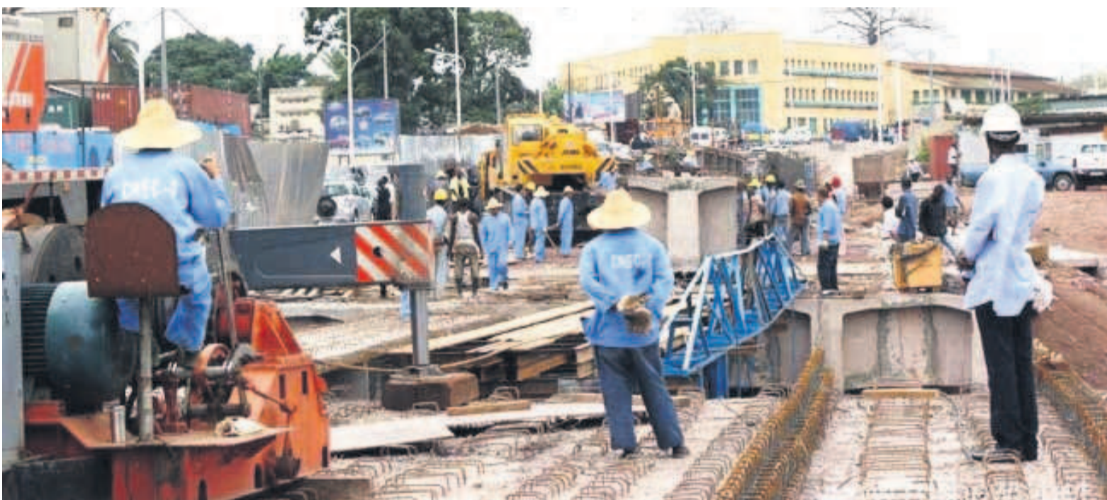
Réhabilitation d'une route dans le cadre du contrat chinois

Décrivant la qualité des ouvrages dans le cadre de la mise en œuvre de la convention de collaboration entre la RDC et le Groupement d'entreprises chinoises, l'Association africaine de défense des droits de l'homme (Asadho) pense qu'un contrôle sérieux est nécessaire pour déterminer l'état actuel de ces infrastructures et des sommes d'argent investies pour leur réalisation afin d'établir les responsabilités.