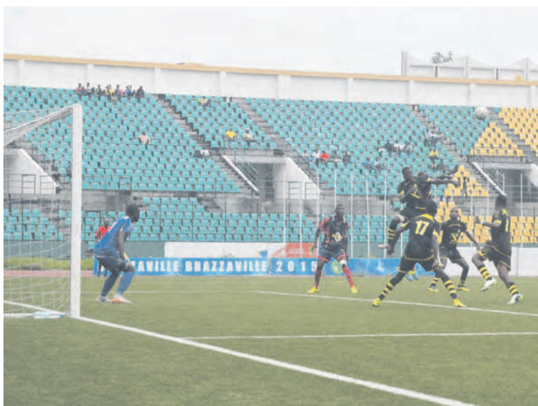
Une vue de la rencontre entre Diabes rouges et FC Kondzo

Les diabolins ont infligé à leur adversaire de la 15 ème journée une lourde défaite de 5-0.