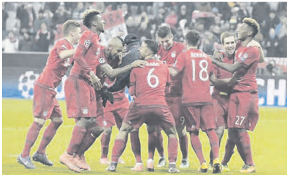
Longtemps menés au score, les Munichois se sont imposés au terme d'un match passionnant

Un soulagement énorme pour l'entraîneur Pep Guardiola. Le Catalan, qui a toujours atteint le carré final lors de ses sept précédentes participations à la tête du Barça puis du Bayern, est particulièrement sous pression pour sa troisième et dernière tentative en Bavière avant de rejoindre Manchester City cet été. Fidèle à sa devise «Fino alla fine», la Juventus Turin, avec un énorme Paul Pogba buteur, s'est battu jusqu'au bout, tenant l'exploit jusqu'aux dernières secondes du temps réglementaire. Maestro de