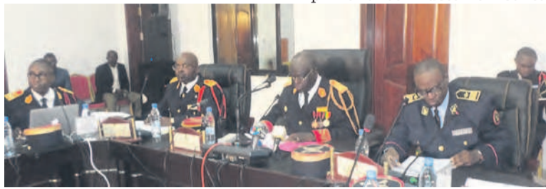
Les membres du comité de modernisation de la douane en plein travaux

Bien que la situation soit générale, le DG des douanes a plus pointé du doigt les services des douanes de Pointe-Noire, certainement au regard des défaillances consta-