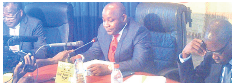
le Dr Christian Ernest Makosso clôturant les travaux

En louant les efforts du gouvernement pour les investissements qu'il ne cesse de consentir en vue de