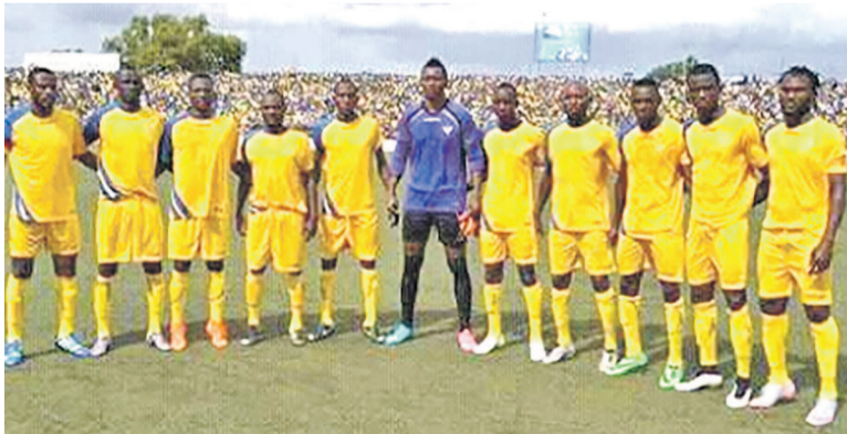
Le FC Saint-Éloi Lupopo traverse une passe difficile au Play-Off de la Division 1