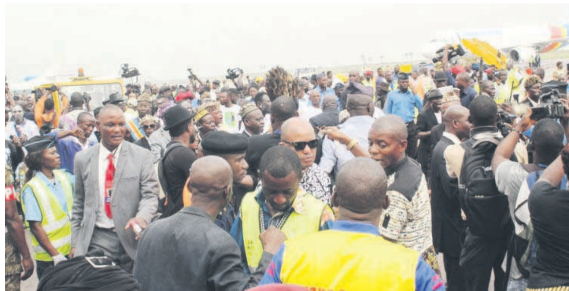
Affluence des fanatiques à l'aéroport

té d'une part que des jeunes chantaient plutôt que de pleurer, et scandaient des cris de Viva la