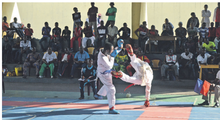
Un combat de la compétition

150 compétiteurs de la ville capitale se sont mesurés. Les uns ont décroché leurs tickets pour le championnat national en individuel et par équipe concernant les katas et kumités, les autres non.