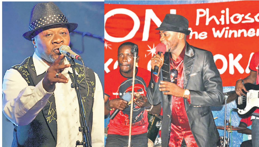
Jules Shungu Wembadio dit Papa Wemba

C'est ce vendredi 29 avril 2016 à partir de 18h au bar dancing Impact (ex Le Talassien), au 53 de la rue Tchitondi, avenue Marien Ngouabi en diagonale de l'église kimbanguiste de Talangaï que Djason philosophe the Winner et l'orchestre Super Nkolo Mboka vont prêter un concert pour rendre hommage à Papa Wemba, l'icône de la musique africaine et mondiale.