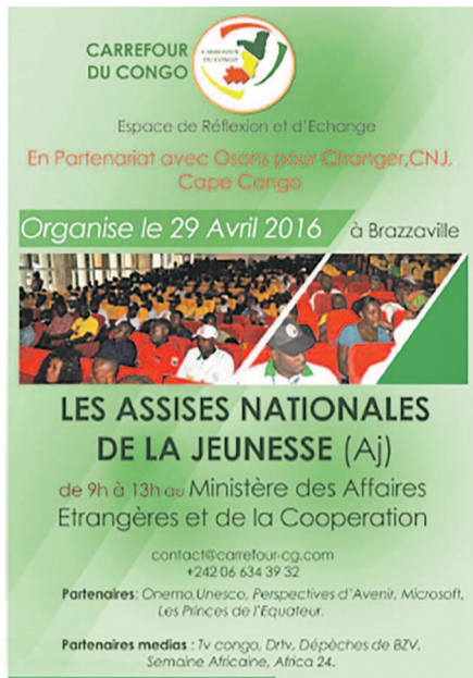
L'affiche annonçant l'événement

Ainsi, plusieurs thèmes seront développés au cours de ces assises, notamment le civisme et la culture de paix ; la formation aux métiers et l'emploi ; l'innovation et les TIC ; le Monitoring et la jeunesse ; l'entrepreneuriat et l'investissement. Selon les initiateurs de cette rencontre, la problématique du développement des jeunes (formations techniques et professionnelles, emploi...) doit être au cœur d'un système sociétal et éducatif qui ambitionne d'assurer le succès de la jeunesse. « Chaque année plusieurs milliers de jeunes quittent le système éducatif sans qualification. S'il existe donc des jeunes sans qualification et souvent sans métier, il existe aussi des métiers sans