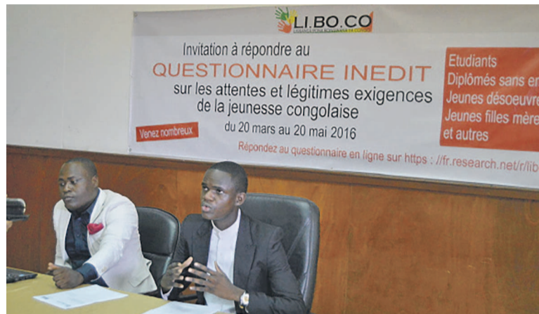
Conférence de presse de l'association Liboco

ra un mémorandum sur la situation détaillée de la jeunesse congolaise. L'objectif visé est de faire en sorte que la jeunesse soit intégrée dans tous les programmes de développement car les jeunes contribuent au développement du pays en tant qu'innovateurs, entrepreneurs, consommateurs, citoyens et membres