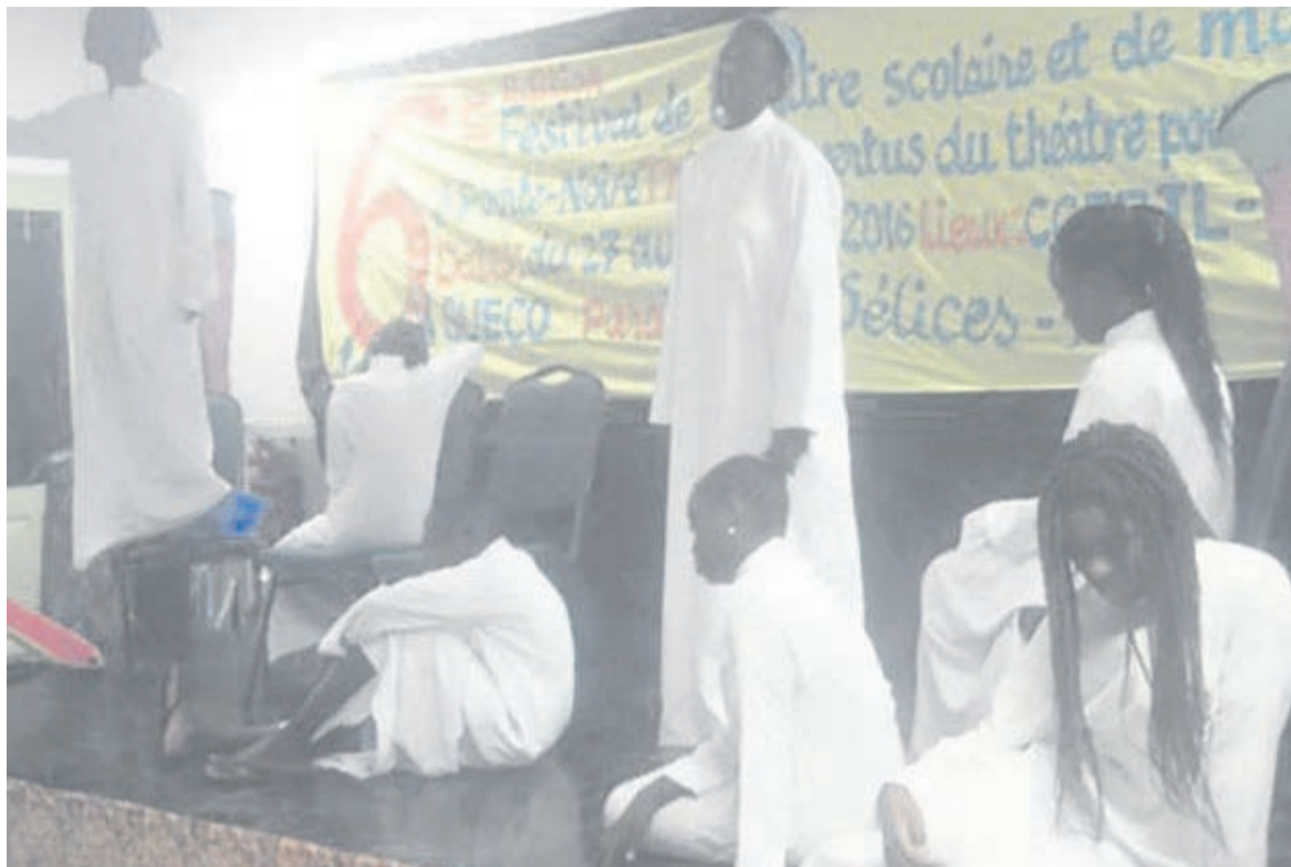
Les élèves de Dom Helder Camara jouant l'étudiante noire de Soweto