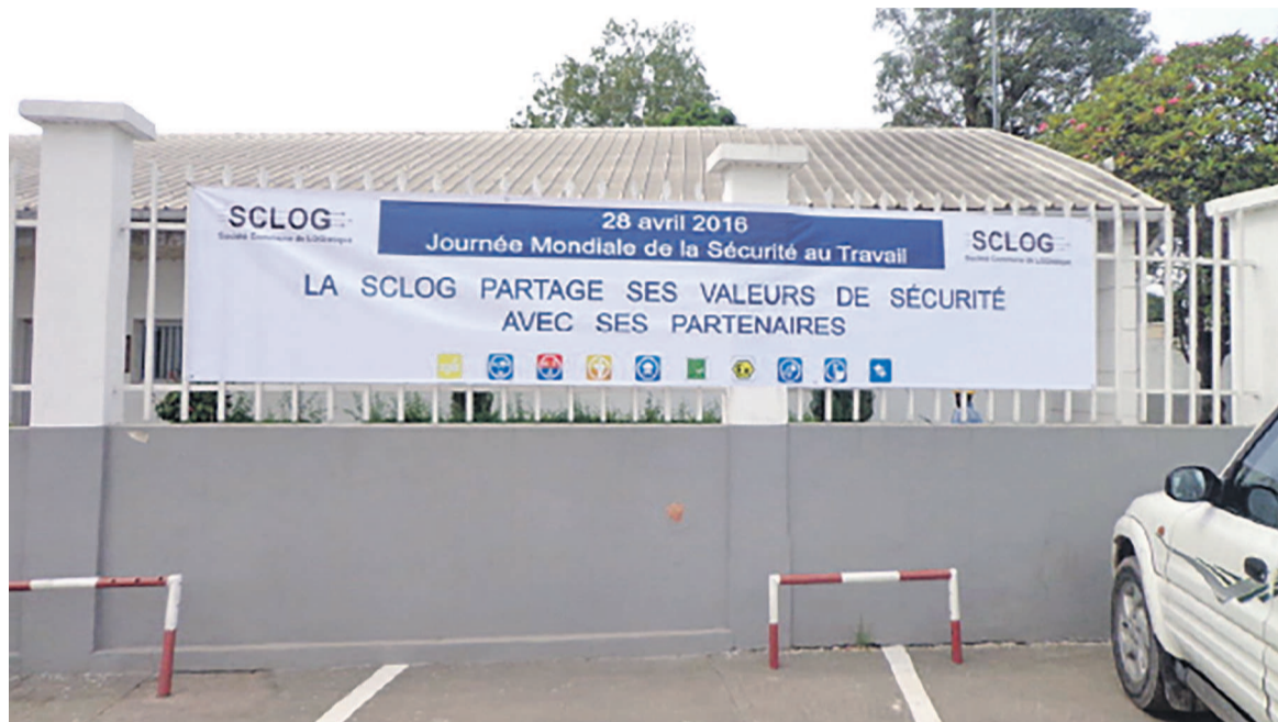
Banderoles et affiches de la SCLOG pavées sur les grandes artères de Brazzaville pour commémorer la journée mondiale de la sécurité au travail

Le monde entier commémore le 28 avril, la journée internationale de la sécurité au travail. Au Congo, la Société Commune de Logistique (SCLOG) a enregistré de nombreuses évolutions en matière de sécurité au travail ces dix dernières années.