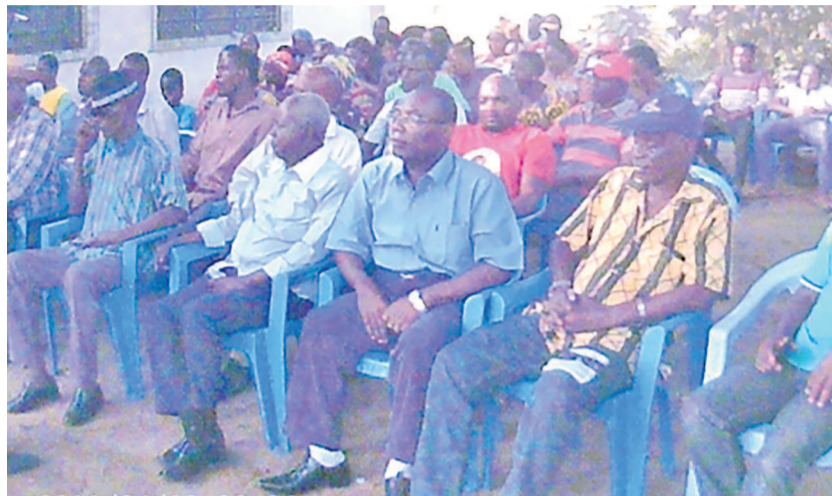
Les habitants de Mbama

Dans un message rendu public le 27 avril à Brazzaville, les habitants du quartier Mbama, situé à Bacongo dans le deuxième arrondissement de Brazzaville, ont remercié le président de la République, Denis Sassou N'Guesso, pour avoir nommé au poste de Premier ministre chef de gouvernement, un de leur ancien voisin en la personne de Clément Mouamba.