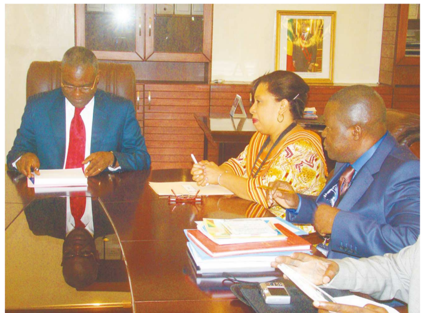
Le ministre Anatole Collinet Makosso s'entretenant avec la représentante de l'Unesco, Elisa Afonso de Santana

L'Unesco s'est aussi dite intéressée par la question de l'économie numérique qui ne peut se faire qu'avec des enseignants bien formés dans