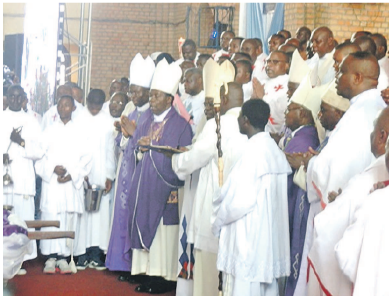
La bénédiction finale avant la levée de corps