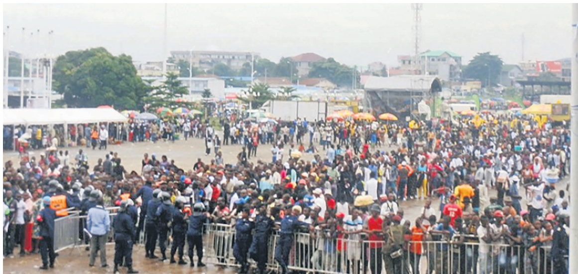
Papa Wemba qui avait tiré sa révérence loin de son fief, Kinshasa sa ville bien-aimée. Ils avaient décidé de prendre leur mal en patience et l'ont fait dans la discipline encadrés par des policiers courtois.

Les Kinois, on l'a vu, tenaient à rendre leur dernier hommage à