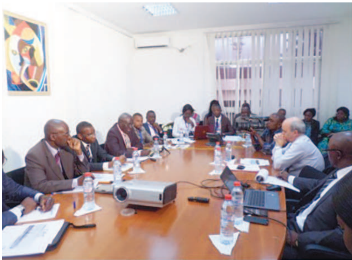
Les participants lors de la première réunion entre Arsel et la société CEC

Créée par une loi en avril 2003, l'ARSEL a pour mis-