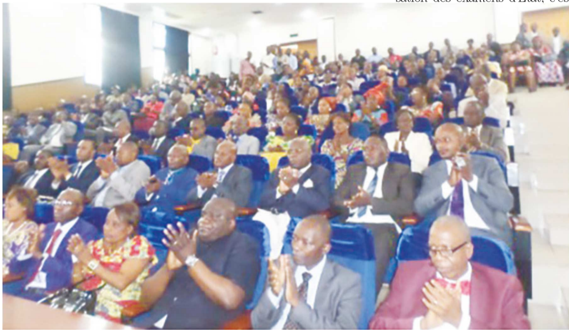
Une vue de la salle à la cérémonie d'ouverture

Ainsi, au terme des discussions, plusieurs recommandations ont été formulées. Il s'agit notamment de l'insertion à terme de la notion de développement durable dans les programmes d'enseignement ; la dotation des établissements