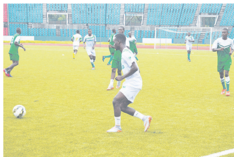
Séance d'entraînement des Diables rouges juniors