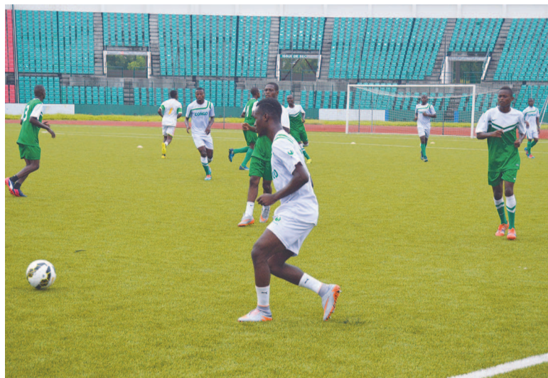
Séance d'entraînement des Diables rouges juniors

Plus d'une vingtaine des Diables rouges juniors convoqués ont amorcé la préparation à Brazzaville. Le match aller se jouera à Ouaga le 21 mai prochain.