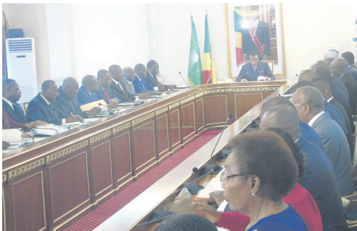
Le Conseil des ministres