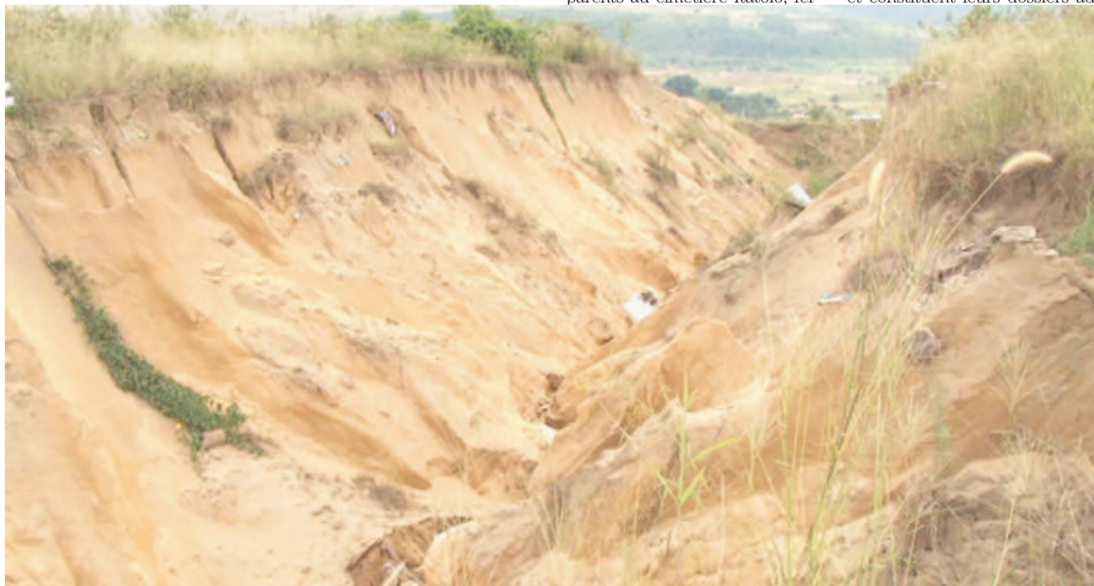
Les cimetières s'effondrent dans un ravin à Itatolo

En effet, deux ravins de plus de dix mètres de profondeurs chacun, provoqués par des pluies diluviennes, ont occasionné l'écroulement de plusieurs tombes.