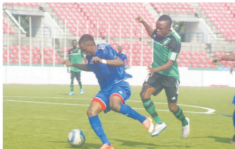
V Club Mokanda peine à enchaîner

Le joueur du FC Kondzo peu inspiré au début du match, venait de se racheter, après avoir gâché plusieurs opportunités notamment celle de la 17e minute. Bakaki était