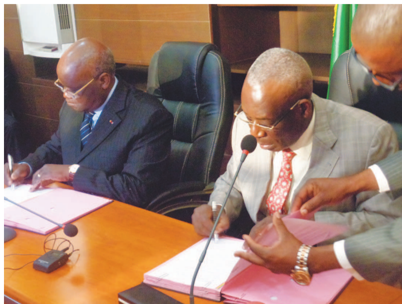
La signature du procès-verbal

A cet effet, le gouvernement avait décidé de confier le paiement des arriérages des pensions de la CRF à la Caisse congolaise d'amortissement (CCA). Quant à la CNSS, le règlement de la dette sociale amorcé par l'Etat n'a pas été poursuivi après le paiement de