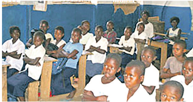
Les élèves dans une salle de classe

Le projet à été lancé par le directeur du Programme national de la santé de l'adolescent (PNNSA), Fidele Mbadu, au collège Boboto au cours de l'atelier de présentation des outils GREAT organisé par Save the children en collaboration avec ses partenaires.