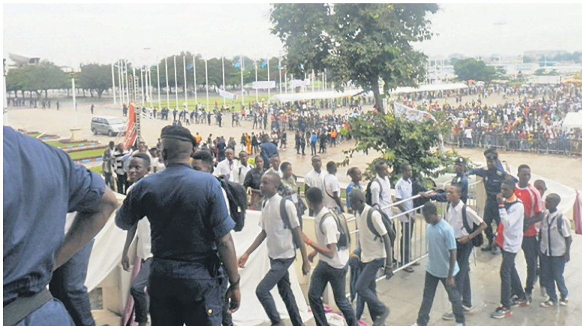
Les élèves gravissant les marches à quelques mètres de l'entrée du lieu mortuaire