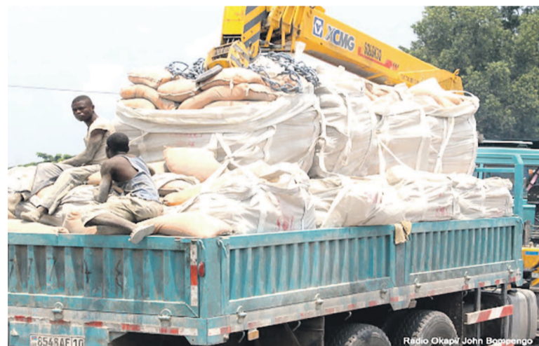
Transport de sacs de ciment pour les travaux de réfections des routes à Kinshasa

Le gouvernement de la République avait, en 2015, condition-