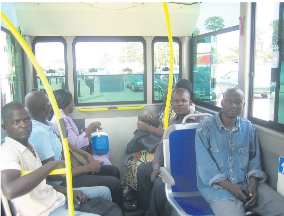
Des usagers empruntant le bus électrique

Pour l'heure, les responsables de Blue Congo ne communiquent pas encore sur le tarif et la date de début de commercialisation de ces bus électriques.