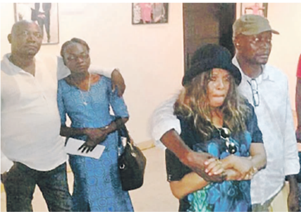
Princesse Joss Kalim en larmes à la vue des photos de son premier concert dans Viva la Musica Photo

Impossible de rester insensible aux clichés qui tapissent les murs du hall d'entrée du centre culturel belge et de la salle Magritte, depuis le 13 mai, cette exposition sert à l'artiste à présenter à sa façon la star internationale dont il a immortalisé le souvenir par des moments inédits captés à l'aide de son objectif.