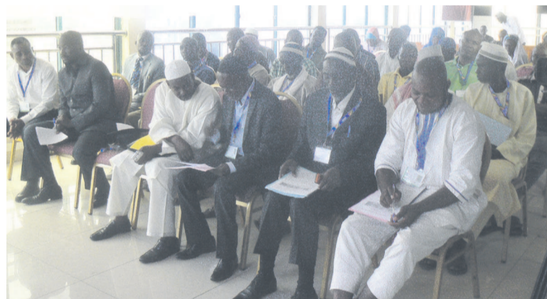
Une vue des apprenants

Malgré le fait que l'islam soit parfois réputé à tort comme une religion renfermée et assez stricte dans l'adoration divine, le représentant du Conseil Supérieur Islamique du Congo (CSIC), El Hadj Youssouf Ngolo, a prouvé néanmoins le contraire en congratulant le choix des thématiques du colloque et en