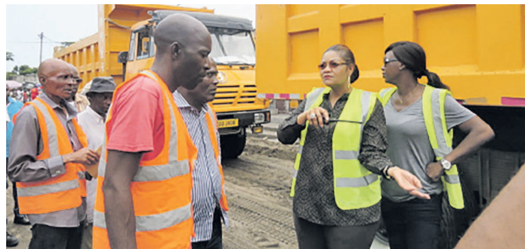
La maire de Ngoyo s'entretenant avec les ouvriers photo à ce constat amer, l'administrateur-maire a contraint les vendeurs de libérer ses lieux et a instruit la force publique de faire appliquer les mesures de déguerpissement.

Cette opération se poursuivra la semaine prochaine dans les autres marchés de l'arrondissement 6 Ngoyo. L'objectif étant de donner un coup de pouce aux hommes et aux femmes qui vendent au marché en assainissant leur lieu de travail et s'imprégner des difficultés qui sont les leurs, notamment le problème d'évacuation quotidienne des ordures. « Nous sommes à la nouvelle République, nous voulons faire