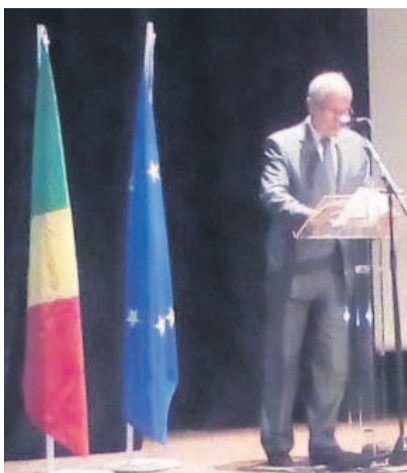
L'ambassadeur de France au Congo prononçant son dernier discours