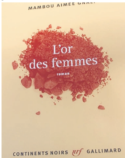
Le roman L'or des femmes

Paru cette année aux éditions Gallimard, collection Continents noirs (France), ce roman de 163 pages s'ouvre par un proverbe vili : «Bakala wolo », qui veut dire en français «l'homme c'est l'or». L'or des femmes est une révolte, un plaidoyer en faveur des femmes marginalisées, les jeunes femmes et les femmes enchaînées par la tradition, notamment le Tchikumbi. Un rite Vili (ethnie des côtes du Congo) d'initiation des filles nubiles, pratiqué avant dont elle évoque les valeurs, mais dénonce en même temps les méfaits sur la jeune fille et la femme qui payent le lourd poids de la tribu et de la tradition.