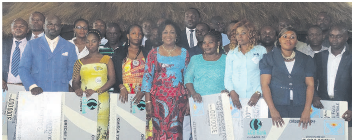
Antoinette Sassou N'Gusso posant avec les bénéficiaires

À l'initiative de la Fondation Congo Assistance, trente jeunes congolais porteurs des micro-projets de croissance ont reçu chacun trois millions FCFA pour développer leurs activités dans divers domaines.