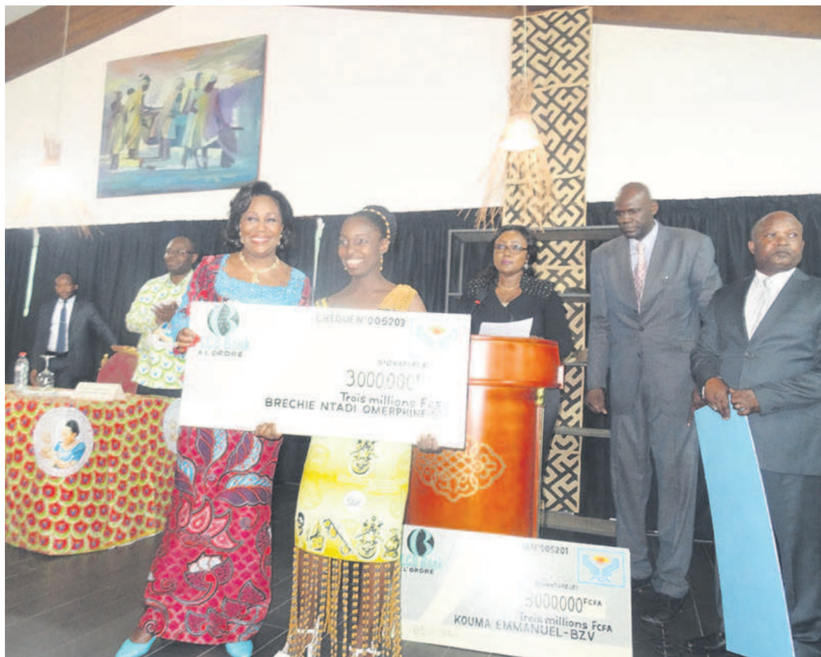
Antoinette Sassou N'Guesso posant avec une bénéficiaire