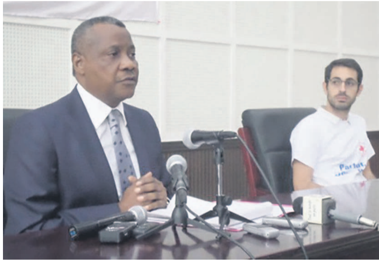
Le président de la Croix-Rouge congolaise et le chef de délégation de la Croix-Rouge française

-Rouge congolaise, avec ses lignes de force et ses insuffisances. Dans un long exposé, le président de la Croix-Rouge a parlé des activités de cette