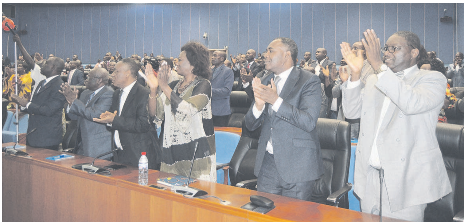
Le Premier ministre ovationné par les acteurs du pôle du consensus de Sibiti/ Crédit photo Adiac.