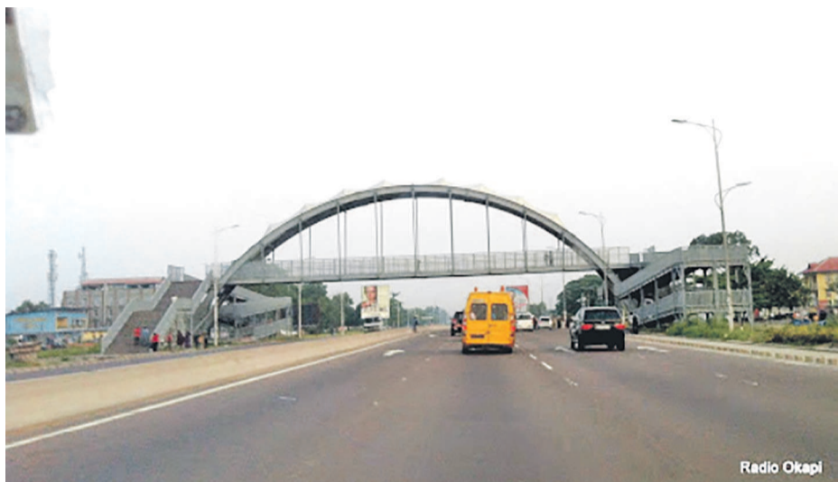
Une passerelle sur le boulevard Lumumba réhabilitée

Dans le cadre de ce projet, les travaux envisagés seront effectués sur cinq artères de la capitale congolaise.