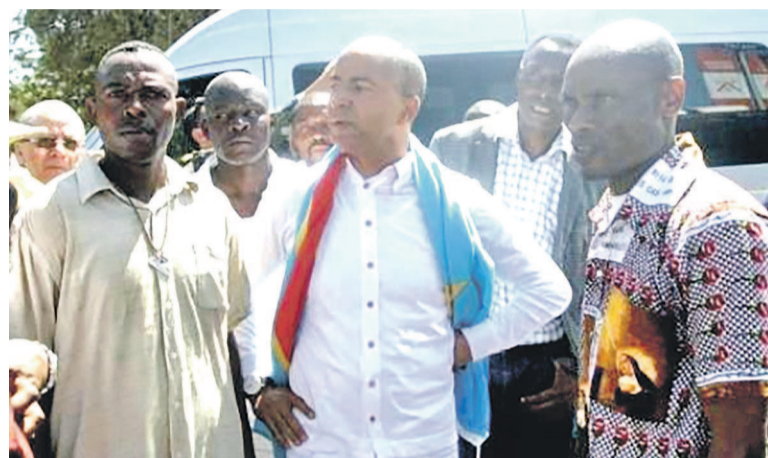
Moïse Katumbi à l'avant-plan