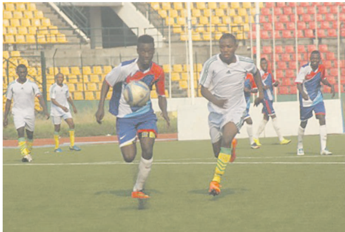
Le FC Racine en bleu jouera le deuxième tour de la Coupe du Congo

Les Diables noirs, tenant du titre seront reçus le 2 juin par Aigles sport après le match Ajax de Ouenzé-JS Ollombo. L'Athlétic club Léopards sera accueilli par Asia, le 5 juin à Dolisie. L'Etoile du Congo se déplace dans la Likouala pour affronter à la même date Interclub d'Impfondo. La Jeunesse sportive de Talangaï croisera toujours le 5 juin dans la Cuvette Ouest AS Olympic pendant que l'Interclub de Brazzaville sera accueilli par Saint-Michel de Ouessou. Duel des Aiglons aux allures d'un match de famille à Djambala ce dimanche. Le Club athlétique renaissance aiglons Cara de Brazzaville jouera contre Cara de Djambala.