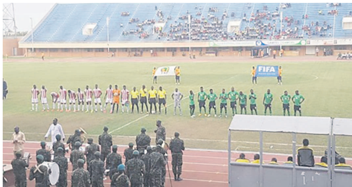
Après une courte défaite au Togo, la Zambie a fait match nul en Gambie