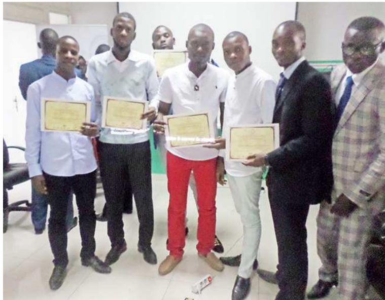
Les étudiants récipiendaires