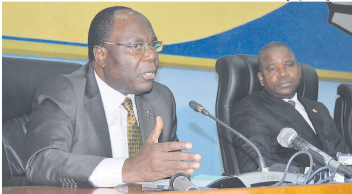
Le Premier ministre remerciant le pôle de consensus de Sibiti

« Plus de 150 partis politiques, plus de 500 associations et une multitude de personnalités rassemblés au sein du pôle de consensus de Sibiti s'engagent à vous soutenir dans votre combat qui est aussi le leur. (...) Il est question d'aller tous de l'avant », a déclaré Pierre Ngolo s'adressant au Premier ministre, Clément Mouamba, au nom dudit pôle dans sa diversité, ce 31 mai à Brazzaville. Des propos acclamés à tout rompre, par les représentants des partis politiques et associations, présents au Palais des Congrès. Autant dire que le pôle de consensus de Sibiti veut voir le chef du gouvernement réussir sa mission à la tête de l'exécutif. Le Premier ministre, pour sa part, ne pouvait rester sans