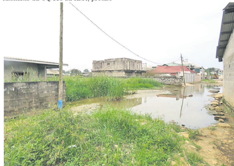
L'Avenue séparant la zone CTI à la Maison d'arrêt de Pointe-Noire»

Angoissés, tourmentés et quasiment sinistrés, les habitants du quartier CQ118 lancent les cris de détresse à l'endroit des autorités nationales pour trouver une solution adéquate à cette situation déplorable. Depuis 2011, les habitants du CQ 118 au KM4, précisé-