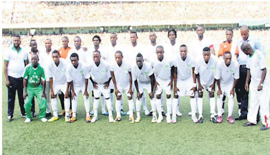
DCMP de Kinshasa