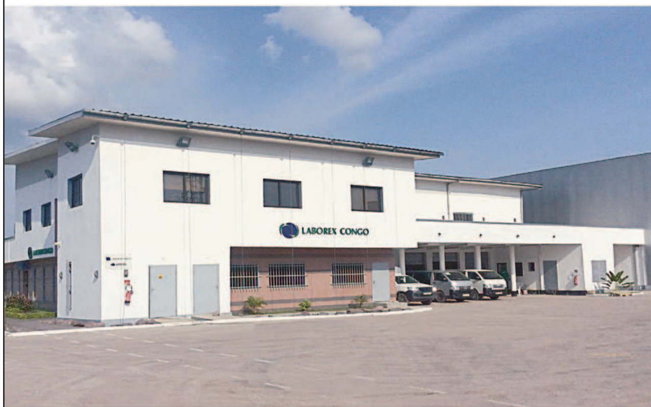
Nouveau bâtiment Laborex Congo