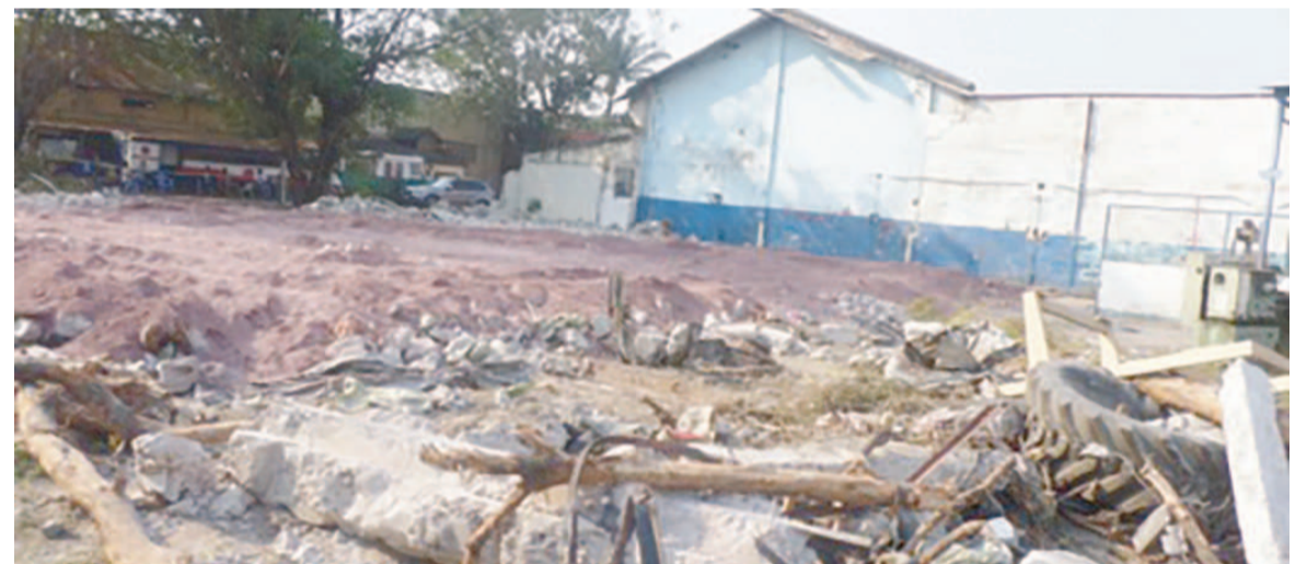
Les travaux de démolition engagés sur les lieux

Situé à Mpila, dans le 5 e arrondissement de Brazzaville, Ouenzé, en diagonale de la CFAO, le domaine abritant l'ancien atelier central de réparation de la Société nationale de distribution d'eau (SNDE) est en proie à des travaux de construction