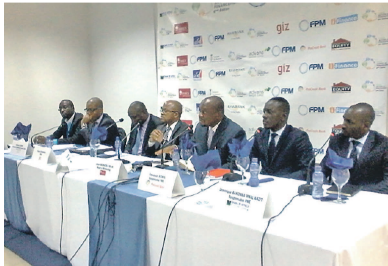
Une vue du panel des intervenants à la conférence de presse

Proximité et formation étaient les maîtres-mots entendus, le 16 juin, des institutions de financement à l'occasion de la conférence annon-