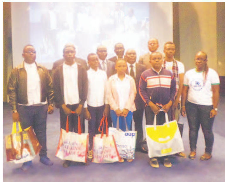
Les autorités posant avec les six candidats ; crédit photo Adiac

Le ministère des Affaires sociales, de l'action humanitaire et de la solidarité a organisé en partenariat avec l'Unicef, une cérémonie solennelle le 17 juin au ministère des Affaires étrangères pour commémorer la fête de l'enfant africain.