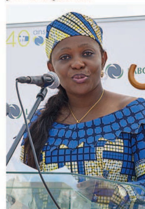
La Ministre de la Santé et de la Population, Jacqueline Lydia Mikolo

à Pointe Noire, la société approvisionne plusieurs fois par jour les pharmacies du pays en médicaments, en consommables médicaux ainsi qu'en produits parapharmaceutiques. Ainsi,