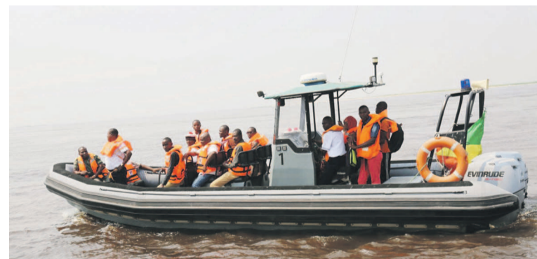
La randonnée sur le fleuve Congo

Prélude à la commémoration du 55 e anniversaire de la création des Forces Armées Congolaises (FAC) et de la gendarmerie nationale, le 22 juin, l'état-major général des FAC a organisé samedi à Brazzaville, en vue d'intéresser les élèves et étudiants des séries scientifiques au métier de marin.