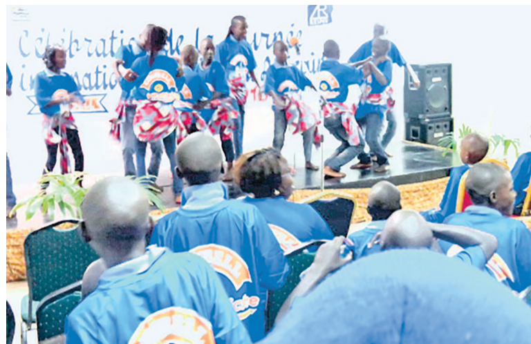
Une vue des enfants exhibant une danse traditionnelle «adiac»

La cérémonie a permis aux responsables de chaque structure d'accueil, quelque fois appuyé par les bénéficiaires de présenter les services qu'offre leur centre aux enfants en rupture familiale. Elle a été aussi un moment pathétique pour certains enfants qui ont témoigné les bienfaits du Samusocial et de leur centre d'accueil respectif qui leur ont redonné l'espoir de