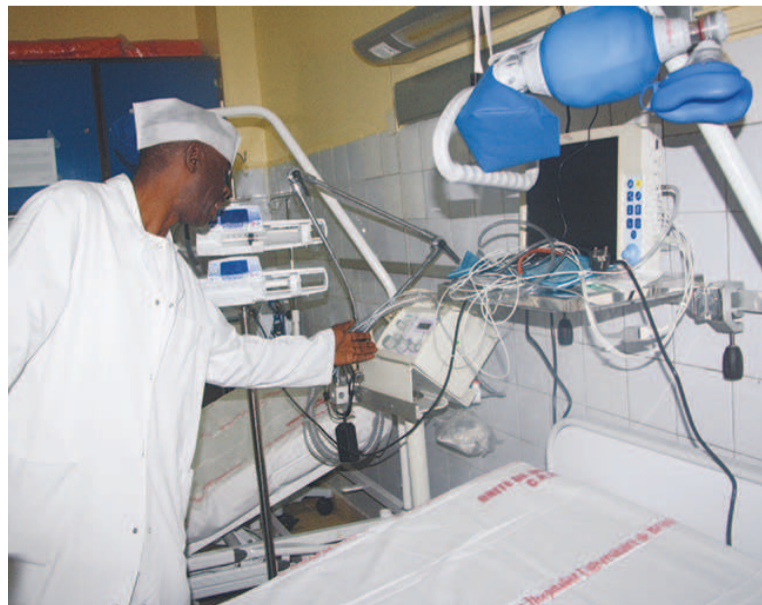
Un médecin expliquant le fonctionnement du matériel à la presse