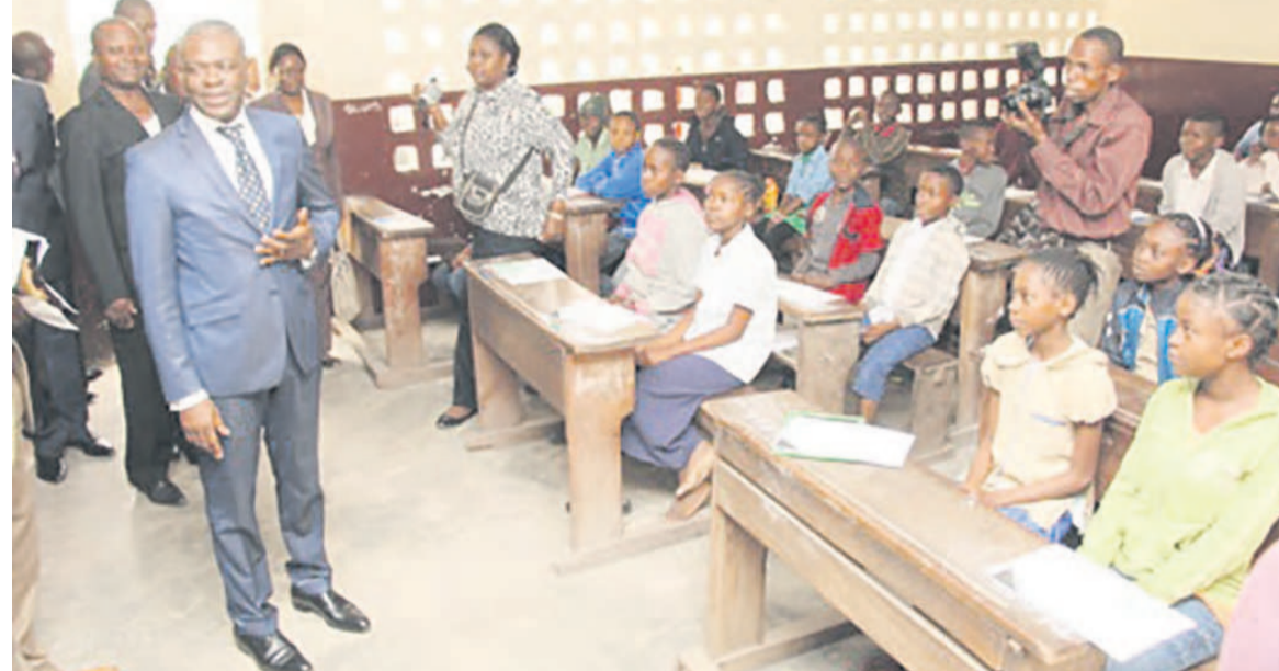
Le ministre Anatole Collinet Makosso dans une salle d'examen

L'appel nominatif des candidats s'est fait une heure avant