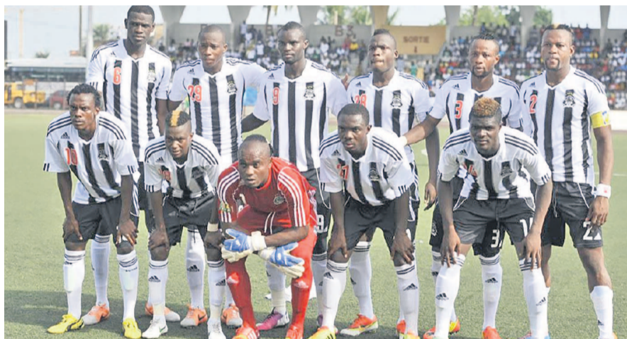
TP Mazembe de Lubumbashi

Mazembe a soumis Young Africans de Tanzanie à domicile par un but à zéro, un deuxième succès après la victoire sur Medeama SC du Ghana en première journée de la phase des poules de la Coupe de la Confédération.