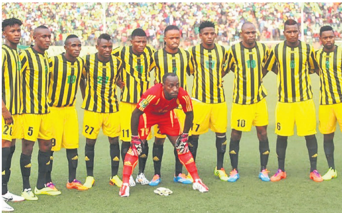
V.Club assure sa qualification en Ligue des champions avec sa deuxième place à la Division 1 (photo d'archive)

Au classement officiel, le TP Mazembe est champion du Congo de football, succédant à