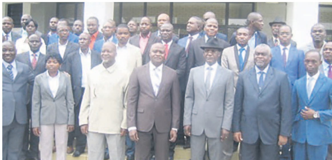
Photo de famille des participants

Le premier atelier de suivi-évaluation du Projet de renforcement des capacités en statistiques (PSTAT) s'est ouvert lundi à Brazzaville. Durant cinq jours, des experts nationaux en statistiques vont tenter d'identifier les activités urgentes, de rédiger les termes de référence de ces activités et de s'entendre sur un canevas d'exécution des opérations de recensement attendues en 2017.