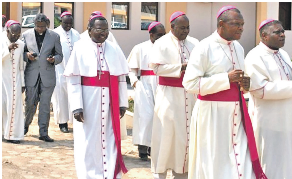
Les évêques catholiques

Réunis dans le cadre de la 53 e Assemblée plénière du 20 au 24 juin à Kinshasa, les Archevêques, Evêques et le Cardinal, membres de la Conférence épiscopale nationale du Congo (Cenco), ont passé en revue la situation sociopolitique du pays avant de proposer des pistes de solution susceptibles de remédier à l'impasse politique actuelle. Dans la déclaration ayant sanctionné leurs travaux, ils ont noté que la crise actuelle est consécutive au blocage du processus électoral. Ils ont, de ce fait, appelé les acteurs politiques à privilégier le consensus politique, si nécessaire pour que le pays ait la chance d'organiser des élections crédibles, transparentes et apaisées dans le res-