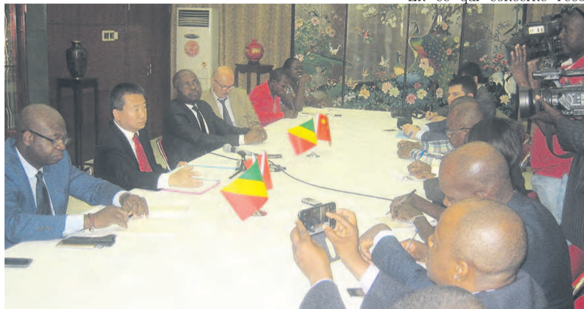
Xia Huang s'adressant à la presse

Cette visite d'Etat, d'après le chef de la diplomatie chinoise au Congo, permettra de booster davantage la coopération sino-congolaise, les grands dossiers d'intérêt commun, notamment les dossiers internationaux et africains.