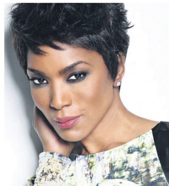
Angela Bassett, actrice

« Ne vous contentez pas de la moyenne. Recherchez toujours le meilleur. Ainsi, que cela marche ou échoue, au moins vous savez que vous avez donné tout ce que vous aviez. Nous devons vivre et donner le meilleur de nous »