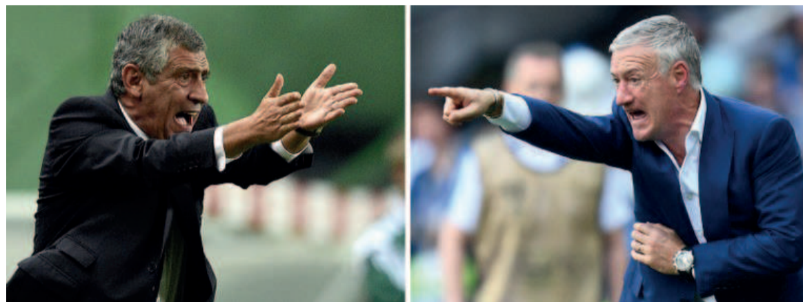
Pragmatiques, Fernando Santos et Didier Deschamps ont su tirer le meilleur de leur groupe respectif pour arriver en finale: l'opposition tactique sera l'une des clés du match

Parfois ballotés, mais globalement plus consistants en seconde période, les Bleus vont finalement vaincre la malédiction allemande, qui