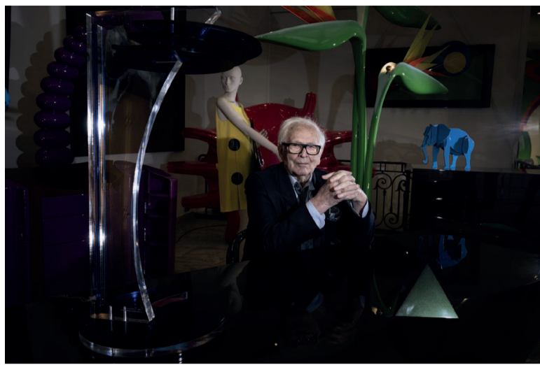
Le créateur Pierre Cardin

Visiblement, Pierre Cardin n'en a pas fini avec la mode. « Je ne m'arrête pas. Comme un peintre ou un écrivain, j'ai besoin de m'exprimer », confie le célèbre couturier également homme d'affaires et amateur d'art.