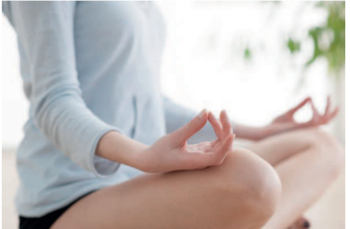
Une femme pendant l'exercice

« Réduction du stress par la pleine conscience » est un exercice mis au point par des chercheurs du Group Health Research Institute pour permettre à des milliers de personnes de réduire leurs maux de dos.