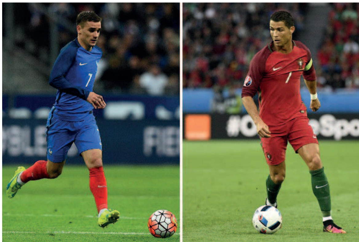
Match dans le match, le duel entre Griezmann et Ronaldo aura des airs de revanche de la dernière finale de Ligue des champions

Il y a seize ans, presque jour pour jour, la France de Zidane remportait la Coupe du monde 98 en battant le Brésil 3-0 sur la pelouse du Stade de France. Dimanche soir, dans l'enceinte de la ville de Saint-Denis, les Bleus de Griezmann et Pogba essaieront de marcher dans les traces de leurs aînés face au Portugal de Cristiano Ronaldo. Le trait d'union entre 1998 et aujourd'hui, c'est Deschamps.