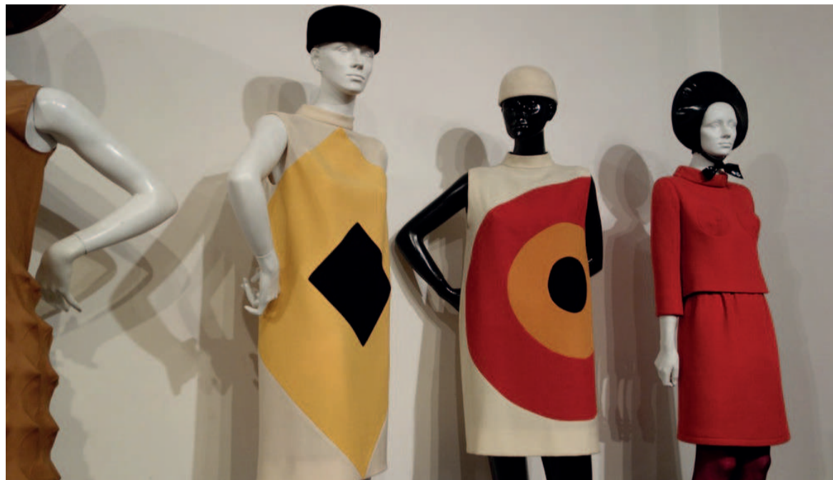
Robes des années 60 au musée Pierre Cardin.

L'homme aux yeux bleus, qui dessine sans relâche ne s'inspire