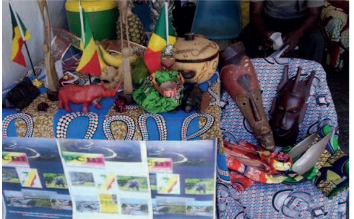
Le Stand du Congo

Ateliers de dessin et de narration accompagnés d'une dégustation du café traditionnel éthiopien et