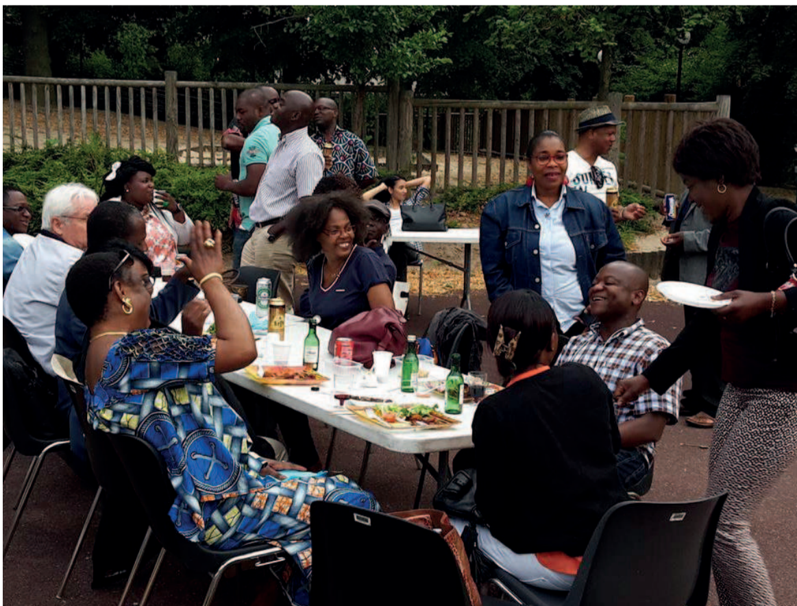
Participants à la guinguette africaine de Suresnes