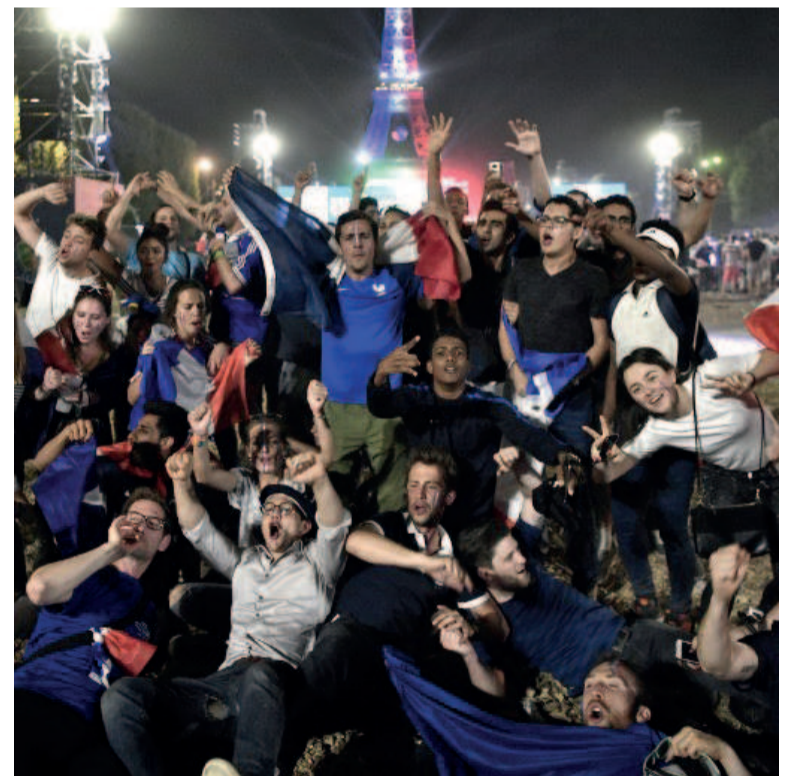
Les Français sont dans la rue après la qualification des Bleus face à l'Allemagne

«On a une équipe qui a l'air d'être soudée à l'intérieur, qui commence à faire l'unanimité auprès des médias. Du coup, le grand public se