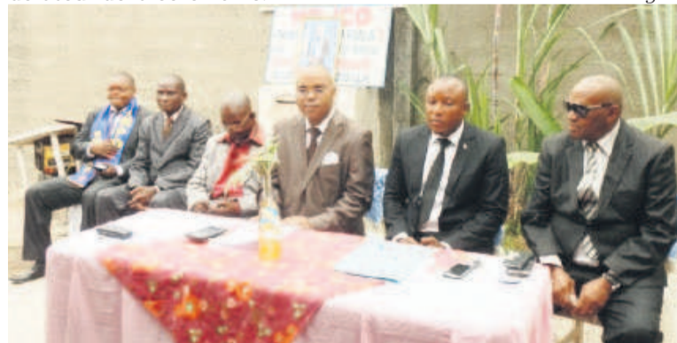
Le Directoire des FCIR

Ce qui leur amène à condamner l'attitude de certains leaders et forces politiques qui « tendent à imposer certains préalables avant la tenue du Dialogue