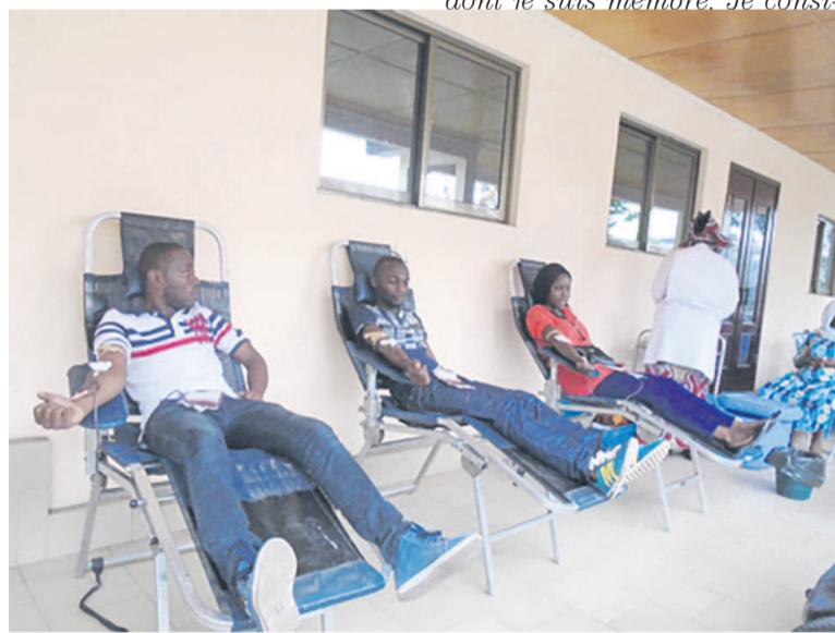
Les jeunes Leaders prélevant le sang

L'association « Les Jeunes Leaders du Congo » (JLC) a organisé, le 9 juillet, en collaboration avec le Centre national de transfusion sanguine (Cnts) et le Conseil national de la jeunesse (CNJ), une collecte de sang, à l'issue de laquelle plus de cent poches ont été recueillies.