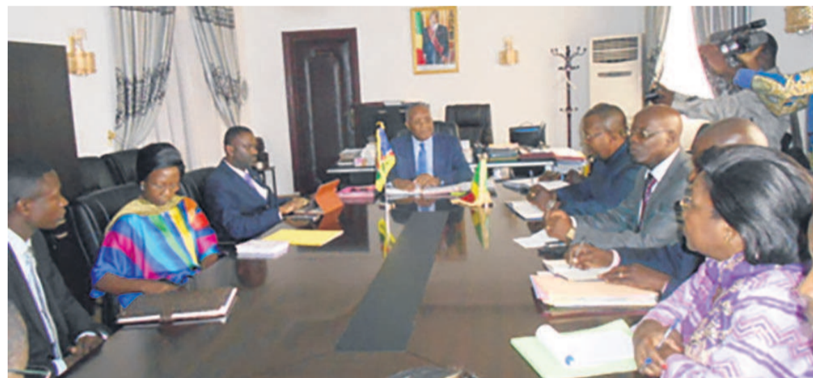
L'entretien entre l'ambassadeur Namibien et le ministre de l'ETPQE (DR)

L'ambassadeur de la Namibie au Congo, Vilio Hifindaka a indiqué, le 7 juillet, que les perspectives entre les deux pays portent sur la coopération économique en vue d'assurer les deux peuples