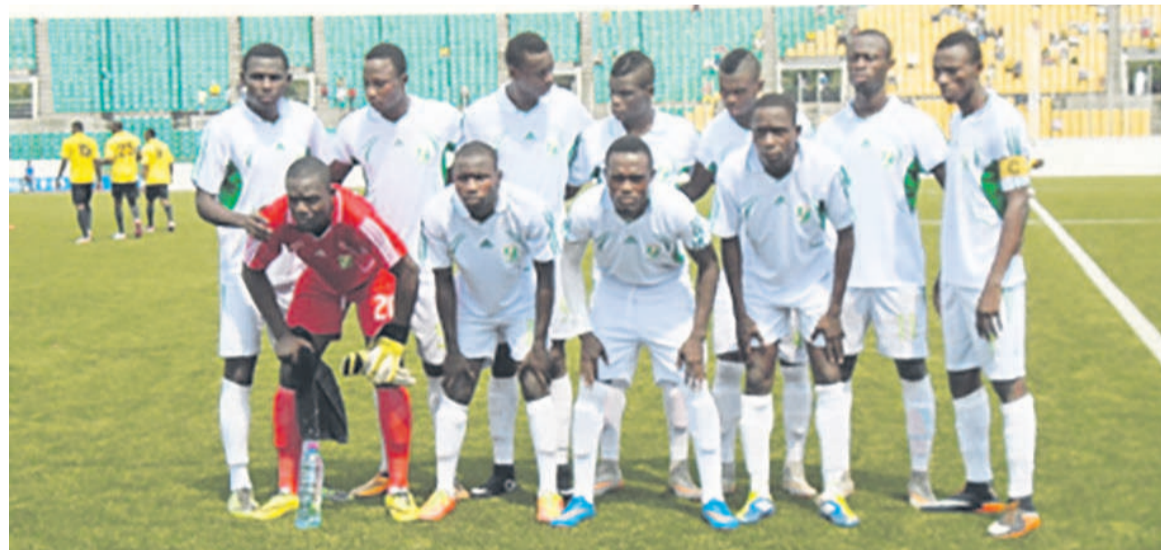
La JSP vole la vedette à l'Etoile du Congo