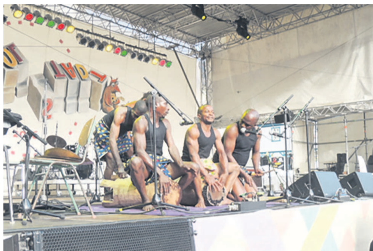
Le groupe Ndima lors de sa prestation au festival de Rudolstadt dans le centre de l'Allemagne