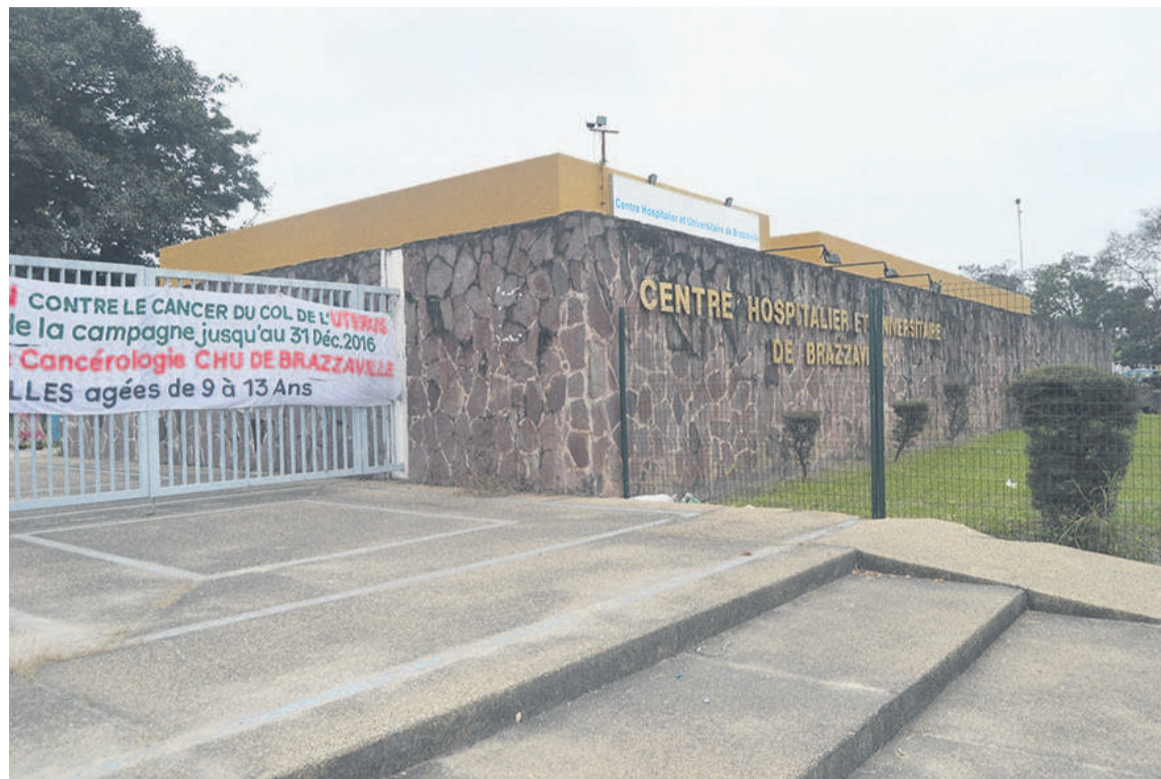
La façade principale du CHU