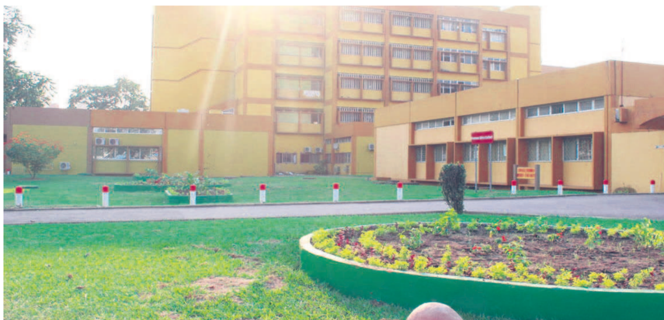
Le Centre hospitalier universitaire