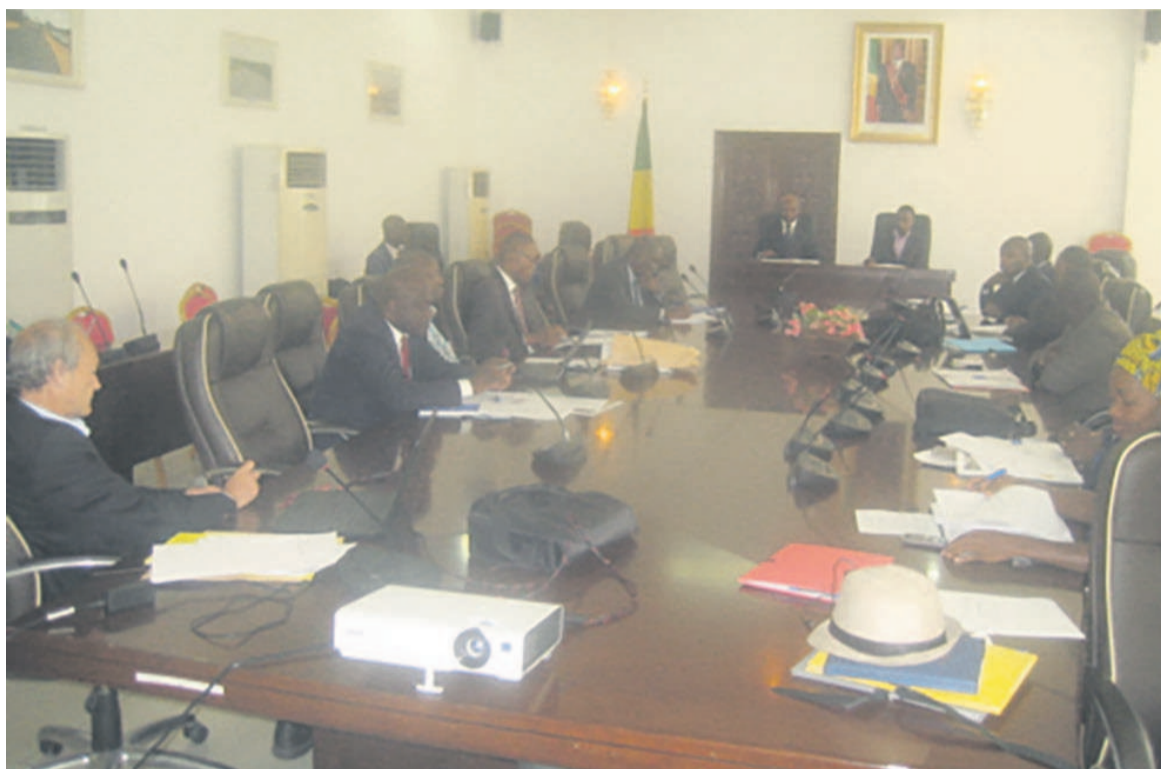
Les participants aux travaux de l'atelier inaugural

Le Comité technique de la statistique (CTS) qui vient de naître, regroupe des cadres des ministères, des experts en statistique, des représentants des organismes partenaires, le patronat congolais, ainsi que des médias publics et privés. Le but étant d'inciter les producteurs des données statistiques à fournir des informations qui correspondent à la demande des utilisateurs.