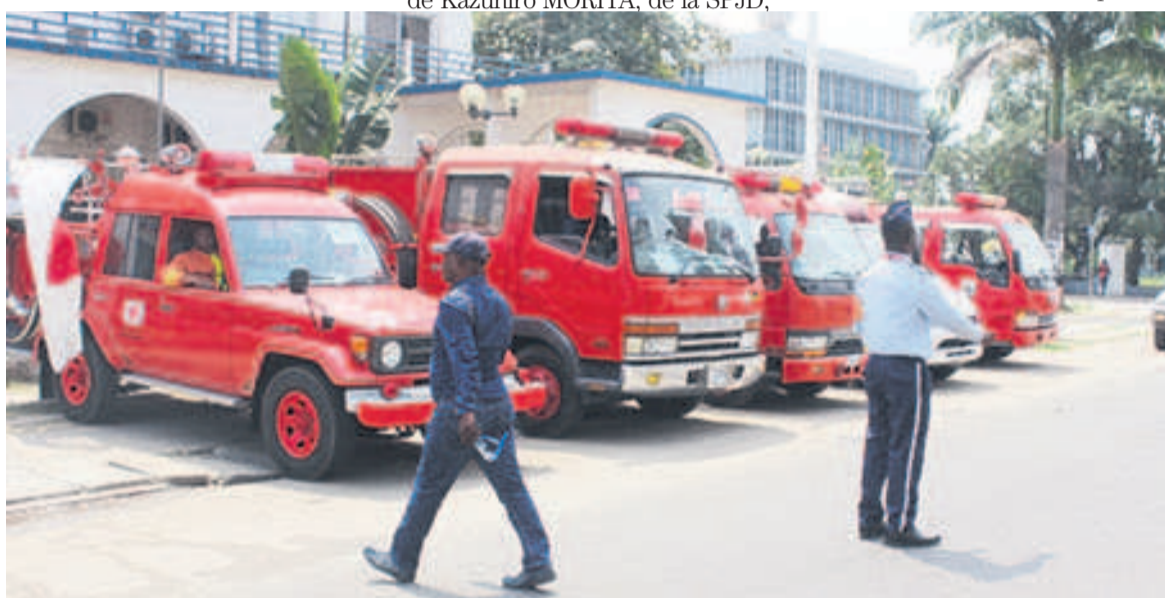
Une vue des véhicules reçus