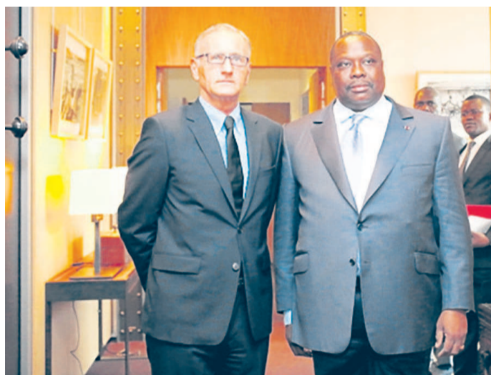
Jean-Jacques Bouya et André Vallini

En séjour de travail en France, le ministre de l'Aménagement du territoire et des Grands travaux, Jean-Jacques Bouya, s'est entretenu avec le secrétaire d'Etat français auprès du ministre des Affaires étrangères et du développement international, chargé du développement et de la francophonie, André Vallini. Les échanges ont notamment porté sur la relance de la coopération économique entre le Congo et la France. « La France a beaucoup de choses à faire avec le Congo, surtout en matière économique », a rappelé André Vallini.