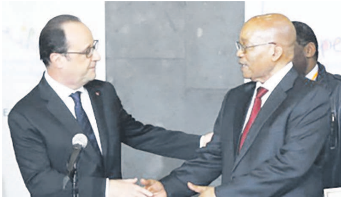
François Hollande et Jacob Zuma

A l'issue du procès, Madiba fut condamné à perpétuité. Le président français a fait état d'une ambition commune entre l'Afrique du Sud et la France, celle de « défendre partout la