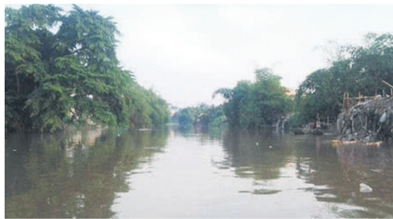
La rivière Ndjili

Dans quelle circonstance se sont-ils retrouvés dans cette rivière ? Autant d'interrogations non encore élucidées. Ce qui contribue à entretenir la hantise dans l'imaginaire des Kinois, chacun y allant de son interpré-