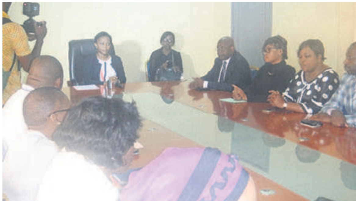
La ministre échangeant avec les responsables des structures sanitaires publiques

en adéquation avec les instructions du président de la République, Denis Sassou N'Guesso, veille à assurer l'effectivité et la poursuite de la gratuité, liée à la disponibilité des ARV dans tout le pays. Le stock disposé par le ministère va couvrir tous les départements du Congo. Le ministère travaille en ce sens inlassablement avec tous les cadres, les partenaires publics, techniques et financiers », a-t-elle signifié. Le clou de la rencontre était mar-