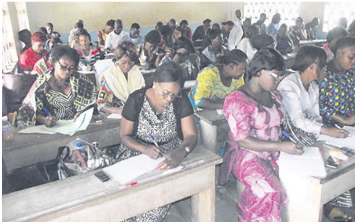
Les participants à la formation