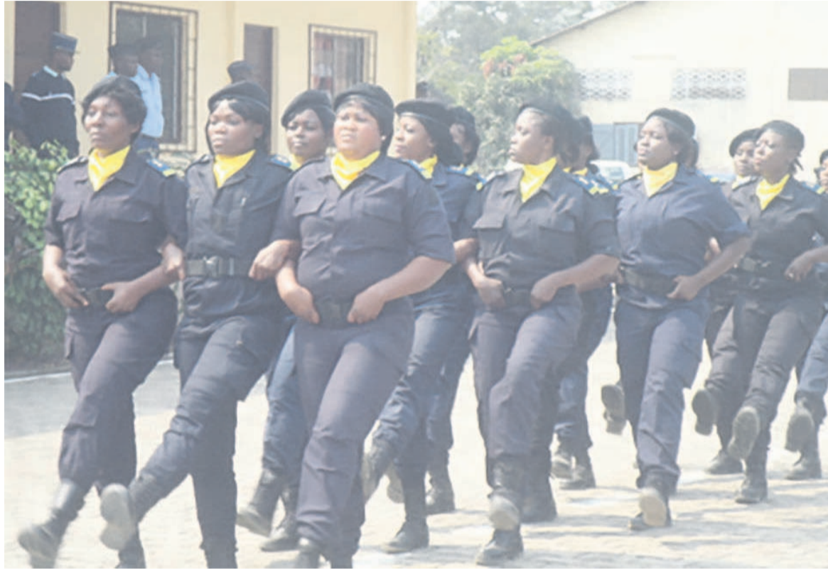
Seize des 140 éléments retenus

de la future UPC. Tout ceci avec l'emploi de ses moyens sentiel de donner à cette unité l'anticipation, la réactivité et la