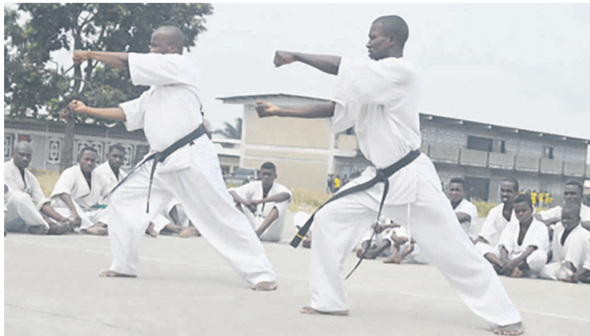
Une démonstration des Kyokushinkais pendant le stage.

En marge de ce stage, il y a eu une passation de grades, des ceintures marrons et noires (1 er et 2 e dan). Les candidats ont été évalués sur des techniques de base et des combats. Les six