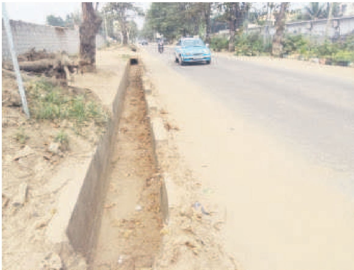
Un caniveau nouvellement curé au centre-ville

Du centre ville aux quartiers périphériques, le sourire est sur toutes les lèvres, car on entend ici et là des bruits et sifflements des engins appropriés. Certains s'occupent du curage proprement dit et d'autres du ramassage du sable, boue et immondices sortis des caniveaux au grand plaisir des citoyens. « Que les choses ne s'arrêtent pas à mi-chemin comme cela a toujours été le cas par le passé, car l'assainissement de la ville s'avère importante vu l'état dans lequel se trouvent des caniveaux ces derniers temps, car ne dit-on pas que la propreté chasse la maladie. Encore que c'est l'une des recommandations de la récente session du Conseil municipal et départemental de la ville de Pointe-Noire et nous attendons de voir que les choses aillent pour le mieux », a déclaré un habitant de Pointe-Noire vivant sur la grande artère de l'avenue de la Base qui mène vers