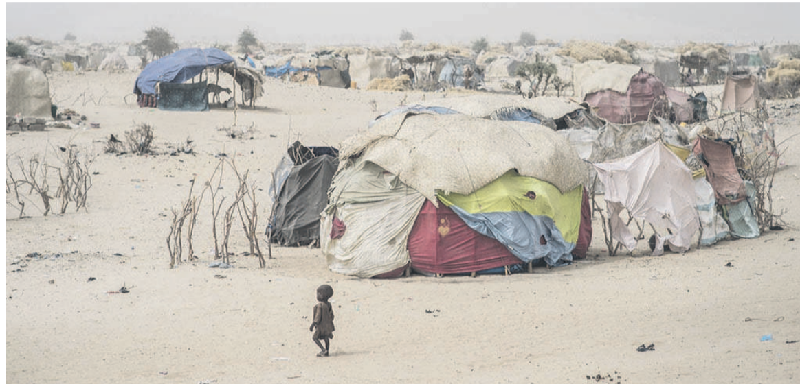
La région de Diffa au Niger est très affectée par la violence au Nigéria due au groupe armé Boko Haram.

Estimant que « le principal défi de cette Force est un financement très insuffisant », le secrétaire gé-