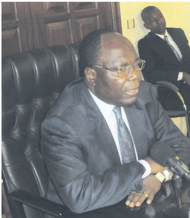
Le Premier ministre Clément Mouamba

S'agissant du premier point, les syndicalistes avaient proposé au ministre de l'Enseignement supérieur de penser à combler les vides en personnel enseignant du fait des départs en retraite des maîtres de conférences et professeurs titulaires, soit par le recrutement des nouveaux ensei-