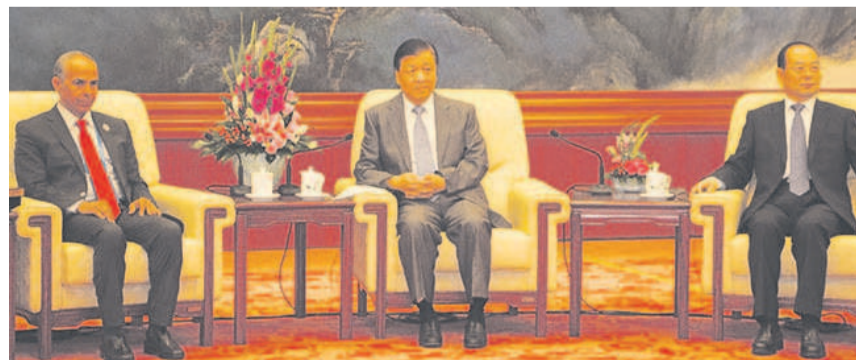
Le président Xi Jinping (au centre) a patronné la séance de la clôture du forum

Les dirigeants de la République populaire de Chine ont plaidé, le 26 juillet, en faveur du rapprochement des médias du monde, à travers la Route de la soie, une initiative du président Xi Jinping visant à favoriser la paix, l'égalité et le bien-être de l'humanité tout entière.