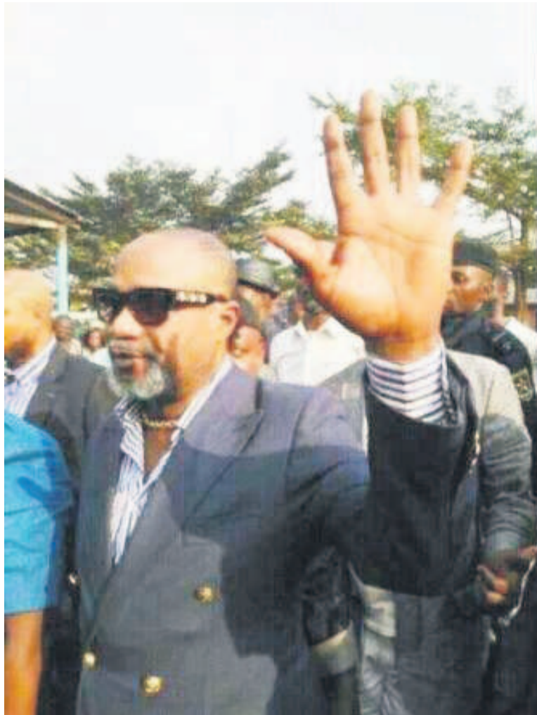
Koffi Olomide pendant son acheminement à Makala

Bien après son audition devant les juges du tribunal de paix, ces derniers pourront ensuite accorder au parquet quinze jours de détention préventive du chanteur. Celui-ci, toujours d'après le procureur, pourrait encore passer trente jours supplémentaires en détention sur demande du parquet dans l'hypothèse où l'enquête n'était pas terminée. C'est dire que l'arrêt provisoire sous lequel tombe Koffi Olomide risque de prendre plus de temps que prévu même si le procureur nuance en affirmant que « l'infraction dont le chanteur est accusé ne l'expose pas à une peine