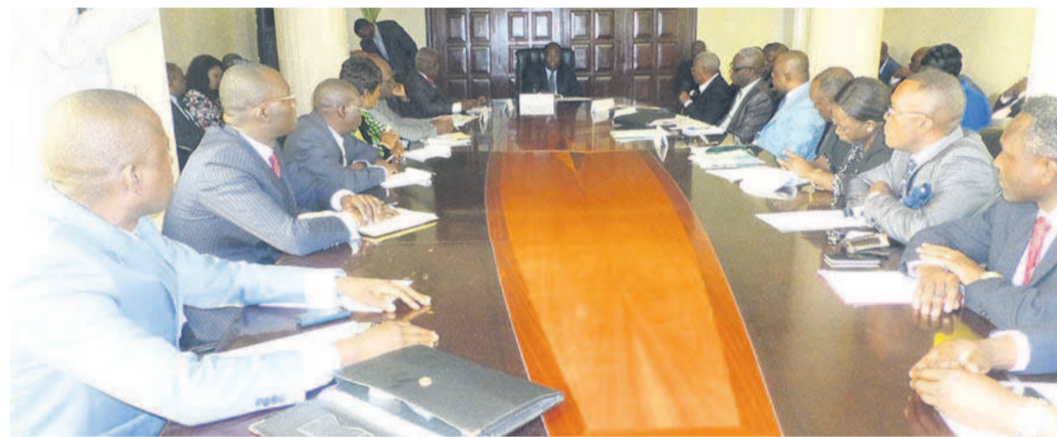
Le Premier ministre Clément Mouamba et les syndicalistes de l'université