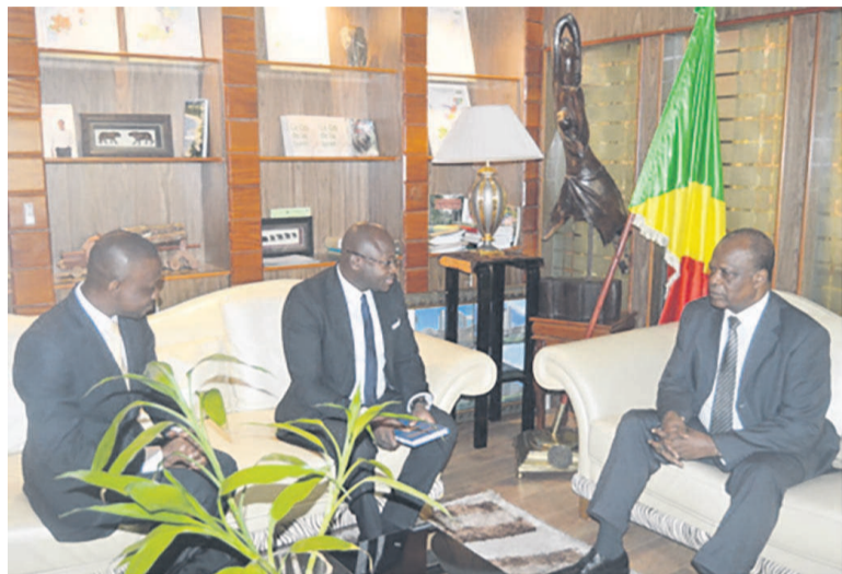
Les représentants d'ACE Global avec le ministre Henri Djombo

Une délégation du groupe ivoirien ACE Global spécialisé, entre autres, dans le financement structuré des projets agricoles, a exprimé au ministre d'Etat en charge de l'Agriculture, de la pêche et de l'élevage, Henri Djombo sa volonté de s'implanter au Congo afin d'aider le pays à redynamiser le secteur agricole.