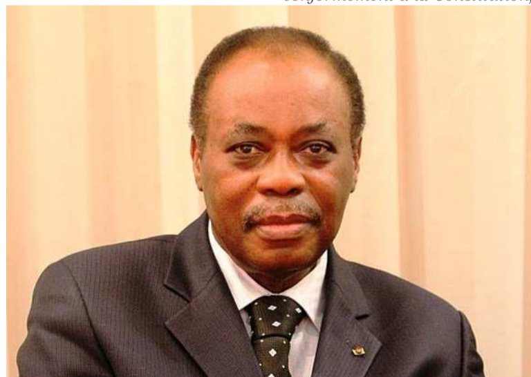
Edem Kodjo prêt à convoquer le comité préparatoire

dans son ensemble à faire preuve de dépassement et à « donner une chance à la recherche d'une solution consensuelle à la situation actuelle que connaît la RDC conformément à la Constitution,