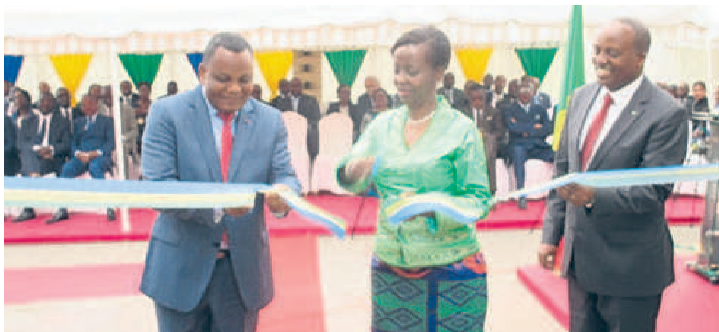
Coupure du ruban symbolique

En vue de raffermir ses liens d'amitié et de coopération avec le Congo, le Rwanda vient d'ouvrir à Brazzaville, sa représentation diplomatique couvrant également le Cameroun, la Centrafrique, le Gabon, la Guinée Equatoriale et le Tchad.