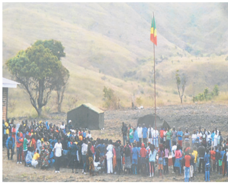
Cérémonie de levée des couleurs en présence de la ministre

« Voyez bien, nous nous sommes habitués. On s'est fait des amis. Il fait bon vivre ici. Nous ne voulons plus repartir chez nous. Pourquoi ne pas continuer à rester ici jusqu'à une date ultérieure ? On mange