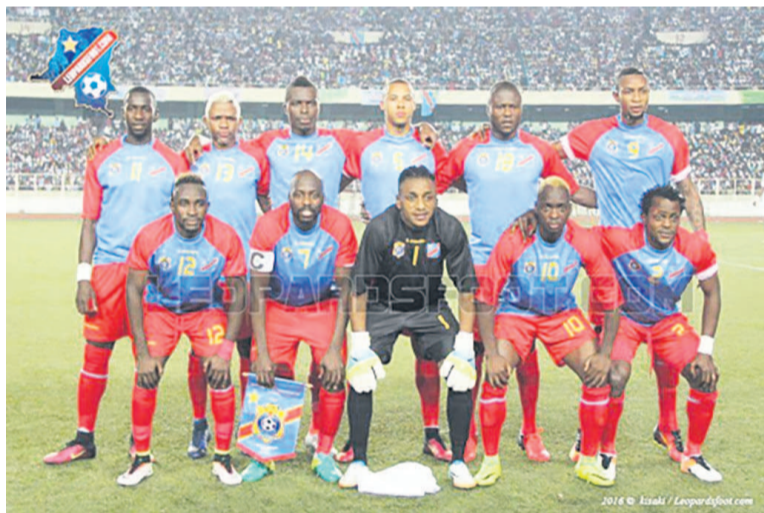
La sélection des Léopards

Et très récemment, la Fédération congolaise de football association (Fécofa) a lancé le concept « En route pour la CAN Gabon 2017 et Mondial Russie 2018 ». Et pour ce premier match des Léopards aux éliminatoires, il est question d'engranger déjà les trois premiers points dans un groupe qui va être compliqué avec la présence, outre de la Libye, de la Tunisie qui s'aff-