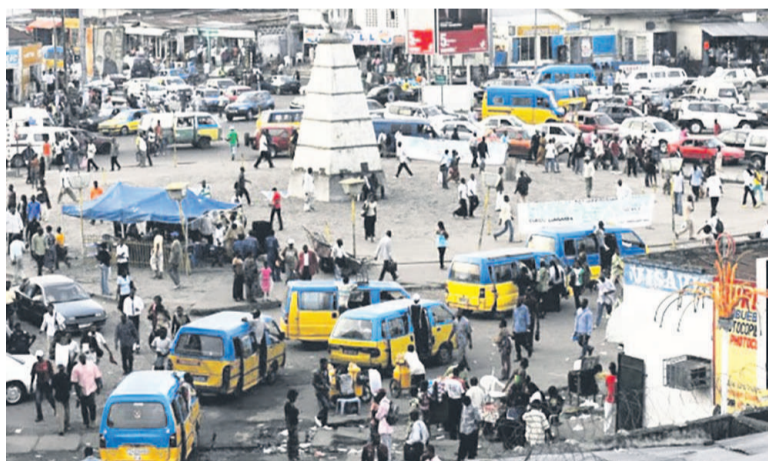
Place Victoire à Kinshasa

À ce rythme, la capitale deviendra vraisemblablement la ville la plus peuplée d'Afrique dès 2030. Par ailleurs, si l'on calcule la progression à l'échelle nationale qui s'établit à 2,8 % par an, le pays doit atteindre deux cents millions d'habitants d'ici à 2050. Face à cette pression démographique, les partenaires au développement invitent les autorités congolaises à mettre en oeuvre urgemment des politiques de grande envergure dans plusieurs secteurs stratégiques dont les transports, le logement et l'accès aux services de base. Rien que pour les routes de Kinshasa, par exemple, l'on s'attend au moins au triplement du réseau actuel.