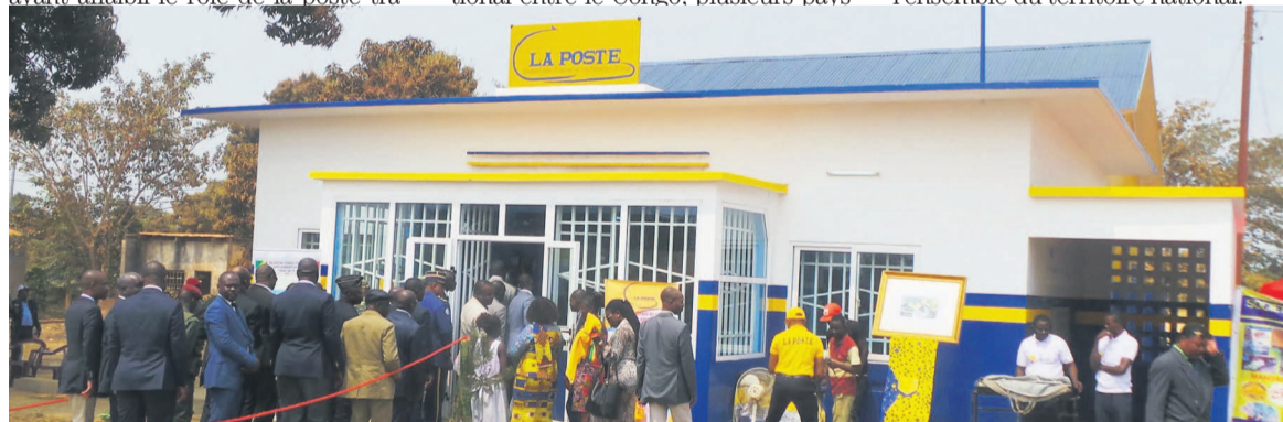
Inauguration du bureau de Poste de Madingou, dans la Bouenza

société Prodit. Il consiste à mettre en place un système d'information qui permettra de gérer tous les services et produits postaux en temps réel sur l'ensemble du territoire national.