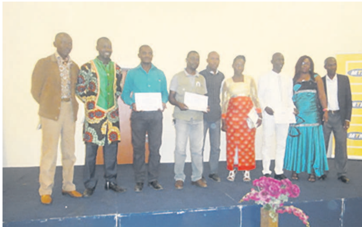
Une vue des festivaliers

Pendant trois jours divers moments ont marqué le déroulement de ce festival, notamment son ouverture, la visite des stands, le déroulement des ateliers de formations sur le thème «La photo, un patrimoine d'esprit et d'enseignement historique», des conférences débat sur la photographie, la visite des sites du patrimoine matériel et immatériel Kouilou et Pointe-Noire, la remise des prix