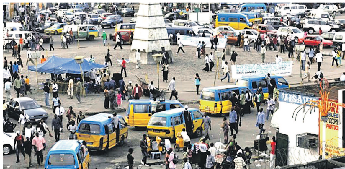
Place victoire à Kinshasa

À ce rythme, la capitale de la RDC deviendra vraisemblablement la ville la plus peuplée d'Afrique dès 2030. Par ailleurs, si l'on calcule la progression à l'échelle nationale qui s'établit à 2,8 % par an, le pays doit atteindre deux cents millions d'habitants d'ici à 2050. Face à cette