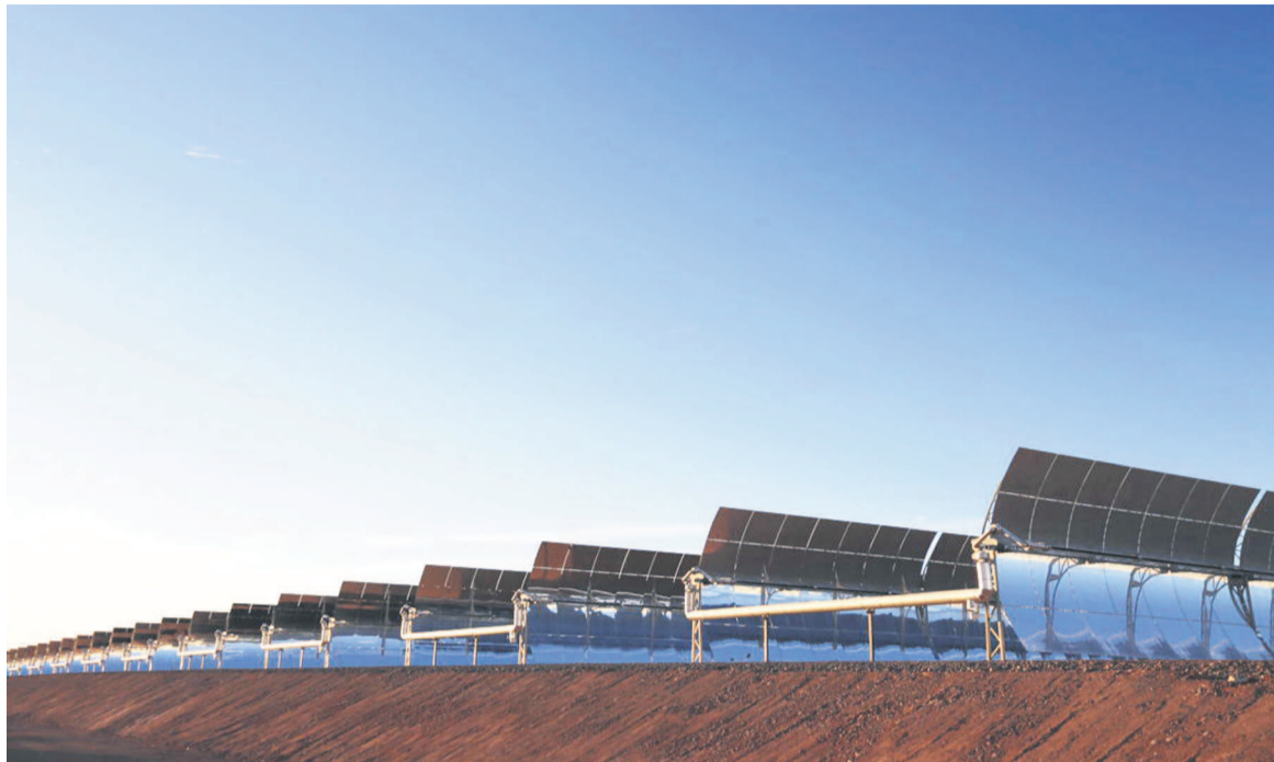
La centrale solaire de Noor, l'unique au monde capable de produire jusqu'à 160 mégawatts dans un seul bloc

Selon une fiche de présentation de ce gigantesque projet, le site de la centrale sera constitué de quatre centrales solaires mul-