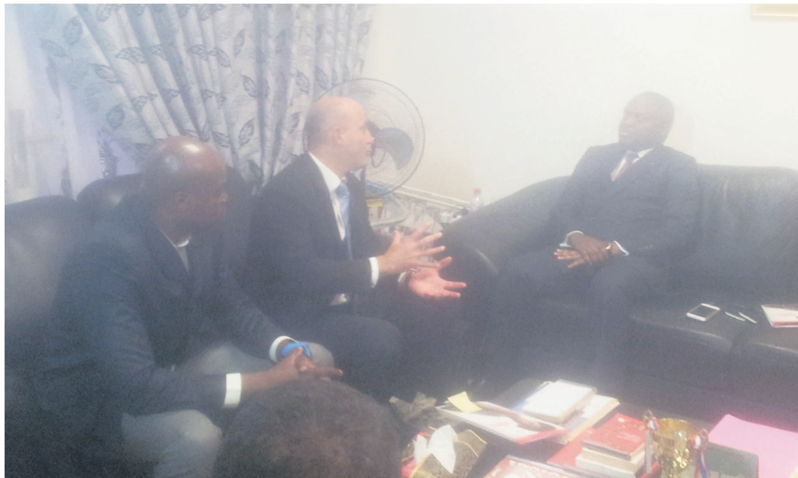
Le ministre de la Culture et des arts s'entretenant avec le DG adjoint de TNT Africa

« Je parle sous le contrôle du ministre de la Culture et des arts, on peut envisager comme nous l'avons fait avec succès à Pointe-Noire, de créer une chaîne que nous allons nommer