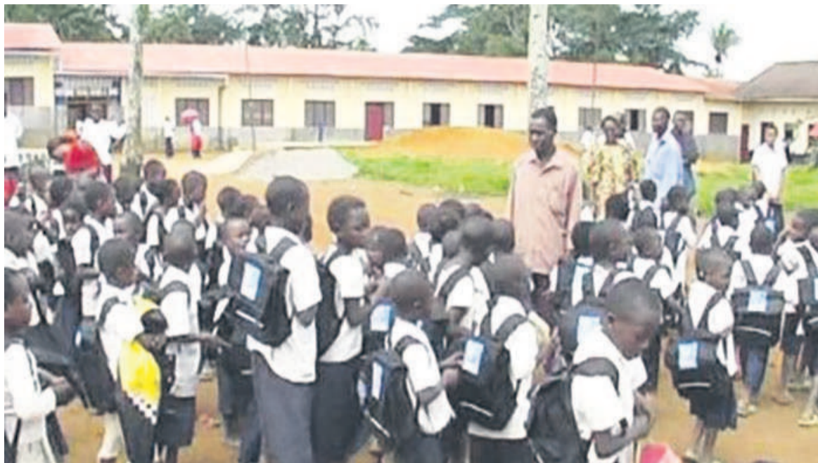
Le projet OPEQ cible les élèves du primaire des centres de recherche », a-t-il rappelé.