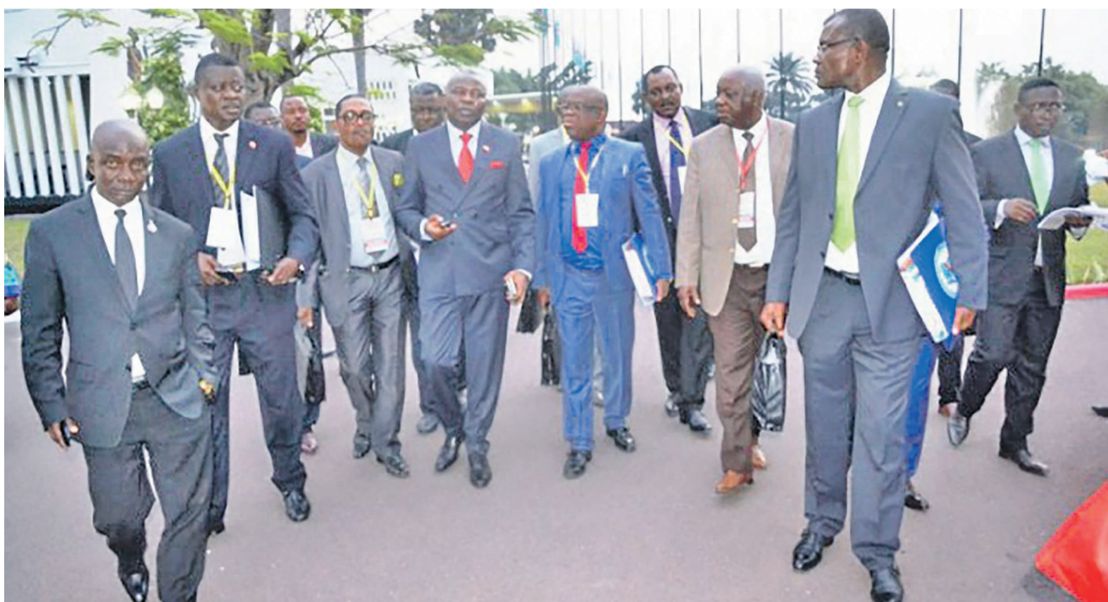
Quelques délégués de l'opposition

L'opposition présente au dialogue a suspendu lundi sa participation en guise de protestation contre la position de la majorité en rapport avec la séquence des scrutins à venir. Pour le camp présidentiel, les élections locales couplées aux provinciales devront être organisées prioritairement avant la présidentielle une fois la révision du fichier électoral terminée. Une option récusée par l'opposition qui, faisant référence à la résolution 2277 du Conseil de sécurité, privilégie plutôt la présidentielle, seul scrutin dont la date butoir est fixée dans la Constitution. Une équation donc pour le facilitateur obligé de sortir le grand jeu pour ramener les frondeurs à la table de négociation. Relativisant l'incident, les délégués de la majorité y voient plutôt une technique de négociation utilisée par l'opposition pour tenter d'imposer son tempo dans un dialogue où elle se sait déjà perdante.