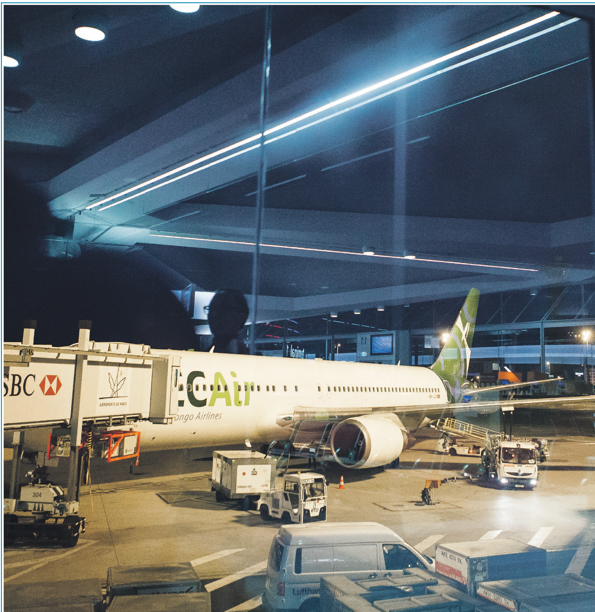
CONCEPTION GRAPHIQUE : THIRTY DIRTY FINGERS