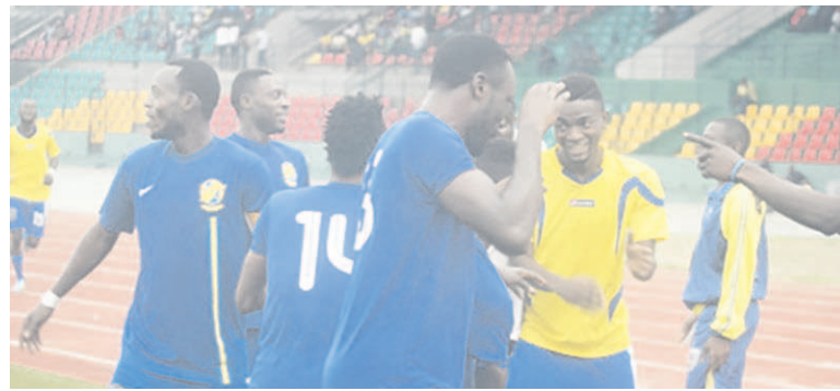
Les joueurs de la JST après leur victoire

Le 3 octobre au stade Alphonse-Massamba-Débat, la JST a profité du report du match V Club Mokanda-Diables noirs pour s'installer provisoirement à la deuxième place avec 73 points, soit une unité de plus que les Diablotins. La JST l'a emporté devant l'AS Kimbonguela sur un score étriqué d'un but à zéro, en match comptant pour la 36 e journée. Cette 36 e journée qui n'a pas souri à l'Etoile du Congo, puisque les Stelliens ont vu leur compteur bloquer à 69 points après leur défaite (0-1) face au Club athlétique renaissance aiglon. L'Etoile du Congo n'a plus son destin en main