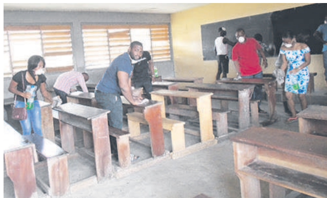
Les membres de l'association en plein assainissement (adiac)

L'opération consiste à nettoyer, balayer, les salles de classe et bien d'autres. Le matériel d'assainissement apporté est notamment les balais, seaux, raclettes, cache nez, etc. Au terme de l'opération, le matériel utilisé sera remis à l'établissement.