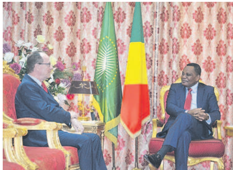
Jean-Claude Gakosso recevant les copies figurées des lettres de créance des mains de Hiroshi Karube...