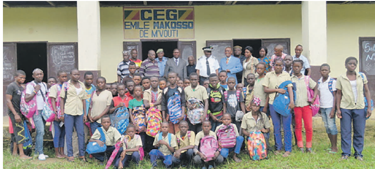
La photo de famille au collège de Mvouti