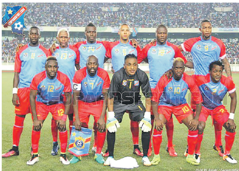
Les Léopards de la RDC

Les Léopards de la RDC se sont inclinés, le 4 octobre, au stade des Martyrs de Kinshasa face aux Harambe Stars du Kenya par un but à zéro, en match amical international. Les deux équipes préparent la première journée des éliminatoires de la Coupe du monde prévue en Russie pour 2018. La RDC affrontera, le 8 octobre, au stade des Martyrs les Chevaliers de la Méditerranée de la Libye en première journée. Le match contre le Kenya devrait donc servir à colmater les brèches.