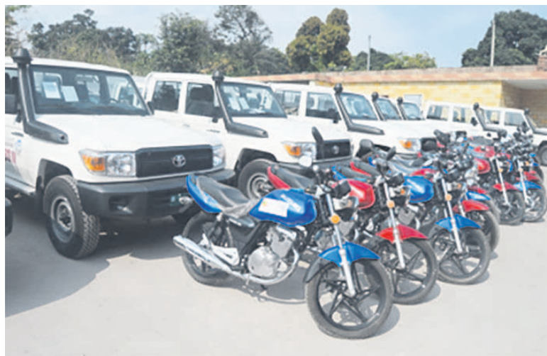
Un échantillon des moyens roulants

Le projet dénommé Programme de Développement des Services de Santé (PDSS II) a fait un don de 30 véhicules (4x4) et de 44 motos au ministère de la Santé et de la Population.