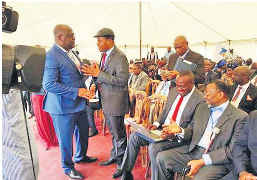
Des participants au conclave du Rassemblement

organisé à Kinshasa », a déclaré Etienne Tshisekedi à la clôture du conclave de Limete. Du vrai Dialogue que le Rassemblement voudrait voir se tenir à Kinshasa, il mettra autour d'une table les