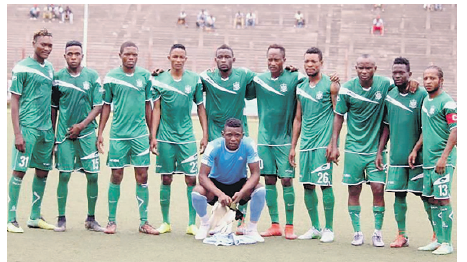
Daring Club Motema Pembe de Kinshasa

Le Daring Club Motema Pembe (DCMP) a enregistré sa deuxième victoire en phase des groupes du championnat national de football.