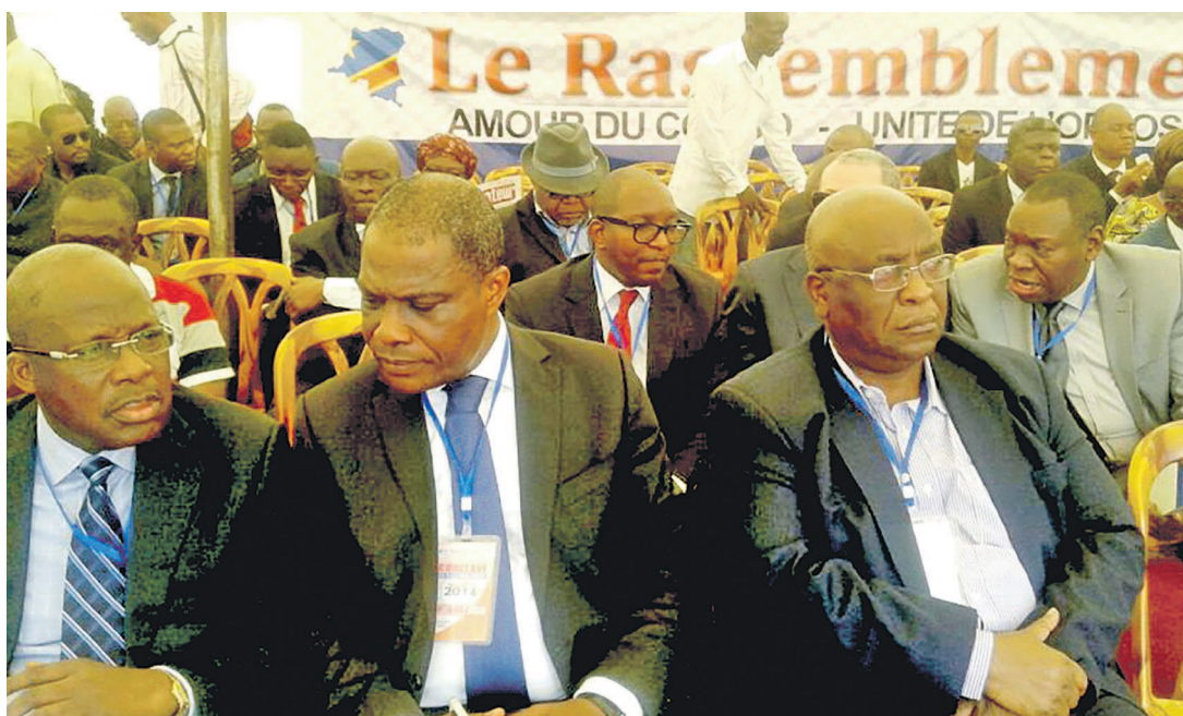
Quelques cadres du Rassemblement pendant le conclave de Limete

Il s'agit d'une sorte de transition qui aura pour mission l'organisation rapide des élections dans le respect dans la Constitution et des normes démocratiques. Cette proposition découle de la volonté de pallier le vide du pouvoir à tous les niveaux qui pourrait se déclarer d'ici le 20 décembre, explique-t-on. Cela est d'autant plus salubre étant donné, précisent les participants au conclave de Limete tenu le 4 octobre à Kinshasa, qu'à partir du 19 décembre prochain, toutes les institutions à mandat électif perdront toute légitimité. Rejetant, par ailleurs, les travaux du dialogue de la Cité de l'Union africaine sous la facilitation d'Edem Kodjo sur les cendres duquel il entend établir le vrai dialogue inclusif, le Rassemblement par la voix du mentor Étienne Tshisekedi appelle au boycott pur et simple des résolutions qui sortiront de ces assises.