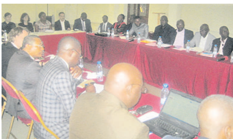
Les participants examinant le rapport d'étude

jusqu'au port autonome de Pointe-Noire permet de réduire les coûts cachés causés par les tracasseries routières au niveau du Cameroun, et d'améliorer la contribution de la filière au PIB et la transparence dans la circulation du bois de cette partie du Congo.