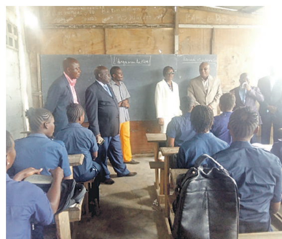
Le ministre et sa suite au lycée commercial de l'OCH