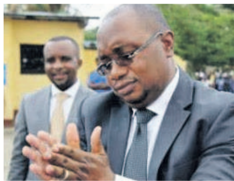
Le ministre de la Santé publique montrant comment se laver correctement les mains

Pour faire du lavage des mains une pratique quotidienne ancrée dans le vécu des Congolais, les enfants reporters de la RDC ont recommandé au ministre de la Santé publique, le Dr Félix Kabange Numbi, de garantir à chaque enfant congolais l'hygiène, l'assainissement et l'accès à l'eau potable, d'intensifier la sensibilisation des enfants sur le lavage des mains, impulser des actions qui assureront l'approvisionnement en eau potable dans les ménages, étendre le programme village et école assainis dans les zones urbaines. Les enfants reporters de la RDC espèrent recevoir de la part du ministre de la Santé publique une suite favorable à leur requête. Les élèves de l'école primaire Marie-Madeleine de Bibwa ont rappelé à l'assistance les moments-clés pour se laver correctement les mains avec du savon ou de la cendre. « Se laver correctement les mains avec du savon ou de la cendre avant de préparer, avant de manger, avant d'allaiter le bébé, après avoir été aux latrines et après avoir changé les couches de l'enfant », ont-ils dit. Sous les explications d'une élève ambassadrice de l'école primaire Marie-Madeleine, le ministre de la Santé publique a fait une démonstration du lavage des mains. Geste qu'il recommande à tout le monde de poser aux cinq moments critiques pour être à l'abri des maladies diarrhéiques et autres infections, parce que le lavage correct des mains réduit de 50%, a-t-il indiqué, les maladies diarrhéiques chez les enfants