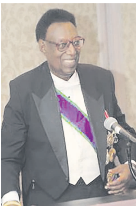
Kigeli V Ndahindurwa

Il avait succédé en 1959 à son demi-frère Mutara III, décédé mystérieusement. Conformément à la tradition en pareil cas, les Birus, un groupe secret possédant le pouvoir de nommer un nouveau roi, désignèrent alors Jean-Baptiste Ndahindurwa (son nom de baptême) pour lui succéder.