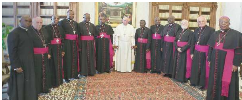
Les évêques du Congo autour du Pape François

Les évêques du Congo ont lancé dimanche un appel aux hommes politiques et au gouvernement pour un retour à la paix dans le département du Pool. Dans un message publié à l'issue de la 45 e Assemblée plénière de la Conférence épiscopale, les prélats ont également convié la classe politique à s'asseoir et dialoguer sereinement.