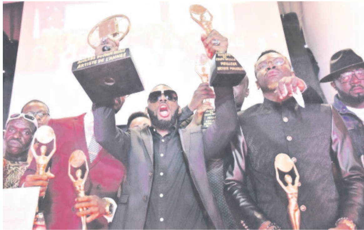
DJ Arafat, récompensé lors de la première cérémonie des «Awards du coupé-décalé», le 16 octobre 2016 à Abidjan

Au palmarès des lauréats 2016, Serge Beynaud a remporté deux trophées, celui de la meilleure chanson « Mawa Naya » et du Clip de l'année avec « Remembele ». Autre distinction remar-