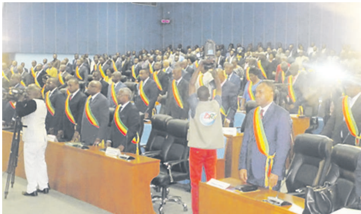
Une vue des députés

À l'ouverture de la session ordinaire dite budgétaire de l'Assemblée nationale le 15 octobre à Brazzaville, de nombreux députés qui se sont absentés, pendant près de six mois pour les uns et plus pour les autres, ont renoué avec le chemin de l'hémicycle.