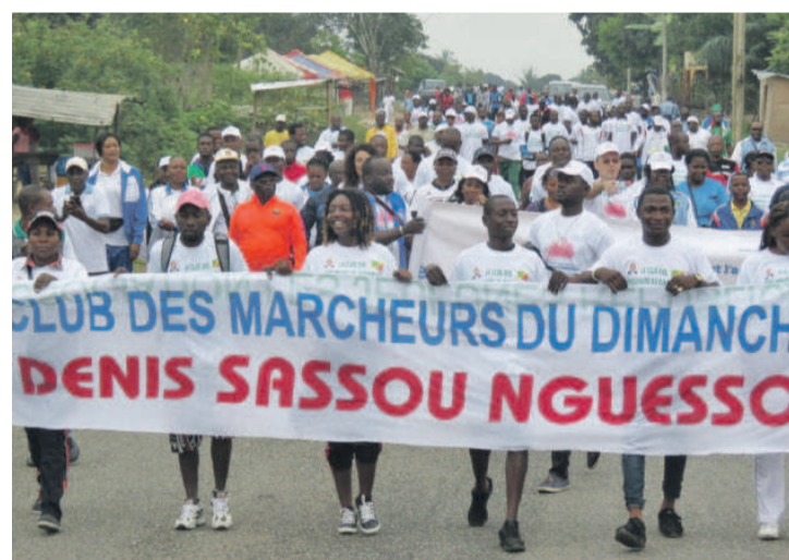
Club des marcheurs

Au Nzango, la sélection de Nzassi a remporté le tournoi, après deux victoires, face à la sélection de Pointe-Noire, 45-40, et devant Tchiamba 35 à 29. Les Ponténégrines se sont contentées, quant à elles, à la deuxième place grâce à leur victoire face Tchiamba, 36 à 23. Par ailleurs, un match de football des vétérans a mis aux prises l'équipe de la sous-préfecture de Tchiamba-Nzassi, hôte du comice face à celle de la préfecture de Pointe-Noire. La rencontre a été soldée par la victoire de Tchiamba-Nzassi qui s'est imposée sur le score de 2 tirs aux buts à 1 après un score vierge à l'issue du temps réglementaire. Ces activités se sont déroulées dans une ambiance festive sous la coordination du préfet de Pointe-Noire, Alexandre Honoré Paka, assisté des autorités locales de la sous-préfecture de Tchiamba-Nzassi ainsi que les représentants des organisations des systèmes des Nations unies, la FAO, le Fida et le PAM. En plus, une marche citoyenne a été organisée. Les clubs des marcheurs, les représentants de l'organisation des systèmes des Na-