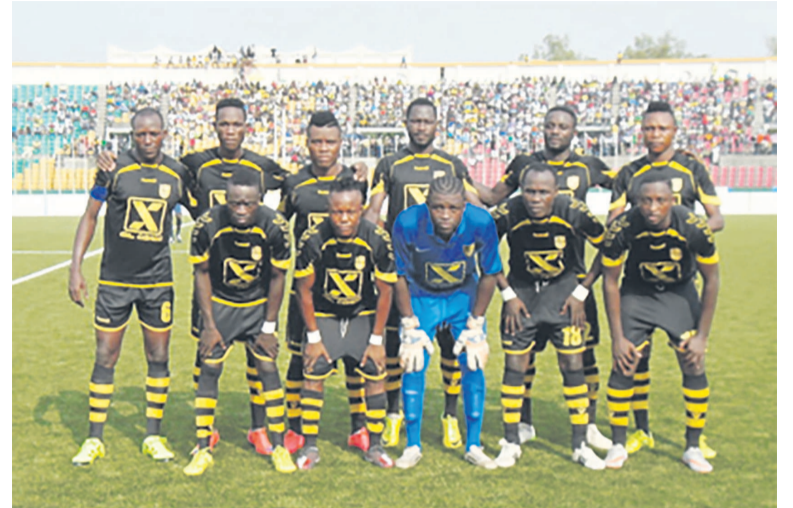
L'Etoile du Congo et les Diables noirs, les deux derniers qualifiés

points avec la JST (73). Mais le goal a-verage leur permet de repasser devant la JST. Face à l'Interclub, l'Etoile du Congo n'a pas malheureusement brillé. Elle s'incline 2-3. La JST qui jouait dans les heures qui suivaient, n'a non plus gagné. Elle a été battue par Patronage Sainte-Anne 0-1. La défaite des deux confirme l'équipe des Diables noirs (74 points) à la deuxième place avant même qu'elle dispute ses deux derniers matches. Les Diables noirs joueront donc la Ligue des champions pendant que l'Etoile