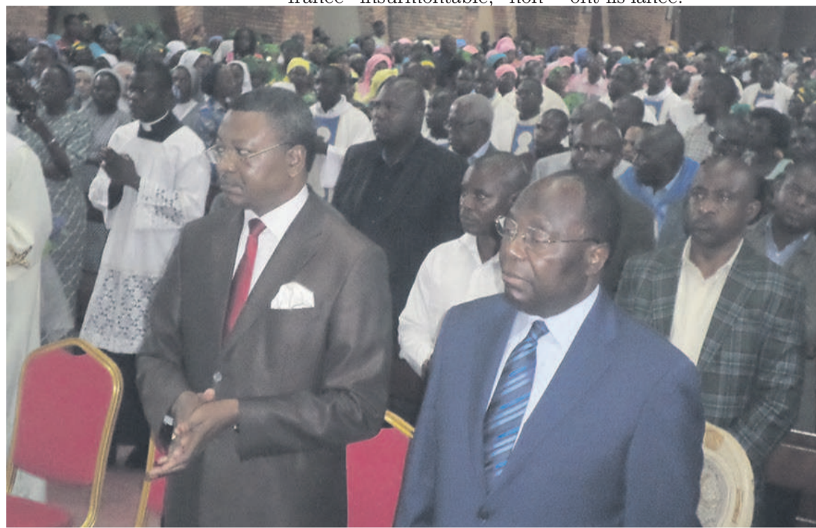
Le Premier ministre, Clément Mouamba, au début de la messe

Placés sur le thème : « La paix est un don de Dieu unique. Croyants (chrétiens et musulmans), consolidons ce don au Congo-Brazzaville et dans nos communautés à travers le dialogue », les travaux de la 45 e assemblée plénière de la CEC se sont clôturés le dimanche à la Basilique Sainte-Anne du Congo. En effet, les évêques du Congo sont revenus au cours de ces assises sur la paix qui est menacée dans le pays. « Nous, évêques du Congo, vous rappelons que le dialogue véritable constitue la pierre angulaire de toute vraie démocratie. Nous demandons vivement à nos responsables politiques d'œuvrer dans ce sens, en vue du retour définitif de la paix au Congo en général et dans le Pool en particulier. Que l'Etat prenne ses responsabilités de garant de la paix et de l'unité nationale », ont-ils mentionné.