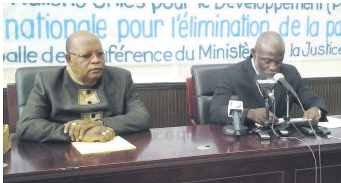
Le directeur général du Plan et le représentant du Pnud à l'occasion de la journée internationale pour l'élimination de la pauvreté